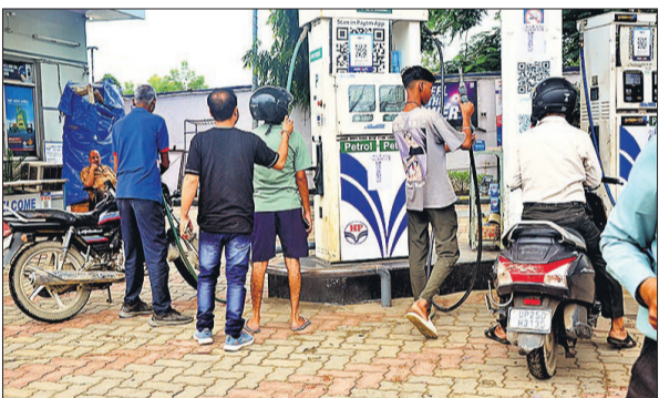
सिविल लाइंस में दूसरे का हेलमेट लगाकर पेट्रोल डलवाते वाहन चालक।

हेलमेट पेट्रोल नहीं देने के नियम के बाद से लोग नए-नए जुगाड़ अपनाते दिखे। कुछ लोग दूसरों से हेलमेट उधार मांगकर या आसपास खड़े लोगों का हेलमेट पहनकर पेट्रोल भरवाया। सुबह से लेकर देर शाम तक बिना हेलमेट के दोपहिया वाहन चालकों को पेट्रोल दिया जाता रहा। सिविल लाइंस के बटलर प्लाजा के पास स्थित पेट्रोल पंप पर हेलमेट नहीं पहन कर आए एक दोपहिया वाहन चालक ने पेट्रोल नहीं देने पर कर्मचारियों से विवाद भी किया। जबकि यहां बैरिकेडिंग और जगह-जगह नोटिस चस्पा थे कि