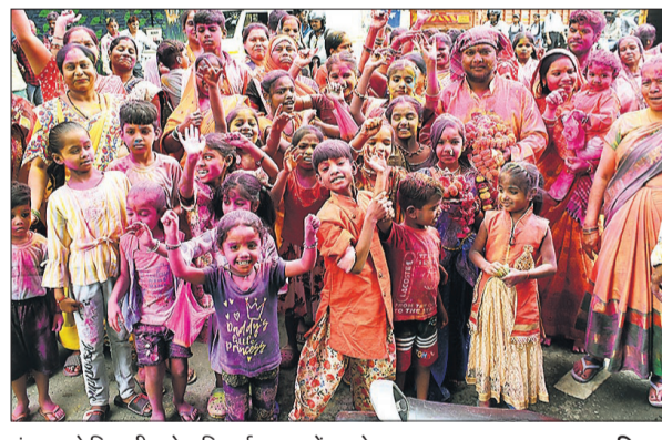
गंगापुर से निकली गणेश विसर्जन यात्रा में झूमते श्रद्धालु।

मूर्ति विसर्जन के साथ विदा किए गणपति: श्री शिव गणेश सेवा समिति की ओर से पीपलेश्वर नाथ शिव मंदिर संजय नगर में मंगलवार को गणेश महोत्सव के तहत पूजन व