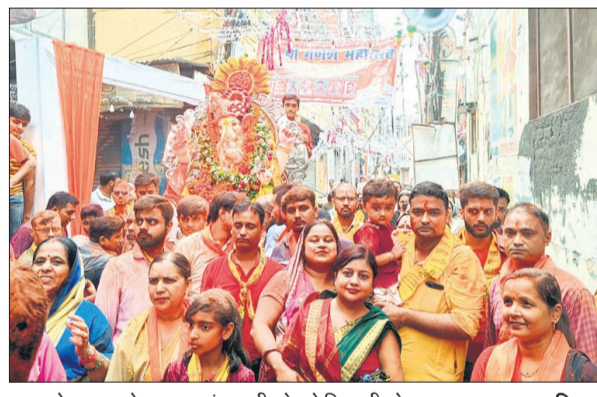
कटरा के राजा गणेश उत्सव मंडल की ओर से निकाली शोभायात्रा।