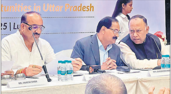
families in Uttar Pradesh