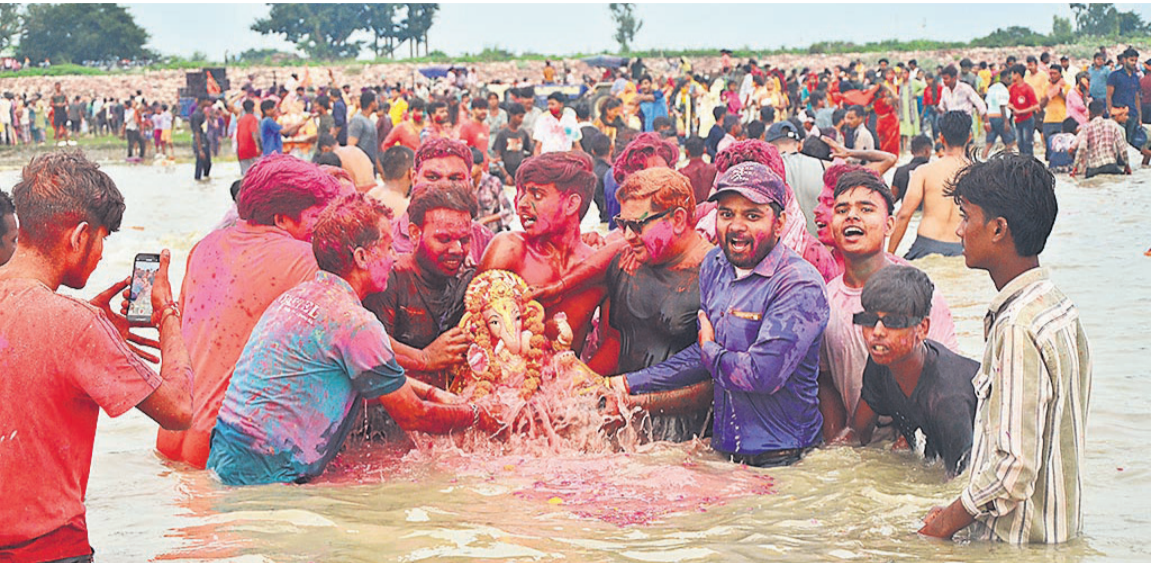
शहर में मंगलवार को अलग-अलग समितियों की ओर से शोभायात्राएं निकाली गईं और मटकी फोड़ कार्यक्रम किए गए। इसके बाद सभी ने रामगंगा के घाट पर गणपति का विधि विधान से पूजन कर विसर्जन किया और अगले बरस जल्दी आने की कामना की।