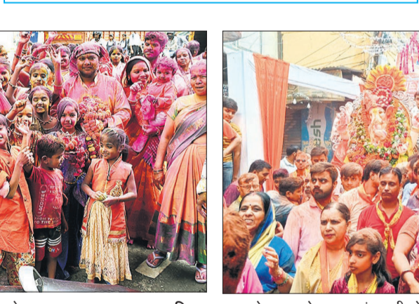
गंगापुर से निकली गणेश विसर्जन यात्रा में झूमते श्रद्धालु।

चौमुखी महादेव मंदिर से निकाली यात्रा बरेली, अमृत विचार : चौमुखी महादेव मंदिर बजरिया पुरनमल से मंगलवार को गणेश जी की विसर्जन यात्रा धूमधाम से निकाली गई। दोपहर में गणेश प्रतिमा का विसर्जन भी बैंडबाजों के साथ किया गया। फाल्गुनी उत्सव की यादे ताजा करते हुए अबीर गुलाब उड़ाया। जगह-जगह फूलों से स्वागत किया। चौमुखी महादेव मंदिर से शोभायात्रा निकाली गई।