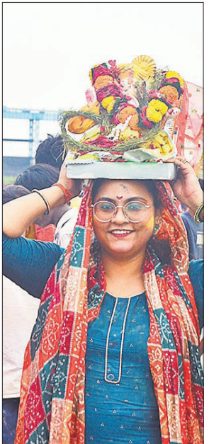
बप्पा को खुशी-खुशी किया विसर्जित।