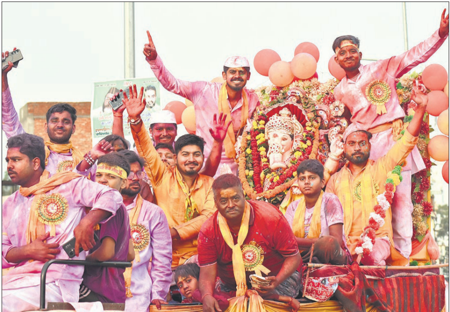
जोगीनवादा से रामगंगा में गणपति प्रतिमा का विजर्सन करने जाते श्रद्धालु।