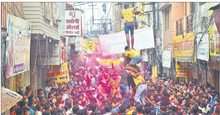
श्री गणेश महोत्सव समिति मराठा एसोसिएशन की ओर से निकली शोभायात्रा में मटकी फोड़ते श्रद्धालु।