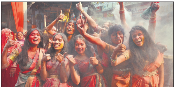
श्री गणेश महोत्सव समिति की गणेश विसर्जन यात्रा में झूमती महिला श्रद्धालु।