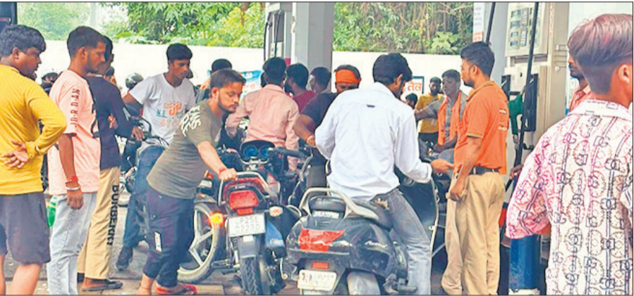
शाहजहांपुर रोड पर बिना हेलमेट पेट्रोल भरवाते बाइक सवार।

अमृत विचार की टीम ने मंगलवार को पीलीभीत रोड, शाहजहांपुर रोड और सिविल लाइंस के प्रमुख पेट्रोल पंपों पर जाकर लाइव पड़ताल की तो नतीजा चौंकाने वाला रहा। बिना