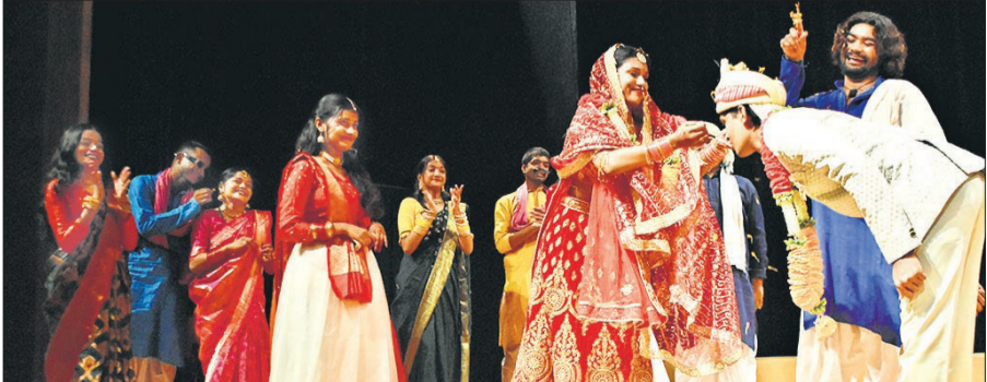
अर्बन हाट स्थित प्रभावे ऑडिटोरियम में किस्सा मौजपुर का नाटक का मंचन करते कलाकार।

दुनिया से और दुनिया को उत्तर प्रदेश से जोड़ेगा। यह ऐतिहासिक विकास खाद्य, कृषि-तकनीक, डेयरी और स्थिरता के क्षेत्र में प्रभाव बढ़ाने और उत्तर प्रदेश को कृषि समृद्धि का केंद्र बनाने के लिए बीएल एग्रो समूह की प्रतिबद्धता को दर्शाता है।