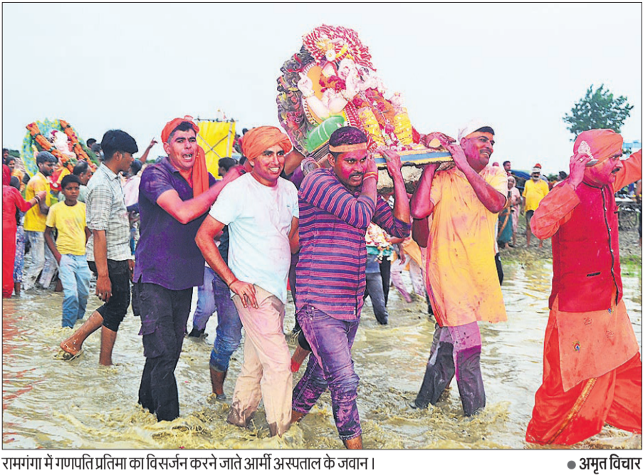
रामगंगा में गणपति प्रतिमा का विसर्जन करने जाते आर्मी अस्पताल के जवान।