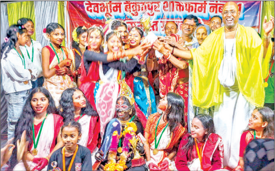
शक्तिफार्म में सांस्कृतिक कार्यक्रम पेश करने पर पुरस्कार प्राप्त करते विजेता बच्चे।