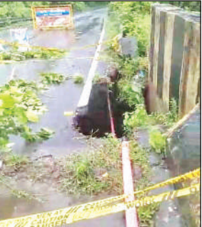
सूखी नदी पर पुल में हुआ गड्ढा।