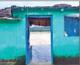
चुकुम में घरों में कटान करता कोसी का पानी।