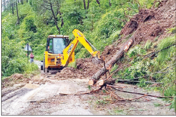
अल्मोड़ा में बंद ग्रामीण सड़कों से मलबा हटाती जेसीबी।