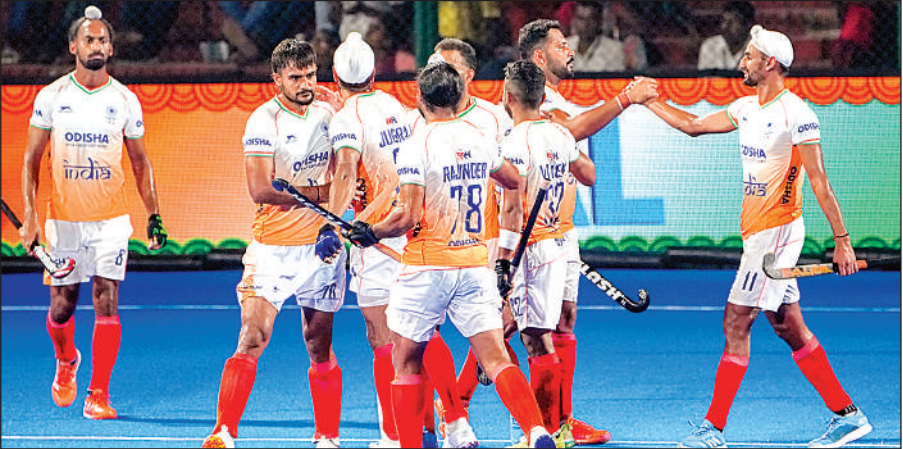
पूल चरण में शानदार प्रदर्शन कर अपराजेय रही भारतीय टीम।

भारतीय टीम ने सोमवार को हर क्षेत्र में बेहतर खेल दिखाया चाहे गोलकीपिंग हो, डिफेंस, मिडफील्ड या आक्रमण। फॉरवर्ड पंक्ति का