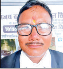
उपाध्यक्ष मंगल सिंह राणा।