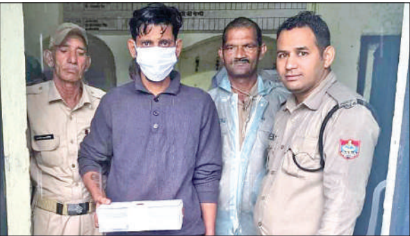
तमंचे के साथ पकड़ा गया आरोपी।