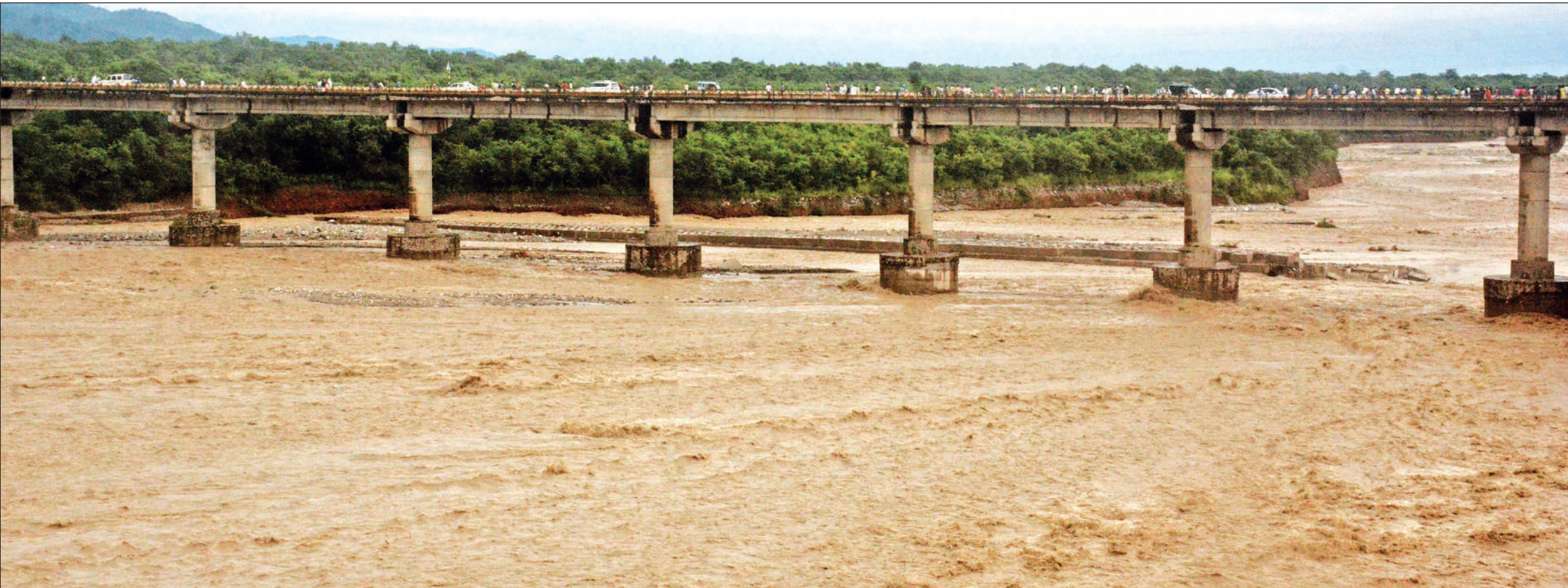
पहाड़ों में तीन दिन से लगातार हो रही बारिश के बाद उफान पर आई गौला नदी के रौद्र रूप से नदी के किनारे भूकटाव की स्थिति बनी हुई है । खतरे के निशान से ऊपर बह रही गौला नदी के इस उफान को देखने के लिए मंगलवार को गौला पुल पर दिनभर लोगों का जमावड़ा लगा रहा । ● अमृत विचार