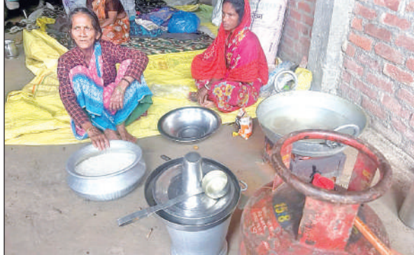
अरविंद नगर नंबर 7 से सुरक्षित स्थानों पर पहुंचे प्रभावित परिवार के लोग ।