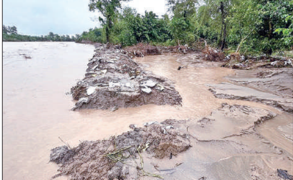
बैगुल नदी के तेज बहाव से क्षतिग्रस्त हुआ तटबंध । ● अमृत विचार

गत 14 अगस्त को बाढ़ ने बैगुल नदी के तटबंध को ध्वस्त करते हुए अरविंदनगर ग्रामसभा के सात, आठ एवं नौ नंबर गांव में भारी तबाही मचाई थी। एसडीआरएफ के जवानों ने सैकड़ों लोगों को सुरक्षित स्थानों तक पहुंचाया था। गत दो दिनों से लगातार हो रही बारिश से बैगुल नदी का जलस्तर फिर बढ़ गया है। पानी का तेज बहाव ध्वस्त तटबंध से होकर इन गांवों में आने से बाढ़ की स्थिति उत्पन्न हो गई है। घरों