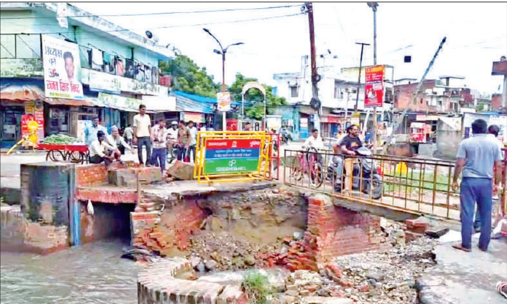
रुद्रपुर के तीन पानी डाम पर तोड़ी गई पुलिया । ● अमृत विचार