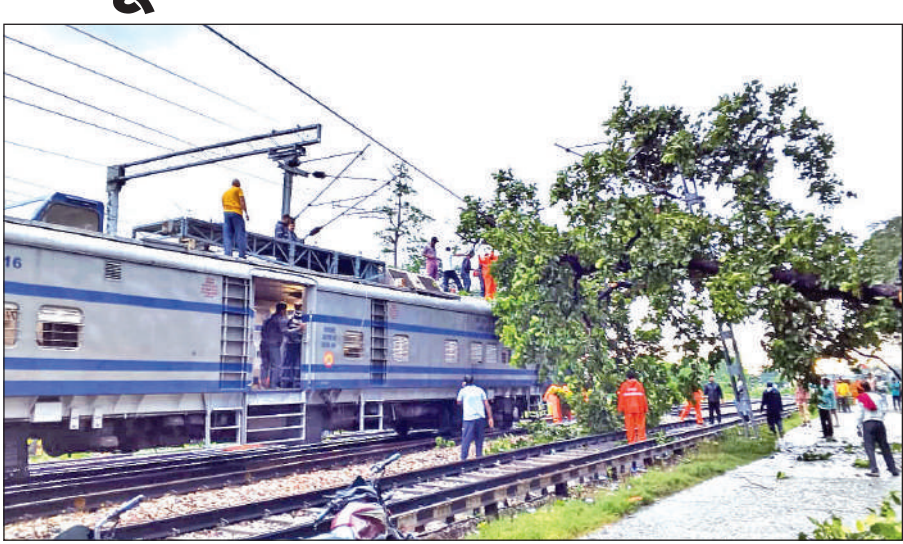
खटीमा में रेलवे ट्रैक पर गिरे पेड़ की कटाई करती रेलवे निरीक्षण यान की टीम । ● अमृत विचार

नगर की नालियां चोक होने और खकरा और ऐंठा नाले के उफान पर आने से नगर भी जलभराव की चपेट में आ गया है। मेलाघाट रोड, सितारगंज रोड, कंजाबाग रोड, टनकपुर रोड अमांड, डिग्री कालेज रोड के मुख्य मार्गों पर जलभराव की स्थिति से लोगों का गुजरना मुश्किल हो गया है। वर्षा से डिग्री