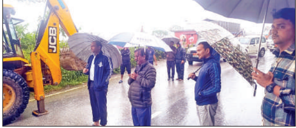
टनकपुर-पिथौरागढ़ एनएच का निरीक्षण करते डीएम व एडीएम।