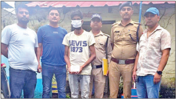
एसओजी और पुलिस की गिरफ्त में स्मैक के साथ पकड़ा आरोपी।