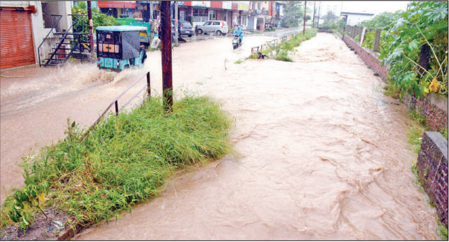
बिड़ला स्कूल से छड़ाया जाने वाली सड़क के बगल में रकसिया नाले के उफान पर, सड़क और नहर का अंदाजा लगाना मुश्किल, हो रहा थोखा।

रकसिया नाले का पानी दमुवाढूंगा शिव मंदिर के पास सड़क पर बहने लगा, जिससे मार्ग को बंद कर बैरिकेडिंग लगाई गई और लोगों से नाला पार न करने की अपील की गई। दूसरी ओर, देवखड़ी नाले के ओवरफ्लो होने से काठगोदाम रोड पर स्थित केंद्रीय जीएसटी कार्यालय के पास जलभराव हो गया, जिससे यातायात पूरी तरह बाधित हो गया। बाद में प्रशासन ने जेसीबी से पानी की निकासी सुचारू की गई। बारिश के साथ नालों में कूड़ा-कचरा और मलबा आने से जलनिकासी व्यवस्था प्रभावित हो गई। रकसिया नाले में पेड़ फंसने