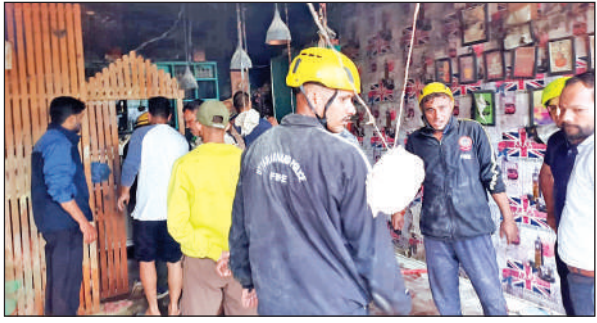
अल्मोड़ा में एक रेस्टोरेंट में धधकी आग पर काबू करती फायर सर्विस टीम।

जानकारों के अनुसार मालरोड स्थित आर्य समाज मंदिर के पास मंगलवार दोपहर में सिलेंडर में आग