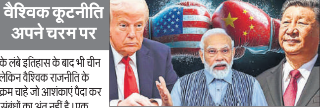
वैश्विक कूटनीति अपने चरम पर