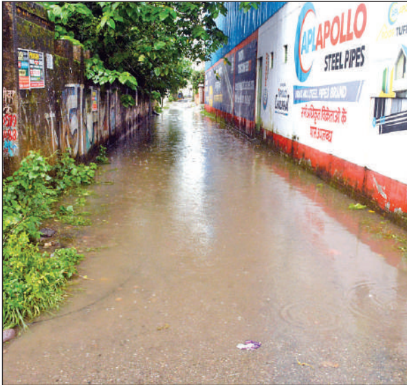
महार्षि विद्या मंदिर के पास अंदर जाने वाली सड़क में भरा पानी। ● अमृत विचार