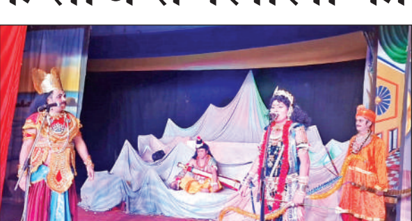
नारद मोह की लीला का मंचन करते कलाकार।