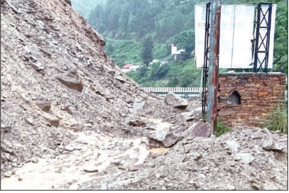
अल्मोड़ा-हल्द्वानी हाइवे के क्वारब के पास मलबे से पटी सड़क। ● अमृत विचार

लग गई। जिससे मौके पर हड़कंप मच गया। आनन-फानन में फायर सर्विस को सूचना दी गई। मौके पर पहुंची फायर सर्विस आग बुझाने में जुट गई। करीब दो घंटे की कड़ी मशकत के बाद आग पर किसी