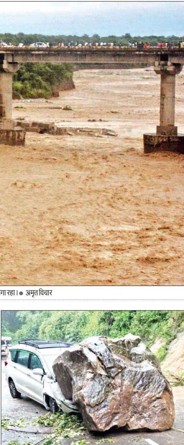
दोगांव क्षेत्र में कार के ऊपर गिरा बोल्टर ।