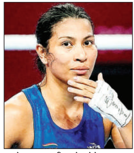
मुक्केबाज लवलीना बोरगोहेन।

बैंगलुरु : टीवोंगो 2020 की कांस्य पदक विजेता लवलीना बोरगोहेन और निखत जरीन 4 सितंबर से इंग्लैंड में शुरू होने वाली विश्व मुक्केबाजी चैंपियनशिप 2025 में 20 सदस्यीय भारतीय दल का नेतृत्व करेंगी। इस खेल की नवगठित वैश्वक शासी संस्था, विश्व मुक्केबाजी द्वारा आयोजित इस चैंपियनशिप का पहला संस्करण एम एंड एस बैंक परिना में होगा और 14 सितंबर को समाप्त होगा। 165 से अधिक देशों के 550 से अधिक मुक्केबाज, जिनमें 17 पेरिस 2024 ओलंपिक पदक विजेता शामिल हैं, 20 भार वगों ( 10 पुरुष और 10 महिला) में प्रतिस्पर्धा करने के लिए तैयार हैं।