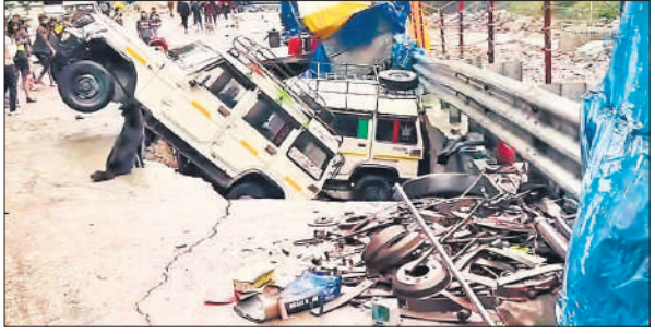
सोनप्रयाग शटल पार्किंग धंसने से चपेट में आए वाहन।

अमृत विचार : उत्तराखंड में भारी बारिश का कहर जारी है। मंगलवार को पूरे राज्य में जमकर बादल बरसे। नदी-नाले उफान पर हैं। मौसम विभाग के जारी अलर्ट को देखते हुए नैनीताल और चम्पावत जिले में कक्षा 12 तक के विद्यालय और आंगनबाड़ी केंद्रों में अवकाश घोषित कर दिया गया है। वहीं, मुख्यमंत्री धामी ने मंगलवार को भारी बारिश के बीच कठिन परिस्थितियों को दरकिनार करते हुए हरिद्वार के लक्सर में आपदा प्रभावित क्षेत्रों में ट्रैक्टर से ग्रामीण और जलमग्न क्षेत्रों तक पहुंचकर स्थलीय निरीक्षण किया और राहत कार्यों को गति देने के निर्देश दिए। बारिश और भूस्खलन के चलते हल्द्वानी-नैनीताल मार्ग पर मंगलवार सुबह एक भारी बोल्टर कार के बोनट पर आ गिरा। गनीमत रही कि कार में सवार तीन लोग बाल-बाल