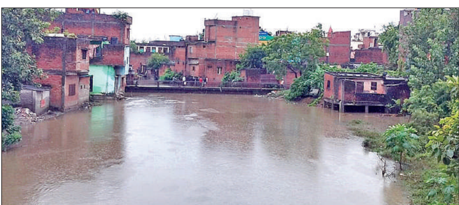
कल्याणी नदी का जलस्तर बढ़ने के बाद डूबे घर । ● अमृत विचार

मौसम विभाग द्वारा अलर्ट जारी होने के बाद रविवार की रात्रि से तराई भावर इलाके में बारिश शुरू हुई और 48 घंटे तक लगातार मूसलाधार बारिश होती रही। इस कारण कल्याणी नदी का निचला हिस्सा और नदी के किनारे बसे रविंद्र नगर, जगतपुरा, मुखर्जी नगर, दूधिया नगर के बहाव वाले वार्डों में पानी का बहाव तेज होने लगा। कल्याणी का जलस्तर बढ़ने के कारण नदी उफान पर आने लगी है। यही कारण है कि तीन पानी डाम की छोटी पुलिया में जब बहाव तेज हुआ और इलाके में जलभराव की स्थिति पैदा होने लगी। निगम को पुलिया को तोड़नी पड़ी। इसके बाद लोगों ने राहत की सांस ली। संभावना जताई जा रही है कि यदि बारिश लगातार जारी रही तो निचले इलाकों में जलभराव हो सकता है। इसके लिए आपदा प्रबंधन, पुलिस, नगर निगम और प्रशासन