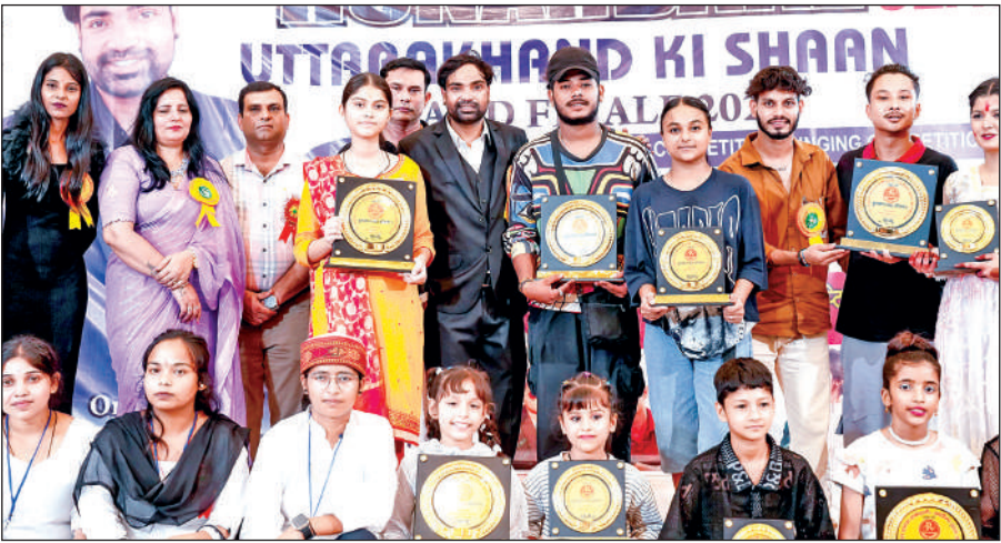
हुनरबाज-3 के विजेताओं के साथ आयोजक एवं अतिथि।