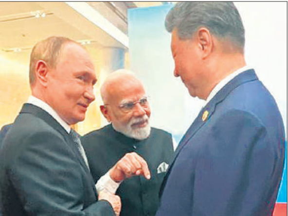
तियानजिन में मोदी, पुतिन और जिनापिंग की मुलाकात से अमेरिका में है हलचल।

नवारो की यह टिप्पणी सोमवार को तियानजिन में एससीओ शिखर सम्मेलन से इतर तीनों नेताओं द्वारा घनिष्ठता प्रदर्शित किए जाने के बाद आई है। मोदी, शी और पुतिन के बीच ‘एकजुटा के प्रदर्शन’ के बारे में पूछे जाने पर नवारो ने व्हाइट हाउस में पत्रकारों से कहा, यह चिंताजनक है, बहुत चिंताजनक है। इसका कोई मतलब नहीं है। टैरिफ पर ट्रंप की नीतियों के कारण वाशिंगटन और नई दिल्ली के बीच रिश्तों में गिरावट आने के बाद नवारो कुछ दिनों से लगातार भारत को निशाना बना रहे हैं। नवारो ने कहा, समझ नहीं आता कि मोदी के मन में क्या है, खासकर तब जब भारत पिछले कई दशकों से चीन के साथ कभी शीत युद्ध तो कभी सीधे संघर्ष की स्थिति में रहा है। उन्होंने कहा, भारत को हमारे साथ काम करना चाहिए। भारत को लगता है कि वो हमारे साथ जैसा चाहे ऐसा कर सकता है लेकिन ट्रंप ऐसा होने नहीं देंगे।