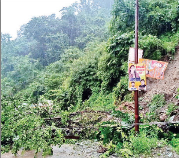
नैनीताल जिले के अमृतपुर एरिया में लैंडस्लाइड होने से मलबा व पेड़ सड़क पर आ गिरे, जिससे यातायात बंद हो गया ।