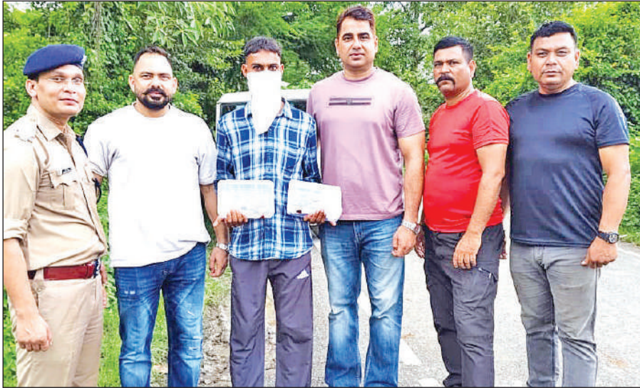
एसटीएफ की गिरफ्त में आरोपी हथियार सप्लायर।