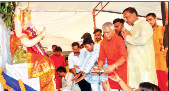
रामलीला मैदान में पूजा-अर्चना करते वैश्य महासभा के सदस्य।