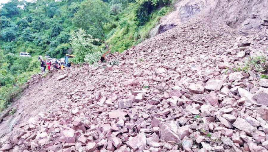
अल्मोड़ा हाईवे मलबा आने से बाधित हो गया। पुलिस ने मलबा हटाकर यातायात सुचारु करवाया । ● अमृत विचार

गौला का जलस्तर 48,282 क्यूसेक, सिंचाई विभाग ने किया अलर्ट : मंगलवार को लगातार बारिश के बीच गौला नदी उफान पर रही। नदी का जलस्तर 48,282 क्यूसेक तक पहुंच गया, जो सामान्य स्तर से काफी अधिक है। तेज बहाव