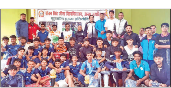
फुटबॉल प्रतियोगिता के संयुक्त विजेताओं को किया पुरस्कृत।