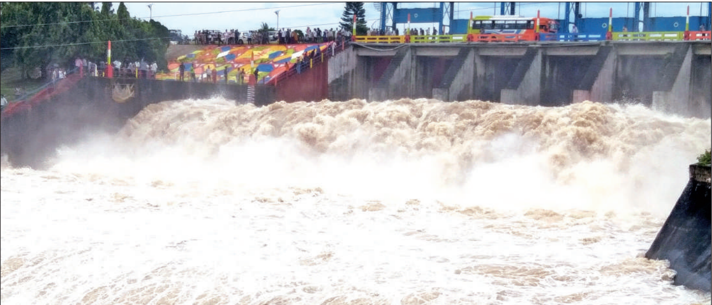
नानकमता में खोले गए नानकसागर डैम के गेट ।