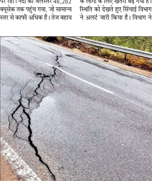
भवाली - अल्मोड़ा हाईवे पर सुयालबाड़ी के पास सड़क में पड़ी दरारें ।