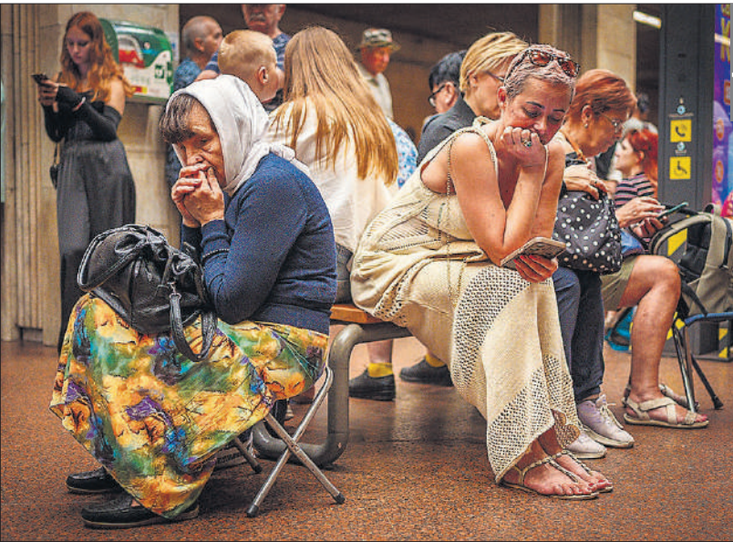
लगातार रूसी सेना के हमलों के बीच सुरक्षा के लिए कीव (यूक्रेन) के एक मेट्रो स्टेशन में बैठे लोग।

सिंगापुर। सिंगापुर के प्रधानमंत्री लॉरेंस वोंग मंगलवार से भारत की तीन दिवसीय आधिकारिक यात्रा शुरू करेंगे, जिसका उद्देश्य द्विपक्षीय संबंधों को मजबूत करने की प्रतिबद्धता को दोहराना है। प्रधानमंत्री नरेंद्र मोदी के निमंत्रण पर वोंग की यह यात्रा दोनों देशों के बीच राजनयिक संबंधों की स्थापना की 60वीं वर्षगांठ के मौके पर हो रही है। उनके कार्यालय ने बताया कि यह यात्रा संबंधों को और प्रगाढ़ बनाने के लिए सिंगापुर और भारत की परस्पर प्रतिबद्धता को भी दोहराती है। वोंग नई दिल्ली में राष्ट्रपति द्रौपदी मुर्मू और प्रधानमंत्री मोदी से मुलाकात करेंगे। मोदी सिंगापुर के प्रधानमंत्री के सम्मान में एक भोज का भी आयोजन करेंगे। वोंग स्वास्थ्य और परिवार कल्याण मंत्री जेपी नन्दा, वित्त मंत्री निर्मला सीतारमण, विदेश मंत्री जयशंकर और एनएसए अजीत डोभाल से भी मुलाकात करेंगे।