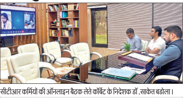
सीटीआर कर्मियों की ऑनलाइन बैठक लेते कॉर्बेट के निदेशक डॉ. साकेत बडोला।

कि वर्षों से वन मार्ग अत्याधिक प्रभावित हुए हैं। इन परिस्थितियों में भी वन एवं वन्यजीवों की सुरक्षा प्रयास किए जा रहे हैं। निदेशक ने वन एवं वन्यजीवों की सुरक्षा के साथ ही स्वयं की सुरक्षा के लिए भी सचेत रहने के निर्देश दिए।