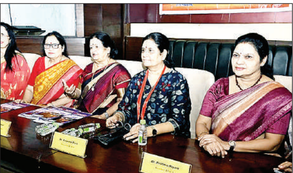
जानकारी देती डॉक्टर।

भेजे गए थे, जिसे स्वीकृति मिल गई है। अब एक सप्ताह में टेंडर जारी कर दिए जाएंगे।