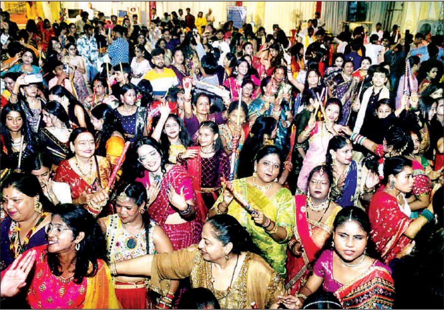
लालबंगला में गणेश पंडाल में डाडिया का रंगारंग कार्यक्रम हुआ।

अमृत विचार। श्री बालाजी बाबोसा सेवा समिति की ओर से रविवार को मंगल उत्सव मनाया गया। सिविल लाइन्स स्थित वेद गेस्ट हाउस” में हुए आयोजन में बाबोसा भगवान को छुपन भोग लगाया गया। आयोजन में 5 फिट की विशेष प्रतिमा को