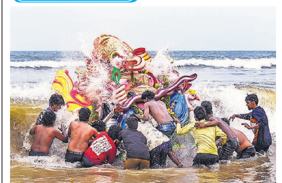
चेन्नई के मरीना बीच पर रविवार को लोगों ने भगवान गणेश की मूर्ति को समुद्र में विसर्जित किया ।