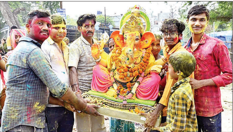
गणपति बाबा को विसर्जन के लिए ले जाते भक्त।

गणपति पंडालों में सुबह से ही उत्साह रहा। पंडालों में प्रसाद के लिए भंडारे वितरित किए गए। पूजन के साथ ही भक्तों को प्रार्थना की दृब भी वितरित की गई। शहर के कई क्षेत्रों में विराजमान विघ्नहर्ता की प्रतिमा की विसर्जन यात्राएं भी निकलीं। इन यात्राओं में भक्तों की ओर से उत्साह के साथ जयघोष