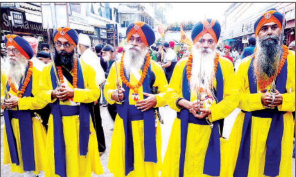
गोविंदनगर के गुरुद्वारा बाबा श्री चंद से निकाला गया नगर कीर्तन जिसकी अगुवाई पंज प्यारे कर रहे थे। संगत वाहे गुरु का जप करते चली।

की आरती हुई। सुतरखाना में बच्चों ने सांस्कृतिक कार्यक्रम के जरिए प्रतिभा दिखाई।