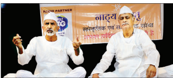
मंच पर नाट्य प्रस्तुति देते कलाकार।