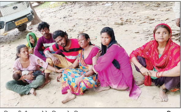
श्रमिक की मौत पर रते-बिलखते परिजन ।