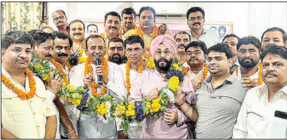
नए पदाधिकारियों का स्वागत किया गया।