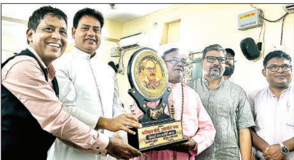
मुख्य अतिथि का स्वागत किया गया।

कानपुर । स्वरूप नगर में कब्जे की शिकायत को लेकर रविवार को क्षेत्रीय लोगों ने प्रदर्शन किया। यहां सार्वजनिक गली में निर्माण कराने की क्षेत्रीय लोगों ने शिकायत की। जिसपर पुलिस ने मौके पर पहुंचकर लोगों को समझाया। गली में कब्जा किए जाने का मामला केडीए पहुंच गया है।