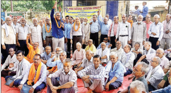
रावतपुर बस अड्डे पर धरना देते पेशनधारी।