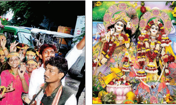
राधा-कृष्ण का भव्य शृंगार किया गया।