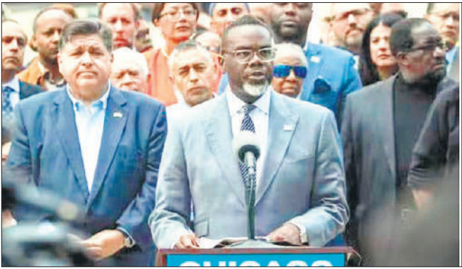
ट्रंप के फैसले के खिलाफ प्रेस कॉन्फ्रेंस करते शिकागो के मेयर ब्रैंडन जॉनसन।

बताया जा रहा है कि ट्रंप प्रशासन अमेरिका के तीसरे सबसे बड़े शहर में कुछ ही दिनों में संघीय अधिकारियों को भेज सकता है। मेयर ब्रैंडन जॉनसन के एक शासकीय आदेश के अनुसार, शिकागो पुलिस तलाशी अभियान, वाहनों की जांच जैसी आव्रजन से जुड़ी कार्रवाई में संघीय अधिकारियों की मदद नहीं करेगी। संघीय सरकार द्वारा ‘नेशनल गार्ड’ की तैनाती किए जाने की अटकलों के बीच मेयर ने शहर के सभी विभागों को निदेश दिया है कि वे शिकागो के लोगों