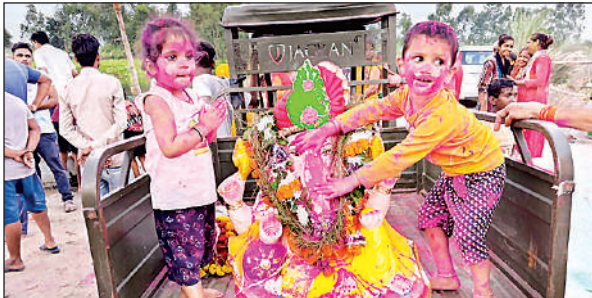
गगनी खेड़ा झील में विसर्जन के दौरान गजानन को अबीर गुलाल लगाता बच्चा ।