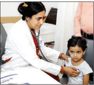
बच्ची की जांच करती डॉक्टर।