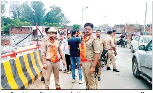
रूरा में हादसे के बाद मौके पर जांच करती पुलिस ।