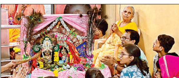
पोनी रोड राधा कृष्ण मंदिर में राधा अष्टमी पर गुणगान करते भक्त ।