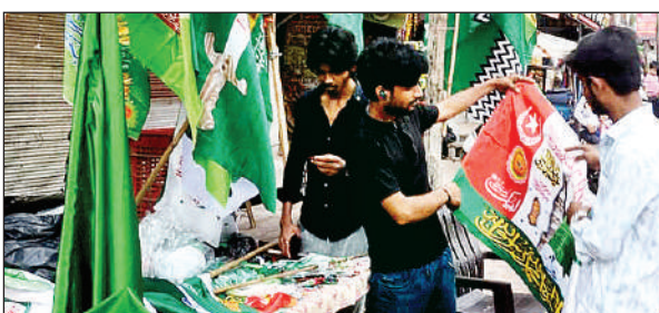
शहर में हरे झंडों की बिक्री शुरू है।