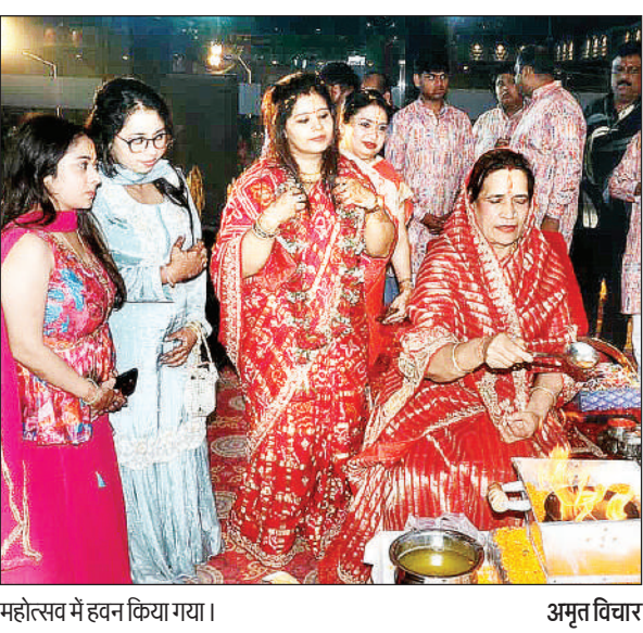
महोत्सव में हवन किया गया।