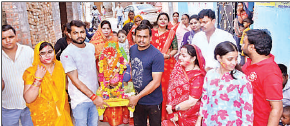
श्री गणेश की प्रतिमा विसर्जित करने जाते भक्त ।

महोत्सव, चंपापुरवा और अन्य स्थानों पर भी भव्य महाआरती हुई । गायत्री नगर श्री गणेश नवयुवक सेवा समिति द्वारा गणेश प्रतिमा को महाभोग अर्पित कर आरती की गई । वहीं पोनी रोड, सहजनी चौराहा, मिश्रा कॉलोनी, बिंदा नगर समेत कई स्थानों पर कथा और