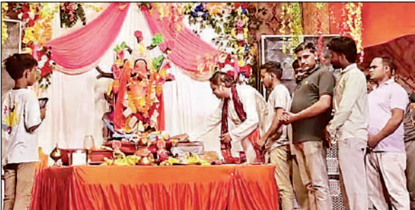
देवारा कलां में बप्पा की आरती करते किसान नेता ।

अमृत विचार । 27 अगस्त से शुरू हुआ गणेश महोत्सव अब अपने अंतिम पड़ाव पर पहुंच चुका है । नगर में रविवार को धूमधाम के बीच गणेश प्रतिमाओं के विसर्जन का सिलसिला शुरू हुआ । सुबह से ही विभिन्न समितियों एवं मोहल्लों में स्थापित प्रतिमाओं को शोभायात्रा के रूप में गगनीखेड़ा झील की ओर ले जाया गया । जगह-जगह गणपति बप्पा मोरया... के जयकारे गुंजते रहे ।