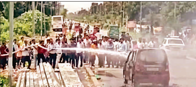
कार में लगी आग बुझाते फेक्ट्री के श्रमिक।