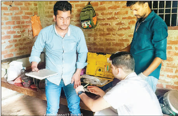
फोरेंसिक टीम ने कमरे में बारीकी से साक्ष्य संकलित किए।