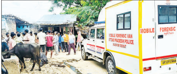
घर के बाहर ग्रामीणों का मजमा लगा रहा।