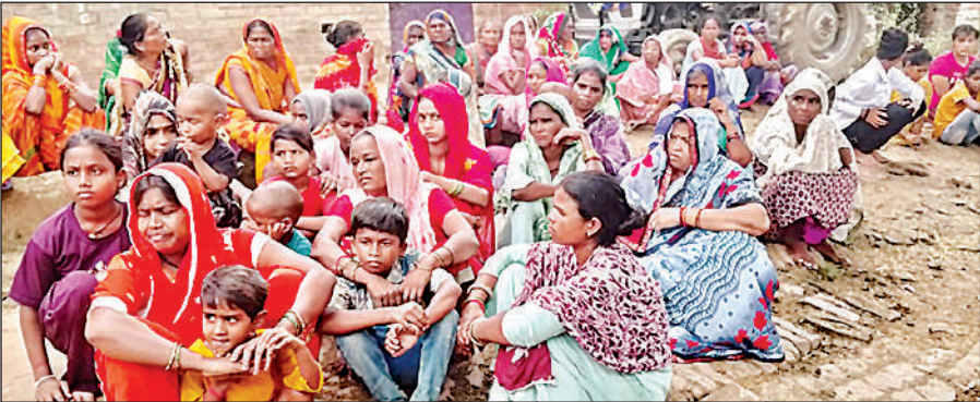
मृतक के घर के बाहर गमगीन बैठे परिजन।

शुक्लागंज, उन्नाव। रविवार देर रात आकाशीय बिजली कड़कने से आनंद घाट स्थित 400 केवीए ट्रांसफार्मर की एसटी उड़ गई। इसके चलते सीताराम कालोनी, मनोहर नगर, पुल बाजार और द्वारिका मोहिनी कपांडंड सहित तीन मोहल्लों के सैकड़ों घरों की बिजली आपूर्ति ठप हो गई। रात करीब सवा बारह बजे ट्रांसफार्मर फेल होने के बाद बिजलीकर्मों मौके पर पहुंचे और मरम्मत की कोशिश की, लेकिन ट्रांसफार्मर तत्काल चालू नहीं हो सका। लगातार 11 घंटे बिजली गुल रहने से उपभोक्ताओं को उमस भरी रात में भारी परेशानी