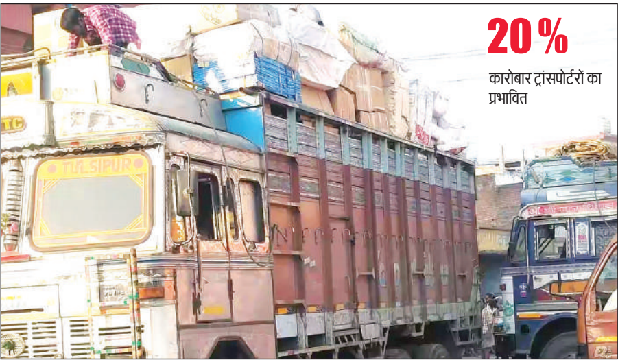
ट्रांसपोर्ट नगर से होती है माल ढुलाई।

शहर के ट्रांसपोर्टर्स इस वक्त गहरी चिंता से गुजर रहे हैं क्योंकि शहर के औद्योगिक इलाकों में मौजूद प्रोडक्शन यूनिट से माल की आवाजाही कम हो गई है। यह कमी निर्यात ऑर्डर के प्रभावित होने की वजह से है। यूनिट्स से कंटेनर डिपो तक जाने वाले ट्रक और लोडर की बुकिंग पर असर लगभग 2 हजार छोटे व बड़े वाहनों पर असर पड़ा है। सबसे बुरी स्थिति उन ट्रांसपोर्टर्स की है जो सिर्फ प्रोडक्शन यूनिट के भरोसे ही अपने लोडर व ट्रक में माल 'स्टॉक' की सवारी करा रहे थे। ट्रक और लोडर की बुकिंग पर असर पड़ने लगा है। उनका मानना है कि यदि यह स्थिति ऐसी ही चलती रही तो आने वाले दो से तीन महीनों में कारोबार और अधिक प्रभावित हो सकता है।