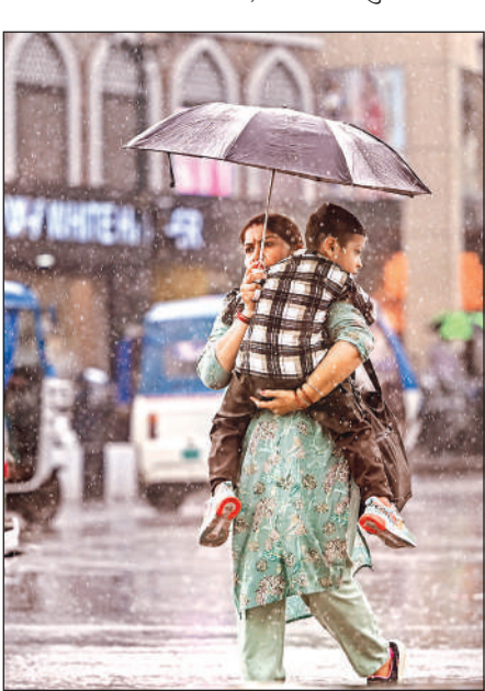
लखनऊ के हजरतगंज क्षेत्र में बारिश के बीच अपने बच्चे को छाता लगाकर भीगने से बचाती महिला।

उनकी जेल अर्वाधि के सदुपयोग करने के लिए व्यवस्था बनाने की भी आवश्यकता बताई। बैठक में अधिकारियों ने जानकारी दी कि राष्ट्रीय विधिक सेवा प्राधिकरण द्वारा सुझाई गई प्रणाली को प्रदेश में अपनाने पर भी विचार किया जा रहा है, ताकि