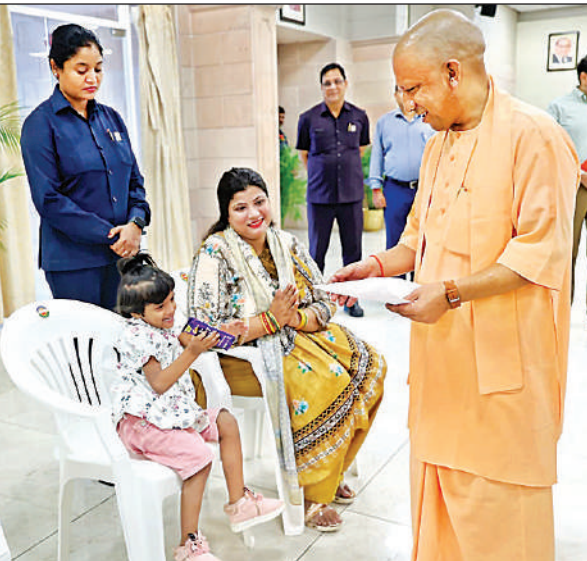
जनता दर्शन के दौरान बच्ची मायरा को चॉकलेट देते मुख्यमंत्री योगी।

जा चुका है। योजना में युवा महिलाएं भी खूब भागीदारी कर रही हैं। ऋण लेने वालों में 71 प्रतिशत पुरुष व 29 प्रतिशत महिला उद्यमी शामिल हैं। कुल ऋण लेने वाले युवाओं में 33.7 प्रतिशत सामान्य वर्ग, 49 प्रतिशत