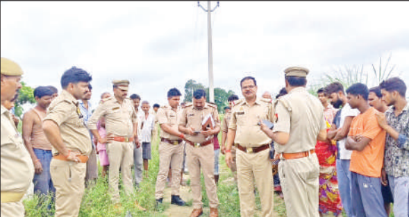
नहर में बालक का शव मिलने पर पुलिस ने प्रारंभिक छानबीन की।

उनसे अपनी आपबीती बताईं तब वे लोग युद्ध के लिए भगवान राम के पास आए यहां अकेले भगवान राम ने उनकी 14000 सेना सहित खर दूषण का वध किया। इसकी जानकारी सूर्यपंखा ने अपने भाई