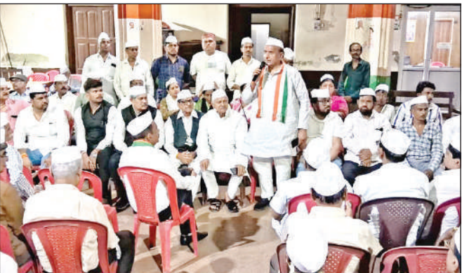
तिलक हाल में बैठक करते कांग्रेस नेता।

अमृत विचार। बिहार में प्रधानमंत्री नरेंद्र मोदी के खिलाफ अपशब्द कहे जाने के विरोध में रविवार को भाजपा ने प्रदर्शन करते हुए कांग्रेस कार्यालय तिलक हाल में धावा बोलने की कोशिश की थी लेकिन पुलिस की मुस्तैदी से मामला बच गया। अफवाह फैल गई कि सोमवार को दोपहर 2 से 3 बजे के बीच भाजपाई फिर प्रदर्शन करने आ रहे हैं जिसपर बड़ी संख्या में कांग्रेसी तिलक हाल पहुंचने और कहा कि गांधी टोपी का अपमान बर्दाश्त नहीं किया जाएगा। यदि कोई बेवजह छेड़ेगा तो उसको छोड़ेंगे नहीं।