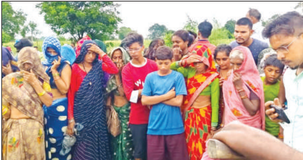
शव मिलने की खबर मिलने की गांव की महिलाएं भी पहुंच गईं।