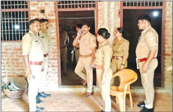
घटनास्थल पर प्रारंभिक जांच- पड़ताल करती पुलिस।