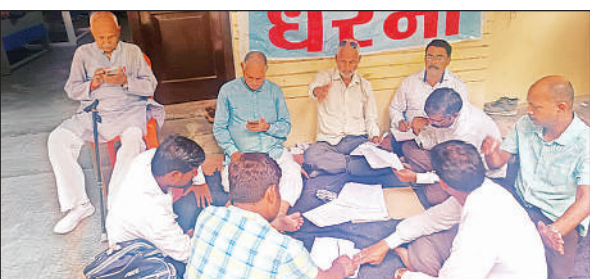
जिला विद्यालय निरीक्षक कार्यालय में धरना देते शिक्षक नेता।