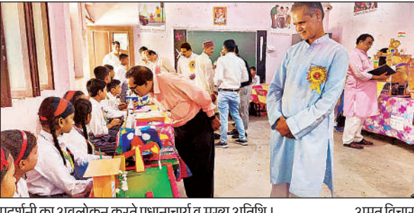
प्रदर्शनी का अवलोकन करते प्रधानाचार्य व मुख्य अतिथि।