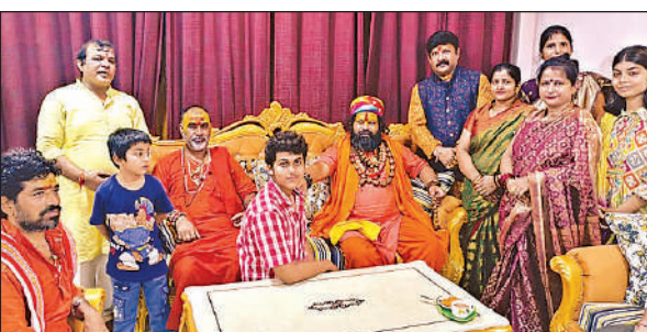
भातू फार्म में मौजूद महंत व अन्य।