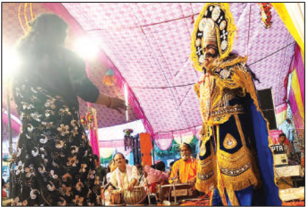
रामलीला में सीता हरण की लीला का मंचन करते कलाकार।

पुखरायां के 132 केवी उपकेंद्र से राजपुर व सट्टी उपकेंद्रों को आपूर्ति दी जाती है। रविवार शाम बारिश में सट्टी उपकेंद्र की 33 केवी लाइन के दो पोल के इंसुलेटर रुरगांव के समीप टूटने से तार भी टूटकर गिर गया। इससे दोनों उपकेंद्रों के 14 फीडरों से जुड़े सैकड़ों गाँव की बिजली आपूर्ति ठप हो गई। बारिश के चलते विधुत कर्मी टूटे इंसुलेटर और तार की मरम्मत नहीं कर पाए।