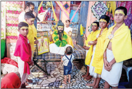
प्रेमानंद की वेशभूषा में बच्चे।