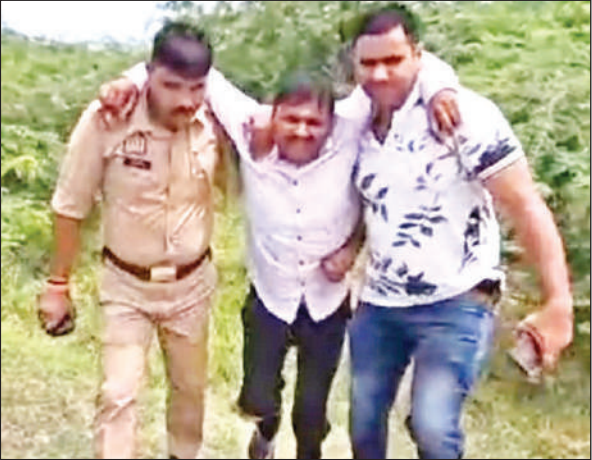
घायल को ले जाती पुलिस।

गंगाघाट पुलिस व एसओजी ने की संयुक्त कार्रवाई, तमंचा और कारतूस बरामद, अन्य आरोपियों की तलाश हुई तेज