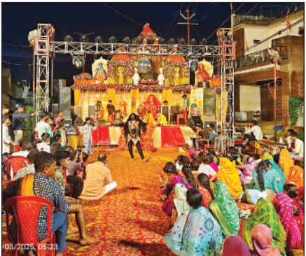
मां काली की झांकी प्रस्तुत करते कलाकार।