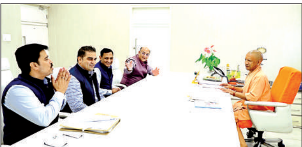
मुख्यमंत्री से मिले शहर के उद्यमी और व्यापारी।