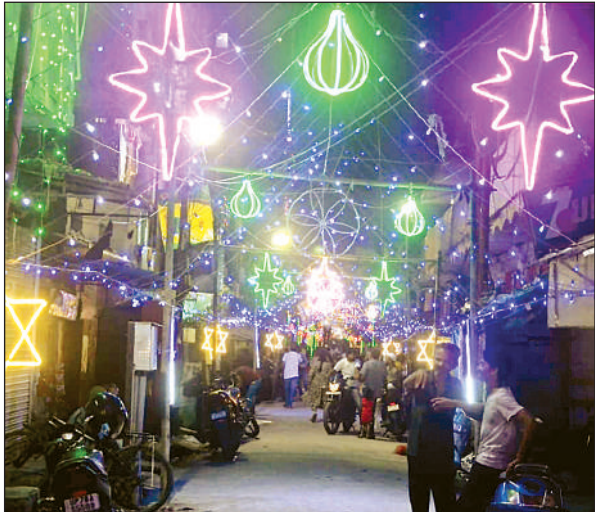
जगह-जगह की गई है सजावट।