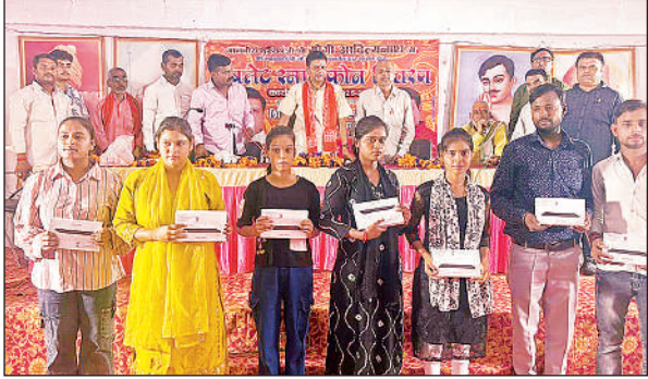
मुख्य अतिथि के साथ टैबलेट लिए छात्र-छात्राएं।।