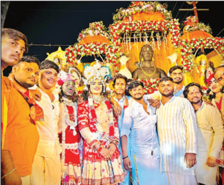
जगराता में राधा-कृष्ण की झांकी ने मन मोहा।