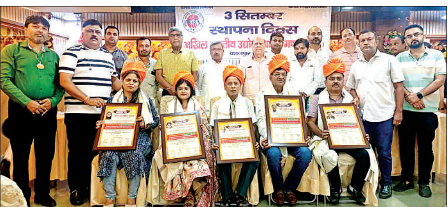
स्थापना दिवस पर व्यापारियों का सम्मान किया गया।

रोजगार मिलेगा। संस्थान अपनी तरह का भारत सरकार का इकलौता शैक्षणिक संस्थान है, जिसका