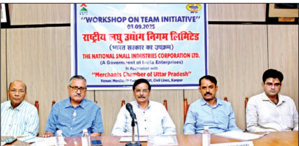
कार्यशाला में विशेषज्ञों ने दी जानकारी।

होने से व्यापार और निवेश बाधित है। कहा गया कि इसमें विस्तार कर एरो सिटी, नॉलेज सिटी और स्मार्ट कानपुर परियोजनाओं को गति दी