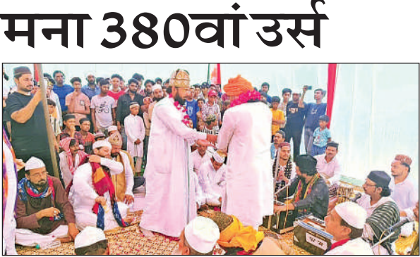
उर्स में शिरकत करते लोग।