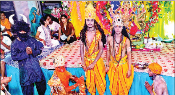
गणेश पंडाल में लीला का मंचन हुआ।

अमृत विचार। पैगंबर मोहम्मद साहब के जन्मदिन पर 5 सितंबर को परेड ग्राउंड से उठने वाले जुलूस-ए-मोहम्मदी के मधेनजर ट्रैफिक पुलिस ने कई रूटों पर रूट डायवर्जन की घोषणा की है। घण्टाघर चौराहा से कोई भी वाहन मूलगंज नहीं जाएगा बल्कि कोपरगंज या एक्सप्रेस वे रोड से चलेंगे। बड़ा चौराहा से कोई भी वाहन कोलवाली की तरफ नहीं जाएगा बल्कि उर्सला कट से यू-टर्न लेकर जाएंगे। उर्सला कट से कोई भी वाहन परेड की तरफ नहीं जा सकेंगे। वाहन नयागंज चौकी से आगे नहीं जा सकेंगे। मूलगंज चौराहा से कोई वाहन नयी सड़क से सदभावना की तरफ नहीं जा सकेंगे। जरीब चौकी चौराहा से आने वाला यातायात भन्नानापुरवा से वायें अजमेरी चौराहा की ओर नहीं जा सकेगा। ऐसे यातायात भन्नानापुरवा से डिप्टी पड़ाव होकर अपने गन्तव्य को जा सकेंगे। मेघदूत तिराहा की तरफ से आने वाला यातायात फूलबाग पनचक्की की तरफ नहीं जा सकेगा, ऐसे वाहन चालिस से किला तिराहा, झाड़ीबाबा होते हुए अपने गंतव्य को जा सकेंगे। करीब चौकी की ओर से आने वाला यातायात चन्दिका देवी मन्दिर से वायें मुडकर हलीम कॉलेज चौराहा की तरफ नहीं जा सकेंगे। ऐसे