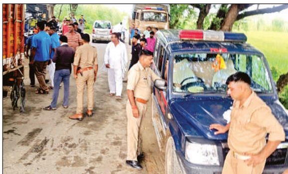
दकपुरवा नहर पुल पर मौजूद ग्रामीण और पुलिस।