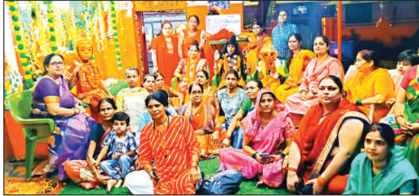
संकट मोचन धाम में हनुमान जी के भजन गुंजे।