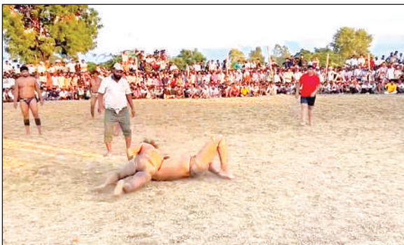
काशीपुर के दंगल में प्रतिद्वंदी को पटखनी देता पहलवान।