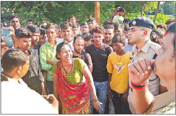
गुस्साए परिजनो और ग्रामीणों को समझाते सीओ सिटी।