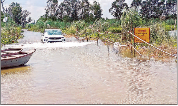
हरिहरपुर मार्ग में बाढ़ के पानी से निकलती कार।

केंद्रीय जल आयोग के अनुसार मंगलवार शाम छह बजे गंगा का जलस्तर 112.690 मीटर था, जो बुधवार सुबह 11 बजे बढ़कर 112.850 मीटर हो गया। शाम छह बजे तक यह और बढ़कर 112.870 मीटर पर पहुंच गया। जलस्तर में लगातार हो रही बढ़ोत्तरी के चलते