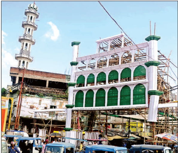
घंटाघर पर बन रहा गेट।

शहरकाजी डॉ. मुफ्ती युनुस रजा ओवैसी ने उलेमा के साथ ईद मौलादुनबी की तैयारियों को लेकर बैठक की और जुलूस-ए-मोहम्मदी के लिए भी गाइडलाइन जारी की गई। शहरकाजी ने कहा कि वजू के साथ जुलूस में शामिल हों। पहले जुमा की नमाज अदा करें फिर