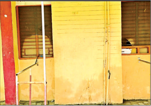
पर्चा काउंटर की बंद विंडो और पसरा सन्नाटा।

अमृत विचार: प्राथमिक स्वास्थ्य केंद्र में डॉक्टरों की लेटलतीफी मरीजों का दर्द बढ़ा रही है। बुधवार की सुबह ओपीडी शुरू होते ही मरीजों की लाइन लग जाती है। लेकिन डॉक्टरों के तय समय पर न पहुंचने से उन्हें घंटों इंतजार करना पड़ता है। ओपीडी का समय सुबह आठ से लेकर दोपहर दो बजे तक है। भीड़ से बचने के लिए मरीज जा उनके तीमारदार सुबह आठ बजे आकर पर्चा बनवाते हैं। इसके बावजूद डॉक्टरों की लेटलतीफी उन्हें घंटों इंतजार कराती है। दावे चाहे जितने किए जाएं पर राजपुर पीएचसी में स्वास्थ्य व्यवस्थाएं पटरी पर नहीं आ रही हैं। हालत यह है कि डॉक्टर और