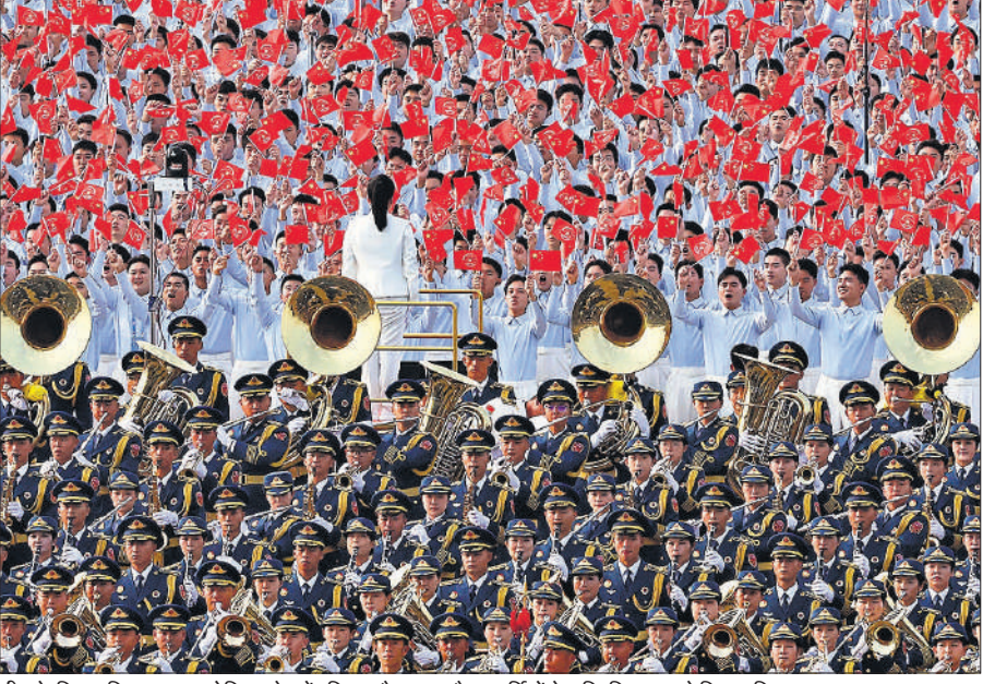
चीन के विजय दिवस पर आयोजित परेड मेंमहिला और पुरुष सैन्य कर्मियों ने सम्मिलित रूप से हिस्सा लिया।

जलालाबाद। संयुक्त राष्ट्र ने पूर्वी अफगानिस्तान में आए भूकंप में हताहतों की संख्या में और वृद्धि की चेतावनी दी है। वहीं, तालिबान प्रशासन ने कहा कि भूकंप में मरने वालों की संख्या 1,400 से अधिक हो गई और 3,000 से ज्यादा लोग घायल हुए हैं। सरकार के प्रवक्ता जबीहुल्ला मुजाहिद ने जो आंकड़े दिए हैं, वे सिर्फ कुनार प्रांत के हैं। रविवार रात आए 6.0 तीव्रता के शक्तिशाली भूकंप ने कई प्रांतों को हिलाकर रख दिया, जिससे भारी तबाही हुई।