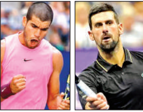
कार्लोस अल्काराज व नोवाक जोकोविच।

दो साल पहले यहां अपना पहला ग्रैंडस्लैम खिताब जीतने के बाद से अल्काराज हार्डकोर्ट पर पहली बार ग्रैंडस्लैम सेमीफाइनल में पहुंचे हैं। जोकोविच ने उन्हें आस्ट्रेलियाई ओपन क्वार्टर फाइनल में हराया था। अगर अल्काराज अमेरिकी ओपन खिताब जीतते हैं तो एटीपी रैंकिंग में यानिक सिमेर को पछाड़कर शीर्ष पर काबिज हो जाएंगे। जोकोविच