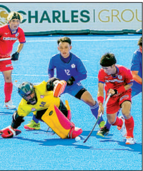
चीनी ताइपे के खिलाफ गोल करने का प्रयास करते जापान के खिलाड़ी।