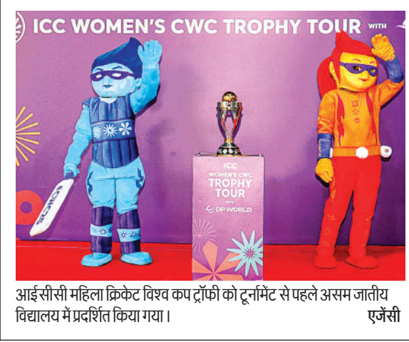
आईसीसी महिला क्रिकेट विश्व कप टूर्नामेंट से पहले असम जातीय विद्यालय में प्रदर्शित किया गया।

सितंबर के आखिरी हफ्ते में होने की उम्मीद है। सिर्फ कुछ पद ही दाव पर होंगे और इस साल के चुनाव बीसीसीआई के अपने नियमों के अनुसार होंगे। राष्ट्रीय खेल प्रशासन अधिनियम लागू होने में अभी कुछ समय लग सकता है जिससे बीसीसीआई इतना लंबा इंतजार नहीं करेगा। जुलाई में अपना 70वां जन्मदिन पूरा कर चुके रोजर बिन्नी दोबारा नहीं चुने जा सकते।