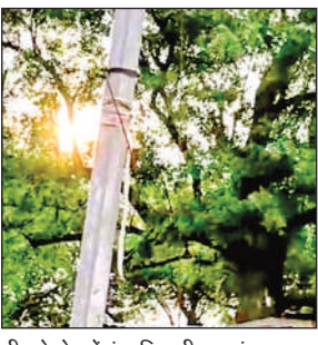
नीम के पेड़ में बंधा बिजली का खंभा।

इस खंभे के आसपास बने मकानों में रहने वाले ग्रामीणों ने बताया कि बारिश के मौसम में इस पेड़ में करंट उतर आता है। पिछले महीने करंट उतरने से एक बैस की मौत हो गई। फिर भी विभाग ने कोई कार्रवाई नहीं की। ग्रामीणों ने बताया कि बिजली का पोल कीचड़ में धंस चुका है। इसे सहारा देने के लिए नीम के पेड़ से