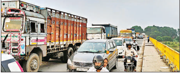
मरहला चौराहे पर जाम में फंसे वाहन सवार।