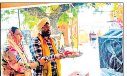
गणेश जी का पूजन करते थाना प्रभारी।