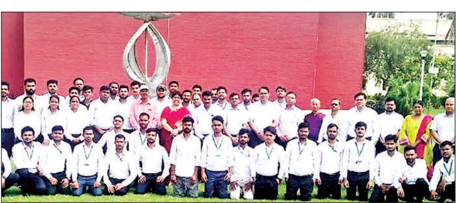
एनएसआई में जाँब पाने वाले छात्र और फैकल्टी।