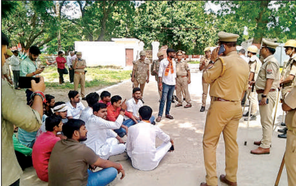
कलेक्ट्रेट परिसर में पुलिस के सामने नारेबाजी करते एबीवीपी के पदाधिकारी व सदस्य।

अमृत विचार। बीते दिनों बाराबंकी में अखिल भारतीय विद्यार्थी परिषद के कार्यकर्ताओं व पदाधिकारियों पर पुलिस के लाठीचार्ज में कई लोग घायल हो गए थे। इससे जनपद के पदाधिकारी भी नाराज हैं। गुरुवार को कलेक्ट्रेट परिसर में विद्यार्थी परिषद के कार्यकर्ताओं ने ‘खाकी’ की मौजूदगी में पुलिस मुर्दाबाद के नारे लगाए। धरना देकर आक्रोश व्यक्त किया। इसके अलावा मंत्री ओपी राजभर के बयान को लेकर उनका पुतला भी फूँका। एबीवीपी के संगठन मंत्री