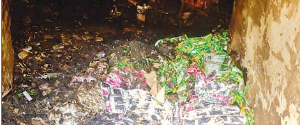
कानपुर रोड पर गोदाम में लगी आग।