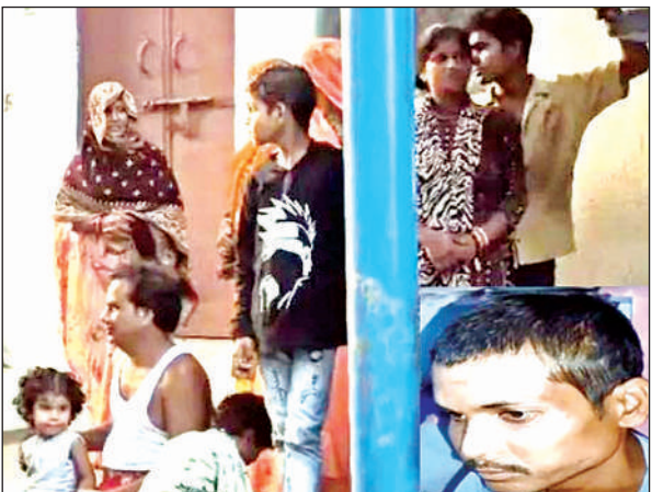
घर पर खड़े परिजन व ईसेट में पीड़ित की फाइल फोटो।

सजावट की गई, जिसे देखने के लिए महिलाएं पुरुष यौम ए पैदाइश के दिन पहुंचते हैं।