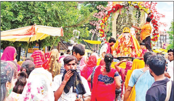
गणेश प्रतिमा को विसर्जित करने ले जाते श्रद्धालु ।

गुरुवार को नगर के मोहल्ला रामगंज स्थित पंडाल में स्थापित गणेश प्रतिमा की शोभायात्रा धूमधाम से नगर में निकाली गई। शोभा यात्रा को नगर के जीटी रोड, तिर्वा रोड, सहित प्रमुख मार्गों पर डीजे की धुनों पर भ्रमण कराया गया। इस दौरान युवाओं ने गणपति बप्पा मोरया के गगनभेदी नारे