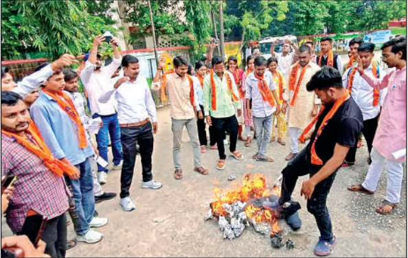
कलेक्ट्रेट में प्रमुख सचिव गृह का पुतला फूंकते एबीवीपी कार्यकर्ता।