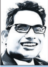
मनोज अभिज्ञान लेखक

वैज्ञानिकों ने गेहूं में एक नया तरीका विकसित किया है, जिससे वह अपने लिए खुद ही उर्वरक (fertilizer) बना सके। यह खोज बहुत बड़ी है, क्योंकि इससे खेती में उर्वरक पर खर्च कम होगा और पर्यावरण पर पड़ने वाला नकारात्मक प्रभाव भी घटेगा। सामान्यतया, गेहूं और अन्य धान्य फसलें हवा में मौजूद नाइट्रोजन गैस का उपयोग नहीं कर पातीं, जबकि कुछ पौधे, जैसे