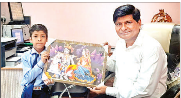
बच्चों को सम्मानित करते शिक्षक।