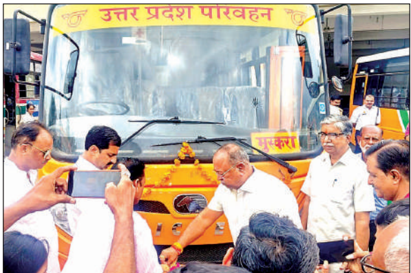
पूजा अर्चना के बाद बस का शुभारंभ करते विधायक व एमएलसी।