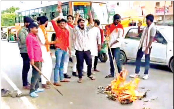
तिर्वा क्रॉसिंग के निकट पुतला फूंकते विद्यार्थी परिषद के कार्यकर्ता।

बाराबंकी में पुलिस की लाठीचार्ज से घायल हुए विद्यार्थी परिषद के कार्यकर्ताओं से नाराज संगठन