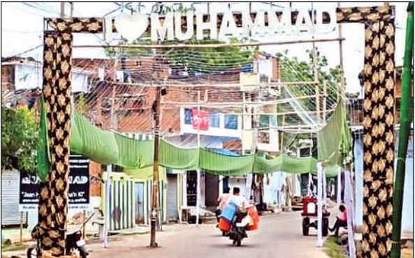
तहसील भटीपुरा मार्ग पर हुई सजावट।

बारावफात पर्व को लेकर युवाओं में कुछ अलग ही उत्साह नजर आता है। रबीउल अव्वल का चांद नजर आते ही युवक अपने अपने मोहल्लों और सड़कों के दोनों तरफ बांस बल्लियां गाड़ने का काम शुरू कर देते हैं, इसके बाद पूरे मार्ग में लगी बांस बल्लियों में कोई बिजली की आकर्षक सजावट करता है तो कोई हरे कपड़े से बांस बल्लियों