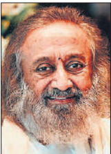
गुरुदेव श्री श्री रवि शंकर

भारत में गुरु-शिष्य परंपरा से जुड़ी एक अनूठी अवधारणा है। गुरु हमेशा शिष्य की सफलता की कामना करता है और शिष्य गुरु की विजय की कामना करता है। यह शुभ संकेत है, क्योंकि यदि शिष्य को लगता है कि वह गुरु से अधिक जानता है, तो इसका अर्थ है कि उसकी शिक्षा रुक गई है और उसके अहंकार ने ज्ञान को नष्ट कर दिया है।