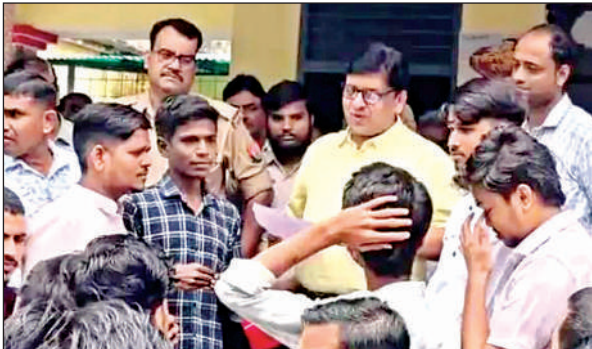
ज्ञापन सौंपते एबीवीपी के पदाधिकारी।