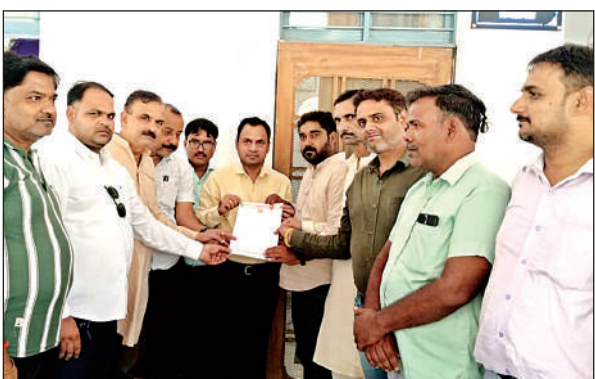
एसडीएम को ज्ञापन सौंपते भाजपा के पदाधिकारी व कार्यकर्ता।