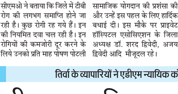
कलक्ट्रेट में एडीएम न्यायिक को ज्ञापन देते तिर्वा के व्यापारी ।