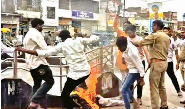
मंत्री का पुलता फूंकते एबीवीपी के कार्यकर्ता।

पुलिस प्रशासन द्वारा प्रदर्शनकारियों को पुतला जलाए जाने से रोका गया, लेकिन विद्यार्थी परिषद ने चकमा देकर कैबिनेट मंत्री का पुतला जला दिया। एसडीएम को सौंपे गए ज्ञापन में बताया कि यूनियनर्सिटी में बार कार्डसिल आफ इंडिया से मान्यता नवीनीकरण न