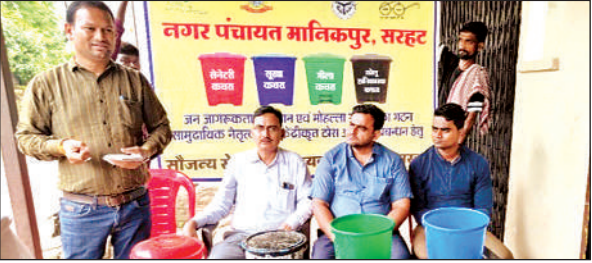
कचरे को अलग-अलग रखने की जानकारी देते नगर पंचायत के कर्मचारी।