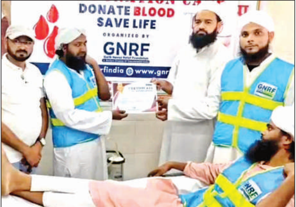
रक्तदान दौरान प्रमाण पत्र दिखाते रक्तदाता।

लोगों ने बिजली की आकर्षक सजावट की है। कई स्थानों पर बनाए गए मदीना मुनव्वरा, काबा