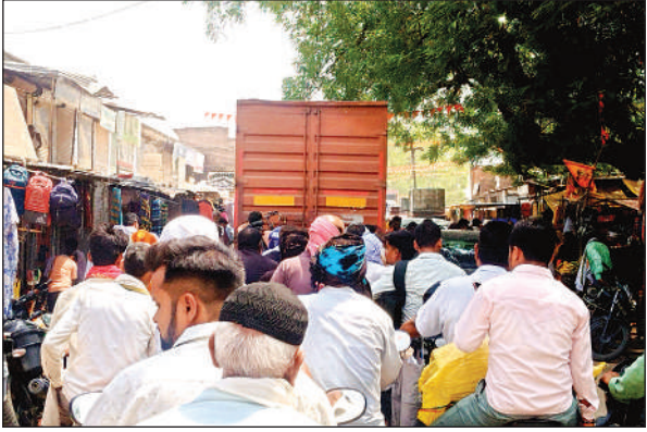
मुख्य चौराहे पर बाधित आवागमन।