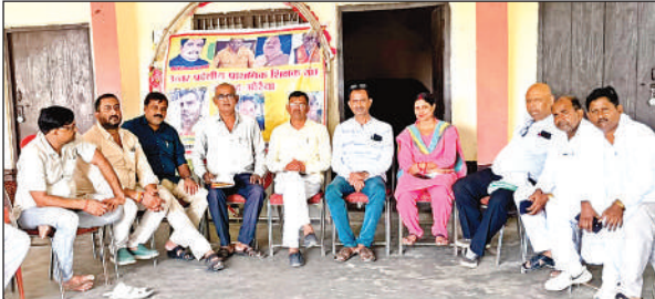
बैठक कर चर्चा करते पदाधिकारी।

जिसमें हाल में ही आए सुप्रीम कोर्ट के फैसले पर विस्तृत चर्चा हुई इसके लिए शिक्षक संघ प्रदेश कार्यसमिति द्वारा लिए गए निर्णय के अनुसार जो भी आंदोलन या अन्य कोई कार्य पूरे मनोयोग से इस मुद्दे की लड़ाई लड़ेगा। उत्तर प्रदेशीय प्राथमिक शिक्षक संघ ने 14 सूत्रीय मांगों के लिए 16 सितंबर से होने वाले धरना/क्रमिक अनशन के लिए सभी ब्लॉक अध्यक्ष/ब्लॉक मंत्री को निर्देशित किया गया कि वो सभी अपने अपने ब्लॉकों से भारी संख्या में शिक्षकों के साथ जिला मुख्यालय में होने वाले धरने में प्रतिभाग करें। संगठन की 2025 की सदस्यता शुरू हो गई है सभी ब्लॉक अध्यक्ष/ब्लॉक मंत्री सदस्यता करके 30 सितम्बर तक जिला पर जमा करें। उत्तर प्रदेशीय प्राथमिक शिक्षक संघ शिक्षकों की हर समस्या को हल कराने के हमेशा तत्पर रहता है, जो भी समस्या सामने आएंगी। उनका डटकर मिलकर मुकाबला किया