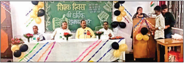
कार्यक्रम में मंचाशीन शिक्षकों के समक्ष भाषण देती छात्रा।

चेयरमैन ने राधा कृष्णन के विराट व्यक्तित्व पर प्रकाश डालते