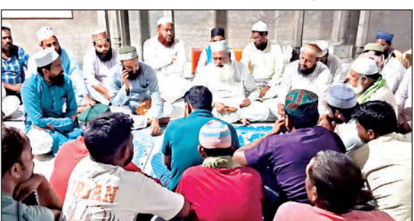
बैठक में मौजूद समुदाय के मौलाना व अन्य ।

उलेमाओं ने जुलूस में शामिल होने वालों के लिए 14 महत्वपूर्ण