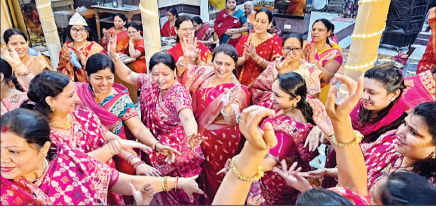
दशलक्षण पर्व धूप दशमी दिवस पर नृत्य करतीं जैन समाज की महिलाएं।