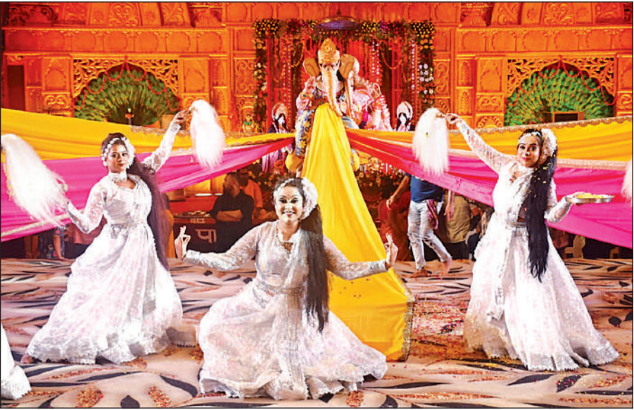
झूलेलाल वाटिका के गणेशोत्सव में सांस्कृतिक कार्यक्रम प्रस्तुत करती कलाकार।