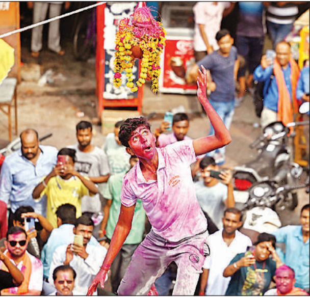
राम मनोहर लोहिया लॉन के गणेशोत्सव में मटकी फोड़ते युवक।