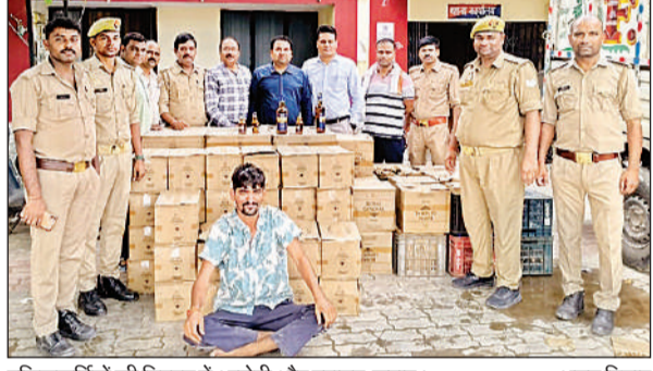
पुलिसकर्मियों की गिरफ्त में आरोपी और बरामद शराब ।