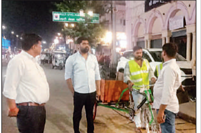
सफाई अभियान के दौरान जेडएसओ व सफाई कर्मचारी।