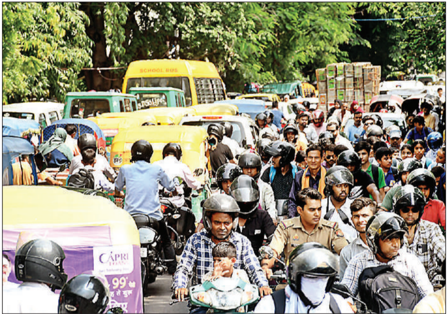
राजधानी में प्रतिदिन लोग कहीं न कहीं जाम की समस्या से जूझते हैं, मंगलवार को पार्क रोड पर जाम में फंसे वाहन चालक।