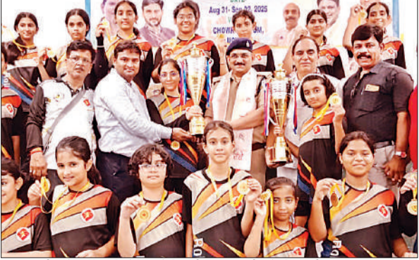
राज्य स्तरीय रोलबॉल प्रतियोगिता में विजयी लखनऊ टीम के खिलाड़ी।