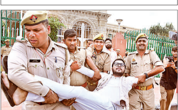
विधानभवन के समक्ष प्रदर्शन कर रहे छात्र को उठाकर ले जाते पुलिसकर्मी।