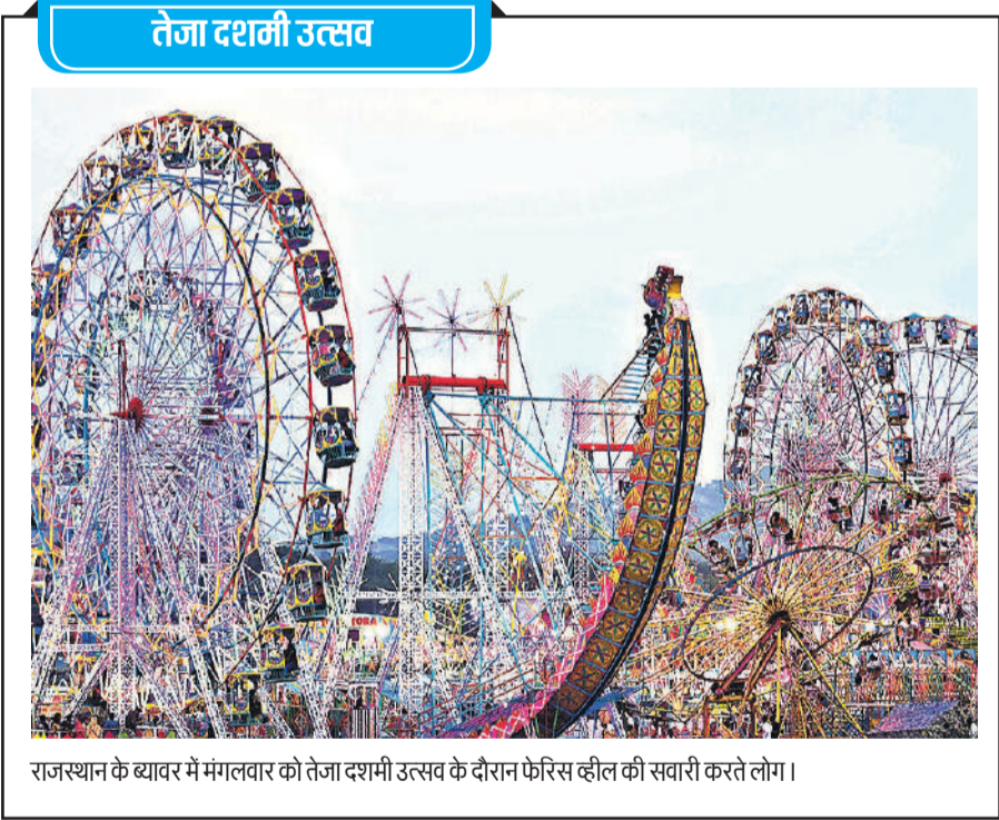
राजस्थान के ब्यावर में मंगलवार को तेजा दशमी उत्सव के दौरान फेरिस व्हील की सवारी करते लोग।

नई दिल्ली । हथिनीकुंड, वजीराबाद और ओखला बैराज से छोड़े गए पानी ने नदी को और विकराल रूप दे दिया है। यमुना पार के इलाकों में रात भर हुई बारिश के बाद घरों में पानी घुस गया। बाढ़ की वजह से अपने घरों को छोड़ने को मजबूर लोग यथासभव अपने सामान लेकर सुरक्षित स्थानों पर जा रहे हैं क्योंकि नदी का जलस्तर लगातार बढ़ रहा है, और अपने पीछे अनिश्चितता का एक निशान छोड़ रहा है।