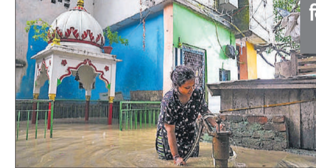
दिल्ली के बाढ़ प्रभावित इलाके में हैंडपंप से पीने का पानी भरती एक युवती।

शिमला । हिमाचल प्रदेश में मंगलवार को भारी बारिश के कारण भूस्खलन और अचानक आई बाढ़ से एक मकान ढह गया, जिससे दो महिलाओं की मौत हो गयी जबकि चार राष्ट्रीय राजमार्गों समेत 1,३11 सड़कों पर यातायात बंद कर दिया गया। अधिकारियों ने यह जानकारी दी। स्थानीय मौसम विभाग ने बुधवार के लिए कांगड़ा, मंडी, सिरमौर और किन्नौर जिलों के अलग-अलग इलाकों में अत्यधिक भारी बारिश की चेतावनी देते हुए ‘अंरिज अलर्ट’ जारी किया जबकि ऊना व बिलासपुर जिलों में भारी बारिश का ‘येलो अलर्ट’ जारी किया गया। इस बीच मुख्यमंत्री सुखविंदर सिंह सुक्खू ने कहा कि राज्य को आपदा प्रभावित घोषित कर दिया गया है।