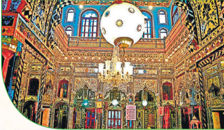
प्रस्तुति: मनोज त्रिपाठी

कानपुर के कमला टावर क्षेत्र में माहेश्वरी मोहाल में स्थित कांच का मंदिर स्थानीय के साथ बाहरी पर्यटकों के लिए आकर्षण का बड़ा केंद्र है। श्री धर्मनाथ स्वामी जैन श्वेतांबर मंदिर के नाम से जाना और पहचाना जाने वाला यह दर्शनीय स्थल 155 वर्ष पुराना होने के साथ जैन धर्म का प्रमुख केंद्र है। कांच से बने इस मंदिर को जो भी देखता है, मुग्ध सा रह जाता है। इस मंदिर में कांच की बेजोड़ कारीगरी अकल्पित है। मंदिर में 15 वें तीर्थंकर धर्मनाथ स्वामी और सातवें तीर्थंकर सुपार्श्वनाथ भगवान की प्रतिमाएं स्थापित हैं। इस मंदिर को कानपुर की ऐतिहासिक, धार्मिक और पौराणिक धरोहर का दर्जा प्राप्त है।