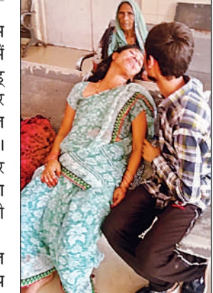
जिला अस्पताल में बहववास मां-बेटा।