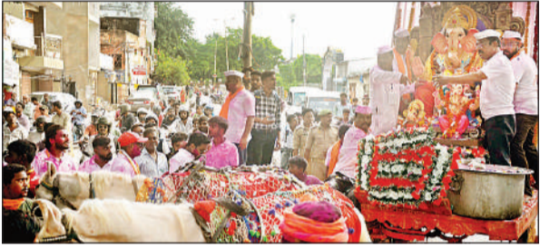
विसर्जन यात्रा में रथ पर सवार गणेशजी की मूर्ति।