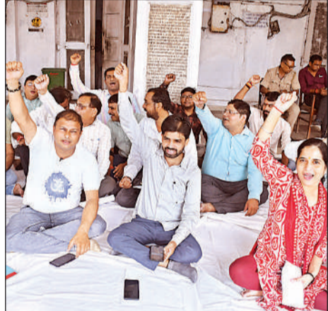
धरने पर बैठे नगर निगम के नायब तहसीलदार व लेखपाल।