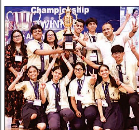
ओवरऑल चैंपियन टीम प्रसन्नचित मुद्रा में।

प्रशिक्षण प्रदाताओं को मिशन पोर्टल पर शुरू किए गए नए प्रशिक्षण कार्यक्रमों की विस्तृत जानकारी दी गई। निदेशक ने बताया कि प्रदेश सरकार के निर्देशानुसार अब सभी प्रशिक्षण बैचों का लाइव टेलीकास्ट किया जाएगा। जिससे प्रशिक्षण की पारदर्शिता सुनिश्चित होगी, गुणवत्ता में सुधार आएगा।