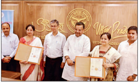
एमओयू के दौरान मौजूद अधिकारी।

अमृत विचार, लखनऊ : सरकारी जमीन से अतिक्रमण हटाने गए नायब तहसीलदार व लेखपाल के खिलाफ क्रॉस एफआईआर के विरोध में संपत्ति विभाग के अधिकारियों और कर्मचारियों का धरना मंगलवार को दूसरे दिन भी जारी रहा। लालबाग स्थित नगर निगम मुख्यालय परिसर पर प्रदर्शन के दौरान उनका कहना था कि जब तक एफआईआर निरस्त नहीं की जाती है तब तक आर-पार की लड़ाई की जाएगी। कर्मचारियों ने सुशांत गोल्फ सिटी थाने द्वारा एफआईआर वापस लेने, डीसीपी दक्षिणी, एसीपी गोसाईगंज व थानाध्यक्ष सुशांत गोल्फ सिटी का स्थानांतरण करने और भीड़ों में अतिक्रमण हटवाते समय पुलिस प्रशासन द्वारा नगर निगम टीम व राजस्व टीम को पूर्ण सुरक्षा प्रदान किए जाने की मांग की।