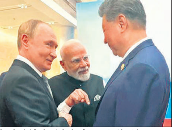
तियानजिन में मोदी, पुतिन और जिनपिंग की मुलाकात से अमेरिका में है हलचल।

नवारो की यह टिप्पणी सोमवार को तियानजिन में एससीओ शिखर सम्मेलन से इतर तीनों नेताओं द्वारा घनिष्ठता प्रदर्शित किए जाने के बाद आई है। मोदी, शी और पुतिन के बीच ‘एकजुटता के प्रदर्शन’ के बारे में पूछे जाने पर नवारो ने व्हाइट हाउस में पत्रकारों से कहा, यह चिंताजनक है, बहुत चिंताजनक है। इसका कोई मतलब नहीं है। टैरिफ पर ट्रंप की नीतियों के कारण वाशिंगटन और नई दिल्ली के बीच रिश्तों में गिरावट आने के बाद नवारो कुछ दिनों से लगातार भारत को निशाना बना रहे हैं। नवारो ने कहा, समझ नहीं आता कि मोदी के मन में क्या है, खासकर तब जब भारत पिछले कई दशकों से चीन के साथ कभी शीत युद्ध तो कभी सीधे संघर्ष की स्थिति में रहा है। उन्होंने कहा, भारत को हमारे साथ काम करना चाहिए। भारत को लगता है कि वो हमारे साथ जैसा चाहे ऐसा कर सकता है लेकिन ट्रंप ऐसा होने नहीं देंगे।