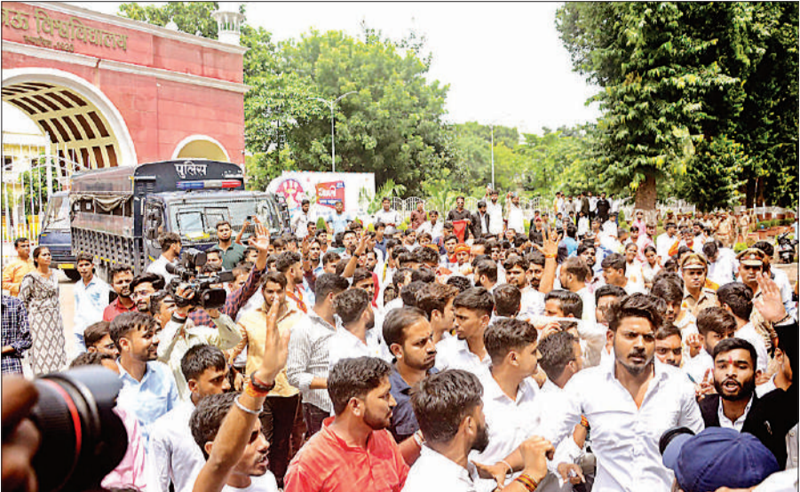
लखनऊ विश्वविद्यालय के गेट पर प्रदर्शन करते आक्रोशित छात्र।