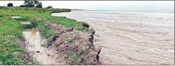
बाढ़ प्रभावित क्षेत्र में कटान करती घाघरा।