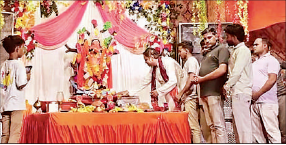
देवारा कलां में बप्पा की आरती करते किसान नेता ।

अमृत विचार । 27 अगस्त से शुरू हुआ गणेश महोत्सव अब अपने अंतिम पड़ाव पर पहुंच चुका है । नगर में रविवार को धूमधाम के बीच गणेश प्रतिमाओं के विसर्जन का सिलसिला शुरू हुआ । सुबह से ही विभिन्न समितियों एवं मोहल्लों में स्थापित प्रतिमाओं को शोभायात्रा के रूप में गगनीखेड़ा झील की ओर ले जाया गया । जगह-जगह गणपति बप्पा मोरया... के जयकारे गूंजते रहे ।