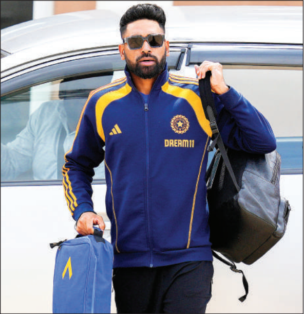
एशिया कप की तैयारी: क्रिकेटर मोहम्मद सिराज रविवार को बेंगलुरु स्थित बीसीसीआई सेंटर ऑफ एक्सीलेंस ग्राउंड पर पहुंचे।

कि टीम की जिम्मेदारी उठाने का क्या मतलब होता है। मोदी ने घरेलू क्रिकेट के प्रति पुजारा की प्रतिबद्धता की भी सराहना की। उन्होंने कहा खेल के प्रति आपका जुनून इस बात से भी झलकता है कि एक अंतरराष्ट्रीय क्रिकेटर होने के बावजूद आपने प्रथम श्रेणी क्रिकेट खेलना जरूरी समझा, चाहे वह सौराष्ट्र के लिए हो या विदेश में। प्रधानमंत्री ने आगे कहा सौराष्ट्र क्रिकेट के साथ आपका लंबा जुड़ाव और राजकोट को क्रिकेट के नक्शे पर लाने में आपका योगदान इस क्षेत्र के हर युवा के लिए अपार गर्व का स्रोत रहेगा।