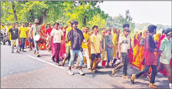
मूर्ति विसर्जन के दौरान गाजे-बाजे के साथ निकलते श्रद्धालु।