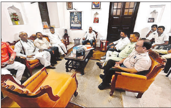
कार्यकर्ताओं के साथ प्रधानमंत्री की मन की बात सुनते राज्यमंत्री।