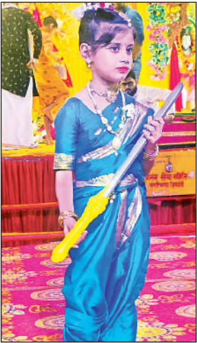
आकर्षक वेश में सजे कलाकार।