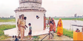
जांच करती पुलिस