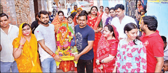
श्री गणेश की प्रतिमा विसर्जित करने जाते भक्त ।

महोत्सव, चंपापुरवा और अन्य स्थानों पर भी भव्य महाआरती हुई । गायत्री नगर श्री गणेश नवयुवक सेवा समिति द्वारा गणेश प्रतिमा को महाभोग अर्पित कर आरती की गई । वहीं पोनी रोड, सहजनी चौराहा, मिश्रा कॉलोनी, बिंदा नगर समेत कई स्थानों पर कथा और