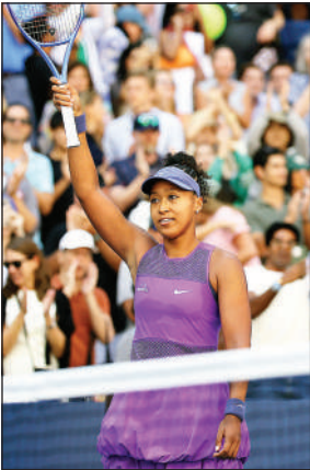
नाओमी ओसाका।

कोको गॉफ और नाओमी ओसाका ने शनिवार को जीत के साथ अमेरिकी ओपन टेनिस टूर्नामेंट के महिला एकल के चौथे दौर में प्रवेश किया जहां उनका आमना सामना होगा। इन दोनों पूर्व चैंपियन के बीच इससे पहले अमेरिकी ओपन में 2019 में मुकाबला हुआ था। ओसाका तब मौजूदा चैंपियन थी और उन्होंने 15 साल की गॉफ को सीधे सेटों में हरा दिया था। गॉफ इस हार के बाद अपने आंसू नहीं रोक पाई थी और ओसाका ने उन्हें संत्वना दी थी। ओसाका ने शनिवार को कहा मैं उसे एक छोटी बहन की तरह मानती हूँ, इसलिए यहां उसके साथ दोबारा खेलना अच्छा है। ओसाका 2021 में ऑस्ट्रेलियाई ओपन के बाद पहली बार किसी ग्रैंड स्लैम टूर्नामेंट