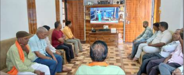
मन की बात कार्यक्रम देखते भाजपा के पदाधिकारी और सदस्य।

भक्ति भाव के साथ विसर्जित हुए ‘गणपति बप्पा’ : गणपति महोत्सव के तहत श्रद्धा व उल्लास के साथ भगवान श्री गणेश प्रतिमा