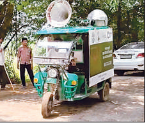
ग्रामीणों को जागरूक करता वन विभाग का वाहन।