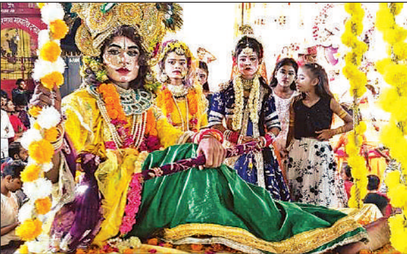
मनमोहक झांकी प्रस्तुत करते कलाकार।