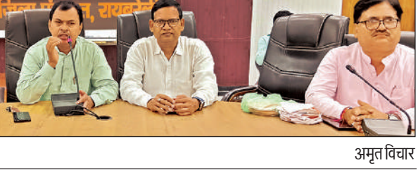
बैठक के दौरान मौजूद पदाधिकारी।