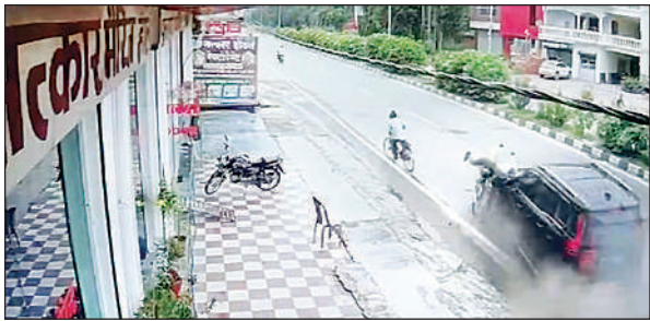
लखनऊ रोड पर डिडौली के पास स्थित एक रेस्टोरेंट के सामने साइकिल सवार को टक्कर मारता स्कॉर्पियो चालक।