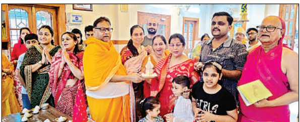
दिगम्बर जैन मंदिर में पूजा-अर्चना करते श्रद्धालु।