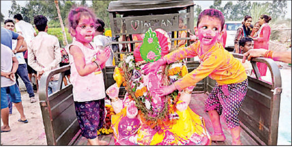
गगनी खेड़ा झील में विसर्जन के दौरान गजानन को अबीर गुलाल लगाता बच्चा ।