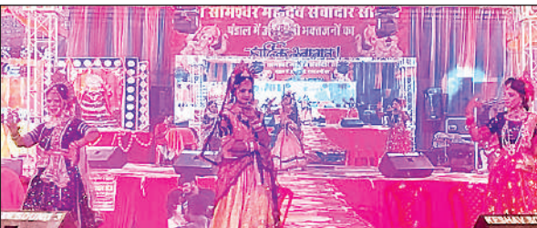
बाबा के दरबार में नृत्य करते कलाकार।

किया कि ट्रैफिक पुलिस को बिना कागजात जांचे चालान नहीं काटना चाहिए। उन्होंने कहा कि अगर ऐसा होता है, तो वे खुद ई-रिक्शा चालकों के हक की लड़ाई लड़ेंगे। ट्रैफिक इन्स्पेक्टर इंद्रेश कुमार ने बताया कि बिना वजह किसी का चालान नहीं किया जाता। उन्होंने कहा कि कुछ ई-रिक्शा चालक सड़क के बीच में गाड़ियों खड़ी कर जाम लगाते हैं। उन्होंने सभी चालकों से आग्रह किया कि वे लाइसेंस और आवश्यक कागजात रखें तथा नियमों का पालन करें। नगर पालिका अध्यक्ष ने ई-रिक्शा चालकों की सलाह दी कि वे अपने सभी कागजात दुरुस्त रखें और नियमों का पालन करते हुए वाहन चलाएं।