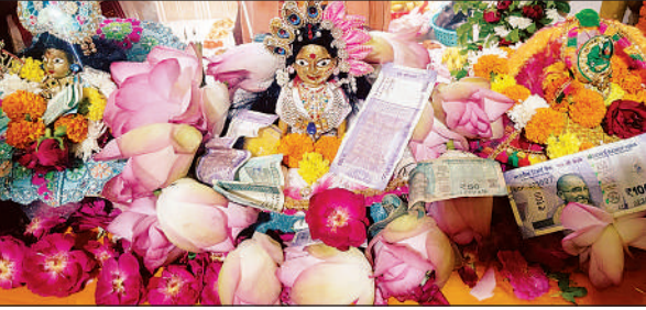
प्राकट्योत्सव के दौरान सजी प्रतिमा।

ट्रैप कैमरे, थर्मल ड्रोन और खेतों में मचान लगाकर बाघ को पकड़ने में सक्षम हैं। केवल पगचिढ़ों और खून के धब्बों के सहारे विभाग सुराग तलाश रहा है। इस धीमी कार्यशैली को लेकर ग्रामीणों में आक्रोश है।