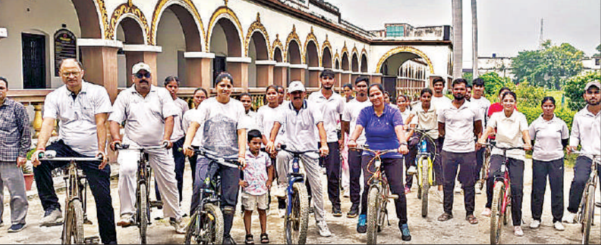
आरआरपीजी कॉलेज द्वारा निकाली गई साइकिल रैली।