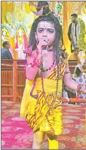
कार्यक्रम में झांकी पेश करते कलाकार।