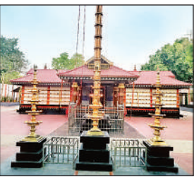
लखनऊ का अयप्पा मंदिर।

दिलचस्पी न दिखाने वाला वहां का वामदल ‘अयप्पा संगमम’ कराने जा रहा है। हालांकि दिलचस्प यह होगा कि इधर उत्तर प्रदेश के मुख्यमंत्री योगी आदित्यनाथ राजधानी लखनऊ में ही सबरीमाला मंदिर की तर्ज पर स्थापित अयप्पा मंदिर से हिंदुत्व की अलख जगा देंगे।