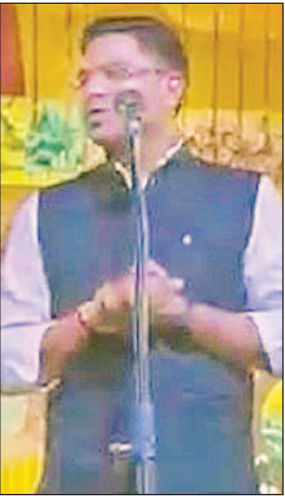
भजन प्रस्तुत करते गायक। अमृत विचार