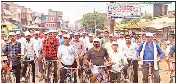
साइकिल यात्रा में शामिल लोग।

अमृत विचार। महान हॉकी जादूगर मेजर ध्यानचंद की 120वीं जयंती के अवसर पर नगरपालिका संडीला द्वारा रविवार को साइकिल यात्रा का भव्य आयोजन किया गया। यह यात्रा प्रातः आठ बजे नगर पालिका कार्यालय से शुरू होकर इम्लियाबाग चौराहा तक निकाली गई। कार्यक्रम का उद्देश्य आमजन में स्वास्थ्य के प्रति जागरूकता बढ़ाना था। साइकिल यात्रा में नपा के अधिकारी व कर्मचारी शामिल हुए। यात्रा के दौरान प्रतिभागियों ने लोगों से नियमित व्यायाम और स्वस्थ जीवनशैली अपनाने की अपील की। नगर पालिका अधिकारियों ने बताया कि इस प्रकार के आयोजन