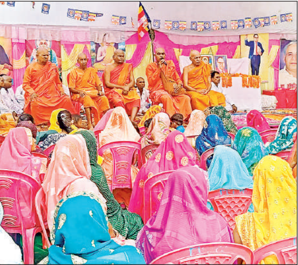
आयोजित कार्यक्रम में मौजूद लोग।