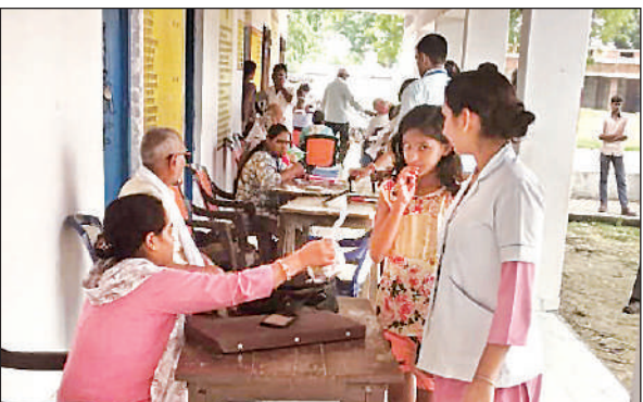
नीबी गांव में आयोजित निःशुल्क नेत्र चिकित्सा शिविर में मौजूद चिकित्सक व अन्य।

है। आंखों से ही पूरे संसार को देखा जा सकता है। उन्होंने इसके लिए आयोजकों को बधाई दी व कहा कि वे हर शिविर में आने का प्रयास करेंगे ताकि गरीबों के होसलों में इजाफा होता रहे। इस अवसर पर