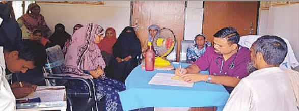
चिकित्सीय परीक्षण कर परामर्श देते चिकित्सक।