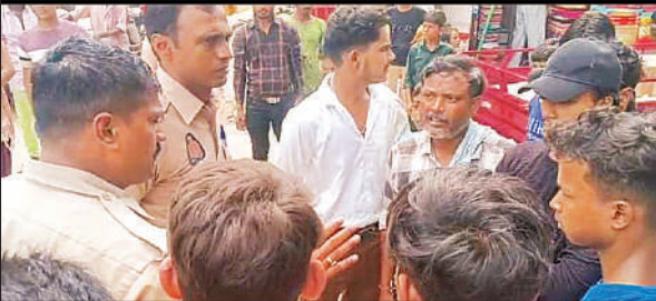
प्रदर्शन के दौरान ई-रिक्शा चालकों को समझाती पुलिस।

उसके ही निजी संपति के मामले में एकतरफा कार्यवाही के लिए तैयार है, जबकि अधिकांश इस तरह के मामलों में अदालत की शरण में जाने को सलाह देता है। उसने कहा कि यदि उसको न्याय नहीं मिला तो प्रशासन के खिलाफ प्रदर्शन करने को मजबूर होंगे।