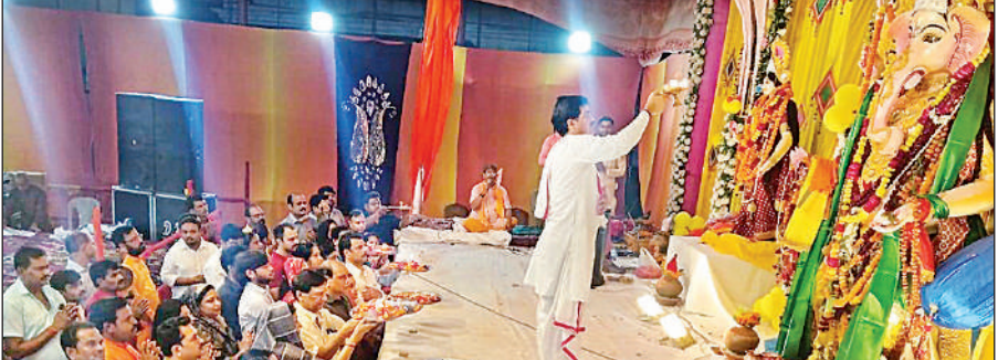
गाणेश जी की आरती करते लोग।