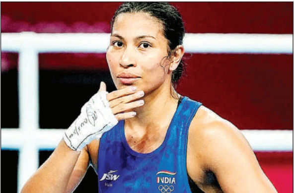
भारतीय मुक्केबाज लवलीना बोरगोहेन।

लवलीना बोरगोहेन ने अपनी अकादमी पर ध्यान केंद्रित करने के लिए मुक्केबाजी से संन्यास लेने पर विचार किया था, लेकिन पेरिस ओलंपिक खेलों में पदक से चूकने के बाद उन्होंने यह फैसला टाल दिया। असम की यह मुक्केबाज आगामी विश्व चैंपियनशिप से अंतराष्ट्रीय स्तर पर वापसी करने के लिए तैयार है और उनका लक्ष्य ओलंपिक में दूसरा पदक जीतना है। टोक्यो ओलंपिक की कांस्य पदक विजेता लवलीना पिछले साल अगस्त में पेरिस ओलंपिक खेलों के बाद से अंतराष्ट्रीय प्रतियोगिताओं से दूर हैं। रिंग से दूर रहने के दौरान उन्होंने अपनी अकादमी स्थापित करने पर ध्यान केंद्रित किया, जिसका उद्घाटन जून में गुवाहाटी में हुआ।