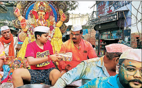
गणेश विसर्जन यात्रा के साथ भक्तगण।