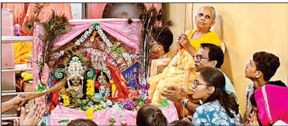
पोनी रोड राधा कृष्ण मंदिर में राधा अष्टमी पर गुणगान करते भक्त ।