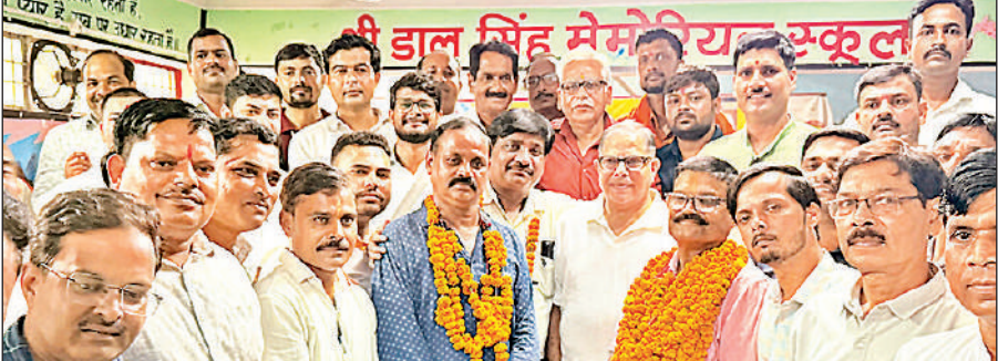
सदस्यों के साथ नवनियुक्त पदाधिकारी।

फतेहपुर चौरासी, उन्नाव। थानाक्षेत्र के एक गांव निवासी पिता ने दर्ज कराई रिपोर्ट में बताया कि शनिवार को वह खेत से घर पहुंचा तो घर पर उसकी बेटी मौजूद नहीं थी। उसने काफी देर तक आसपास के लोगों से जानकारी की और नात रिश्तेदारी में भी बेटी की जानकारी की। लेकिन उसका कोई सुराग नहीं लगा। उसने अज्ञात के खिलाफ बेटी को बहला फुसलाकर भगा ले जाने की रिपोर्ट दर्ज कराई है।