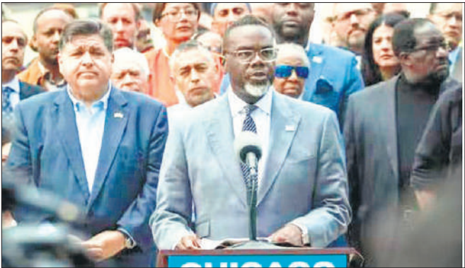
ट्रंप के फैसले के खिलाफ प्रेस कॉन्फ्रेंस करते शिकागो के मेयर ब्रैंडन जॉनसन।

बताया जा रहा है कि ट्रंप प्रशासन अमेरिका के तीसरे सबसे बड़े शहर में कुछ ही दिनों में संघीय अधिकारियों को भेज सकता है। मेयर ब्रैंडन जॉनसन के एक शासकीय आदेश के अनुसार, शिकागो पुलिस तलाशी अभियान, वाहनों की जांच जैसी आव्रजन से जुड़ी कार्रवाई में संघीय अधिकारियों की मदद नहीं करेगी। संघीय सरकार द्वारा ‘नेशनल गार्ड’ की तैनाती किए जाने की अटकलों के बीच मेयर ने शहर के सभी विभागों को निदेश दिया है कि वे शिकागो के लोगों