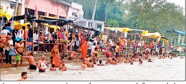
गोकना गंगा घाट पर स्नान करते श्रद्धालु और तट पर भगवान सूर्य की पूजा करते लोग।

अमृत विचार। रविवार को दक्षिण वाहिनी मां गंगा तट, महर्षि गोकर्ण एवं राजा भागीरथ की तपोस्थली गोकर्ण तीर्थ गोकना घाट पर श्री राधाअष्टमी एवम् महा रविवार दिवस पर भारी संख्या में श्रद्धालुओं ने गंगा स्नान कर सूर्य भगवान को अर्घ्य दिया। मां गंगा गोकर्ण जन कल्याण सेवा समिति एवं जिला गंगा समिति के तत्वाधान में श्री राधा अष्टमी एवं श्री सूर्यनारायण भगवान महारविवार की दिवस के शुभ अवसर पर भगवान सूर्यनारायण को अर्घ्य देकर उनकी आरती पूजा कर लोक कल्याण की कामना की गई।