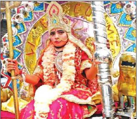
विसर्जन यात्रा में शामिल झांकी।