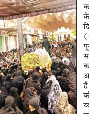
जुलूस निकालते अजादार। इमामबाड़े पर संपन्न हुआ। रास्ते भर अंजुमनों ने नौहा-मातम किया और मौलाना-ए-किराम ने तकरीर करते हुए लोगों तक इमाम हुसैन का पैगाम पहुंचाया। बता दें कि 8 रबीउल अव्वल

अमृत विचार : क्षेत्र के भनौली गांव में सोमवार को 8 रबीउल अव्वल के मौके पर परंपरागत अमारी का जुलूस बड़े ही अकीदत और गमगीन माहौल में निकाला गया। हर साल की तरह इस बार भी जुलूस का आयोजन अंजुमन सिपाहें हुसैनी भनौली सादात के तत्वावधान में हुआ, जिसमें हजारों अजादारों ने शिरकत करते हुए बीबी फातेमा को उनके लाल का पुरसा दिया। सुबह करीब आठ बजे जुलूस जामा मस्जिद इमामबाग से बरामद होकर इसौली रोड, दरगाहें आलिया और छोटे इमामबाड़े से होता हुआ बड़े