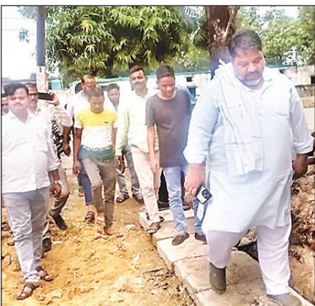
निर्माण कार्य का जायजा लेते नगर पालिका अध्यक्ष।