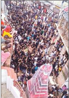
महमूदाबाद कस्बे में ताजिया निकालते अजादार।