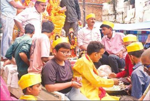
गणेश प्रतिमा को विसर्जन के लिए ले जाते भक्त।