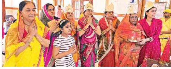
जैन मंदिर में पूजा-अर्चना करते श्रद्धालु।