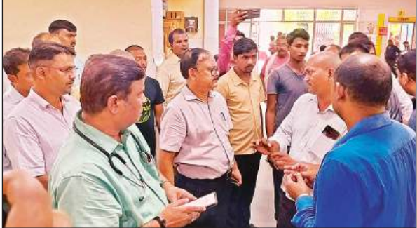
निरीक्षण के दौरान सीएमओ ने सीधे मरीजों से जानकारी लेते। अमृत विचार