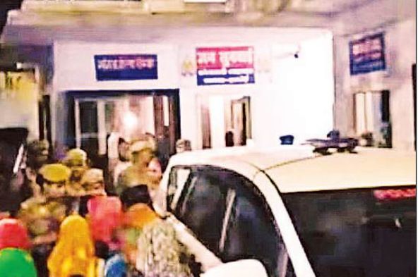
भीड़ ने घेर ली पुलिस अधीक्षक की गाड़ी।