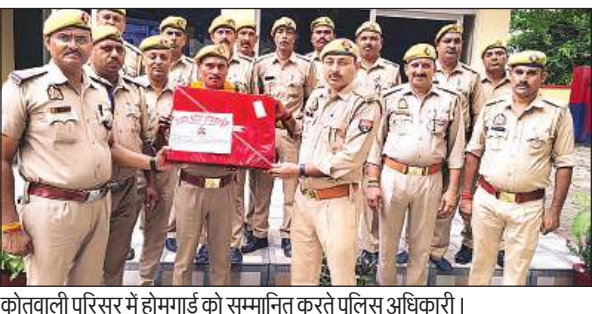
कोतवाली परिसर में होमगार्ड को सम्मानित करते पुलिस अधिकारी।