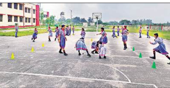
पीएम श्री केंद्रीय विद्यालय में आयोजित प्रतियोगिता में शामिल बच्चे।