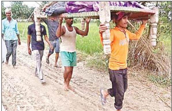
गृहस्थी सिर पर ढोकर सुरक्षित स्थान की ओर ले जाते ग्रामीण।