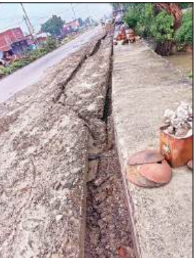
रायबरेली-अयोध्या हाईवे के किनारे बारिश से धंसी सड़क।

क्योंकि बरसात से एक तरफ जहां आम जनजीवन अस्त व्यस्त हो गया। वहीं दूसरी तरफ कच्चे