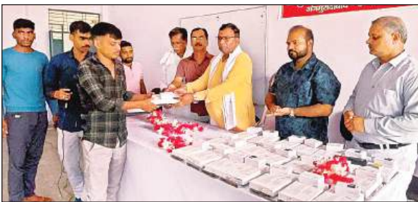
छात्र को टैबलेट देते विधायक।

550 वोट सिर्फ 18 मकान नम्बरों से कैसे दर्ज हो गए। उन्होंने कहा कि इसी भाग संख्या में मतदाता सूची के अनुसार 261 मकान नम्बर पर 34 वोट दर्ज हैं जिनमें हिन्दू मुस्लिम अन्य जाति के वोटर शामिल हैं जबकि मकान नम्बर 262 से भी 20 वोट दर्ज हैं जिनमें हिन्दू मुस्लिम वोटर शामिल हैं। उन्होंने कहा कि इसकी जांच कराई जानी चाहिए।