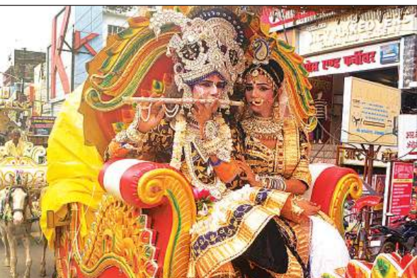
शोभायात्रा के दौरान निकाली गयी झांकियां।