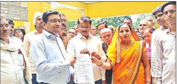
एसडीएम को ज्ञापन सौंपते मानव उत्थान सेवा समिति के लोग।