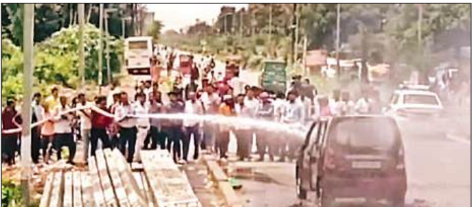
कार में लगी आग बुझाते फेक्ट्री के श्रमिक।