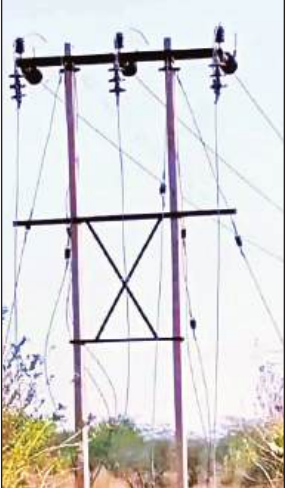
आकाशीय बिजली गिरने से खराब हुई विद्युत लाइन।