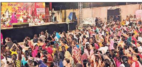
साकेतपुरी गणेश पंडाल में उमड़ी भक्तों की भीड़।