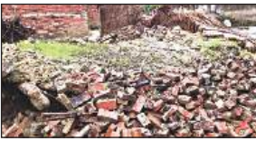
बारिश से टूक गांव में गिरा घर।

उन्होंने कहा कि मेजर ध्यानचंद हॉकी के जादूगर थे, जिनसे हमें अनुशासन, मेहनत और फिटनेस की प्रेरणा लेनी चाहिए। इस दौरान सुबकभी एवं कैरम की प्रतियोगिताएं कराई गईं। सुबकभी प्रतियोगिता जूनियर वर्ग में बालिका वर्ग से