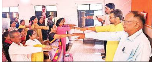
विद्यालय में शपथ लेते छात्र-छात्राएं व शिक्षक।