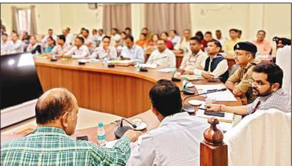
बैठक में अधिकारियों को निर्देशित करते जिलाधिकारी गौरांग राठी।

अमृत विचार। उप्र अधीनस्थ सेवा चयन आयोग लखनऊ द्वारा 6 व 7 सितम्बर को जिले में होने वाली प्रारम्भिक अर्हता परीक्षा (पीईटी)-2025 की लिखित परीक्षा जनपद के 16 परीक्षा केंद्रों में होगी। जिसमें दो दिनों में 27168 परीक्षार्थी शामिल होंगे। परीक्षा सुकुशल सम्पन्न कराने के उद्देश्य से जिलाधिकारी गौरांग राठी ने विकास भवन सभागार में परीक्षा हेतु नामित जोनल, सेक्टर व स्टेटिक मजिस्ट्रेटों व केन्द्र व्यवस्थापकों के साथ बैठक की। इसमें जिलाधिकारी ने कहा कि परीक्षा के दिन सुरक्षा, विद्युत, पीने