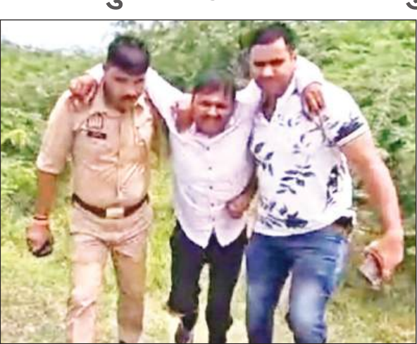
घायल को ले जाती पुलिस।