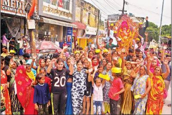
गणपति को विसर्जन के लिए ले जाते श्रद्धालु।

पाली संवाददाता के अनुसार नगर के मोहल्ला बिरहाना स्थित दुर्गा मंदिर परिसर पर श्री गणेश महोत्सव कई दिनों से चल रहा था। सोमवार को श्री गणेश विसर्जन यात्रा नगर के विभिन्न मोहल्ले में निकाली गई। शाम को विसर्जन यात्रा गरा नदी पर पहुंची, वहां पर