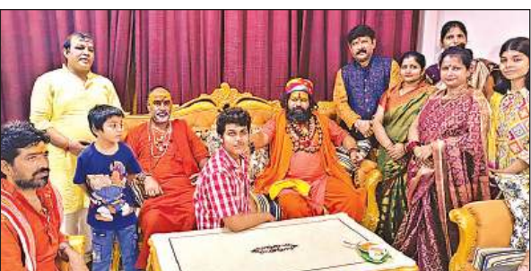
भातू फार्म में मौजूद महंत व अन्य।