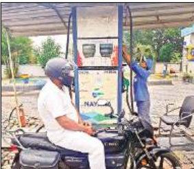
बाइक में पेट्रोल भरवाता युवक।

बीती रात हुई बरसात से स्थानीय चौराहे के पास करीब 200 मी हाईवे के किनारे बना नाला जमीन में ही धंस गया और हाईवे की इंटरलॉकिंग पटरी भी धंस गई जिसके चलते स्थानीय चौराहे के पास सड़क से गुजरना अब खतरे से खाली नहीं रह गया है। क्षेत्रीय लोगों ने सड़क धंसने की शिकायत जिम्मेदारों को दी लेकिन शाम तक कोई भी कर्मचारी धंसी हुई सड़क को देखने नहीं पहुंचा और ना ही मरम्मत का काम शुरू कराया गया। लोगों ने कहा कि सड़क के निर्माण में घटिया सामग्री का इस्तेमाल किया गया जिसके चलते दो साल में ही यह सड़क धंस गई है। इस संबंध में निदेशक एपी सिंह ने बताया कि उन्हें इसकी जानकारी नहीं है शिकायत मिलने पर मरम्मत कराई जाएगी।