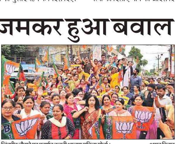
जिंदपीर चौराहे पर प्रदर्शन करती भाजपा महिला मोर्चा।

कार्यालय की ओर फेंकना शुरू कर दिया। कांग्रेसी भी उग्र होकर नारेबाजी करने लगे। पुलिस ने दोनों पक्षों को शांत कराया। कांग्रेसियों को कीचड़ आदि की मार से बचाने के लिए पुलिस ने तिरपाल लगाकर बचाव किया। बताते चले कि बिहार