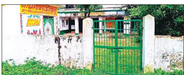
बंद हुआ महुआबोझी प्राथमिक विद्यालय।

अमृत विचार: प्राथमिक विद्यालय महुआबोझी का विलय कंपोजिट विद्यालय बसायकपुर गौरीगंज में कर दिया गया है। ग्रामीणों का कहना है कि दोनों विद्यालयों की दूरी लगभग दो किलोमीटर है, जो कि प्रदेश के शिक्षामंत्री के निर्देशों के विपरीत है। प्रदेश के शिक्षामंत्री ने साफ निर्देश दिए हैं कि जिन विद्यालयों की आपसी दूरी एक किलोमीटर से अधिक है, उनका स्वतंत्र संचालन होना चाहिए। लेकिन इसके बावजूद महुआबोझी विद्यालय का विलय बसायकपुर गौरीगंज के साथ कर दिया गया है। जिसका विरोध कई गांव के ग्रामीणों ने किया