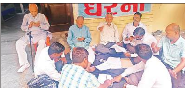
जिला विद्यालय निरीक्षक कार्यालय में धरना देते शिक्षक नेता।