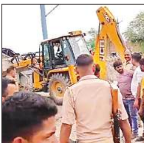
अतिक्रमण हटाता प्रशासन का बुलडोजर और मौके पर मौजूद ग्रामीण व पुलिस।