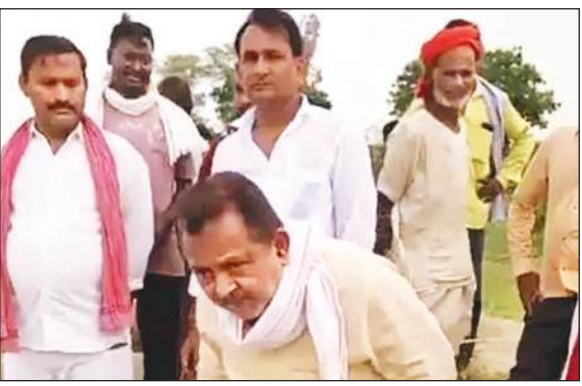
बाढ़ और कटान प्रभावित क्षेत्र में ग्रामीणों से संवाद करते पूर्व विधायक।