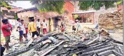
कच्ची कोठरी गिरने से बिखरा मलवा, मौजूद ग्रामीणों की भीड़।