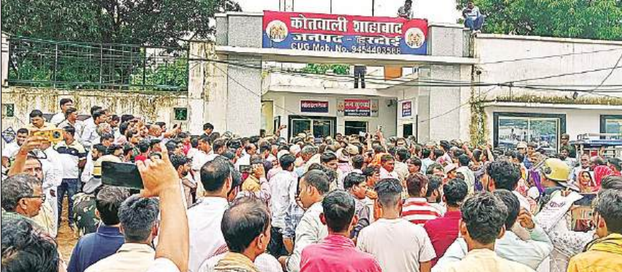
कोतवाली में प्रदर्शन करते ग्रामीण व परिजन।