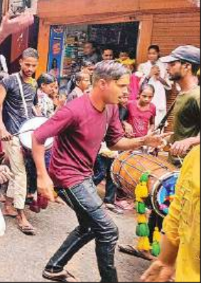
बेनीगंज में गणेश प्रतिमा विसर्जन के दौरान ढोल-नगाड़े बजाते भक्त।