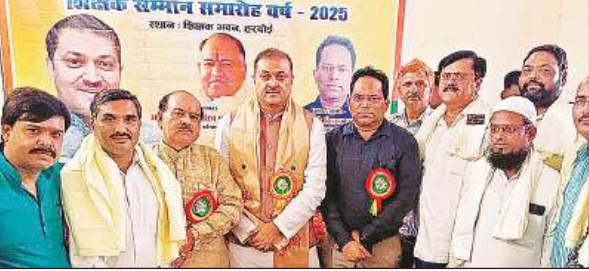
सम्मानित शिक्षकों के साथ एमएलसी।