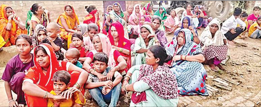
मृतक के घर के बाहर गमगीन बैठे परिजन।

शुक्लागंज, उन्नाव। रविवार देर रात आकाशीय बिजली कड़कने से आनंद घाट स्थित 400 केवीए ट्रांसफार्मर की एसटी उड़ गई। इसके चलते सीताराम कालोनी, मनोहर नगर, पुल बाजार और द्वारिका मोहिनी कपांडंड सहित तीन मोहल्लों के सैकड़ों घरों की बिजली आपूर्ति ठप हो गई। रात करीब सवा बारह बजे ट्रांसफार्मर फेल होने के बाद बिजलीकर्मियों मौके पर पहुंचे और मरम्मत की कोशिश की, लेकिन ट्रांसफार्मर तत्काल चालू नहीं हो सका। लगातार 11 घंटे बिजली गुल रहने से उपभोक्ताओं को उमस भरी रात में भारी परेशानी