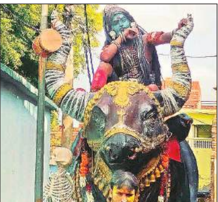
पाली में विसर्जन यात्रा के दौरान सजी झांकी।