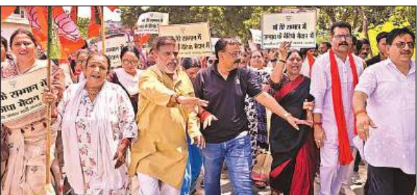
रैली में शामिल भाजपाई व महिलाएं।