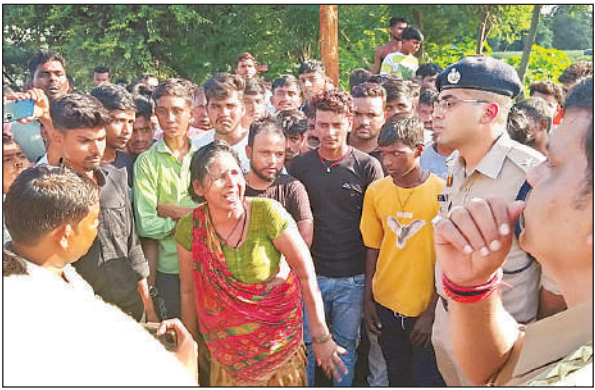
गुस्साए परिजनों और ग्रामीणों को समझाते सीओ सिटी।