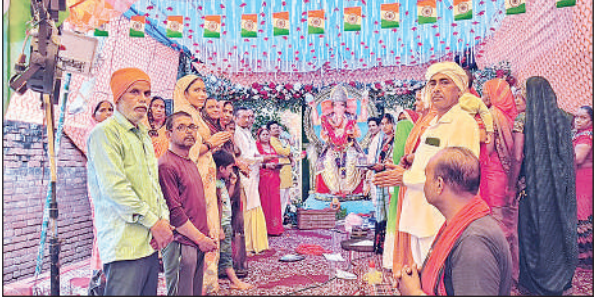
भातू फार्म गणेश पंडाल में गजानन की पूजा-अर्चना करते भक्त।