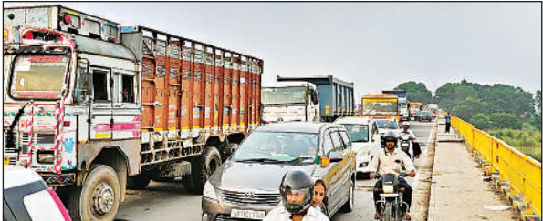
मरहला चौराहे पर जाम में फंसे वाहन सवार।