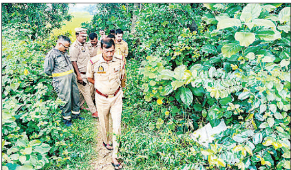
मौके पर जांच-पड़ताल करते देवा थाना प्रभारी।