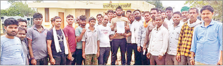
पावर हाउस पर मौजूद ग्रामीण दिखाते शिकायती पत्र।