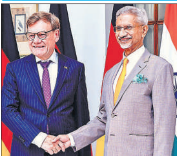
जर्मन समकक्ष वेडफुल के साथ विदेश मंत्री जयशंकर ।

आतंकवाद के मुद्दे पर हम भारत के साथ : वाडेफुल जर्मन विदेश मंत्री जोहान वाडेफुल ने कहा कि जहां तक आतंकवाद का मुद्दा है तो आत्मरक्षा से जुड़े इस मामले में जर्मनी दृढ़ता से भारत के पक्ष में खड़ा है। उन्होंने कहा कि अंतर्राष्ट्रीय नियमों पर आधारित व्यवस्था के मामले में भी जर्मनी, भारत और कई अन्य देशों से सहमत है।