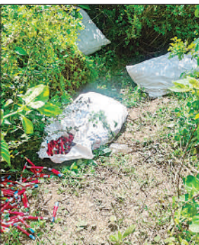
बोरियों में मिला विस्फोटक।