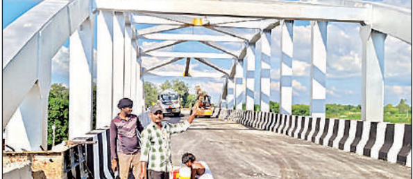
लालगंज बाईपास रेलवे पुल की पेंटिंग करते कंपनी के मजदूर।