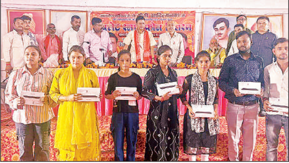
मुख्य अतिथि के साथ टैबलेट लिए छात्र-छात्राएं।।