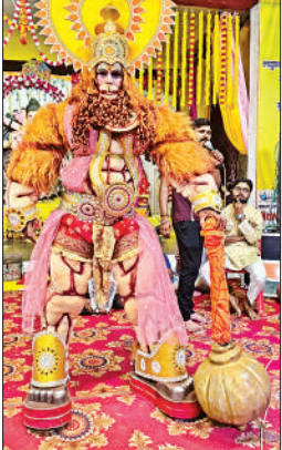
मूर्ति विसर्जन यात्रा में बाहुबली हनुमान जी की झांकी।