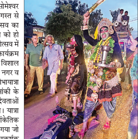
कछौना में 14वें भव्य श्री गणेश महोत्सव के समापन पर निकाली गई शोभायात्रा में झांकी प्रस्तुत करते कलाकार।

कछौना, हरदोई, अमृत विचार। श्री सोमेश्वर महादेव सेवादार समिति द्वारा 27 अगस्त से चल रहे 14वें भव्य श्री गणेश महोत्सव का विधिवत समापन मंगलवार की शाम को हो गया। लगातार सात दिनों तक चले महोत्सव में नगर का वातावरण भक्तिमय रहा। कार्यक्रम के अंतिम दिवस पूजा अर्चना के साथ विशाल शोभा यात्रा का आयोजन हुआ, जिसमें नगर व क्षेत्र के हजारों श्रद्धालु शामिल हुए। शोभायात्रा रेलवे स्टेशन बालामऊ से विशाल झांकी के साथ आरम्भ हुई। झांकियों में देवी देवताओं का जीवंत चित्रण प्रस्तुत किया गया। यात्रा में सजे विभिन्न वाहन जिस पर सांकेतिक देवी देवताओं को ससम्मान ले जाया गया जो आकर्षण का मुख्य केंद्र बिंदु रहे। आकर्षक झांकियों से सजी शोभायात्रा नगर के मुख्य मार्ग से होती हुई विसर्जन स्थल तक गई।