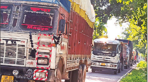
सड़क पर पेड़ गिरने से खड़े वाहन।