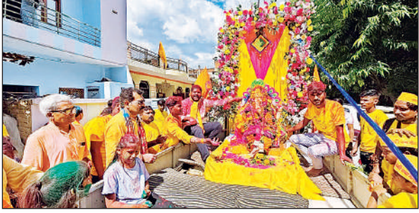
गजानन की निकाली जाती विसर्जन यात्रा।