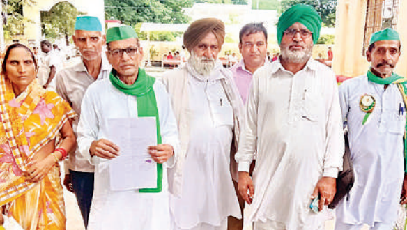
जिला प्रशासन को ज्ञापन देने आए भाकियू के पदाधिकारी।