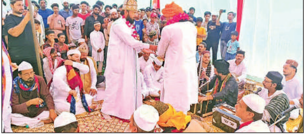
उर्स में शिरकत करते लोग।