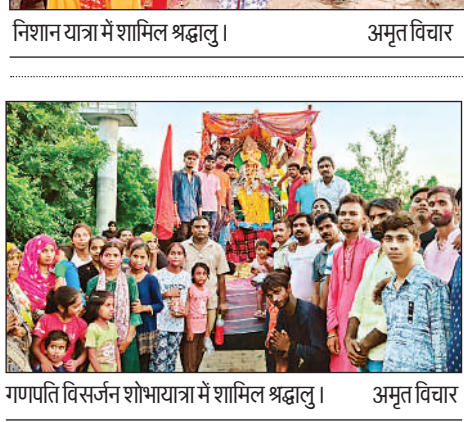
गणपति विसर्जन शोभायात्रा में शामिल श्रद्धालु।

ब्लॉक स्तरीय कविता पाठ प्रतियोगिता संपन्न :