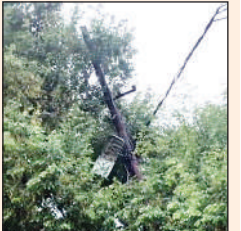
ऊंचाहार की पुरानी रेलवे क्रॉसिंग के पास केबल पर लटका पेड़।