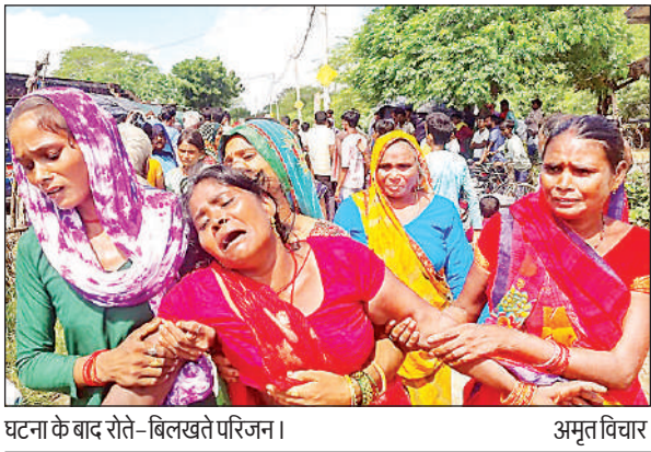
घटना के बाद रोते-बिलखते परिजन।