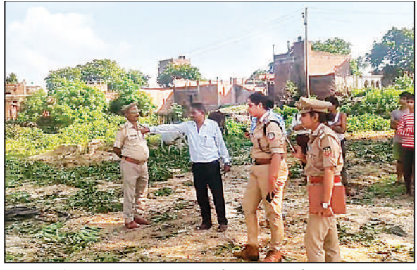
वन कर्मियों के साथ जांच-पड़ताल करने पहुंची वन क्षेत्राधिकारी।