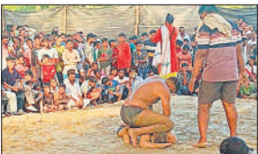
दंगल में दमखम दिखाते पहलवान।