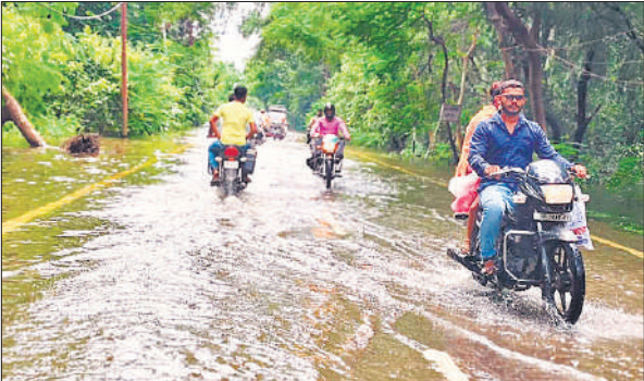
टनकपुर हाईवे पर सिविल लाइन चौकी के पास जलभराव से गुजरते राहगीर।

अमृत विचार : छह दिन से चला आ रहा बारिश का क्रम बुधवार को थम गया। मौसम साफ हुआ और सुबह से ही तेज धूप निकली। मगर, पहाड़ों पर हो रही मूसलाधार बारिश के बाद डैम से छोड़े गए पानी के पहुंचने से उफनाई देवहा नदी का कहर जारी रहा। नदी से सटे निचले इलाकों में बाढ़ ने जनजीवन पूरी तरह से प्रभावित कर दिया है। बाहरी क्षेत्र के कई मुख्य मार्गों पर जलभराव से आवागमन बाधित रहा। हालांकि शहर के अधिकांश इलाकों में हालात सामान्य हो गए। जिससे लोगों ने राहत महसूस की है। कुछ स्थानों पर जरूर अभी भी जलभराव की दिक्कत बनी हुई है। कुछ आंशिक असर जरूर पड़ा है। बता दें गुरुवार से लगातार रुक-रुक कर बारिश हो रही। जिसके बाद शहर की पॉश कॉलोनियां, सरकारी दफ्तर, स्कूल, गली मोहल्ले, मुख्य मार्ग हर तरफ पानी ही पानी भरा रहा। कुछ इलाकों में तीन-चार दिन तक जलभराव रहा और जनजीवन ठप पड़ गया। इसके बाद जनप्रतिनिधि, अधिकारी खुद उतरे और जलभराव की समस्या का समाधान कराया। जिसका असर