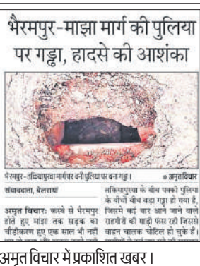
भैरमपुर-मांझा मार्ग की पुलिया पर गड्डा, हादसे की आशंका

● भैरमपुर-मांझा मार्ग पर गांव पर पुलिया पर था विशाल गड्डा थी, जबकि इस मार्ग पर करीब दो दर्जन गांवों के लोगों का आना-जाना रहता है। अमृत विचार ने दो सितंबर के अंक में इस समस्या को प्रमुखता से छापा था। खबर का असर यह हुआ कि पीडब्ल्यूडी विभाग ने बुधवार को गड्डे को ठीक करारक सड़क को दुरस्त कराया। इससे ग्रामीणों ने राहत महसूस की है।