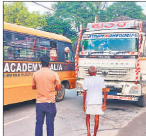
हादसे के बाद पलिया-निघासन हाईवे पर लगा जाम।

हादसे से बस में बैठी सवारियों में चीख पुकार मच गई। आधा घंटे पलिया-निघासन हाईवे पर जाम लगा रहा। इस दौरान दोनों चालकों ने नोकझोंक होती रही और भीड़ जमा हो गई, लेकिन पुलिस को इस हादसे की भनक