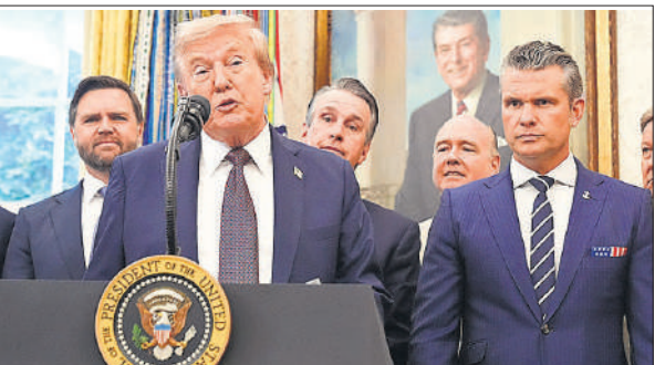
व्हाइट हाउस के ओवल ऑफिस में अपने सहयोगियों के साथ राष्ट्रपति डोनाल्ड ट्रंप।

ट्रंप ने मंगलवार को रेडियो शो ‘द स्कॉट जेनिंसग शो’ पर बातचीत में कहा, भारत हमारे खिलाफ टैरिफ लगाता है। चीन हमारे खिलाफ बहुत टैरिफ लगाता है। ब्राजील भी ऐसा करता है। उन्होंने कहा, भारत सबसे अधिक टैरिफ लगाने वाला देश रहा है लेकिन अब उन्होंने मुझे भारत में जीरो टैरिफ की पेशकश की है। ट्रंप ने पिछले महीने भारतीय उत्पादों के आयात पर 25 प्रतिशत टैरिफ और रूसी तेल की खरीद जारी रखने पर 25 प्रतिशत अतिरिक्त टैरिफ लगाने की घोषणा की थी। इस तरह 27 अगस्त से भारतीय उत्पादों पर अमेरिका में कुल 50 प्रतिशत टैरिफ लग रहा है। अमेरिकी राष्ट्रपति ने दावा किया कि उन्हें टैरिफ लगाने की प्रक्रिया और उसके प्रभाव को लेकर दुनिया में सबसे अच्छी समझ है। उन्होंने कहा, मैं टैरिफ को दुनिया के किसी भी दूसरे व्यक्ति से कहीं बेहतर