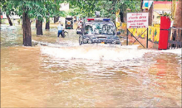
ऑफिसर्स कॉलोनी में कई फीट भरा पानी।

इधर, पहाड़ों पर हुई बारिश के बाद छोड़े गए पानी से देवहा नदी उफना चुकी है। जिससे सदर तहसील क्षेत्र चंदोई, पीलीभीत मुस्तकिल, पिपरा वाले, पिपरा भगु, गुटैहा, मीरापुर मुस्तकिल,