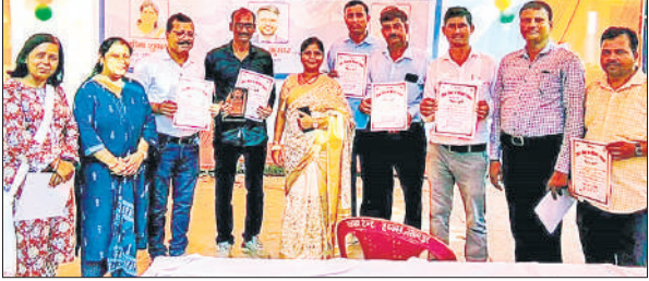
जनपद स्तर पर प्रथम स्थान प्राप्त करने वाले शिक्षक।