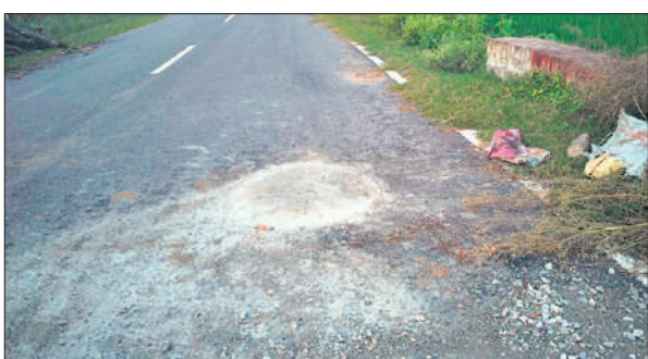
भैरमपुर-मांझा मार्ग पर पुलिया पर भरा गया गड्डा।

अमृत विचार: कस्बे से भैरमपुर-मांझा मार्ग पर स्थित पुलिया पर बने गड्डे की खबर प्रकाशित होने के बाद पीडब्ल्यूडी विभाग हरकत में आ गया। बुधवार को गड्डे को भरकर सड़क को दुरस्त कराया गया। इससे राहगीरों ने राहत की सांस महसूस की है। प्रधानमंत्री राष्ट्रीय ग्रामीण योजना के तहत बेलरायां से मांझा तक सड़क का चौड़ीकरण कार्य हुआ था। इस कार्य को हुए अभी साल भर भी पूरा नहीं हो पाया है। गांव तकियापुरवा और भैरमपुर के बीच स्थित पुलिया पर बड़ा गड्डा हो गया था। इस गड्डे में लोग वाहनों समेत फंसकर कई बार गिरकर चोटिल भी हो चुके हैं। ग्रामीणों की शिकायतों के बाद भी पीडब्ल्यूडी विभाग ने गड्डे की ठीक कर सड़क दुरस्त करने की जहमत नहीं उठाई