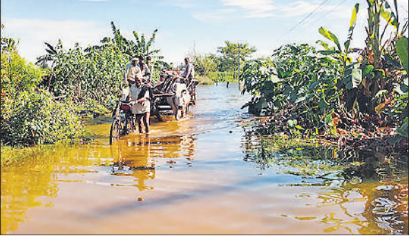
बैलगाड़ी से निकल कर आ रहे ढकीया गांव के ग्रामीण।