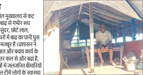
ट्राली पर तंबू तान कर बैठा गांव जीतपुरवा का बाढ़ पीड़ित