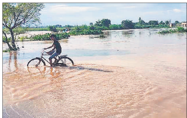
रपटा पुल पर जलभराव के बीच गुजरता साइकिल सवार।

बरेली के कस्बा नवाबगंज को जाने वाले मार्ग पर गासीपुर कुंडा गांव, देवहा नदी के पुल के बीच में स्थित रपटा पुल पर भी तीन फिट पानी चल रहा है। जिसके चलते बुधवार को आवागमन बंद रहा। हर तरफ पानी ही पानी दिखा। अन्य कई इलाकों में भी बाढ़ का पानी घुस गया।