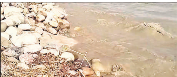
कलीनगर तहसील के गोरख डिब्बी क्षेत्र में बने स्पर का कटान करती शारदा नदी।

का जलस्तर बढ़ने से बूंदीभूड़, नौजल्हा नकटहा, महाराजपुर और बंरबोख गांव बाढ़ की चपेट में आ गए थे। वहीं पूरनपुर तहसील क्षेत्र में चंदिया हजाय, शास्त्रीनगर, भरतपुर, चंद्रनगर और सिद्धनगर में बाढ़ का पानी जा घुसा था। बाढ़ के पानी से गांव को घिरता देख तमाम लोग सुरक्षित स्थानों की ओर पलायन कर गए थे, जबकि कुछ घरों की छतों पर तिरपाल डालकर रह रहे थे। बुधवार