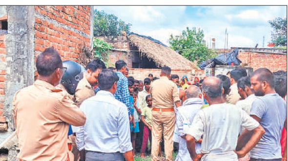
मृतक महिला के घर पर परिजनों को समझाती पुलिस।