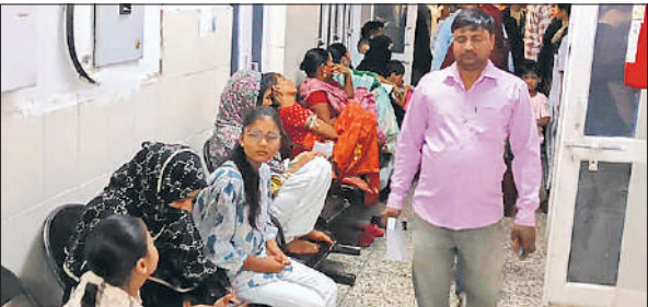
ओपीडी में डॉक्टर के कक्ष के बाहर बारी का इंतजार करते मरीज।

जनपद में पिछले छह दिन से जारी बारिश के चलते मोहल्लों और कॉलोनियों में पानी भर गया था। अब पानी घटने के बाद भी बेनी चौधरी, डालचंद, चंदोई और नावकुंड जैसे इलाकों में जलभराव की स्थिति बनी हुई है। ऐसे हालात में संक्रमण