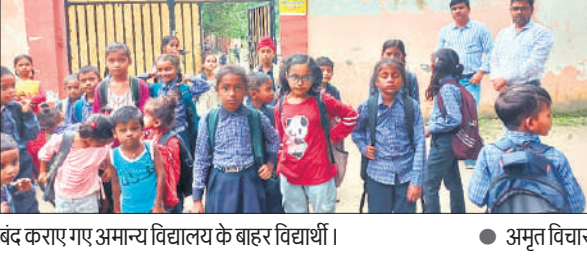
बंद कराए गए अमान्य विद्यालय के बाहर विद्यार्थी।