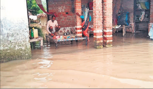
लोनियाना गांव में घरों में भरा पानी।

अमृत विचार: शारदा नदी का उफान लगातार कहर बरपा रहा है। गोला और पलिया तहसील के कई गांव जलमग्न हो चुके हैं। ढकिया गांव के लोग बैलगाड़ियों और ट्रैक्टरों से सुरक्षित जगहों की ओर निकलने को मजबूर हैं। वहीं बड़ेझा