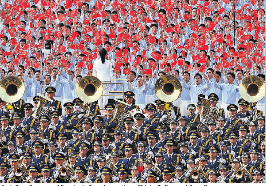
चीन के विजय दिवस पर आयोजित परेड मेंमहिला और पुरुष सैन्य कर्मियों ने सम्मिलित रूप से हिस्सा लिया।

जलालाबाद। संयुक्त राष्ट्र ने पूर्वी अफगानिस्तान में आए भूकंप में हताहतों की संख्या में और वृद्धि की चेतावनी दी है। वहीं, तालिबान प्रशासन ने कहा कि भूकंप में मरने वालों की संख्या 1,400 से अधिक हो गई और 3,000 से ज्यादा लोग घायल हुए हैं। सरकार के प्रवक्ता जबीहुल्ला मुजाहिद ने जो आंकड़े दिए हैं, वे सिर्फ कुनार प्रांत के हैं। रविवार रात आए 6.0 तीव्रता के शक्तिशाली भूकंप ने कई प्रांतों को हिलाकर रख दिया, जिससे भारी तबाही हुई।