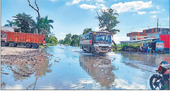
पलिया- भीरा रोड पर बह रहा बाढ़ का पानी।

अमृत विचार: शारदा नदी का पानी पलिया तहसील क्षेत्र के करीब 12 गांवों और शहर के कई मोहल्लों में घुस आया है। घरों, स्कूलों और रास्तों में पानी भरने से लोगों को खाना बनाना तो दूर खड़ा होने तक को सूखा स्थान नहीं मिल पा रहा है। मंगलवार देर शाम से भीरा रोड, नगला रोड और मेलाघाट रोड पर पानी बढ़ाना शुरू हो गया है। बुधवार दोपहर तक बाढ़ का पानी नगर के मोहल्ला ढाकिन, ईदगाह, चिकनी तलैया, चीनी मिल आवासीय परिसर और आसवनी