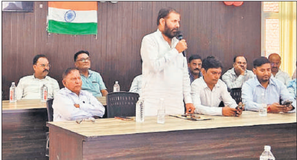
बोर्ड बैठक में अपनी बात रखते सभासद।

है। हम लोग गांधी वादी विचारधारा के हैं डरने वाले नहीं हैं। जब हम लोग अंग्रेजों से नहीं डरे उनको देश से खदेड़ दिया। सभी ने दोषियों के खिलाफ रिपोर्ट दर्ज कर गिरफ्तारी की मांग की।