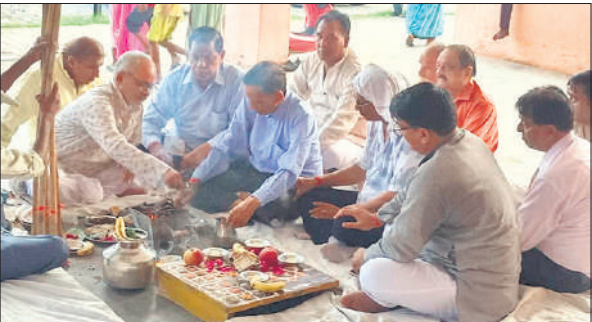
रामलीला मैदान पर पूजन में मौजूद समिति के सदस्य।

श्रीरामलीला मेला कमेटी के बैनर तले बुधवार को रामलीला मेला की झंडी शोभायात्रा बाजार कटरा से बैडबाजों के साथ धूमधाम से निकाली गई। जिसमें सबसे आगे श्रद्धालु पताका लेकर भगवान राम की जय-जयकार करते हुए चल रहे थे। झंडी शोभायात्रा मटिया नाथ चौराहा, रामविलास चौराहा, दुबे मोहल्ला, पानी की टंकी आदि प्रमुख स्थानों पर होती हुई मेला ग्राउंड पहुंचकर सम्पन्न हुई। बाद