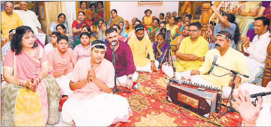
श्रीराधा रानी के भजन गाते राधा माधन संकीर्तन मंडल के सदस्य।