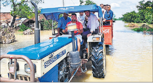
ट्रैक्टर से राहत सामग्री लेकर बाढ़ प्रभावित गांवों को जाते एसडीएम सदर।