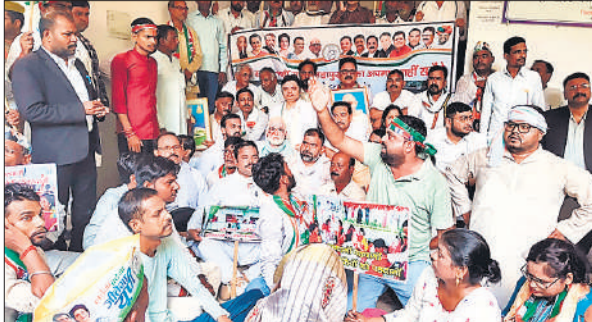
डीएम कार्यालय का घेराव कर प्रदर्शन करते कांग्रेसी।