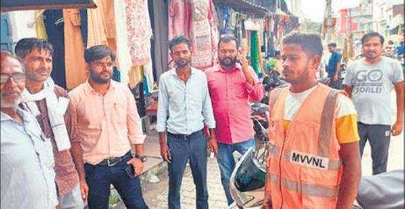
कस्बे में विद्युत कनेक्शन चेक करते बिजली विभाग कर्मचारी।

पूर्व में लाइन काटी गई थी वह बिना बकाया जमा किए। विद्युत लाइन चलती पाई गई। ऐसे उपभोक्ताओं के खिलाफ 138 बी के तहत कार्यवाही की जा रही है। उपभोक्ताओं का लोड बढ़ाया गया है व कुछ उपभोक्ताओं का लोड घटाया भी गया। उपखंड