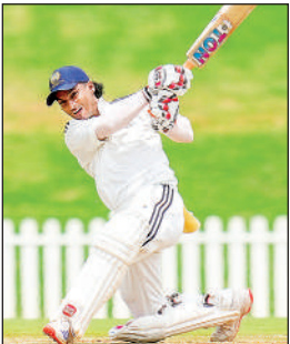
उत्तर क्षेत्र के आयुष बड़ोनी शतकीय पारी के दौरान शॉट लगाते हुए।