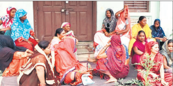
मालवीय आवास गृह पर धरना देतीं सफाई कर्मी महिलाएं।

रविवार को मालवीय आवास गृह पर धरना प्रदर्शन करते हुए सफाई कर्मियों ने कहा कि जिले की नगर पालिका व नगर पंचायतों में सफाई कर्मियों की जगह दूसरे लोगों को काम पर रखा जा रहा है। आउटसोर्सिंग के ठेका सफाई कर्मियों को साप्ताहिक अवकाश दिया जाए। उसका वेतन न काटा जाए। सफाई उपकरण मुहैया कराए जाएं। संविदा सफाई कर्मियों को ईपीएफ जमा किया जाए, वर्दी व सुरक्षा उपकरण दिखाए जाएं।