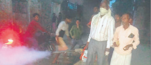
मचलाई गांव में फॉगिंग करता मलेरिया विभाग का कर्मचारी।