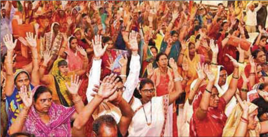
खिरनी बाग स्थित रामलीला मैदान में भरत मिलन प्रसंग का भावुक दृश्य सुनते श्रद्धालु।

भरत अयोध्यावासियों के साथ वन की ओर दौड़े और चित्रकूट पहुंचकर प्रभु श्रीराम से मिले। वह क्षण सम्पूर्ण रामायण का सबसे मार्मिक प्रसंग बन गया। भरत प्रभु के चरणों में लोट गए और निवेदन किया कि भैया अयोध्या आपके बिना सूनी है, लौट चलिए। यह राज्य आपका है। लेकिन प्रभु राम ने पिता दशरथ की आज्ञा और धर्म की मर्यादा को सर्वोपरि बताते हुए वनवास पूरा करने का संकल्प