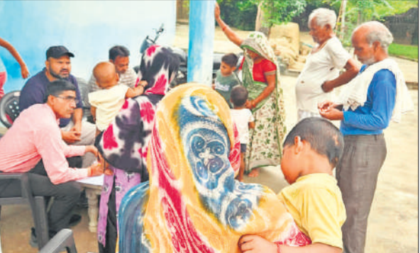
स्वास्थ्य शिविर में मरीजों को दवा देते डाक्टर।