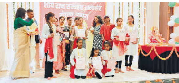
प्रशस्ति पत्र के साथ कलाकार।