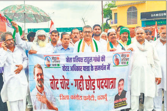
सहसवान में पदयात्रा निकालते कांग्रेस पदाधिकारी और कार्यकर्ता। ●अमृत विचार

कछला गंगा इस समय 162.46 सेमी पर है। इससे आगे हुसैनपुर बांध को भी खतरा पैदा हो गया है। बांध पर बाढ़ खंड पहरेदारी कर रहा है फिर भी खतरा बना हुआ है।