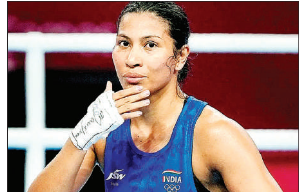
भारतीय मुक्केबाज लवलीना बोरगोहेन।

टोक्यो ओलंपिक की कांस्य पदक विजेता लवलीना पिछले साल अगस्त में पेरिस ओलंपिक खेलों के बाद से अंतराष्ट्रीय प्रतियोगिताओं से दूर हैं। रिंग से दूर रहने के दौरान उन्होंने अपनी अकादमी स्थापित करने पर ध्यान केंद्रित किया, जिसका उद्घाटन जून में गुवाहाटी में हुआ।