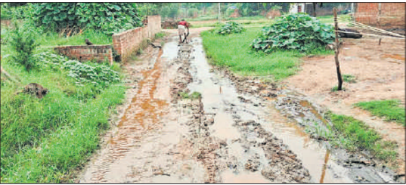
फरीदपुर में सड़कों पर भरा कीचड़।