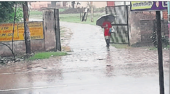
बारिश के बीच छाता लेकर जाती महिला।

पिछले कई दिनों से आसमान में बादल छाए हुए थे, लेकिन बरस नहीं रहे थे। मौसम विभाग का पूर्वानुमान भी फेल हो रहा था। रविवार को भी सुबह से आसमान में काले काले बादल छाए हुए