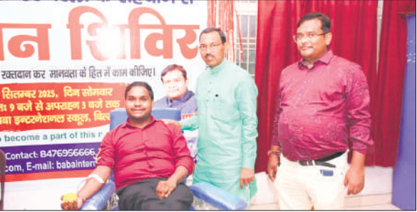
शिविर में रक्तदान करता युवक ।।