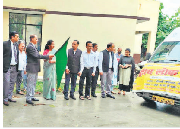
प्रचार वाहन को रवाना कराते न्यायिक अधिकारी।