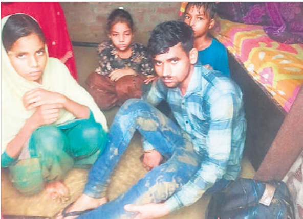
दीवार गिरने से घायल लोग।