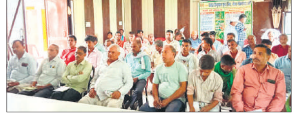
प्रशिक्षण में मौजूद किसान।