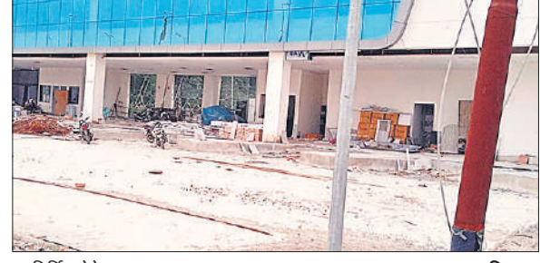
नवनिर्मित सेटेलाइट बस अड्डा।

● कार्यदायी संस्था को इस माह करना है हैंडओवर