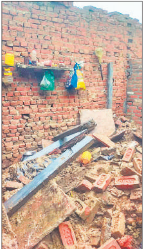
गांव समदनगर में गिरा मकान।