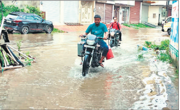
शहर की मधुवन कॉलोनी में भरे बरसात के पानी के बीच से निकलते बाइक सवार ।

अमृत विचार : पिछले सप्ताह भर से चल रहे गणेश महोत्सव का समापन हो गया। समापन पर भगवान गणेश की विधि विधान से पूजा की गई। साथ ही नाना प्रकार के व्यंजन से भोग लगाया गया। उनकी आरती उतारी गई। इसके बाद प्रसाद का वितरण किया गया। कथा समापन पर श्री कृष्ण लीला का वर्णन किया गया। साथ ही ब्रज के कलाकारों द्वारा सांस्कृतिक कार्यक्रम प्रस्तुत किए गए। मंगलवार को विसर्जन यात्रा निकाली जाएगी। इसके लिए प्रशासन की ओर से पहले ही तैयारी कर रखी है। यात्रा के साथ कछला गंगा घाट पर भारी संख्या पुलिस बल तैनात रहेगा।