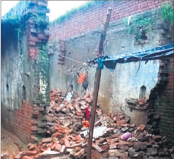
बारिश के दौरान छत गिरने से फैला मलबा।

सूचना पर प्रशासन ने जेसीबी मशीन मंगाकर पेड़ हटाने का कार्य शुरू कराया। लगभग एक घंटे की मशक्कत के बाद यातायात दोबारा बहाल हो सका।