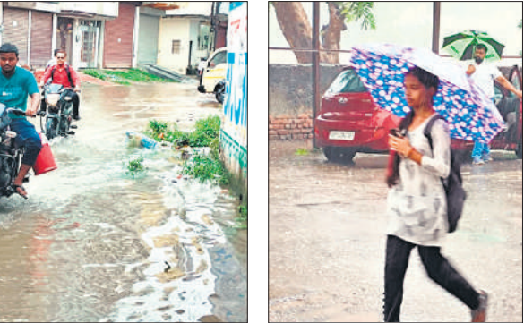
बारिश में छाता लेकर जाती महिला ।

बाजार आने जाने वाले लोगों को परेशानी हो रही है। बस स्टैंड और रेलवे स्टेशन पर यात्री पानी और कीचड़ के बीच निकलते दिखाई दिए। कृषि विभाग के अधिकारियों की मानें तो अगले 24 घंटे तक बारिश जारी रह रहेगी। अगर ऐसे ही बारिश जारी रही तो हालात और बिगड़ने की संभावना है। 24 घंटे से हो रही बारिश के कारण रोडवेज