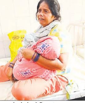
मृत बच्चे को गोद में लिए मां।