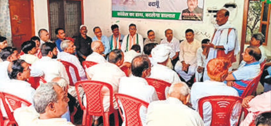
मासिक बैठक में पार्टी की नीतियों पर चर्चा करते कांग्रेस पदाधिकारी।

पर चलना, गरीबों की सहायता करना और आपस में मेलजोल बरकरार रखना ही ईद-ए-मिलादुन्नबी का असली जश्न है। धर्म गुरुओं के अनुसार पैगंबर हजरत मोहम्मद साहब 12 तारीख को पैदा हुए थे। उनके जन्म होने पर दुनिया नबी के नूर से जगमगा उठी। नबी जब दुनिया में तशरीफ लाए तो बच्चियों को रहमत बना दिया। पैगंबर हजरत हमेशा अमन का पैगाम देते