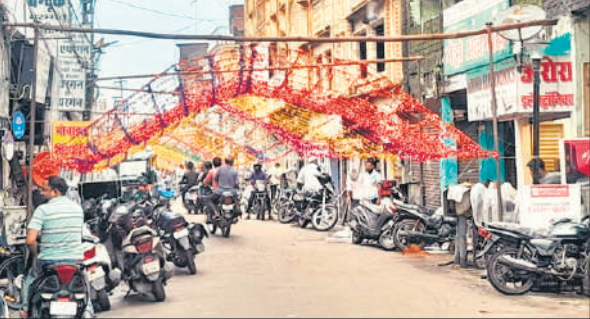
हजरत मोहम्मद साहब के जन्मदिन पर सजाया जा रहा छह सड़का बाजार।

इस्लाम धर्म के पैगंबर का जन्मदिन शुक्रवार को जनपद भर में मनाया जाएगा। हजरत मोहम्मद साहब के जन्मदिन को मनाने को लेकर मुस्लिम समाज के लोगों में उल्लास का माहौल है। उनके जन्मदिन पर शहर व ग्रामीण इलाकों में निकलने वाले जुलूस-ए-मोहम्मदी की झांकियां सजाई जा रही है। युवाओं के साथ ही छोटे बच्चों की टोलियां जुलूस में चार चांद लगाएंगी। शहर के