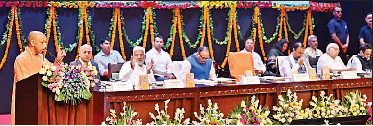
लोकभवन सभागार में आयोजित कार्यशाला को संबोधित करते मुख्यमंत्री योगी, मंच पर उपस्थित अन्य कैबिनेट मंत्री।

योगी ने यहां बजुर्गों को उत्साहित करते हुए कहा कि रिटायर्ड होने का मतलब टायर्ड होना नहीं है। आपका अनुभव इस अभियान को गति देगा। यह अभियान शताब्दी संकल्प अभियान के क्रम में है, जिसके लिए उत्तर प्रदेश सरकार निरंतर प्रयत्नशील है और इसमें 25 करोड़ जनता को भागीदार बनाना