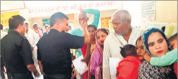
जिला अस्पताल में मरीजों की लाइन लगाते सुरक्षार्कर्मों।

अमृत विचार : डेंगू, मलेरिया और बुखार के मरीज निकलने शुरू हो गए हैं। जिला अस्पताल में बुखार पीड़ितों की लंबी लाइन लग रही है। मरीजों के बीच धक्का मुक्की होने पर सुरक्षा कर्मियों को बुलाना पड़ा। सुरक्षा कर्मियों ने मरीजों की लाइन लगावयी, और फिर दोपहर एक बजे तक 1428 मरीजों को दवा दी गई। बुधवार को सुबह आठ बजे से जिला अस्पताल में मरीज पहुंचने शुरू हो गये। मरीजों की संख्या अधिक होने के कारण पहले तो पर्चा काउंटर पर सैकड़ों महिला पुरुषों की लाइन लगी रही। पर्चा बनवाने के बाद मरीज ओपीडी के बाहर लाइन लगा कर खड़े हो गये। मरीजों की संख्या बढ़ने पर करीब 11 बजे अस्पताल के अंदर मरीजों के बीच धक्का मुक्की शुरू हो गयी। एक दूसरे को गाली गलौज करने लगे। जिससे हंगामा हो गया। शोर शराबा होने पर डॉक्टरों ने बाहर निकल कर सुरक्षा कर्मियों को बुलाया और मरीजों को लाइन में