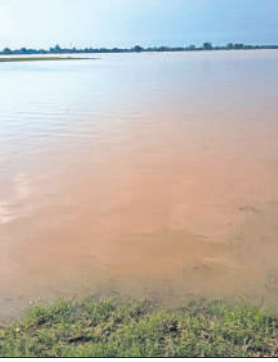
परौर के गांवों में घुसा बाढ़ का पानी।

यदि इसी तरह जलस्तर बढ़ता रहा तो आज रात तक कुण्डरी गांव का थरिया-परौर मार्ग से जुड़ा एकमात्र रास्ता भी डूब जाएगा, जिससे लोगों का आवागमन ठप पड़ सकता है। पिछली बाढ़ से पहले ही किसानों की सैकड़ों हेक्टेयर फसल बर्बाद हो चुकी है, अब पशुओं के चारे और पानी की संकट भी गहराने लगा है। गांवों में