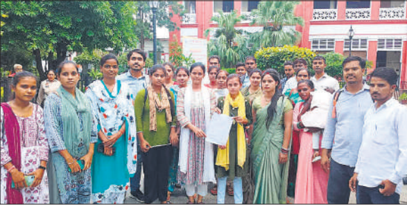
मांग को लेकर कलेक्ट्रेट पहुंचे पंचायत सहायक।