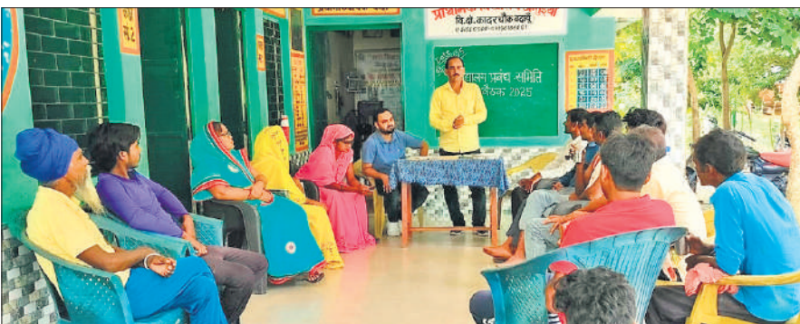
प्रबंध समिति की बैठक में मौजूद शिक्षक व अन्य।