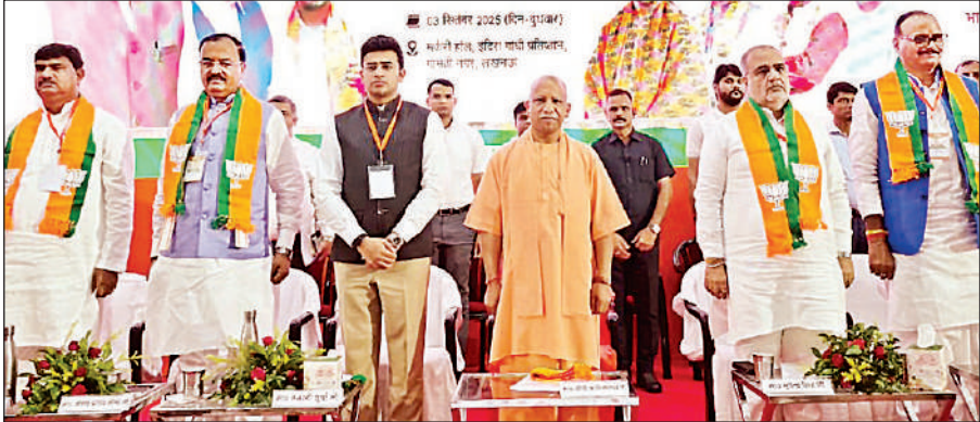
लखनऊ के इंदिरा गांधी प्रतिष्ठान में कार्यशाला के दौरान मुख्यमंत्री योगी, प्रदेश अध्यक्ष भूपेंद्र चौधरी व अन्य।

अमृत विचार: मुख्यमंत्री योगी आदित्यनाथ ने बुधवार को इंदिरा गांधी प्रतिष्ठान में सेवा पखवाड़ा अभियान कार्यशाला को संबोधित किया। मुख्यमंत्री ने एक तरफ पार्टी कार्यकर्ताओं की हौसलाअफजाई की, तो उनका मार्गदर्शन भी किया। मुख्यमंत्री ने सेवा पखवाड़ा अभियान (17 सितंबर से दो अक्टूबर) के तहत होने वाले कार्यक्रमों की चर्चा करते हुए अपील की कि दो अक्टूबर को विजयादशमी भी है। यह सभी कार्यक्रम भी अच्छे से हों और पर्व-त्योहार भी आसानी से मनाए जाएं। योगी ने सेवा पखवाड़े के आयोजन और उसकी महत्ता पर प्रकाश डाला। उन्होंने वोकल फॉर लोकल को