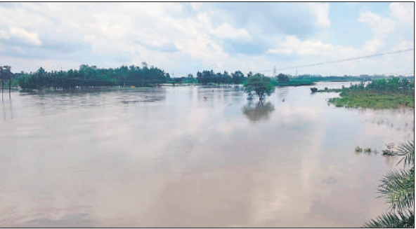
खेतों में भरा बाढ़ का पानी ●अमृत विचार