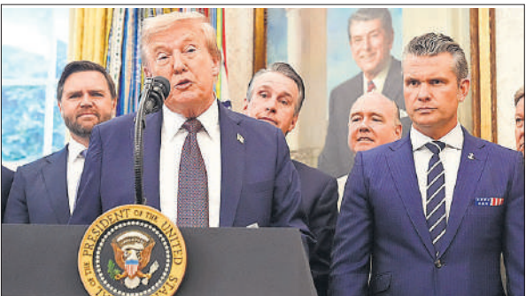
व्हाइट हाउस के ओवल ऑफिस में अपने सहयोगियों के साथ राष्ट्रपति डोनाल्ड ट्रंप।

ट्रंप ने मंगलवार को रेडियो शो ‘द स्कॉट जेनिंसग शो’ पर बातचीत में कहा, भारत हमारे खिलाफ टैरिफ लगाता है। चीन हमारे खिलाफ बहुत टैरिफ लगाता है। ब्राजील भी ऐसा करता है। उन्होंने कहा, भारत सबसे अधिक टैरिफ लगाने वाला देश रहा है लेकिन अब उन्होंने मुझे भारत में जीरो टैरिफ की पेशकश की है। ट्रंप ने पिछले महीने भारतीय उत्पादों के आयात पर 25 प्रतिशत टैरिफ और रूसी तेल की खरीद जारी रखने पर 25 प्रतिशत अतिरिक्त टैरिफ लगाने की घोषणा की थी। इस तरह 27 अगस्त से भारतीय उत्पादों पर अमेरिका में कुल 50 प्रतिशत टैरिफ लग रहा है। अमेरिकी राष्ट्रपति ने दावा किया कि उन्हें टैरिफ लगाने की प्रक्रिया और उसके प्रभाव को लेकर दुनिया में सबसे अच्छी समझ है। उन्होंने कहा, मैं टैरिफ को दुनिया के किसी भी दूसरे व्यक्ति से कहीं बेहतर