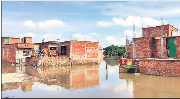
खन्जौत नदी का जलस्तर बढ़ने से लोदीपुर में निचले हिस्से में भरा पानी

अमृत विचार: पहाड़ों के साथ ही मैदानी क्षेत्रों में हो रही बारिश से जिले में बाढ़ जैसे हालात बनने लगे हैं। जनपद की गंगा, रामगंगा नदी के साथ साथ शहर से निकलने वाली गर्ग और खन्जौत नदी भी उफान मार रही है। जिस कारण नदी किनारे तटीय क्षेत्रों में बसे लोगों की रातों की नींदें गायब हो गई है। रात में लोग जगकर जलस्तर बढ़ने कम होने की रिपोर्ट पर नजर बनाएं हुए हैं। गर्ग व खन्जौत नदी जलस्तर बढ़ने से शहर के लोदीपुर, राईखेड़ा, सुभाषनगर समेत अन्य निचले इलाकों में बाढ़ की आशंका बनी हुई है। बुधवार को लोदीपुर क्षेत्र में खन्जौत नदी किनारे बसे लोगों के घरों तक पानी घुस गया है। जिसको लेकर स्थानीय प्रशासन व राजस्व टीम में लगी हुई है, लोगों से एडवाइजरी जारी करते हुए घरों से सुरक्षित स्थान पर जाने की अपील की जा रही है। जिला प्रशासन की ओर से कलान तहसील में तैनात एक एसडीआरएफ टीम को गर्ग व खन्जौत नदी जलस्तर बढ़ने के दृष्टिगत बुला लिया गया है। पांच मोटरबोट और मंगाई गई है, पहले से 15 नाव, मोटरबोट लगी हुई है। साथ ही साथ तहसील अधिकारियों द्वारा जेसीबी, ट्रैक्टर ट्रॉली मालिकों से संपर्क शुरू कर दिया गया है। जिससे कि आपदा की स्थिति में कोई दिक्कत न आए।