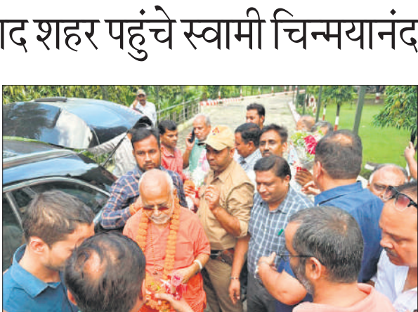
मुमुक्षु आश्रम में स्वागत के दौरान आशीर्वाद देते स्वामी चिन्मयानंद।