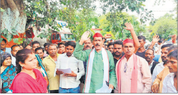
कलेक्ट्रेट में प्रदर्शन करते सपा पदाधिकारी।

सपा जिला अध्यक्ष ने कहा कि वार्ड 19 में लगातार जन समस्याओं का अंबार बढ़ रहा है। सभी लाइटें बंद हैं। गालियां जर्जर हैं, पुलिया टूटी पड़ी है और नगर निगम प्रशासन इस ओर ध्यान नहीं दे रहा। उन्होंने कहा कि पूरे महानगर में गंदगी का अंबार लगा है, मच्छरों का प्रकोप बढ़ रहा