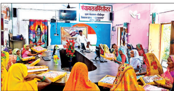
अंतरराष्ट्रीय वृद्ध दिवस पर बुजुर्गों का किया सम्मानित।