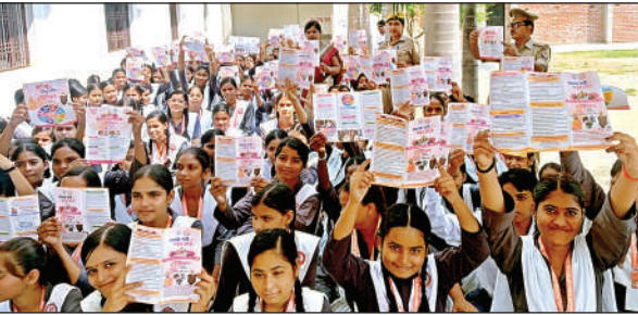
महाराणा प्रताप इंटर कॉलेज में कार्यक्रम के तहत पंपलेट दिखाती छात्राएं।

● प्रबंधक व प्रधानाचार्य की देखरेख में हुआ कार्यक्रम