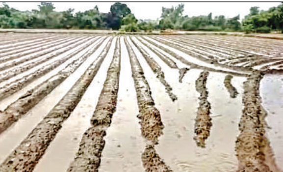
ठठिया क्षेत्र में आलू के खेत में भरा पानी।

अमृत विचार। दिन भर झमाझम बारिश हुई जिससे जनजीवन पूरी तरह से अस्तव्यस्त हो गया। सुबह से झड़ी लगी तो बीच बीच में कुछ देर के लिए पानी की रफ्तार धीमी होती लेकिन फिर से तेज हो जाती। इससे पूरे दिन ही सूर्य देव के दर्शन नहीं हुए। बरसात से जहां गर्मी से राहत मिल गई वहीं आलू की बुवाई करने वाले किसानों के लिए फायदा हो गया। हालांकि कुछ स्थानों पर धान की फसल गिरने से किसानों को नुकसान भी हुआ है। मंगलवार की सुबह नौ बजे छापे घने बादलों ने तेजी से बरसना शुरू हो कर दिया। इसके बाद करीब दो घंटे तक तेज बारिश हुई। इसके बाद कुछ थमकर फिर से बादल बरसने लगे। इसके बाद रुक रुककर आठ घंटे तक कभी तेज तो कभी धीमे बारिश होती रही। समाचार लिखे जाने तक भी बरसात हो रही है। बरसात के चलते बाजार भी जहां-तहां ही खुल सका। अधिकांशतया लोगों को घर में ही कैद हो जाना पड़ा। पिछले लंबे समय से पड़ रही उमस भरी गर्मी से राहत अवश्य