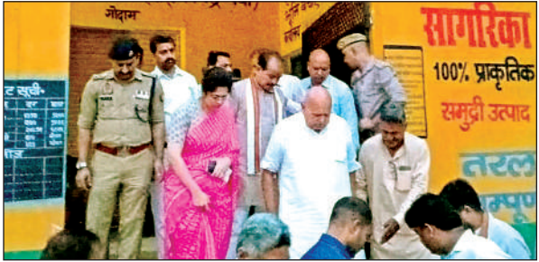
समिति का निरीक्षण कर निकलते प्रदेश के कृषि मंत्री सूर्य प्रताप शाही।

मंत्री ने सहकारी समिति के कृषकों को समय से समिति का बकाया जमा करने के लिए भी प्रेरित किया गया, इससे समिति के कार्य समय से पूर्ण होते रहें। किसानों की समस्याओं