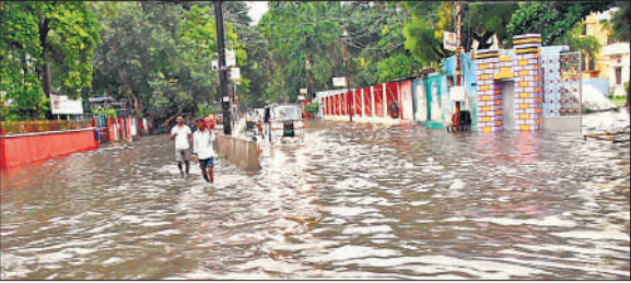
कानपुर के सर्वोदय नगर में बारिश से हुआ जलभराव ।