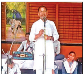
कार्यक्रम को संबोधित करते प्रधानाचार्य।