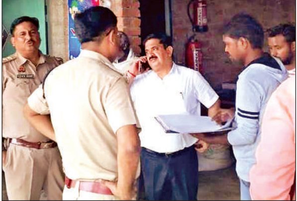
पटाखा निर्माण कारखाने का निरीक्षण करते एसडीएम व सीओ।