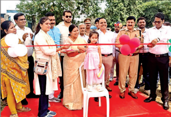
मेले का शुभारंभ करती सदर विधायक साथ में डीएम और एसएसपी