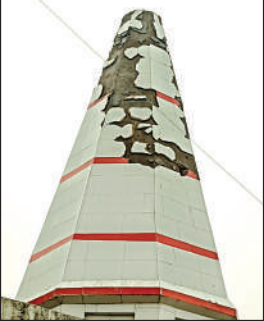
बिजली गिरने से क्षतिग्रस्त गुंबद ।