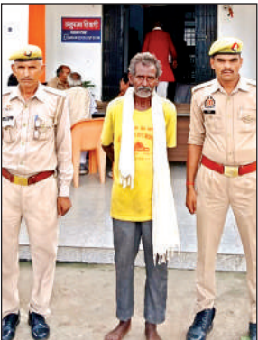
पुलिस की गिरफ्त में आरोपी।

जब देर तक बेटिया घर न पहुंची तो उसे ढूंढा गया। जब वह घर के पीछे गई तो वृद्ध को बेटिया के साथ