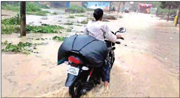
बारिश से रास्तों में भरे पानी से निकलता बाइक सवार।

मंगलवार को मुख्यालय सहित कस्बा व ग्रामीण क्षेत्रों में दोपहर बाद गरज चमक के साथ जोरदार बारिश होने से खेत खलिहान लबालब होने से किसान मायूस आदि ने बताया कि ज्यादा बारिश से किसानों की फसल को करारा झटका देना है ज्यादा बारिश होने के कारण