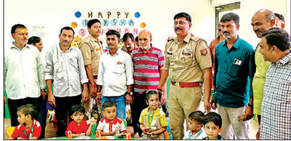
कन्याओं को भोज कराते एसओ बकेवर व व्यापार मंडल के पदाधिकारी ।