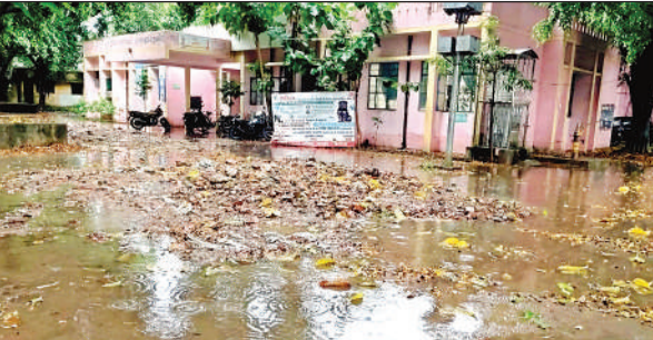
नगर की सीएचसी में बरसात के कारण हुआ जलभराव।

यहां गंदगी व जलभराव के कारण स्थानीय लोगों सहित आने जाने वालों को आवागमन में परेशानी का सामना करना पड़ा। जलालाबाद जीटी रोड पर नदी जैसे हालात दिखाई दिए। वाहन चालकों को जलभराव से होकर गुजरना पड़ा। ग्राम सराय प्रयाग, तेराजाकेट, जसोदा, समधन, मलिकपुर आदि स्थानों पर भी मूसलाधार बारिश व जलभराव से लोगों को परेशानी का सामना करना पड़ा।