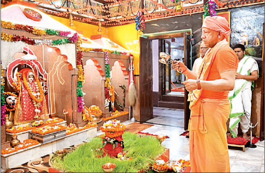
नवरात्र पर गोरक्षपीठ में मां दुर्गा की आरती करते गोरक्षपीठाधीश्वर एवं मुख्यमंत्री योगी आदित्यनाथ।