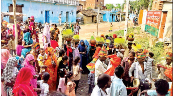
नवरात्र के तहत जवारा विसर्जन को जाते भवत।

कस्बे के मोहल्ला खंदियापुरा के हिंगलाज मंदिर से जवारा यात्रा निकाली गई। इसके बाद जमींदारी मोहल्ला, बजरिया, दरैरापुरा, मस्ताना, नयापुरा सहित अगल अलग जवारे निकाले गए। वहीं दूसरी तरफ आधा दर्जन मोहल्ले से देवी के विमान भी निकाले गए। जवारा यात्रा के दौरान महिलाएं देवी गीत गाकर फिर पर जवारों का कलश लेकर चल रहीं थीं। सभी देवी मंदिरों के जवारे झंडा बजार में एकत्र होकर ऐतिहासिक चबूतरे की परिक्रमा लगाते रहे। जिसमें ग्राम