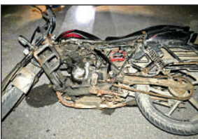
मौके से बरामद हुई बाइक।