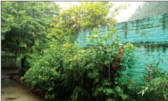
मकरंदनगर में बारिश के दौरान का दृश्य।