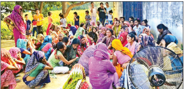
महिला की मौत पर रोते बिलखते परिजन।

की जानकारी दी जा रही है, ताकि वे किसी भी संकट में तुरंत मदद पा सकें। साइबर अपराध, घरेलू