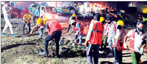
रात्रि के समय नगर में सफाई करते कर्मी।

की टीम बनाकर 8-8 घण्टों की शिफ्ट से सफाई कार्य किया जा रहा है। अभियान की समीक्षा नगरीय निकाय निदेशालय, लखनऊ से टीम गठित है। 25 सितम्बर को रात्रि 3.30 बजे एवं 29 सितम्बर को रात्रि 09 बजे उच्चाधिकारियों द्वारा वीडियो कॉन्फ्रेंसिंग के माध्यम से सफाई अभियान को देखा गया। पालिका द्वारा पूरे नगर में 210 सीटीयू (क्लीनीनेस टागेट यूनिट) को चिन्हित किया गया जिसमें से 202 प्वाइंट की सफाई करवाई जा चुकी है।