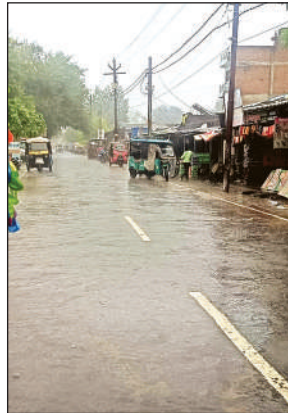
बारिश के चलते सड़क पर पसरा सन्नाटा।

पिछले सप्ताह से कालपी ने उमस भरी गर्मी से नागरिक परेशान थे। मंगलवार को काफी देर तक बादलों की गड़गड़ाहट तथा बिजली की चमक दिखाई दी। दोपहर करीब 1:00 बजे से बारिश का जो सिलसिला शुरू हुआ वह देर शाम तक जारी रहा। झमाझम बारिश होने से मुख्य बाजार टरननगंज, खोवा मंडी, मूंगफली मंडी, सराफा मार्केट, गल्ला मंडी, फुलपावर चौराहे आदि स्थानों में सड़के सूनी हो गए। तथा ग्राहकों की चहलकदमी न होने से दुकानदार अपनी अपनी