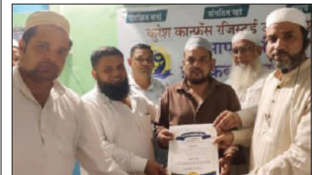
बाहर से आये अतिथियों को सम्मान पत्र देते आयोजक।