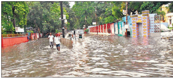
कानपुर के सर्वोदय नगर में बारिश से हुआ जलभराव ।