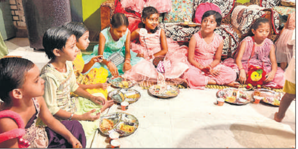
अष्टमी पर भोजन करती कन्याएं।

सात दिनों व्रत रखते आ रहे श्रद्धालुओं ने मंगलवार को आठवें दिन मां भगवती के आठवें स्वरूप महागौरी की पूजा अर्चना कर व्रत खोला। मंगलवार की सुबह से ही घरों में पूजा अर्चना हुई। मंदिरों पर सुबह से ही दर्शन पूजन का सिलसिला शुरू हो गया। देवी उपासकों ने माता के चरणों में फल, फूल, धूप, दीप, नैवेद्य अर्पित किया। माता की भव्य आरती उतारी और जयकारे लगाए। माता का रोली से तिलक कर पुष्प और फल अर्पित कर नवरात्र व्रत कथा का पाठ किया। इसके बाद आरती और दुर्गा चालीसा के पाठ के साथ ही पूजन किया। श्रद्धालुओं ने हवन