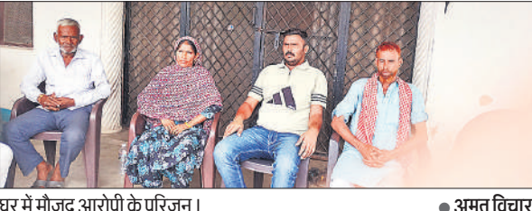
घर में मौजूद आरोपी के परिजन।