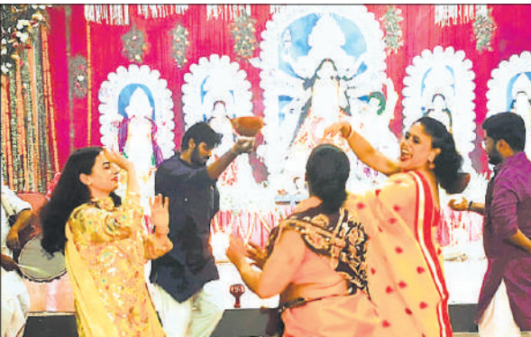
मनोरंजन सदन में धनुची नृत्य करती महिलाएं।

माल गोदान के वाहनों का संचालन 2 अक्टूबर को दोपहर 2 बजे से रात