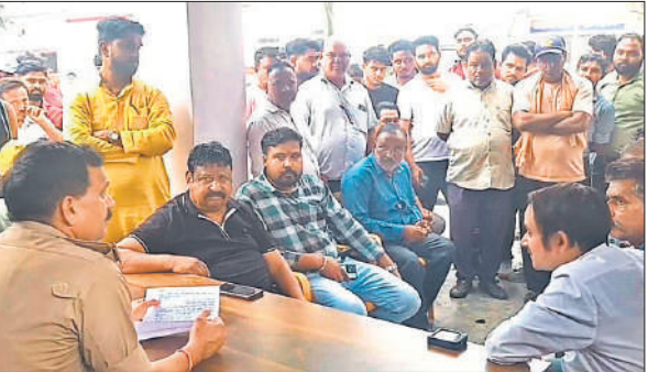
सभासदों पर कार्रवाई के लिए कोतवाली पहुंचे पालिका कर्मी।