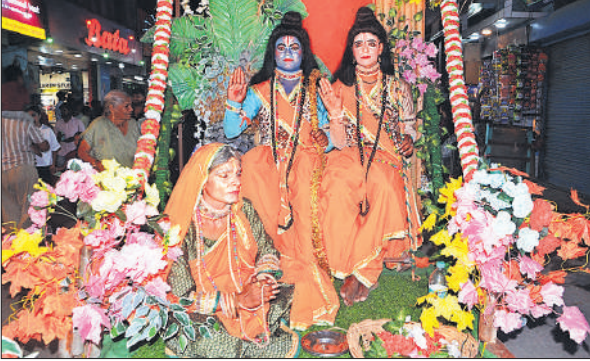
शोभायात्रा में शामिल श्री राम और शबरी के मिलन की झांकी।