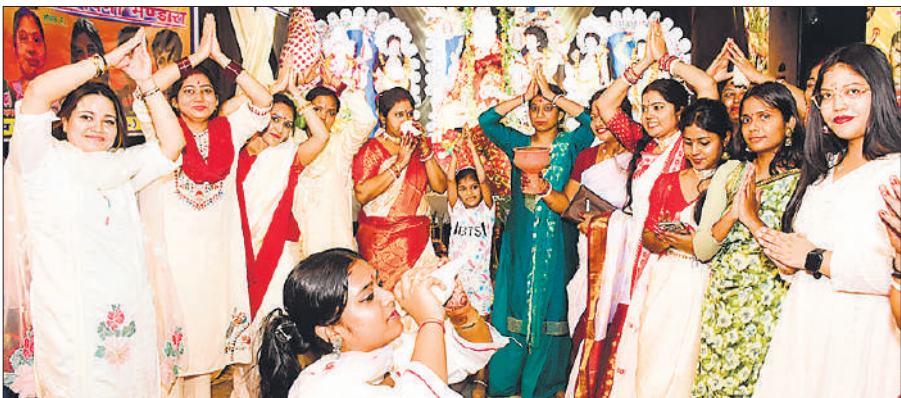
साईं सेलिब्रेशन में आयोजित दुर्गा पूजा में पूजा करती महिलाएं।

अमृत विचार : बंगाली समुदाय की ओर से धूमधाम से दुर्गा पूजा महोत्सव मनाया जा रहा है। पांच दिवसीय महोत्सव के तहत विधि विधान से पूजा-अर्चना के साथ सांस्कृतिक कार्यक्रम हो रहे हैं। रेलवे मनोरंजन सदन में सर्वजनित बंगाली एसोसिएशन की ओर से मंगलवार को तीसरे दिन महाअष्टमी का पूजन किया गया। भक्तों ने