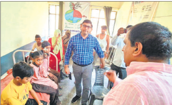
गुन्नौर सीएचसी में उपचार कराने लाए गए बच्चे।

मंगलवार सुबह को गुन्नौर तहसील क्षेत्र में बिजली की गड़गड़ाहट के साथ बरसात हो रही थी। परिषदीय विद्यालय विजुआ नगला में पच्चीस छात्र-छात्राएं कक्षा में बैठे पढ़ रहे थे। इस दौरान करीब तेज दस बजे तेज कड़कड़ाहट संग तेज बरसात शुरू हुई और विद्यालय भवन की छत पर बिजली गिर गई। कक्षा में धमाके जैसी तेज आवाज सुनाई दी। इससे पहले कि बच्चे और अध्यापक कुछ समझ पाते कक्षा भवन की दीवारों का प्लास्टर टूटकर गिर पड़ा। इसके साथ ही