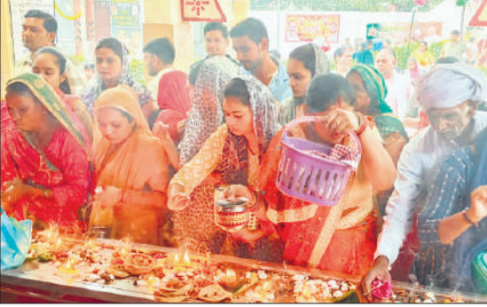
चामुंडा मंदिर पर मां दुर्गा की पूजा अर्चना करती महिलाएं।