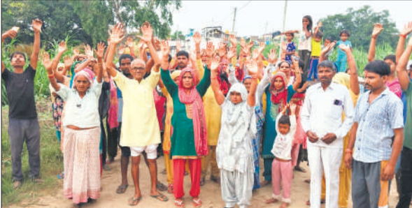
कब्जा हटाने के विरोध में प्रदर्शन करते ग्रामीण।