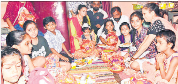
अष्टमी पर कन्या पूजन करते श्रद्धालु।

परंपरा का लोगों ने पालन किया। माता के भजनों की गूंज से माहौल अलौकिक हो उठा। कोर्ट रोड और बुध बाजार स्थित दुर्गा मंदिर में सुबह से ही लंबी कतारें लगी रहीं। लालबाग स्थित प्राचीन काली माता मंदिर और गोविंद नगर के सत्य हरि शिव मंदिर में भी दिन भर श्रद्धालुओं का तांता लगा रहा। परिवार सहित भक्त मंदिर पहुंचे और मां का आशीर्वाद प्राप्त किया। मंदिर समितियों ने भी व्यवस्था की विशेष तैयारी की थी, ताकि भक्तों को किसी प्रकार की असुविधा न हो।