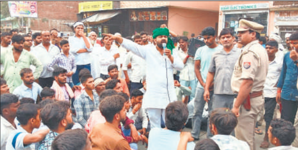
किसानों से वार्ता करते पुलिस अधिकारी।

इसके बाद, सभी कार्यकर्ता मंडी समिति पहुंचे और धरना देकर बैठ गए। किसान संगठन ने मांग की है कि सरकारी रेट पर ही किसानों का धान खरीदा जाए और वह सक्षम अधिकारी को मौके पर बुलाने की मांग पर अड़े रहे। किसान देर शाम तक मंडी समिति में डटे रहे।