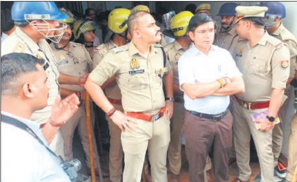
मंत्री गुलाब देवी के आवास से धरना हटवाने पहुंचे डीएम व एसपी।

ऑफलाइन स्थानांतरण करने को लेकर लामबंद प्रदेश के कई जनपदों के शिक्षक माध्यमिक