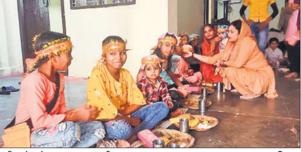
मंडी धनौरा में कन्या पूजन करती श्रद्धालु।

इसलिए जगह-जगह कन्याओं को पूजा गया और उनको भोजन कराया गया। प्राचीन नवदुर्गा मंदिर