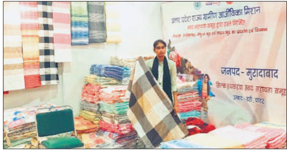
ग्रेटर नोएडा में ट्रेड शो में सिल्क हथकरघा स्वयं सहायता समूह का सूना स्टॉल।