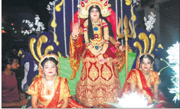
शोभायात्रा में शामिल माता रानी की झांकी।