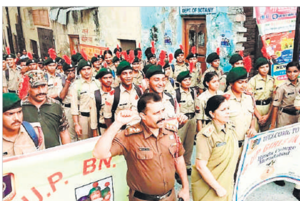
रैली में शामिल एनसीसी कैडेट्स।