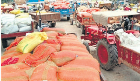
मंडी में खड़ी धान से भरी ट्रैक्टर ट्रॉली।

छल है। एक घंटे के जाम के बाद, पुलिस प्रशासन के समझाने पर किसान सड़क से हट गए। लेकिन उन्होंने अपना विरोध खत्म नहीं किया।