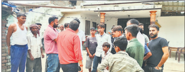
कासिम के घर के आसपास लगी भीड़।

हिंदू धर्म गुरुओं की हत्या की साजिश में रविवार को पुलिस और एटीएस ने किया था गिरफ्तार