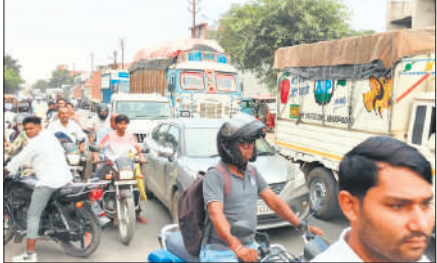
जाम के कारण मार्ग पर लगी वाहनों की कतारें।