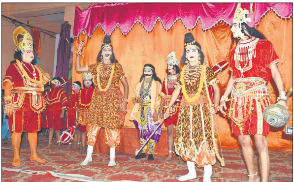
सुभाषनगर रामलीला में मंचन करते कलाकार।