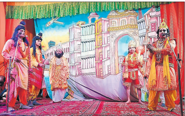
हार्टमन कॉलेज मैदान में रामलीला में मंचन करते कलाकार।

बरेली, अमृत विचार: श्री रामलीला सभा की ओर से आयोजित सुभाषनगर की रामलीला में मंगलवार रात में लक्ष्मण शक्ति, हनुमान भरत मिलाप, कुंभकरण वध लीला का मंचन किया गया।