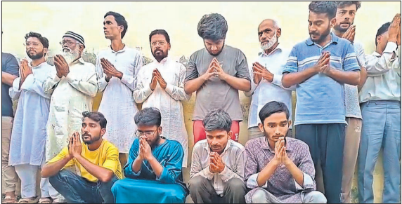
जुमे की नमाज के दिन बवाल करने के आरोपी हाथ जोड़ते हुए।