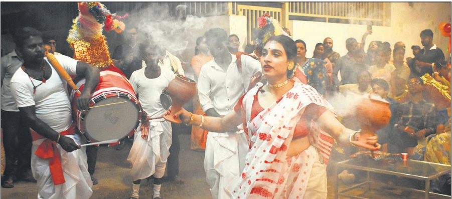
रेलवे मनोरंजन सदन में सजे दुर्गा पंडाल में धनुची नृत्य करती महिला श्रद्धालु।

दुर्गा पूजा में सबसे महत्वपूर्ण महाअष्टमी की पूजा होती है। मान्यता है कि इस दिन भगवान श्रीराम ने लंका पर चढ़ाई करने से पहले 108 कमल के पुष्प से मां दुर्गा की पूजा की थी। पूजा में एक पुष्प कम पड़ने पर जब वह तलवार