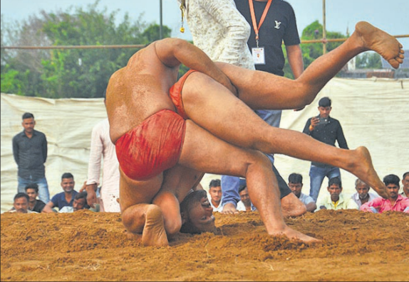
वनखंडी नाथ रामलीला समिति के दंगल में दांव लगाते पहलवान।

बरेली, अमृत विचार: बाबा वनखंडी नाथ रामलीला समिति की ओर से आयोजित दंगल में मंगलवार को 16 कुश्रियां लड़ी गई जिसमें 6 कुश्रियां निर्णायक भूमिका में रहीं। दंगल में महिला एस-02 भरकर संबंधित खंड शिक्षा अधिकारी कार्यालय में उपलब्ध कराना होगा। इसके साथ ही आधार कार्ड और एसआर पंजिका (छात्र रजिस्टर) की प्रमाणित प्रति संलग्न करना अनिवार्य है। बीएसए ने सभी प्रधानाचार्यों और शिक्षकों को निर्देशित किया कि वे पोर्टल पर अपलोड किए गए आंकड़ों का अपनी विद्यालय पंजिका से कक्षावार मिलान करें। यदि कोई छात्र-छात्रा डेटा फीडिंग से छूट जाता है तो इसकी पूर्ण जिम्मेदारी संबंधित विद्यालय की होगी। इस पर नियमानुसार कठोर कार्रवाई की जाएगी।