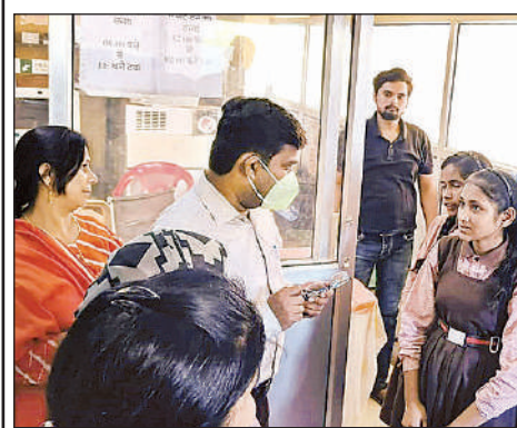
छात्राओं को जागरूक करते हुए चिकित्सक।