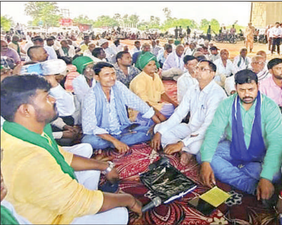
धरने पर बैठे भाकियु पदाधिकारी और सदस्य।