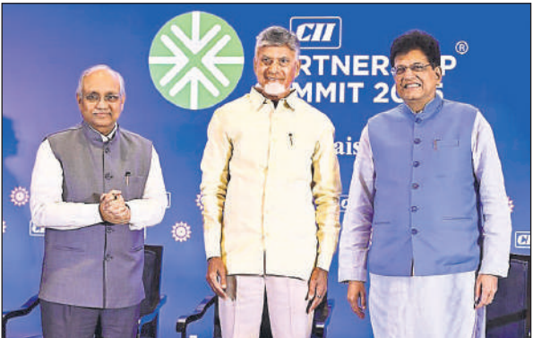
भारतीय उद्योग परिषद के सम्मेलन में आंध्र प्रदेश के सीएम चंद्रबाबू, उद्योग मंत्री पीयूष गोयल।

हथियार के तौर पर इस्तेमाल करने का कोई असर नहीं होगा और हम हमेशा अपने अंतर्राष्ट्रीय दायित्व पूरा करने की स्थिति में रहेंगे। उन्होंने नवंबर में विशाखापत्तनम में होने वाले सीआईआई भागीदारी शिखर सम्मेलन के बारे में जानकारी देने के लिए आयोजित कार्यक्रम में यह बात कही। अमेरिका की तरफ से भारत एवं कई अन्य देशों पर भारी शुल्क लगाए जाने के कारण वैश्विक व्यापार बाधित हुआ है। इस लिहाज से गोयल की यह टिप्पणी महत्वपूर्ण है। अमेरिका ने 27 अगस्त से भारतीय सामानों पर 50 प्रतिशत का भारी शुल्क लगा दिया है। वाणिज्य मंत्री ने यह भी कहा कि ऐसे