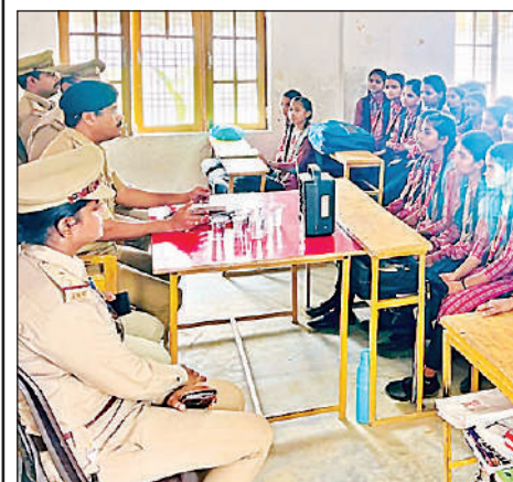
छात्राओं को जागरूक करते पुलिस अधिकारी।