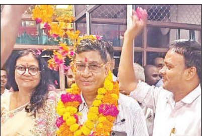
माला पहनाकर दी गई विदाई।