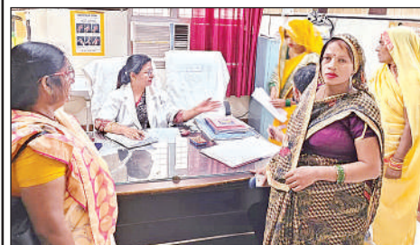
शिविर में महिला मरीजों को देखती हुई चिकित्सक।