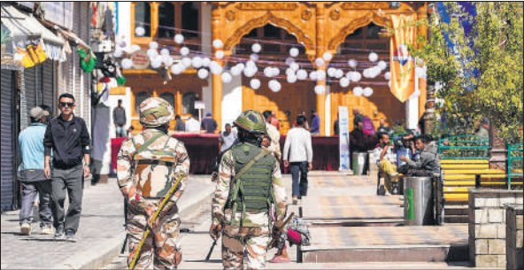
लेह में सप्ताह भर बाद कर्फ्यू में पूरे दिन की ढील के बाद बाजारों में निकले लोग ।

तैनाती की गई है और वे कानून-व्यवस्था बनाए रखने के लिए कड़ी निगरानी रख रहे हैं। मंगलवार को कर्फ्यू में पहले सुबह 10 बजे से दोपहर दो बजे तक ढील दी गई थी और बाद में इसे शाम पांच बजे तक बढ़ा दिया गया। इससे पहले, शनिवार को पहली बार अलग-अलग इलाकों में दोपहर एक बजे और साढ़े तीन बजे से दो-दो घंटे के लिए कर्फ्यू में ढील दी गई थी। अधिकारियों ने बताया कि लेह शहर में मोबाइल इंटरनेट सेवाएं अब भी निलंबित हैं और कारगिल समेत प्रदेश के अन्य प्रमुख हिस्सों में पांच या अधिक लोगों के एकत्र होने पर प्रतिबंध अभी भी लागू है।