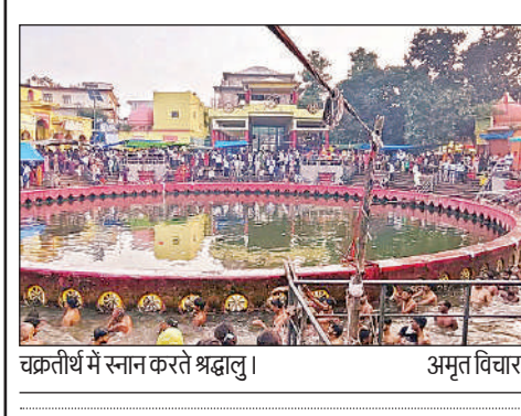
चक्रतीर्थ में स्नान करते श्रद्धालु।