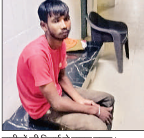
ग्रामीणों की पिटाई से घायल युवक।