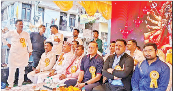
भरत मिलन कार्यक्रम में उपस्थित अतिथि।

करीब 60 वर्षों से शहर में ऐतिहासिक भरत मिलाप कार्यक्रम आयोजित हुआ। रामलीला समिति एवं रामलीला आयोजन समिति के तत्वावधान में आयोजित भरत मिलाप कार्यक्रम में शुक्रवार रात रामरथ हनुमानगढ़ी मंदिर से बैंड बाजे के साथ निकाला। इसके बाद शिवाय ज्योति मंडल, न्यू अमर ज्योति मंडल, आदर्श ज्योति मंडल, ज्वाला ज्योति अपने अपने लाव लश्कर के साथ शहर में प्रदर्शन करने के लिए रवाना हुआ। वहीं महाकाल गुप्त, श्री शिव ज्योति मंडल, अन्नपूर्णा गुप्त की झांकियां गाजे बाजे के साथ शहर में मंडलों।