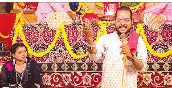
कीर्तन प्रस्तुत करते भजन गायक।

भजन गायक कानपुर से चलकर कानपुर की आन बान