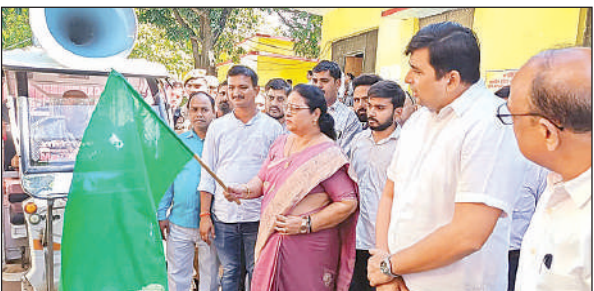
हरी झंडी दिखाकर वाहन रवाना करती विधायक महमूदाबाद।