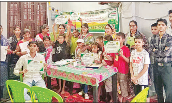
बैठक में मौजूद लोग।