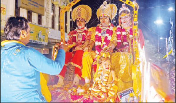
शोभायात्रा में श्रीराम, माता सीता के स्वरूपों की आरती करता श्रद्धालु।

शोभायात्रा में राधा-कृष्ण, दुर्गा माता, काली मां, शिव-पार्वती, छत्रपति शिवाजी सहित अनेक झांकियों आकर्षण का केंद्र रहीं। कस्बे के विभिन्न स्कूलों के बच्चों द्वारा प्रस्तुत झांकियों को भरत सेवा समिति ने सम्मानित किया। मूंशीगंज चौराहे पर भरत मिलाप के भावुक दृश्य का मंचन हुआ, जिसमें भरत द्वारा भगवान