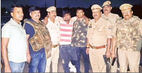
मुठभेड़ में घायल गो तस्कर को ले जाती पुलिस।

अमृत विचार। अमेठी पुलिस ने कार्रवाई करते हुए 50,000 के इनामी एक शातिर अंतर्जनपदीय गो तस्कर को मुठभेड़ के बाद गिरफ्तार कर लिया है। अपराधी के कब्जे से तमंचा, कारतूस और गो तस्करी में इस्तेमाल की गई मोटरसाइकिल बरामद हुई है।