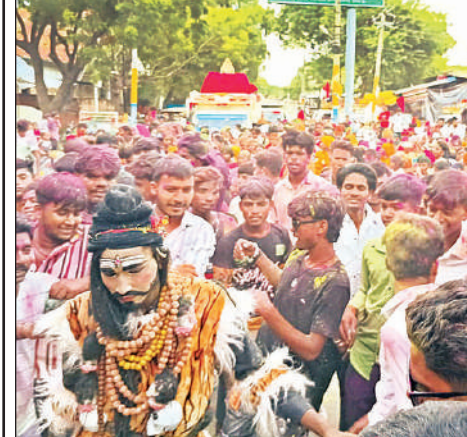
दुर्गा प्रतिमा के विसर्जन के लिए जाते श्रद्धालु।