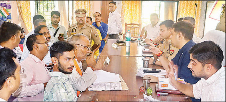
सवायजपुर तहसील में आयोजित समाधान दिवस में फरियादियों की शिकायतें सुनते डीएम और एसपी।

अमृत विचार। शनिवार को जिलेभर में कोतवाली व थाना क्षेत्रों में आयोजित संपूर्ण समाधान दिवस संपन्न हुआ। जिसमें अधिकारियों ने जनता की शिकायतों का निस्तारण कराया। तहसील सवायजपुर में आयोजित सम्पूर्ण समाधान दिवस में जिलाधिकारी अनुनय झा ने सरकारी जमीनों, गरीबों व असहाय लोगों की भूमि पर कब्जा की शिकायतों को लेकर नाराजगी व्यक्त की। राजस्व विभाग के कानूनगो एवं लेखपालों को निर्देश दिये कि ग्रामीण क्षेत्रों में सरकारी एवं गरीबों की भूमि पर कब्जा करने वालों के विरूद्ध कड़ी कार्रवाई करते हुए समस्त भूमि