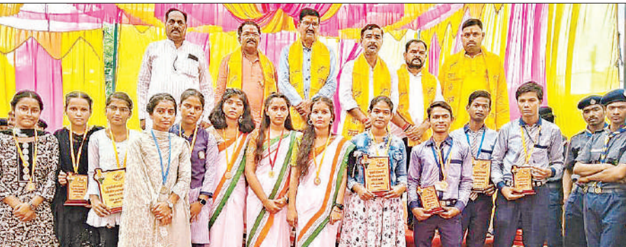
शील्ड से सम्मानित छात्र-छात्राएं।