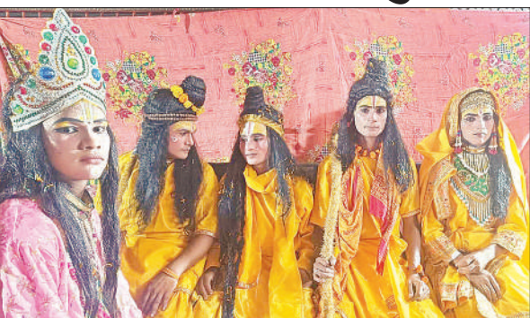
शाहाबाद में भरत मिलाप शोभायात्रा में सजी झांकी के अ

उधर पटवर्मा रामलीला मेला समिति की भरत मिलाप शोभा यात्रा नगर के प्रमुख मार्गों से निकाली गई। शोभा यात्रा का शुभारंभ शुक्रवार