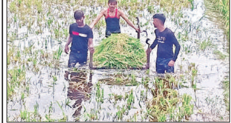
बारिश के बाद डूबी धान की फसल को खेत से निकालते किसान।