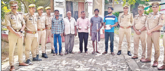
पुलिस हिरासत में विक्षिप्त की हत्या करने वाले ग्रामीण।