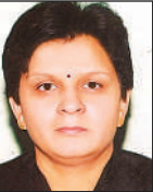
नवागत जिला जज रीता कौशिक।

जनपद में कार्यरत जिला जज संजीव शुक्ला का स्थानांतरण हो गया है। उन्हें जनपद बनारस का जिला जज बनाया गया है। श्री शुक्ला बीते 11 महीने से यहां पर जिला जज के तौर पर कार्य कर रहे थे। उनके स्थान पर जनपद अंबेडकर नगर की जिला जज रीता कौशिक यहां आ रही है। बीते 50 सालों से अधिक समय के इतिहास में यह पहला मौका होगा, जबकि कोई महिला