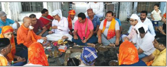
खटीमा में हवन पूजन करतेरामलीला कमेटी के पदाधिकारी।