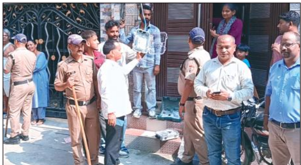
किच्छा में पुलिस फोर्स की मौजूदगी में स्मार्ट मीटर लगाते विद्युत कर्मचारी।