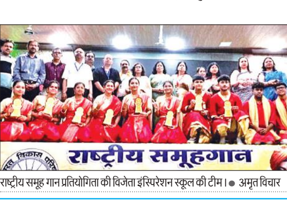
राष्ट्रीय समूह गान प्रतियोगिता की विजेता इंस्पिरेशन स्कूल की टीम। ● अमृत विचार

हल्द्वानी : राष्ट्रीय स्वयंसेवक संघ (आरएसएस) के शताब्दी वर्ष पूर्ण हो चुके हैं। इस उपलक्ष्य पर आज पांच अक्टूबर को नगर में एक विशाल कार्यक्रम का आयोजन किया जा रहा है। इस अवसर पर संघ के सह सर कार्यवाह आलोक मुख्य वक्ता के रूप में उपस्थित रहेंगे। वह शनिवार को हल्द्वानी पहुंच चुके हैं। रविवार को सुबह 7 बजे से एमबी इंटर कॉलेज मैदान में आयोजित होने वाले कार्यक्रम को स्वयंसेवकों संबोधित करेंगे। इस ऐतिहासिक अवसर पर नगर एवं आसपास के क्षेत्रों से 7000 से अधिक स्वयंसेवक पूर्ण गणवेश में उपस्थित रहेंगे। यह आयोजन संघ के 100 वर्षों की राष्ट्रनिष्ठ, सेवा और संगठन यात्रा का प्रतीक है।