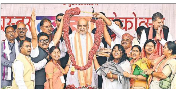
बस्तर दशहरा महोत्सव में शामिल केंद्रीय गृह मंत्री अमित शाह।

शाह ने कहा कि मैं सभी आदिवासी भाइयों बहनों को कहना चाहता हूं कि आपके काम के युवाओं को हथियार डालने के लिए समझाइए। वह हथियार डाल दे, मुख्यधारा में आएँ तथा बस्तर