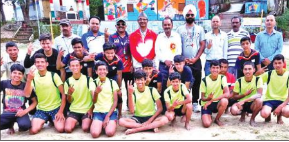
पतलोत में आयोजित दो दिवसीय ब्लॉक स्तरीय कबड्डी प्रतियोगिता में हिस्सा लेते खिलाड़ी