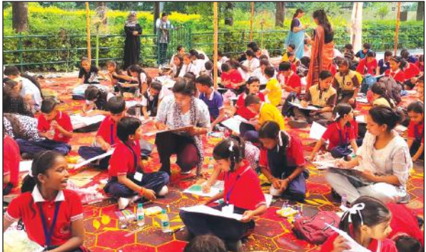
रामनगर में चित्रकला प्रतियोगिता में प्रतिभाग करते स्कूली बच्चे।

से भोजन भी खिलाया, जिससे वे अत्यंत उत्साहित नजर आए। साथ ही, कॉबेंट म्यूजियम, कालाहूंगी में विद्यार्थियों द्वारा कले मॉडलिंग एवं भाषण प्रतियोगिता आयोजित की गई। इस प्रतियोगिता का आयोजन कॉबेंट ग्राम विकास समिति एवं कॉबेंट टाइगर रिजर्व द्वारा संयुक्त रूप