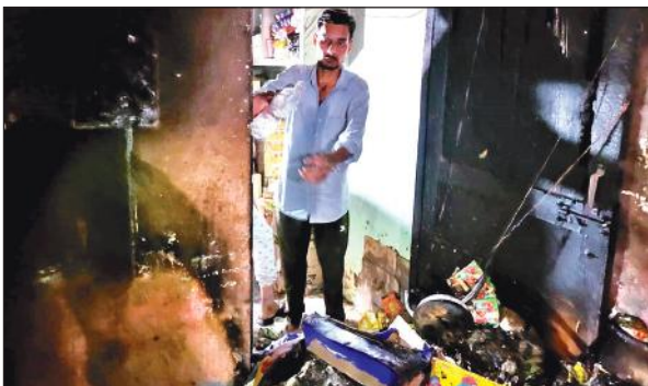
बेकरी में जला हुआ सामान दिखाता दुकानदार।