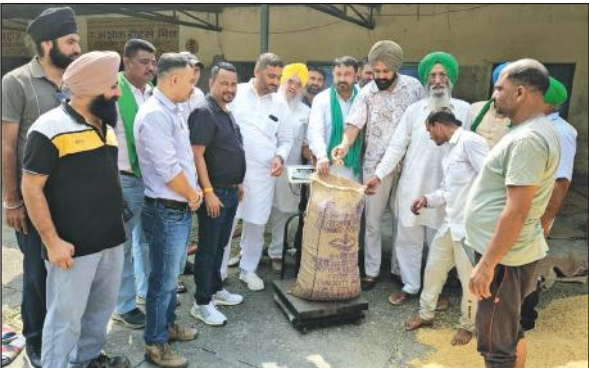
खटीमा की मंडी में धान खरीद के समय मौजूद किसान। ● अमृत विचार