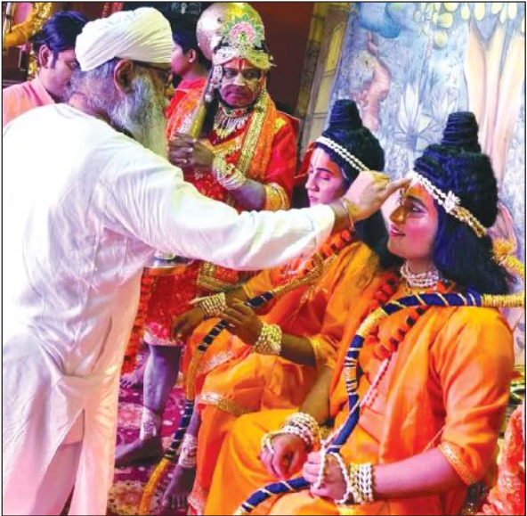
बाजपुर में श्रीराम का तिलक करते उत्तराखंड अल्पसंख्यक आयोग के पूर्व अध्यक्ष।