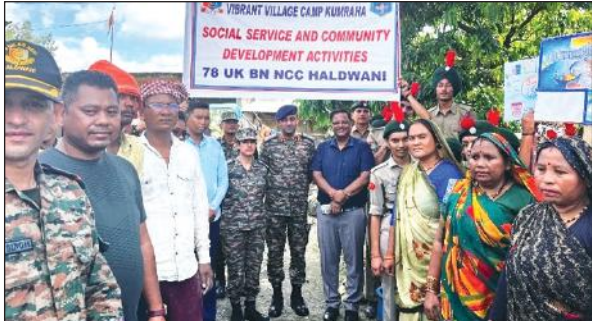
खटीमा के ग्रामीण क्षेत्र में अभियान चलाते सिटी कॉन्वेंट स्कूल के एनसीसी कैडेट्स।