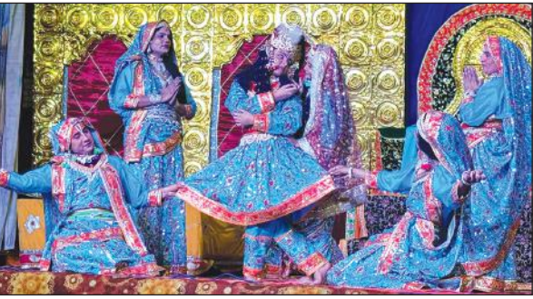
रासलीला में गोपियों के साथ भगवान श्रीकृष्ण की मनमोहक प्रस्तुति।