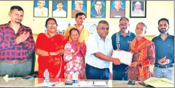
रानीबाग में चारा उत्पादन प्रशिक्षण के उपरांत प्रमाण पत्र देते अतिथि। ● अमृत विचार

होम किए गए। अनुष्ठानों में पिण्डिका अधिवासन, प्रतिष्ठांग होम, नवग्रह देवताओं हेतु फल होम और लक्ष्मी होम जैसे विविध वैदिक विधियां पूरी श्रद्धा के साथ संपन्न की गईं। मुख्य आकर्षण महाभोग, महानीराजन, उत्तर पूजा, नवाहुति बलिदान और पूर्णाहुति रहा। मुख्य जजमान पूरन