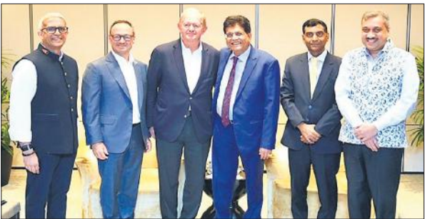
सिंगापुर में निवेशकों के साथ केंद्रीय मंत्री पीयूष गोयल।

उन्होंने कहा कि मैं आप सभी से आग्रह करूंगा कि आप भारत द्वारा प्रस्तुत अवसरों पर गौर करें। केंद्रीय मंत्री ने भारत की तीन खास