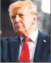
प्रधानमंत्री बेंजामिन नेतन्याहू के साथ हुई बातचीत के बाद गाजा पट्टी ज़ि युद्ध समाप्त कराने के लिए एक योजना पेश की थी।