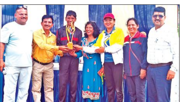
भीमताल में प्रतियोगिता के विजयी प्रतिभागियों को पुरस्कृत करते अतिथि।