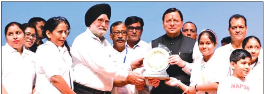
देहरादून में प्राइड मूवमेंट सम्मान समारोह में वॉलंटियर्स को सम्मानित करते मुख्यमंत्री पुष्कर सिंह धामी।

सीएम धामी ने कहा कि यह सम्मान ऐसे कर्मियों के प्रति कृतज्ञता का प्रतीक है, जिन्होंने आपदा के दौरान राहत एवं बचाव अभियान में अपनी जान की परवाह किए बिना प्रभावितों की मदद की है। जब हम उत्तराखंड की बात करते हैं, तो केवल प्राकृतिक सौंदर्य और आध्यात्मिकता ही नहीं बल्कि इसकी भौगोलिक कठिनाइयों और प्रत्येक वर्ष होने वाली आपदाओं की चुनौती भी स्वतः ही सामने आ जाती है। राज्य में भूस्खलन, बाढ़, अतिवृष्टि और अन्य प्राकृतिक आपदाएं आना आम हैं। उन्होंने कहा कि वर्ष 2013 की केदारनाथ आपदा, 2021 में चमोली की त्रिघण्टा और धौलीगंगा घाटी आपदा और 2023 में जोशीमठ