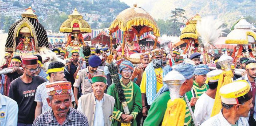
हिमाचल प्रदेश के कुल्लू जिले में सप्ताह भर चलने वाले अंतर्राष्ट्रीय कुल्लू दशहरा उत्सव के तीसरे दिन भगवान नरसिम्हा की शोभा यात्रा निकाली जाती है जिसमें भारी संख्या में लोग भाग लेते हैं।