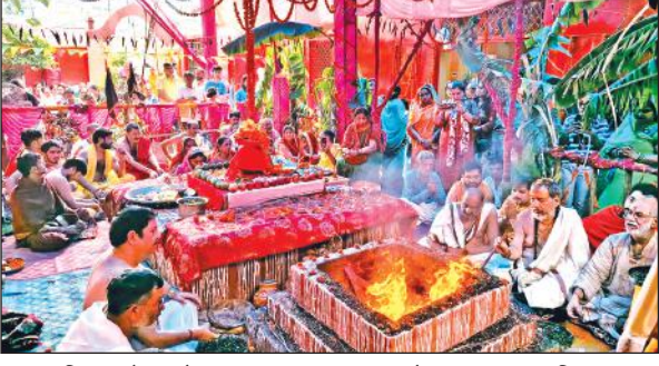
अचल प्रतिष्ठा महोत्सव के अवसर पर हसन-यज्ञ करते श्रद्धालु