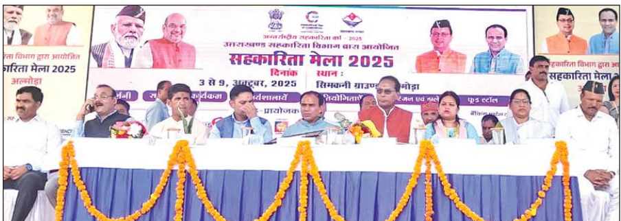
अल्मोड़ा में आयोजित सहकारिता मेले में मंवासीन कैबिनेट मंत्री डॉ. धन सिंह रावत और अन्य। ● अमृत विचार

उन्होंने कहा कि वर्ष 2025 को अन्तर्राष्ट्रीय सहकारिता वर्ष के रूप में मनाया जा रहा है। कहा कि उत्तराखण्ड के 13 जिलों में सहकारिता मेले लगाये जा रहे हैं। इसकी शुरुआत जनपद अल्मोड़ा से की गई है तथा देहरादून में दिसम्बर माह में इसका समापन होगा। कहा कि इन सहकारिता मेलों के तीन लक्ष्य रखे गये हैं पहला लक्ष्य है काशतकारों को बाजार उपलब्ध कराना, दूसरा लक्ष्य है तीन लाख लखपति दीदीयों को तैयार करना तथा तीसरा लक्ष्य है मिलेट्स मिशन