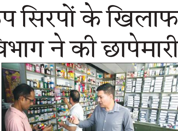
कफ सिरप की जांच करती औषधि निरीक्षक की टीम।

राजस्थान व मध्य प्रदेश में कफ सिरप पीने से बच्चों की हुई मौतों के बाद राज्य सरकार भी गंभीर हो गई है। स्वास्थ्य मंत्री डॉ. धन सिंह रावत के निर्देशों के बाद स्वास्थ्य विभाग और खाद्य सुरक्षा एवं औषधि प्रशासन की टीमों राज्य के सभी जिलों में मेडिकल स्टोर्स, थोक विक्रेताओं और अस्पतालों की दवा