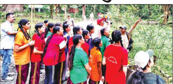
रामनगर के पवलगाढ़ में तितलियों को देखते बच्चे।