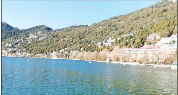
नैनीताल झील का मनोहारी दृश्य।

अमृत विचार : 178 वर्ष बाद नैनी झील की सुरक्षा दीवारों का जीर्णोद्धार की घड़ी नजदीक आई है। सिंचाई विभाग ने प्रस्ताव तैयार कर शासन को भेजने जा रहा है। तल्लीताल लोनिवि विश्राम गृह से से लोअर मालरोड के करीब एक किमी झील से लगी दीवारों का सुरक्षा पहले चरण में की जाएगी। नैनीताल का अस्तित्व नैनी झील से है। झील के महत्व को ध्यान में रखते हुए ब्रिटिश शासकों ने वर्ष 1847 में पहली बार झील की सुरक्षा दीवारों का निर्माण किया था। 175 वर्ष गुजर जाने के बाद झील की दीवारें अब कई जगह से जर्जर हो चली हैं जबकि ग्रांड होटल के समीप लोअर