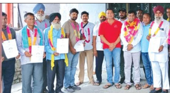
नानकमत्ता में कार्यकारिणी के गठन के बाद नवनि्युक्त पदाधिकारी।