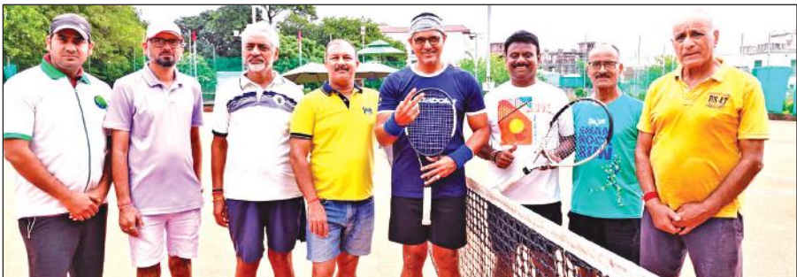
कालाढ़ूंगी में आयोजित टेनिस प्रतियोगिता के दौरान खिलाड़ियों के साथ मुख्य अतिथि। ● अमृत विचार