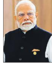
गए सभी प्रयासों का दृढ़ता से समर्थन करता रहेगा। ट्रंप ने इजराइल और हमास के बीच दो वर्ष से जारी युद्ध को समाप्त कराने की एक शांति योजना पेश की थी।

नई दिल्ली। प्रधानमंत्री नरेन्द्र मोदी ने शनिवार को कहा कि गाजा में शांति प्रयासों में निर्णायक प्रगति के बीच भारत अमेरिकी राष्ट्रपति डोनाल्ड ट्रंप के नेतृत्व का स्वागत करता है। प्रधानमंत्री मोदी ने चमसपंथी संगठन हमास की ओर से इजराइली बंधकों की रिहाई के संकेतों का उल्लेख किया और कहा कि यह क्षेत्र में शांति बहाल करने के प्रयासों में एक महत्वपूर्ण कदम है। उन्होंने एक्स पर कहा कि भारत शांति की दिशा में किए गए सभी प्रयासों का दृढ़ता से समर्थन करता रहेगा। ट्रंप ने इजराइल और हमास के बीच दो वर्ष से जारी युद्ध को समाप्त कराने की एक शांति योजना पेश की थी।