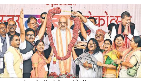
बस्तर दशहरा महोत्सव में शामिल केंद्रीय गृह मंत्री अमित शाह।

शाह ने कहा कि मैं सभी आदिवासी भाइयों बहनों को कहना चाहता हूं कि आपके काम के युवाओं को हथियार डालने के लिए समझाइए। वह हथियार डाल दे, मुख्यधारा में आएँ तथा बस्तर