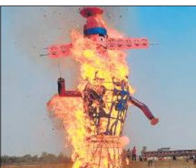
धू-धूकर जलता रावण का पुतला।

संभल/सौंधन, अमृत विचार: सौंधन में रामलीला में शनिवार को श्रीराम,लक्ष्मण और वानर सेना का रावण, मेघनाद,कुम्भकर्ण से युद्ध हुआ। लक्ष्मण के प्रहार से मेघनाद का अंत हो गया। प्रभु श्रीराम ने रावण के भाई कुम्भकर्ण को परलोक पहुंचा दिया। श्रीराम और रावण का युद्ध हुआ। रावण अपनी मायावी शक्तियों के सहारे युद्ध करता रहा। श्रीराम ने रावण के सिर कई बार धड़ से अलग किए लेकिन वह बार-बार जी उठता और युद्ध करने लग जाता। जब युद्ध का अंत नहीं हुआ तभी रावण के भाई