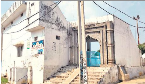
राया बुजुर्ग गांव की मस्जिद शरीफ गोसुलवरा।