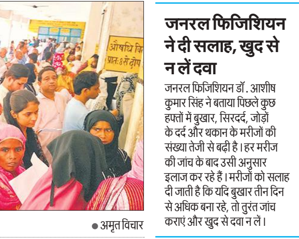
● अमृत विचार

की लंबी लाइनें धमने का नाम नहीं ले रहीं। जिला अस्पताल में बेड पूरी तरह भरे हुए हैं। डॉक्टर मजबूरन एक-दो दिन भर्ती रखकर, मरीज की स्थिति में सुधार होते ही डिस्चार्ज कर रहे हैं ताकि नए मरीजों को भर्ती किया जा सके। इससे ओपीडी और इमरजेंसी दोनों ही जगहों का भार बढ़ गया है।