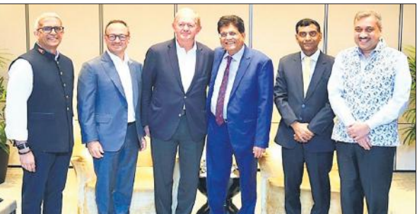
सिंगापुर में निवेशकों के साथ केंद्रीय मंत्री पीयूष गोयल।

उन्होंने कहा कि मैं आप सभी से आग्रह करूंगा कि आप भारत द्वारा प्रस्तुत अवसरों पर गौर करें। केंद्रीय मंत्री ने भारत की तीन खास