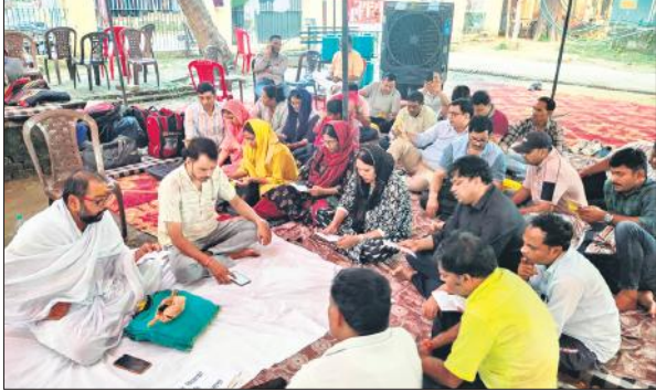
चंदौसी में अपनी मांगों को लेकर धरने पर बैठे शिक्षक।