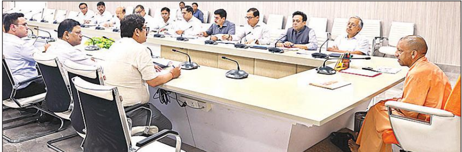
लखनऊ में आवास एवं शहरी विकास विभाग की उच्चस्तरीय समीक्षा बैठक करते मुख्यमंत्री योगी आदित्यनाथ।

मुख्यमंत्री ने कहा कि प्रदेश की तेजी से बढ़ती शहरी आबादी के अनुरूप विकास का मॉडल तैयार किया जा रहा है। हर योजना का ब्लूप्रिंट स्थानीय सर्वे और अध्ययन के बाद ही तैयार