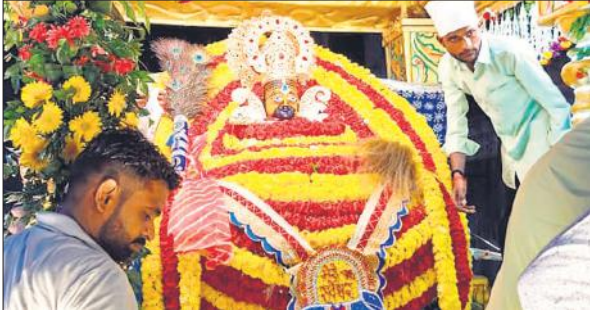
शोभायात्रा में शामिल खाटू श्याम का स्वरूप।