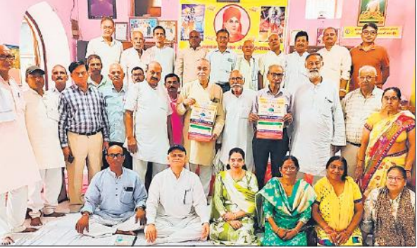
आर्य प्रतिनिधि सभा जनपद की बैठक में मौजूद पदाधिकारी व अन्य। ● अमृत विचार

12 अक्टूबर को कुंदरकी आर्य समाज के वार्षिकोत्सव के उपलक्ष्य में निकलने वाली शोभायात्रा को सफल बनाने की योजना बनी। वहीं दिल्ली