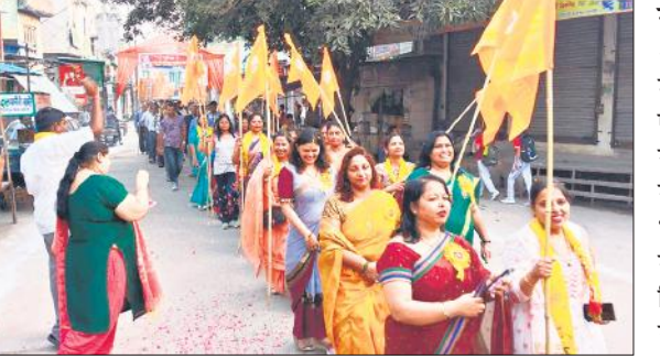
प्रभात फेरी में अग्रबंधुओं पर पुष्पवर्षा करते लोग।