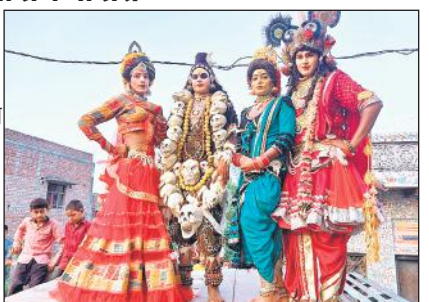
जुनावई में शोभायात्रा में शामिल झांकी।