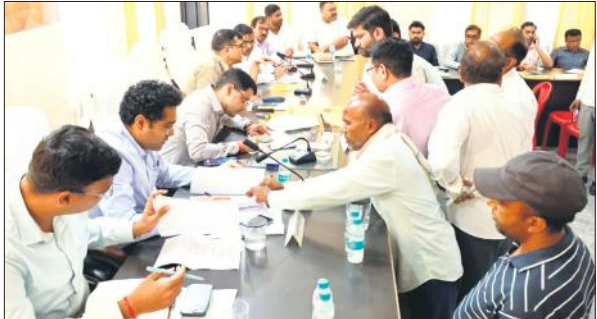
संपूर्ण समाधान दिवस में शिकायते सुनेते डीएम और एसपी।