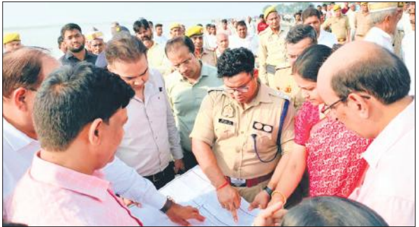
मेला स्थल का मैप देखते डीएम और एसपी।