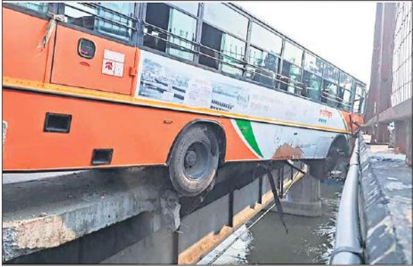
रेलिंग से लटकी रोडवेज बस।

रामपुर डिपो की रोडवेज बस शनिवार को दिल्ली जा रही थी। बस में 16 यात्री सवार थे। बृजघाट गंगा पुल पर अचानक से बस के ब्रेक फेल हो गए। जिससे बस पुल पर लगी लोहे की रेलिंग को तोड़ते हुए दोनों पुल के बीच में लटक