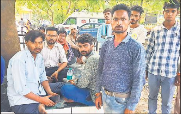
जिला अस्पताल में मौजूद मृतक के परिजन।