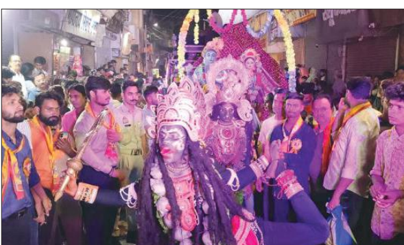
भरत मिलाप शोभा यात्रा में शामिल मां काली का अखाड़ा।

जियाउर्रहमान बर्क अपने आवास में वापस लौट गए। हालांकि उन्होंने प्रदेश सरकार पर गंभीर आरोप लगाए।