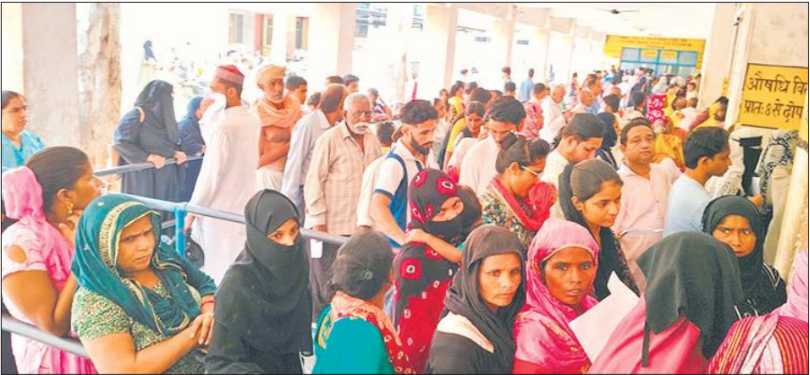
जिला अस्पताल की ओपीडी में लाइन में लगे लोग।

चिकित्सकों का कहना है कि बुखार और वायरल से पीड़ित मरीजों में डेंगू और मलेरिया के लक्षण देखे जा रहे हैं, ऐसे उसी के आधार पर उनका इलाज किया जा रहा है। सुबह आठ बजे से ही जिला अस्पताल की ओपीडी के बाहर लंबी कतारें लगनी शुरू हो जाती हैं। पर्चा बनवाने के कांउटर पर मरीजों की