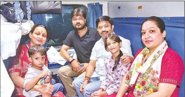
हमसफर एक्स्प्रेस से दिल्ली के लिए रवाना होते मंत्री नंद गोपाल गुप्ता ‘नंदी’।

अमृत विचार : औद्योगिक विकास मंत्री नंद गोपाल गुप्ता ‘नंदी’ प्रयागराज और विभिन्न जनपदों के 60 सदस्यों के साथ शनिवार को दिल्ली पहुंचे, जहां वे एक होटल में आयोजित वैश्य इंटरनेशनल एसोसिएशन के कान्क्लेव में शामिल होंगे। यह कान्क्लेव समाज के निर्बल वर्ग को आत्मनिर्भर बनाने के उद्देश्य से आयोजित किया गया है। कार्यक्रम में प्रयागराज के 11 परिवारों को आधुनिक ठेले प्रदान किए जाएंगे, जिससे वे चाट, चाय-नाश्ता और लड्डू-चना जैसे छोटे व्यापार कर आत्मनिर्भर बन सकें। प्रयागराज के