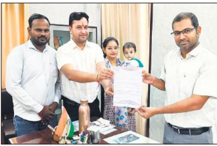
बहजौई में एडीएम को ज्ञापन सौंपते पदाधिकारी।