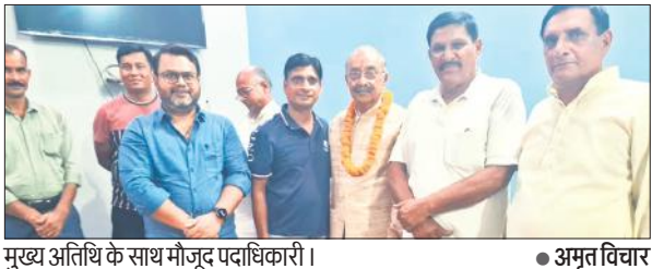
मुख्य अतिथि के साथ मौजूद पदाधिकारी।