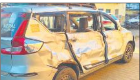
इसी कार में सवार थे मृतक।

बिलसंडा, अमृत विचार : नगर में विवाहिता को जहर खिलाने का मामला सामने आने पर हड़कंप मचा रहा। घटना शुक्रवार शाम की है। बताते हैं कि विवाहिता ने सास और ससुर पर जहर देने का आरोप लगाया है। सूचना पर पुलिस ने पहुंचकर जांच शुरू की है। कार्रवाई के लिए तहरीर नहीं दी गई है।