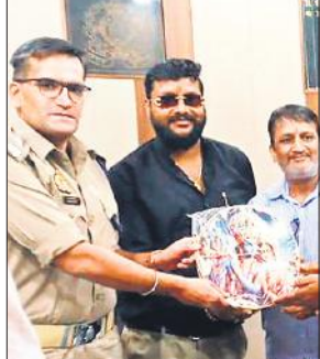
सीओ पूरनपुर को स्मृतिचिह्न भेंट करते व्यापारी।