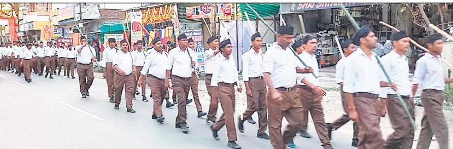
नगर में पथ संचलन करते आरएसएस के स्वयंसेवक।