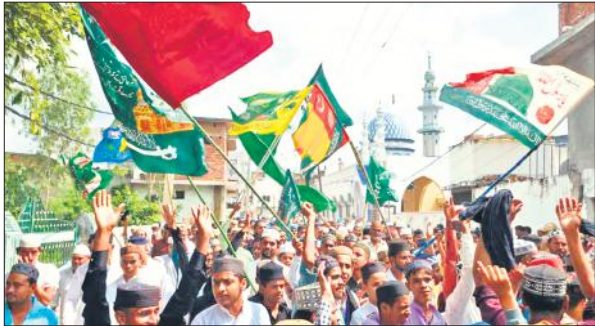
जुलूस ए गौसिया में इस्लामिक झंडे लहराते युवा।

जाने की इच्छा जाहिर करती हैं। पुत्री को बिना निमंत्रण आया देख राजा दक्ष उपहास करते हैं। भगवान शिव का अमानन करते हैं। यह देख सती क्रोधित होकर अग्नि कुंड में प्रवेश कर आत्मदाह