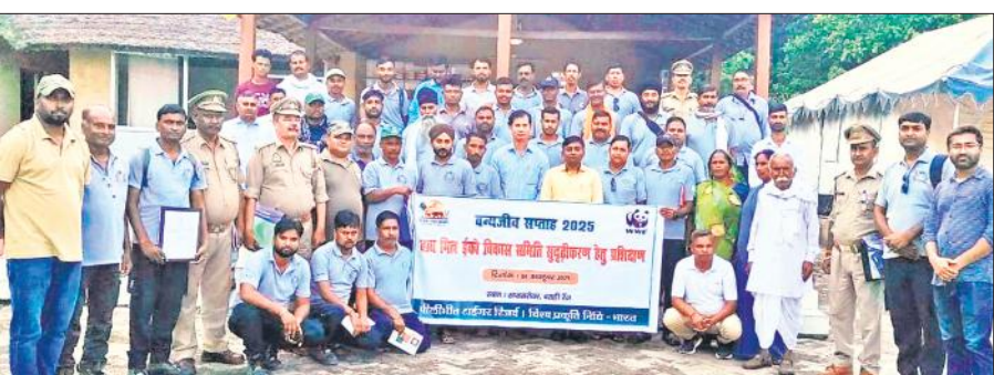
सप्त सरोवर में प्रशिक्षण के दौरान मौजूद बाघ मित्र व वन अफसर।