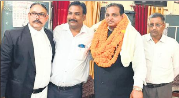
पूर्व बार काउंसिल अध्यक्ष का स्वागत करते अधिवक्ता।