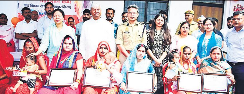
प्रमाण पत्र के साथ योजनाओं का लाभ पाने वाली महिलाएं।

पुलिस ने आरोपी के खिलाफ रिपोर्ट दर्ज कर उसका मेडिकल परीक्षण कराया है। शहर कोतवाल ने बताया कि आरोपी की तलाश की जा रही है।