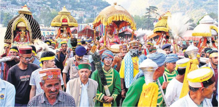
हिमाचल प्रदेश के कुल्लू जिले में सप्ताह भर चलने वाले अंतर्राष्ट्रीय कुल्लू दशहरा उत्सव के तीसरे दिन भगवान नरसिम्हा की शोभा यात्रा निकाली जाती है जिसमें भारी संख्या में लोग भाग लेते हैं।