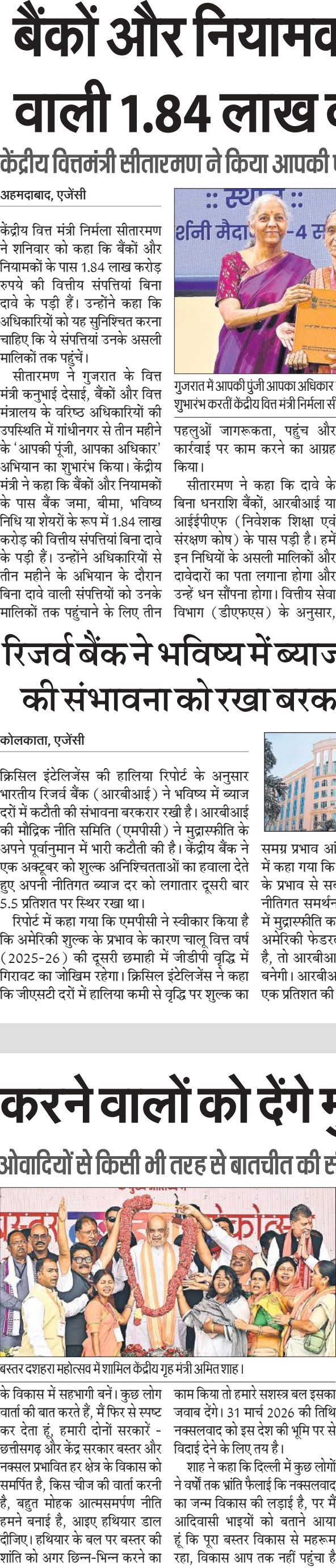
बस्तर दशहरा महोत्सव में शामिल केंद्रीय गृह मंत्री अमित शाह।

शाह ने कहा कि मैं सभी आदिवासी भाइयों बहनों को कहना चाहता हूं कि आपके काम के युवाओं को हथियार डालने के लिए समझाइए। वह हथियार डाल दे, मुख्यधारा में आएँ तथा बस्तर