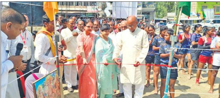
कबड्डी टूर्नामेंट का फीता काटकर उद्घाटन करते अतिथि।

प्रबंधक व शिक्षक सहित बड़ी संख्या में स्वयंसेवक मौजूद रहे। सुरक्षा की दृष्टि से पुलिस बल शहरभर में तैनात रहा। कार्यक्रम का उद्देश्य राष्ट्रभक्ति, सांस्कृतिक संवर्धन और सामाजिक समरसता का संदेश जन-जन तक पहुंचाना रहा।