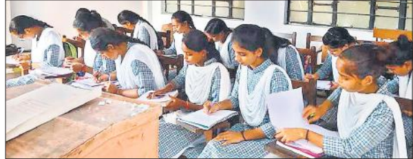
निबंध प्रतियोगिता में भाग लेती छात्राएं।