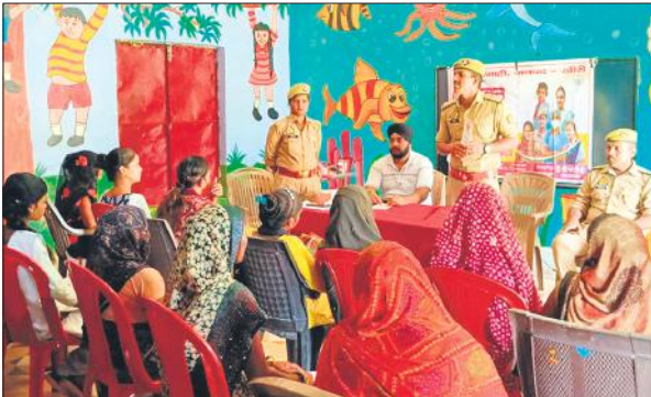
महिलाओं को जागरूक करती पुलिस।