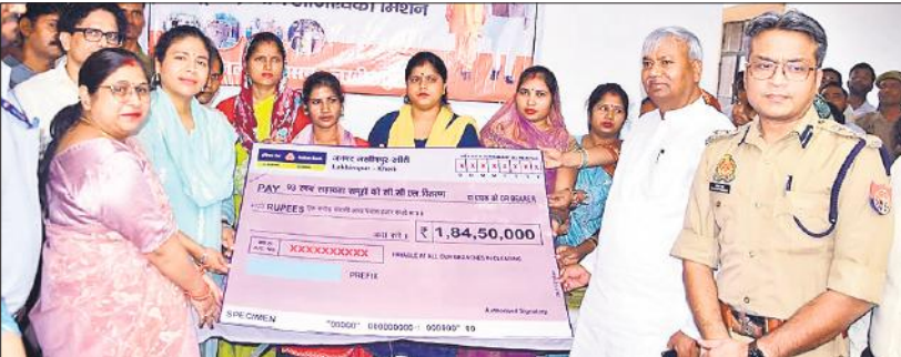
स्वयं सहायता समूहों को 1.84 करोड़ का सीसीएल का डेमो चेक देते पूर्व राज्यसभा सांसद और डीएम दुर्गा शक्ति नागपाल।

और राष्ट्रीय पारिवारिक लाभ योजना के करीब 100 लाभार्थियों को मिशन शक्ति सीएसआर किट प्रदान की। लाभ पाकर महिलाओं के चेहरे खुशी से खिल उठे। इसी के साथ पांच बेहतर कामकाज करने वाली आंगनबाड़ी