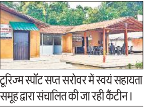
टूरिज्म स्पॉट सप्त सरोवर में स्वयं सहायता समूह द्वारा संचालित जा रही कैंटीन।

केंद्र सरकार की महत्वाकांक्षी लखपति दीदी योजना ने ग्रामीण और शहरी क्षेत्रों की महिलाओं के जीवन में बड़ा बदलाव लाया है। इस योजना के तहत हजारों महिलाएं न केवल आर्थिक रूप से आत्मनिर्भर बनी हैं बल्कि कई ने मेहनत और लगन भी से लखपति का दर्जा भी हासिल किया है। यह योजना ग्रामीण महिलाओं को रोजगार और स्व-रोजगार के नए