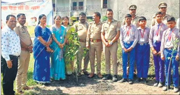
कार्यक्रम में मौजूद बच्चे, वनकर्मी व शिक्षक।

इस दौरान कई लोगों के वाहन भी जो जुलूस के संपन्न होने के बाद फंसकर रह गए। हालांकि शाम बैरिकेडिंग हटा दी गई।