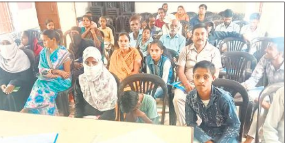
बीआरसी कंजा की गोष्ठी में मौजूद अभिभावक।