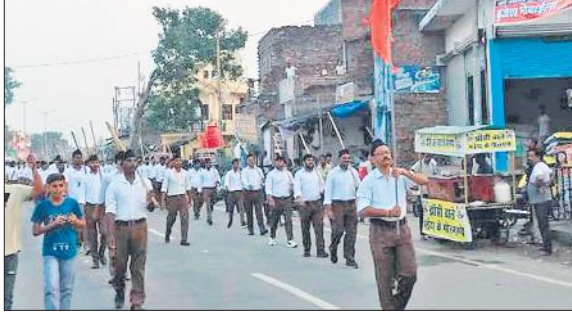
पथ संचलन में शामिल स्वयंसेवक।