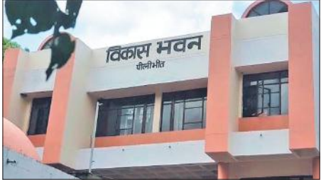
सभी 58 पंचायत सहायकों को नोटिस जारी कर निर्धारित समय में सर्वे कार्य पूरा करने के निर्देश दिए हैं। इसमें किसी तरह की लापरवाही बर्दाश्त नहीं की जाएगी। - रोहित भारती, डीपीआरओ

शासन द्वारा बीते अगस्त में एग्री स्टैक ( ई-खसरा पड़ताल) योजना के तहत जनपद में खरीफ फसलों को लेकर डिजिटल क्राप सर्वे करने के निर्देश दिए गए थे। पूर्व में डिजिटल क्राप सर्वे में राजस्व विभाग, कृषि एवं पंचायत राज विभाग के कर्मचारियों की ड्यूटी लगाई जाती थी। मगर,