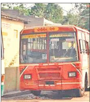
रोडवेज डिपो के बाहर खड़ी बस।

रोडवेज डिपो द्वारा 113 रोडवेज बसें का संचालन किया जा रहा था। यह बसें दिल्ली, आगरा, रुद्रपुर, आगरा, लखनऊ, वाराणसी सहित अन्य मार्गों पर चलाई जा रही थी। करीब पखवाड़ा भर पहले समयावधि पूरी कर चुकी 19 बसें को रोडवेज बेड़े से हटाते हुए उन्हें कंडम घोषित करते हुए मुख्यालय भेज दिया गया था। ऐसे में डिपो के बेड़े में मात्र 94 बसें का ही संचालन किया जा रहा है। बसें की संख्या कम होने से जहां परिवहन व्यवस्था लड़खड़ा रही थी, वही रोडवेज डिपो को आर्थिक नुकसान भी उठाना पड़ रहा था। इसको लेकर डिपो के अधिकारियों द्वारा पूर्व में मुख्यालय स्तर पर प्रस्ताव भेजकर नई बसें भिजवाने की मांग की गई