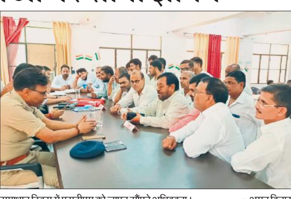
समाधान दिवस में एसडीएम को ज्ञापन सौंपते अधिवक्ता।

बार एसोसिएशन ने चेतावनी दी कि अगर समस्याओं का समाधान शीघ्र नहीं किया गया तो अधिवक्ता आंदोलन के लिए बाध्य होंगे। ज्ञापन देने वालों