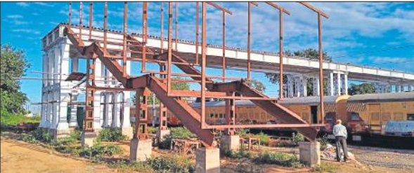
शनिवार को फुट ओवरब्रिज के काम में तेजी दिखाई दी।