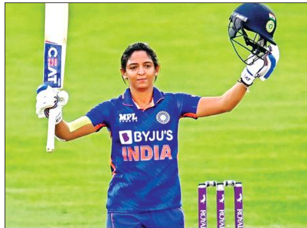
भारतीय महिला क्रिकेट टीम की कप्तान हरमनप्रीत।

दीप्ति शर्मा की ऑलराउंड कला और अमनजोत कौर के साहसिक अर्धशतक की बदौलत, अपने पहले मैच में मेजबान श्रीलंका को डकवर्थ लुईस नियम के तहत 59