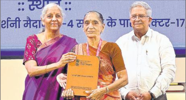
गुजरात में आपकी पुंजी आपका अधिकार नामक राष्ट्रव्यापी जागरूकता अभियान का शुभारंभ करती केंद्रीय वित्त मंत्री निर्मला सीतारमण व अन्य।

सीतारमण ने गुजरात के वित्त मंत्री कनुभाई देसाई, बैंकों और वित्त मंत्रालय के वरिष्ठ अधिकारियों की उपस्थिति में गांधीनगर से तीन महीने के 'आपकी पूंजी, आपका अधिकार' अभियान का शुभारंभ किया। केंद्रीय मंत्री ने कहा कि बैंकों और नियामकों के पास बैंक जमा, बीमा, भविष्य निधि या शेयरों के रूप में 1.84 लाख करोड़ की वित्तीय संपत्तियां बिना दावे के पड़ी हैं। उन्होंने अधिकारियों से तीन महीने के अभियान के दौरान बिना दावे वाली संपत्तियों को उनके मालिकों तक पहुंचाने के लिए तीन