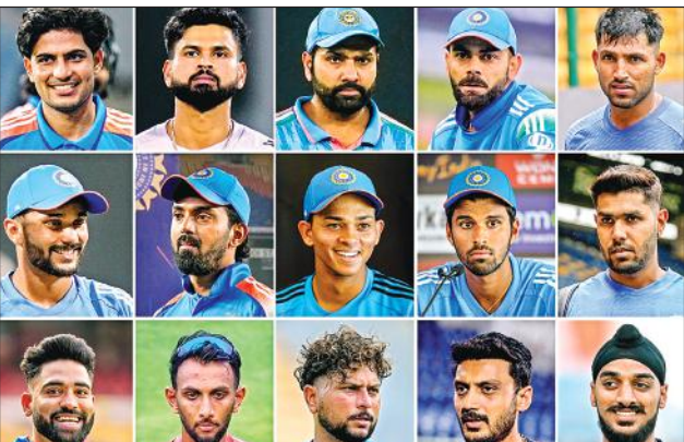
ऑस्ट्रेलिया के खिलाफ एकदिवसीय मुकाबले के लिए चयनित भारतीय खिलाड़ी।

टेस्ट टीम के बाद वन-डे टीम की भी कप्तानी शुभमन गिल को सौंपी गई। ऑस्ट्रेलिया दौरे के लिए चयनित गिल की अगुवाई वाले वनडे टीम में रोहित शर्मा और विराट कोहली शामिल हैं। श्रेयस अय्यर को टीम का उपकप्तान नियुक्त किया गया है। रोहित और कोहली चैंपियंस ट्रॉफी फाइनल के बाद पहली बार भारतीय टीम के लिए खेलते नजर आएंगे। हार्दिक पांड्या स्ट्रेन इंजरी के चलते वनडे और टी20 टीम से बाहर हैं। वहीं जसप्रीत बुमराह को वनडे टीम से आराम दिया गया है, हालांकि बुमराह टी20 टीम में शामिल हैं। मोहम्मद सिराज की वनडे टीम में वापसी हुई है। रवींद्र जडेजा वनडे टीम