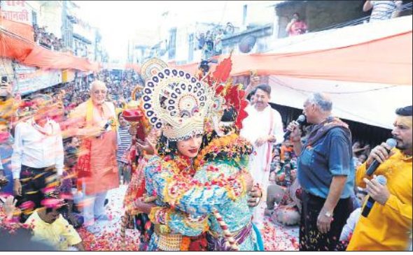
खिरनी बाग की ऐतिहासिक श्रीरामलीला में श्रीराम और भरत मिलाप का मंचन करते कलाकार।

तरह शिया सेंट्रल वक्फ बोर्ड द्वारा एप्रूवर, चेकर, मेकर्स व कोआर्डिनेटर नामित किए गए हैं। सुन्नी वक्फ बोर्ड के पास 2585 और शिया बोर्ड के पास चार वक्फ संपत्तियां हैं। इसमें पूर्व में कराए गए सर्वे के दौरान 749 वक्फ संपत्तियां ऐसी पाई गई हैं, जो राजस्व अभिलेखों में सरकारी