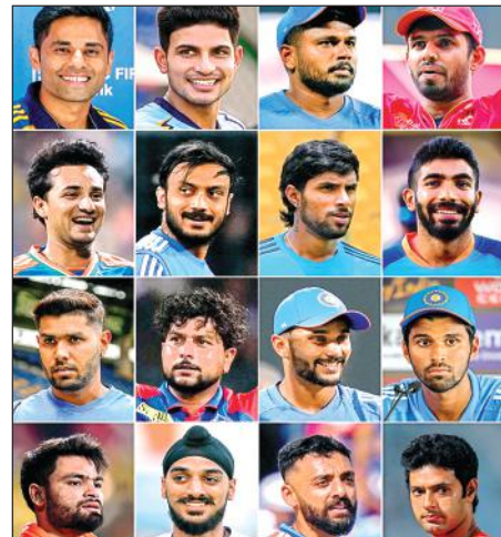
टी-20 मुकाबले के लिए चयनित भारतीय खिलाड़ी।

चाहिए। सिर्फ चयनकर्ताओं के लिए ही नहीं कोच के लिए तीन अलग-अलग लोगों के साथ काम करना आसान नहीं रहता। जडेजा के वनडे टीम में शामिल नहीं होने पर आगरकर ने कहा कि ऑस्ट्रेलिया में अधिक वनडे नहीं खेलने थे, इसलिए वहां की परिस्थितियों के लिहाज से टीम में अधिक स्पिनरों की जरूरत नहीं थी। हार्दिक इस समय ऑस्ट्रेलिया दौरे के लिए फिट नहीं थे। ऑस्ट्रेलिया में भारत को तीन वनडे मैचों की सीरीज खेलनी जो कि 19 अक्टूबर से शुरू होगा और 25 अक्टूबर को वनडे सीरीज का अंतिम मैच खेला जाएगा। वहीं पांच मैचों की टी20 सीरीज का आगाज 29 अक्टूबर को होगा और आठ नवंबर को सीरीज का अंतिम मैच खेला जाएगा।