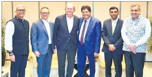
सिंगापुर में निवेशकों के साथ केंद्रीय मंत्री पीयूष गोयल।

खरीदते हैं, अब 18% जीएसटी पर माल लगे। शून्य जीएसटी पर काँपी बेचने से उनकी लागत बढ़ेगी, जिससे काँपी की कीमतें बढ़ेंगी। व्यापारियों का कहना है कि बड़े उद्योगपति मिलों से सीधे कागज खरीदकर लाभ उठा सकते हैं, लेकिन छोटे व्यापारी इससे वंचित रहेंगे। इससे कुटीर उद्योग बंद होने की कगार पर हैं।