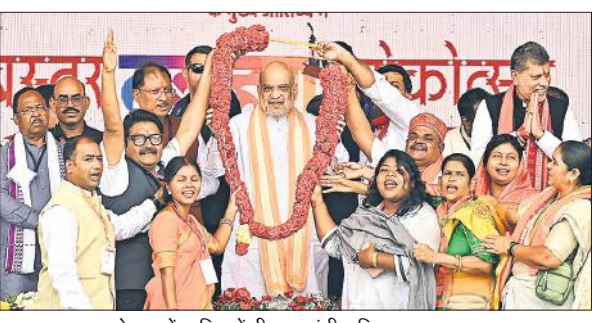
बस्तर दशहरा महोत्सव में शामिल केंद्रीय गृह मंत्री अमित शाह।

जगदलपुर, एजेंसी केंद्रीय गृह मंत्री अमित शाह ने शनिवार को माओवादियों से किसी भी तरह से बातचीत की संभावना से इन्कार करते हुए कहा कि वे आत्मसमर्पण करें और विकास में सहभागी बनें। शाह ने जगदलपुर के लालबाग परेड मैदान में आयोजित बस्तर दशहरा लोकोत्सव, 2025 और स्वदेशी मेला को संबोधित करते हुए एक बार फिर 31 मार्च 2026 तक देश से नक्सलवाद के खاتم्वे के संकल्प को दोहराया। गृह मंत्री ने कहा कि हथियारों के बल पर बस्तर की शांति भंग करने वालों को सुरक्षा बल मुंहतोड़ जवाब देंगे। शाह ने कहा कि मैं सभी आदिवासी भाइयों बहनों को कहना चाहता हूं कि आपके काम के युवाओं को हथियार डालने के लिए समझाइए। वह हथियार डाल दे, मुख्यधारा में आएँ तथा बस्तर