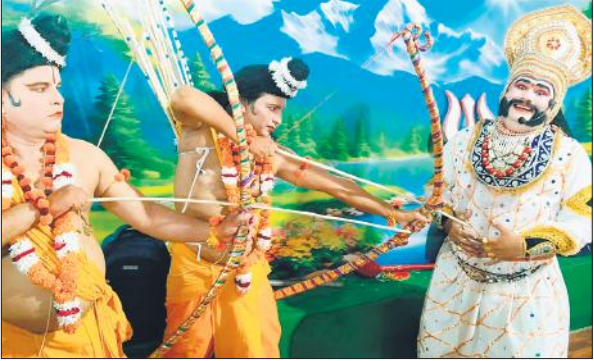
ओसीएफ स्टेट श्री रामलीला में रावध वध का मंचन करते कलाकार।

युद्धभूमि में श्रीराम और रावण के बीच घमासान मचा। रावण ने अपनी अपार शक्ति का परिचय देते हुए देवों और असुरों को भी भयभीत कर दिया। अंततः प्रभु श्रीराम ने ब्रह्मास्त्र का संधान कर रावण का वध किया। रावण भूमि पर गिरा, प्रभु श्री राम अपने अनुज लक्ष्मण से रावण से ज्ञान लेने को कहते हैं, तब स्वयं रावण ने उन्हें नीति और