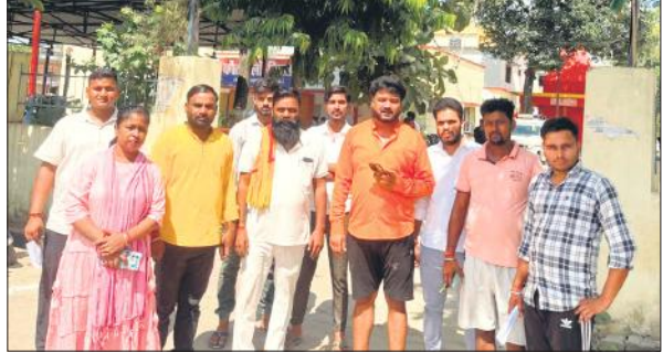
दोषियों पर कार्रवाई की मांग को लेकर तिलहर कोतवाली के बाहर खड़े गोरक्षक।