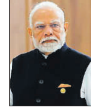
गए सभी प्रयासों का दृढ़ता से समर्थन करता रहेगा। ट्रंप ने इजराइल और हमस के बीच दो वर्ष से जारी युद्ध को समाप्त कराने की एक शांति योजना पेश की थी।

नई दिल्ली। प्रधानमंत्री नरेन्द्र मोदी ने शनिवार को कहा कि गाजा में शांति प्रयासों में निर्णायक प्रगति के बीच भारत अमेरिकी राष्ट्रपति डोनाल्ड ट्रंप के नेतृत्व का स्वागत करता है। प्रधानमंत्री मोदी ने चमसपंथी संगठन हमस की ओर से इजराइली बंधकों की रिहाई के संकेतों का उल्लेख किया और कहा कि यह क्षेत्र में शांति बहाल करने के प्रयासों में एक महत्वपूर्ण कदम है। उन्होंने एक्स पर कहा कि भारत शांति की दिशा में किए गए सभी प्रयासों का दृढ़ता से समर्थन करता रहेगा। ट्रंप ने इजराइल और हमस के बीच दो वर्ष से जारी युद्ध को समाप्त कराने की एक शांति योजना पेश की थी।