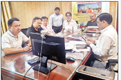
अधिशासी अभियंता से बातचीत करते अमीनाबाद के व्यापारी।