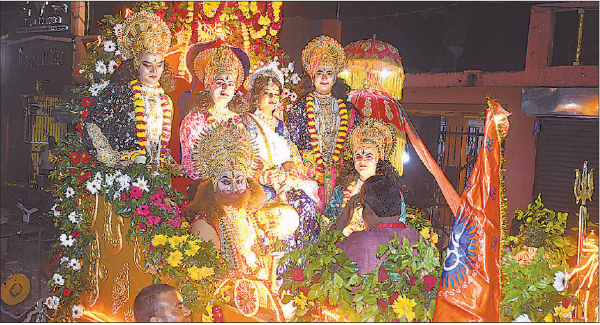
ऐशबाग रामलीला कमेटी की ओर से निकाली गई नगर दर्शन यात्रा में मां जानकी, चारों भाइयों, हनुमानजी के साथ रथ पर विराजमान अयोध्या के राजा रामचंद्र के स्वरूप।

छह घोड़ों से सजे रथ पर निकाली गई राजा रामचंद्र की शोभायात्रा ,दर्शन के लिए सड़क के दोनों किनारों और छतों पर जुटी भीड़