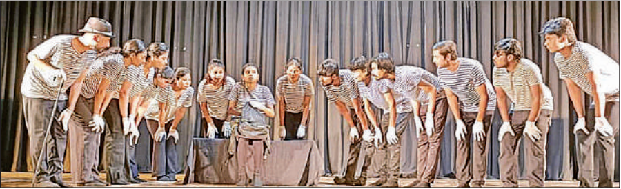
मुकाभिनय नाटक रंग बदरंग का मंचन करते कलाकार।

अखिल भारतीय सांस्कृतिक संस्थान ने तीन दिवसीय गांधी जयंती नाट्य महोत्सव का आयोजन किया। नाटक रंग बदरंग में प्रसंशकों के बीच लोकप्रिय खुशमिजाज और मस्ती भरे युवक चार्ली का जन्मदिन मनाया जाता है। दोस्त और एक खास प्रशंसक घर में बर्थडे सेलिब्रेशन कर रहे होते हैं, चारों