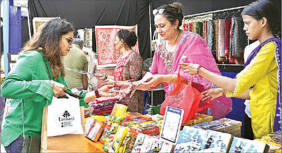
फिक्की फलो के मेले में लगे मूक बधिर महिलाओं के स्टाल पर उत्पाद खरीदती महिला।

अमृत विचार : खादी ग्राम उद्योग भवन डालीबाग में लगाए गए कारीगर मेले में मूक बंधिक महिलाओं बनाए गए उत्पादों ने ग्राहकों का सबसे ज्यादा ध्यान खींचा। कैंडिल से लेकर घर की सजावट की वस्तुएं की खूबसूरती को लोग देखते ही रह गए। मेले के अंतिम दिन शनिवार को अंतिम दिन खरीददारों की खूब भीड़ उमड़ी। गांधी जयंती के उपलक्ष्य में फिक्की फलो लखनऊ चैप्टर ने खादी ग्राम उद्योग भवन डालीबाग में कारीगर मेला-2025 का आयोजन किया गया। इसमें देश एवं प्रदेश की विविध शिल्प परंपराओं के कारीगरों की कृतियों को प्रदर्शित और विक्रय करने के लिए स्टाल लगाए गए थे। मूक बधिर महिलाओं द्वारा संचालित