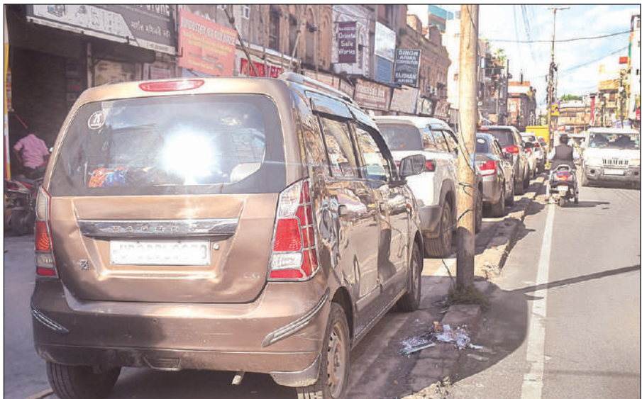
कैसरबाग चौराहे से चारबाग जाने वाली सड़क के डिवाइडर के पास खड़ी कारें।

कैसरबाग चौराहे से चारबाग जाने के लिए लाटूश रोड एक अहम मार्ग है। कैसरबाग चौराहे से चारबाग की दूरी लगभग 1.5 से 2 किलोमीटर है। जाम के कारण यह दूरी तय करने में लोगों को आधे घंटे से भी अधिक समय लग जाता है। लाटूश रोड पर मेडिसिन मार्केट के पास बीच-बीच में कट, श्रीराम चौराहा और बांसमंडी चौराहे तक जाम की समस्या बनी रहती है। इससे व्यापार बुरी तरह प्रभावित रहता है। ग्राहक इस रोड पर खरीदारी करने आने से बचते हैं। ट्रैफिक विभाग से लेकर नगर निगम के जिम्मेदार यहां कभी झांकने तक नहीं आते।