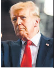
प्रधानमंत्री बेंजामिन नेतन्याहू के साथ हुई बातचीत के बाद गाजा पड़ी युद्ध समाप्त कराने के लिए एक योजना पेश की थी।

सिद्धांतों के अनुसार युद्ध खत्म करने के लिए ट्रंप को पूरा सहयोग देगा। हमस की ओर से जारी एक बयान में कहा गया है कि गाजा के भविष्य और फलस्तीनी अधिकारों से संबंधित प्रस्ताव के पहलुओं पर निर्णय अन्य गुटों की सर्वसम्मति और अंतर्राष्ट्रीय कानून के आधार पर लिया जाएगा। बयान में हमस के हथियार डालने के बारे में कोई उल्लेख नहीं किया गया है, जो ट्रंप के प्रस्ताव में शामिल इजराइल के एक प्रमुख मांग थी। मुख्य मध्यस्थों