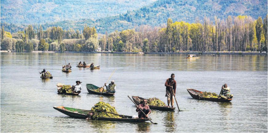
नाविको ने शनिवार को जम्मू-कश्मीर की राजधानी श्रीनगर में स्थित डल झील से खरपतवार हटाने का काम किया। इस विश्व प्रसिद्ध झील में शिकारे की सैर करने हर साल बड़ी संख्या में देश-विदेश से पर्यटक आते हैं।