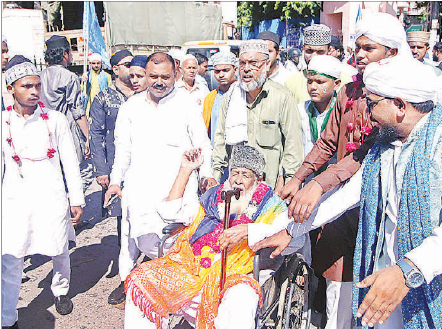
यारहवीं पर शाहीमा शाह की मजार से मेडिकल कॉलेज स्थित दरगाह हरमैन तक निकाले गए जुलूस-ए-गोसिया में शामिल मुस्लिम धर्मगुरु और धर्मावलंबी।