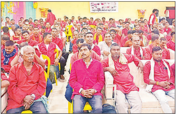
राष्ट्रीय कुली मोर्चा की बैठक में मौजूद कुली।