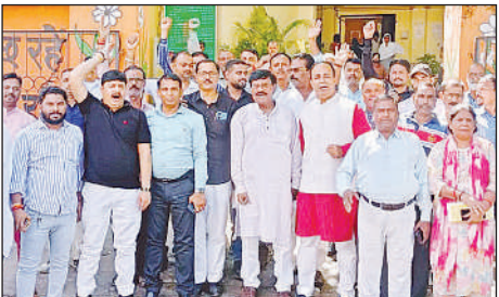
गेट मीटिंग करते नगरीय निकाय कर्मचारी।