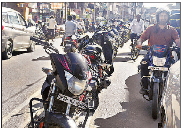
कैसरबाग चौराहे से चारबाग जाने वाली सड़क के बीच में खड़ी बाइकें।

अमृत विचार : कैसरबाग चौराहे से चारबाग जाने वाली सड़क पर डिवाइडर छोटे कर दिए गए और साइड में वाहन खड़े किए जा रहे हैं। दोनों ओर दुकानों के बाहर दुकानदार वाहन खड़े करते हैं और उसके बाद दवा खरीदने आए लोग सड़क तक वाहन पार्क कर देते हैं। इससे लाटूश रोड चौराहे से कैसरबाग तक दिन भर जाम की स्थिति बनी रहती है। व्यापारियों के साथ इस मार्ग से निकलने वाले लोग भी परेशान हैं। चारबाग और अमीनाबाद को जोड़ने वाले इस मार्ग पर वैसे ही ट्रैफिक का जबरदस्त दबाव रहता है। उसके बाद सड़क पर खड़े, वाहन खड़ करने से मुश्किलें बढ़ जाती हैं। बावजूद इसके न तो पुलिस का ध्यान है और न ही यातायात विभाग के जिम्मेदारों का। त्योहारी सीजन होने के कारण दिनभर जाम रहता है।