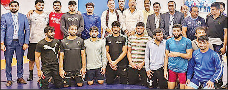
संघ के पदाधिकारियों और चयन समिति के साथ चुनी गई कुश्ती टीम के खिलाड़ी।

इस ट्रायल में एक-एक कर सभी पहलवानों ने मैट पर अपने दांव-पेंच आजमाये और अपना दमखम दिखाया। चार घंटे तक चले इस ट्रायल में फ्री-स्टाइल और ग्रीकोरोमन दोनों वर्गों में मुकाबले आयोजित किए गए। कुल मिलाकर ग्रीकोरोमन वर्ग के 36 और फ्री-स्टाइल वर्ग के 18 मुकाबले खेले गए। भारतीय कुश्ती संघ की देखरेख में आयोजित इस चयन ट्रायल में