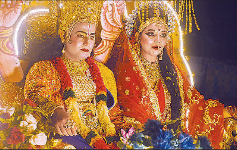
ऐशबाग रामलीला कमेटी की ओर से निकाली गई श्रीराम की नगर दर्शन शोभायात्रा में शामिल रथ पर सवार लक्ष्मी-नारायण, सुग्रीव, अंगद व वानर सेना और उर्मिला, मंडवी एवं श्रुतकीर्ति के स्वरूपों की झांकियां।