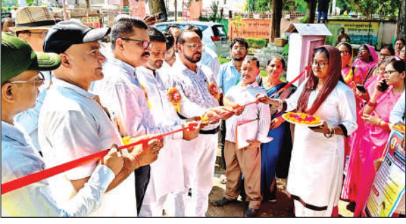
फीता काटकर अभियान की शुरुआत करते सीडीओ और चेयरमैन।

गौरतलब हो कि शासन के निर्देश पर संचारी रोग नियंत्रण अभियान 05 से 31 अक्टूबर तक एवं दस्तक अभियान 11 से 31 अक्टूबर तक संचालित किया जायेगा। जिसमें