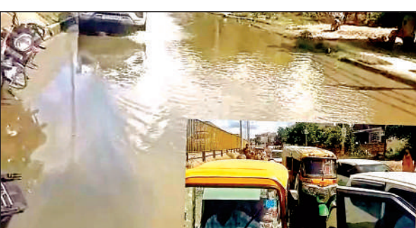
मोहल्ले में भरा गन्दा पानी व लगा जाम (इनसेट) ।

स्थानीय लोगों का आरोप है कि नगर पालिका, जिलाधिकारी और नेशनल हाईवे अथॉरिटी ऑफ इंडिया को इस समस्या से अवगत कराने के लिए लिखित प्रार्थना पत्र दिए गए, लेकिन कोई सुनवाई नहीं हुई। समस्या जस की तस बनी हुई है। मोहल्लेवासियों ने एकजुट होकर सर्विस रोड पर जाम लगा दिया। जाम की सूचना पर आईटीआई चौकी