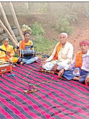
सत्संग में भजन प्रस्तुत करते भक्त।