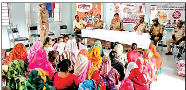
जन चौपाल में जानकारी देते क्षेत्राधिकारी व अन्य।

● पुलिस क्षेत्राधिकारी ने सुरक्षा के साथ हेल्पलाइन नंबरों के बारे में विस्तार से जानकारी दी