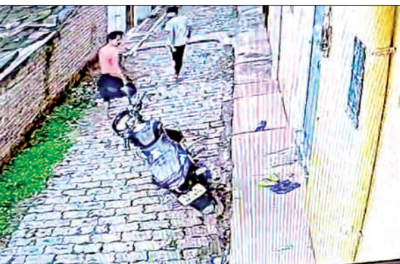
जाते समय सीसीटीवी कैमरे में कैद हुए आरोपी।