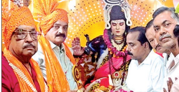
भगवान भोले नाथ की आरती उतारते समिति के लोग ।