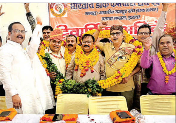
नवनिर्वाचित पदाधिकारियों का माल्यार्पण कर स्वागत करते कर्मचारी ।