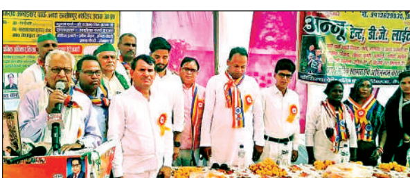
चिंतन शिविर में बोलते मुख्य अतिथि व मौजूद अन्य लोग ।

मठ पर देर रात संपन्न हुई। यात्रा में डेडू दर्जन आकर्षक झांकियों जिनमें धार्मिक सांस्कृतिक, और राष्ट्रीय रंग देखने को मिले। भोले भंडारी का परिवार, विष्णु भगवान ,नरसिंह अवतार, राधा कृष्ण की रास मंडल की झांकी, भारत माता की झांकी पर लहराता तिरंगा, गरुड भगवान,कमल पर विराजित देवी लक्ष्मी,माता वैष्णो देवी यात्रा,देवी के नौ रूपों की झांकियां, कालीमाता, दुर्गा माता आदि की झांकियां श्रद्धालुओं के आकर्षण का मुख्य केंद्र रही।