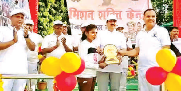
विजेता पुलिस महिला ट्रेनी को सम्मानित करते डीएम व एसएसपी ।