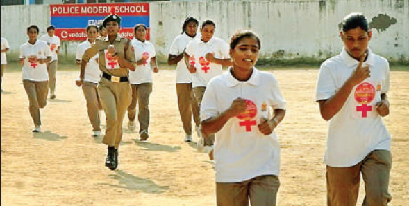
मैराथन दौड़ में प्रतिभाग करती महिला ट्रेनी पुलिस कर्मी ।