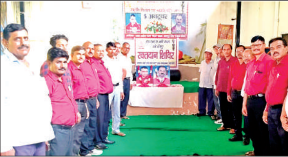
शिविर में मौजूद सम्राट अशोक क्लब के सदस्य।

● मेडिकल कॉलेज ब्लड बैंक व डॉक्टर्स की टीम रही मौजूद