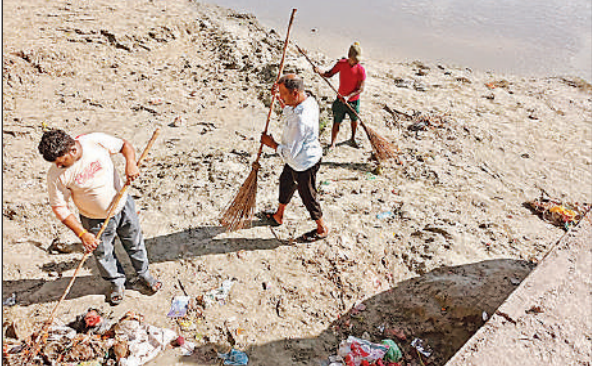
घाटों की साफ-सफाई करते पालिका कर्मी ।