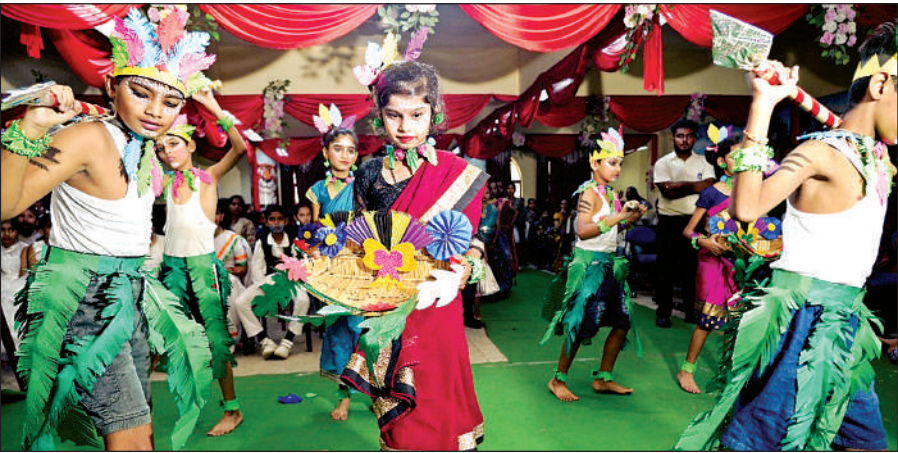
चिड़ियाघर में रंगरंग कार्यक्रम पेश करते बच्चे।