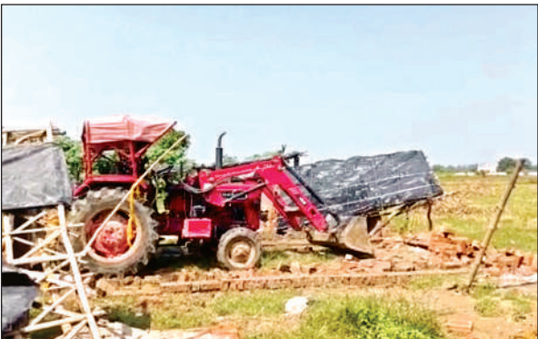
सरकारी भूमि से कब्जा हटाना ट्रैक्टर।