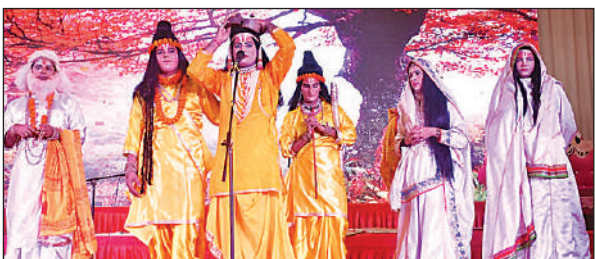
रामलीला का मंचन करते पात्र ।

अधिकारी की अध्यक्षता में टीम गठित कर दवाओं की गुणवत्ता की जांच कराने को कहा गया । उन्होंने पुलिस प्रशासन द्वारा चलाए जा रहे 'मिशन शक्ति फेज 5.0' की समीक्षा करते हुए एंटी रोमियो स्कॉड की कार्रवाई तेज करने, सराहनीय कार्य करने वाली महिलाओं का सम्मान करने, शक्ति केंद्रों की स्थापना और महिला अपराधों से संबंधित हॉट स्पॉट इलाकों की सीसीटीवी निगरानी सुनिश्चित करने के निर्देश दिए । प्रभारी मंत्री ने कहा कि वित्तीय वर्ष 2025-26 के लिए आवंटित बजट का पूर्ण सदुपयोग किया जाए और सभी योजनाओं को निर्धारित समय सीमा के भीतर पूरा किया