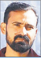
ट्रवल प्लाइट फेसबुक

क्या आप जानते हैं कि एक ऐसी किताब भी है, जिसे कोई भी इंसान अपनी पूरी ज़िंदगी में कभी पूरा नहीं पढ़ सकता और उसमें सिर्फ 10 पन्ने हैं? 1960 में, फ्रेंच लेखक रेयमों क्वेनो (Raymond Queneau) ने शायद दुनिया की सबसे लंबी किताब पेश की थी। इसका नाम है Cent mille milliards de pomes यानी एक लाख अरब कविताएं। यह किताब मात्र दस पन्नों की है और हर पन्ने पर एक सॉनेट (Sonnet) छपा हुआ है। इन कविताओं की पंक्तियां एक ही तुकबंदी पैटर्न को साझा करती हैं और इन्हें स्ट्रिप्स (पट्टियों) पर छापा गया है, जिससे पाठक अलग-अलग सॉनेट की पंक्तियों को आपस में मिलाकर नई कविताएं बना सकते हैं।