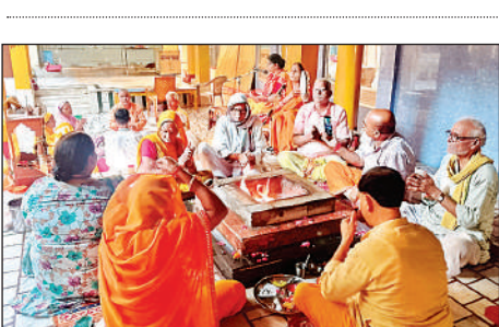
यज्ञ में आहुतियां डालते श्रद्धालु ।