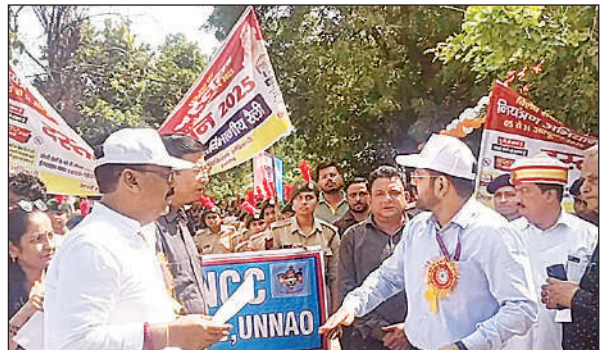
कैटेड्स को स्वच्छता रखने की शपथ दिलाते डीएम व विधायक ।

किसी को दिक्कत नहीं है । लेकिन जब कोई हिंसा करता है तो कानून इसका जवाब देगा । विपक्ष के आरोपों पर तीखा पलटवार करते हुए मंत्री ने अखिलेश यादव के लोकतंत्र की हत्या वाले बयान की पूरी तरह निराधार बताया । उन्होंने कहा भाजपा सरकार पूरी तरह न्यायसंगत और पारदर्शी है । यह राजनीति का स्वर्णिम युग है । प्रधानमंत्री मोदी कर्मयोगी हैं और मुख्यमंत्री योगी आदित्यनाथ जनयोगी हैं । यह योगियों की सरकार है दोगियों की नहीं । मंत्री ने कहा कि केंद्र और राज्य सरकार जनता की सुरक्षा न्याय और विकास के लिए प्रतिबद्ध हैं ।