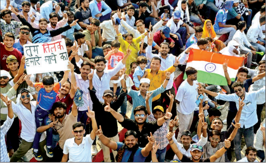
भारत एं और आस्ट्रेलिया ए का मैच देखने के लिए दर्शक जोश में रहे।