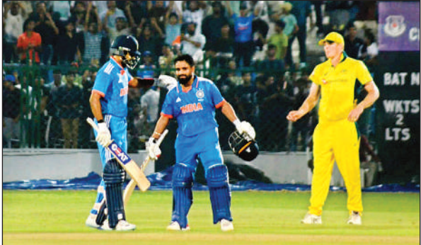
शतकवीर भारतीय बल्लेबाज को दी बधाई।