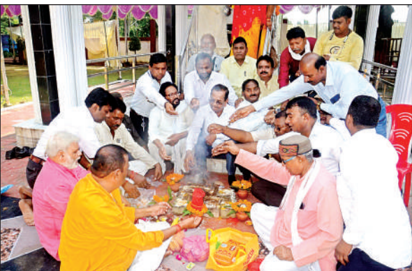
पूजा करते समिति के पदाधिकारी।