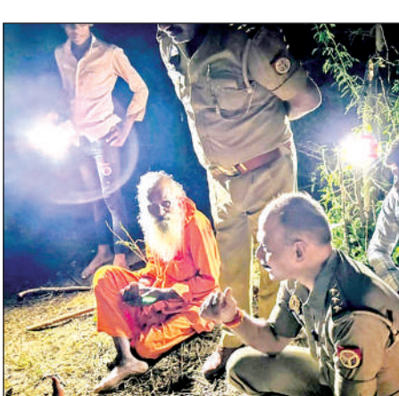
घटना की जानकारी लेते पुलिस के अधिकारी।