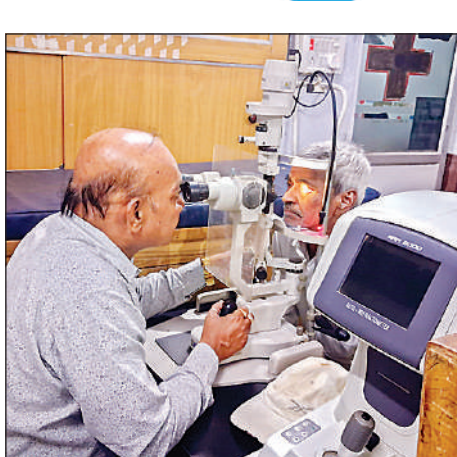
मरीज की आंखों की जांच करते डॉक्टर ।