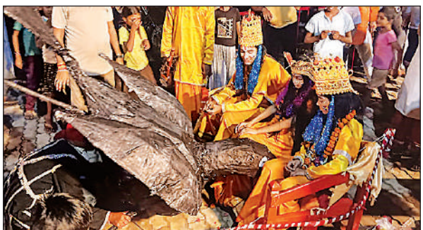
शंकरपुर रामलीला में जयंत लीला का मंचन करते पात्र ।