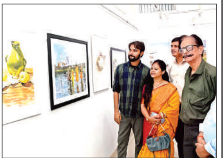
गुरुकुल में पेंटिंग देखते अतिथि।