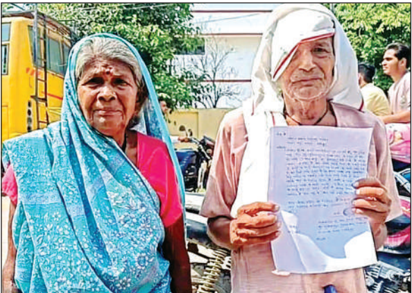
कोतवाली में शिकायत करने पहुंचे बुजुर्ग दंपती।

● पीड़ित दंपती ने कोतवाली में तहरीर देकर लगाई गुहार