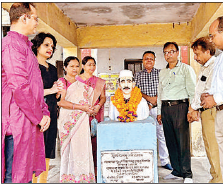
डीएसएन कॉलेज में चित्र पर माल्यापण के बाद खड़े अतिथि ।