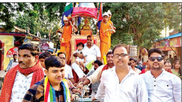
रथ यात्रा में शामिल श्रद्धालु।