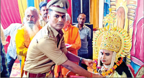
प्रभु श्रीराम का माल्यार्पण कर पूजन करते पुलिसकर्मी।