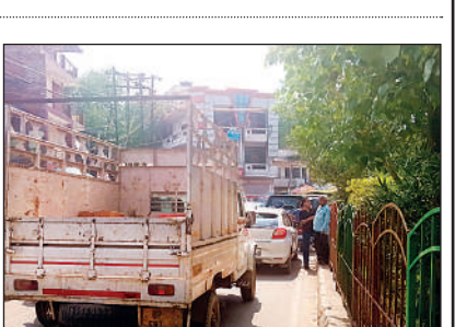
जाम में फसे वाहन ।

शुक्लागंज । रविवार दोपहर पानी रोड तिराहे के पास ई-रिक्शों के आड़े तिरहे खड़े रहने से फोरलेन मार्ग पर करीब एक घंटे तक जाम लग गया । इस दौरान कानपुर जाने वाले लोगों को बड़ी परेशानी का सामना करना पड़ा । ई-रिक्शों की वजह से यह समस्या रोजाना देखने को मिल रही है, बावजूद इसके जिम्मेदार अभी तक इस ओर ध्यान नहीं दे रहे हैं । बालूघाट मोड़ के पास पालिका द्वारा टोपो स्टैंड का निर्माण कराया गया है, लेकिन यह अभी तक संचालित नहीं हो सका है । लोग अपील कर रहे हैं कि ई-रिक्शा और टोपो स्टैंड की उचित व्यवस्था कराई जाए ।