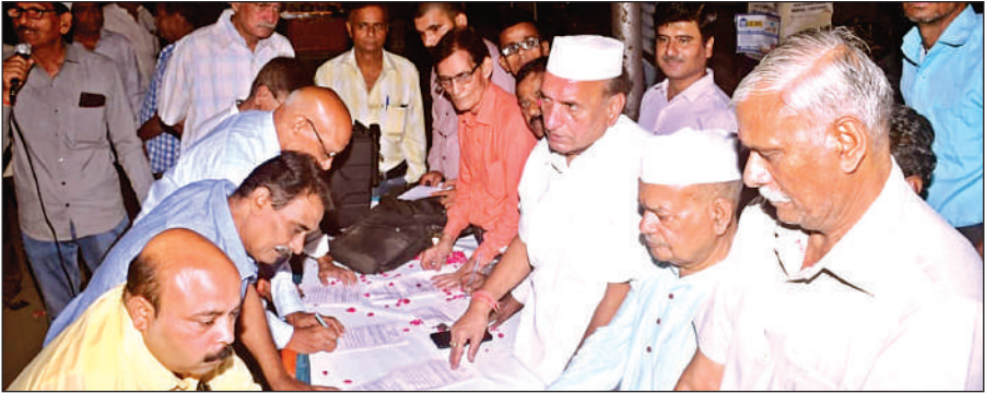
गुमटी नंबर पांच में हस्ताक्षर अभियान में लगी भीड़।

कई गंभीर मुद्दों और चुनौतियों पर भी ध्यान आकर्षित किया जाएगा। इसके अलावा युवा नाटकों के जरिए युवाओं की समस्याओं और देश की सांस्कृतिक खूबियों पर भी ध्यान आकर्षित कराएंगे।