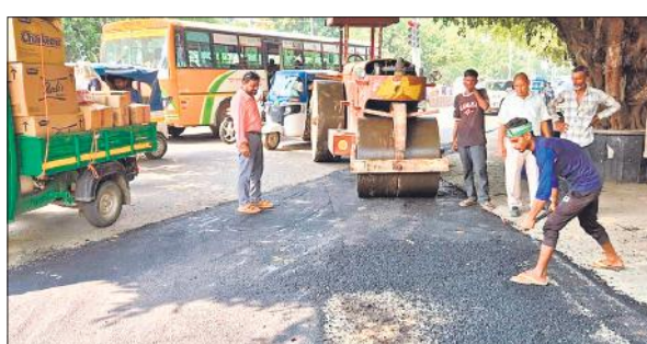
पीएसी तिराहे पर गड्ढों की मरम्मत करते मजदूर।

रविवार को लोक निर्माण विभाग के अधीक्षण अभियंता एस पी सिंह ने बताया कि इस अभियान के तहत पीएसी तिराहा से भटावली गांव तक की 9 किलोमीटर की सड़क के गड्ढों को भरने का कार्य शुरू कर दिया गया है। मरम्मत कार्य के दौरान बजरी और कोलतार डालकर गड्ढों को