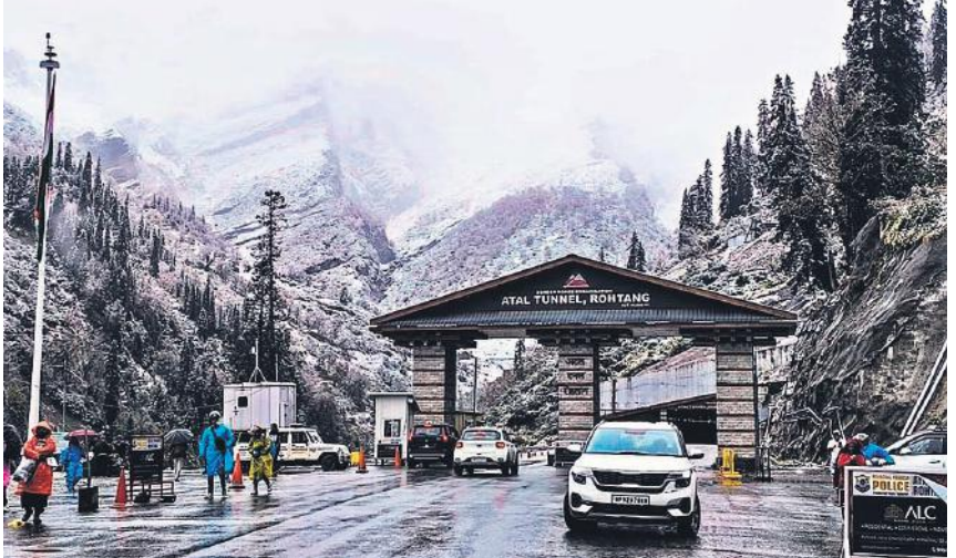
हिमाचल प्रदेश के रोहतांग में रविवार को बर्फबारी हुई, जिसका पर्यटकों ने लुफ्त उठाया। अटल सुरंग से गुजरने वालों ने यहां वाहन रोक कर तस्वीरें कैमरे में कैद कीं। मानसून की वापसी के बाद यहां पर्यटकों की आमद भी बढ़ गई है।