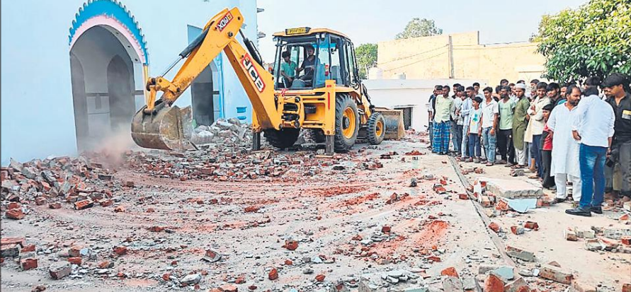
संभल के राया बुजुर्ग गांव में मस्जिद का अवैध निर्माण तोड़ता बुलडोजर ।