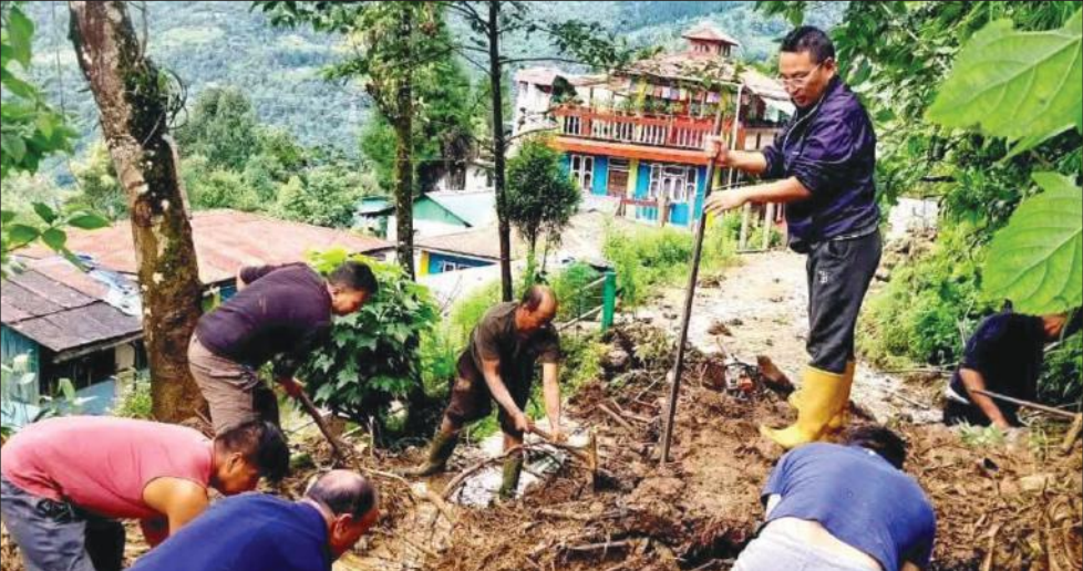
दार्जिलिंग में भारी बारिश के कारण हुए भूस्खलन के बाद राहत कार्य में जुटी प्रशासनिक टीम।

एनडीआरएफ और जिला प्रशासन की रिपोर्ट के अनुसार, सरसली, जसबीरागांव, मिरिक बस्ती, धार गांव (मेची), नागराकाटा और मिरिक झील क्षेत्र से लोगों के मारे जाने की खबर है। दार्जिलिंग उपमंडल अधिकारी ने बताया कि पुलिस, स्थानीय प्रशासन और आपदा प्रतिक्रिया टीम की मदद से बचाव और राहत अभियान जारी है। मुख्यमंत्री ममता बनर्जी ने पीड़ितों के लिए मुआवजे की घोषणा की है। वह 6 अक्टूबर को उत्तर बंगाल का दौरा करेंगी और क्षेत्र की स्थिति का आकलन करेंगी, जहां बड़ी संख्या में पर्यटक भी प्रभावित हुए हैं। उत्तर बंगाल विकास मंत्री उदयन गुहा ने स्थिति को चिंताजनक बताया और रिपोर्ट