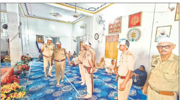
गुरुद्वारे में मौजूद लोग और मौजूद पुलिस बल ।

क्षेत्र में चर्चित पसियापुरा स्थित शहीद बाबा दीप सिंह गुरुद्वारे के स्वामित्व को लेकर करीब तीन वर्षों से दो पक्षों में विवाद चल रहा है। इसी विवाद को लेकर 15 सितंबर को दोनों पक्ष आमने-सामने आ गए थे। जहां पूरे दिन चले बवाल के दौरान डीएम और एसपी के ही सामने ही तीन राउंड फायरिंग होने के बाद इलाके को छावनी में तब्दील कर दिया था। वहीं, प्रशासन ने मामले को नियंत्रित करने के बाद गुरुद्वारे को कब्जे में ले लिया था। इसी बीच परंपरा के अनुसार रविवार को धार्मिक स्थल पर मत्था टेकने के लिए संगत पहुंची। मगर प्रशासन ने