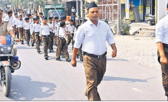
हल्लू सराय में पथ संचलन निकालते संघ के स्वयंसेवक ।