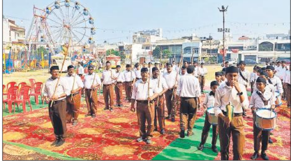
रामलीला मैदान में मौजूद स्वयंसेवक ।