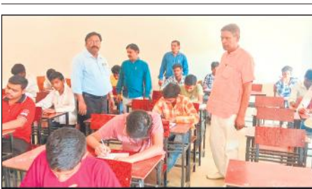
लंकाकांड प्रतियोगिता परीक्षा देते बच्चे।