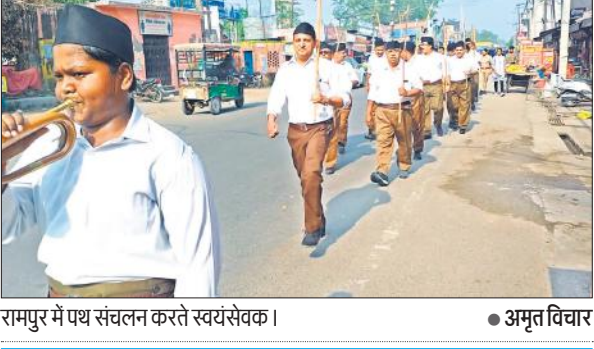
रामपुर में पथ संचलन करते स्वयंसेवक ।