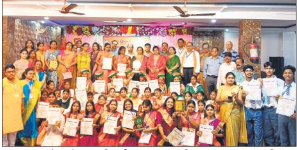
प्रमाण पत्र एवं मेडल के साथ प्रतिभागी छात्र-छात्राएं व शिक्षक ।