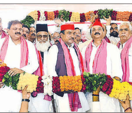
काकोरी में आयोजित सम्मेलन में उपस्थित सपा के पदाधिकारी।