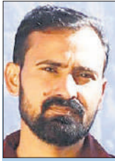
ट्रवल प्लाइट फेसबुक

क्या आप जानते हैं कि एक ऐसी किताब भी है, जिसे कोई भी इंसान अपनी पूरी ज़िंदगी में कभी पूरा नहीं पढ़ सकता और उसमें सिर्फ 10 पन्ने हैं? 1960 में, फ्रेंच लेखक रेयमों क्वेनो (Raymond Queneau) ने शायद दुनिया की सबसे लंबी किताब पेश की थी। इसका नाम है Cent mille milliards de pomes यानी एक लाख अरब कविताएं। यह किताब मात्र दस पन्नों की है और हर पन्ने पर एक सॉनेट (Sonnet) छपा हुआ है। इन कविताओं की पंक्तियां एक ही तुकबंदी पैटर्न को साझा करती हैं और इन्हें स्ट्रिप्स (पट्टियों) पर छापा गया है, जिससे पाठक अलग-अलग सॉनेट की पंक्तियों को आपस में मिलाकर नई कविताएं बना सकते हैं।