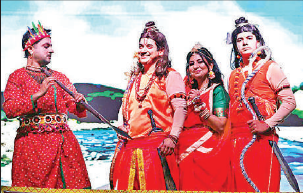
रामलीला का मंचन करते कलाकार।