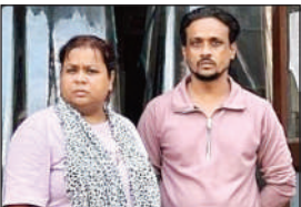
पकड़े गए आरोपी भाई-बहन।