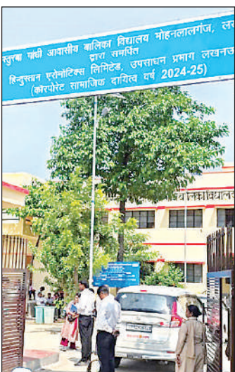
कस्तूरबा गांधी विद्यालय पहुंची जांच टीम।

क्या है मामला शनिवार को मोहनलालगंज तहसील में आयोजित संपूर्ण समाधान दिवस में