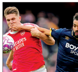
बाल के लिए जद्दोजहद करते आर्सेनल और वेस्ट हम यूनाईटेड के खिलाड़ी ।

38 गेंदों में 5 चौकों और 4 छक्के की मदद से तेज पचासा जड़ा। वहीं दूसरी दूसरी खड़े अभिषेक शर्मा ने अपने खेल के विपरीत धीमी बैटिंग की। अभिषेक शर्मा टॉड मर्फी की गेंद पर तनवीर सांधा को स्लिप प्लाइट पर कैच थमा बैठे। उन्होंने 25 गेंदों पर 2 चौकों की मदद से 22 रन बनाए। पिछले मैच में 94 रन बनाने वाले तिलक वर्मा भी जल्द आउट हो गए। 3 रन के स्कोर पर टॉड मर्फी ने उन्हें एलबीडब्ल्यू कर दिया। इसके बाद कप्तान श्रेयश अय्यर क्रोज पर प्रभसिमरन सिंह का साथ देने आए। प्रभसिमरन ने 66 बॉल में शानदार 101 रन बनाए। हालांकि शतक के तुरंत बाद वह तनवीर सांधा की गेंद पर सदरलैंड