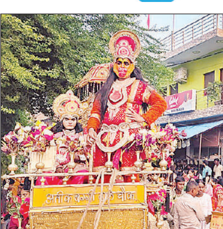
सरोजनीनगर के नटकुर गांव में निकाली गई झांकी।