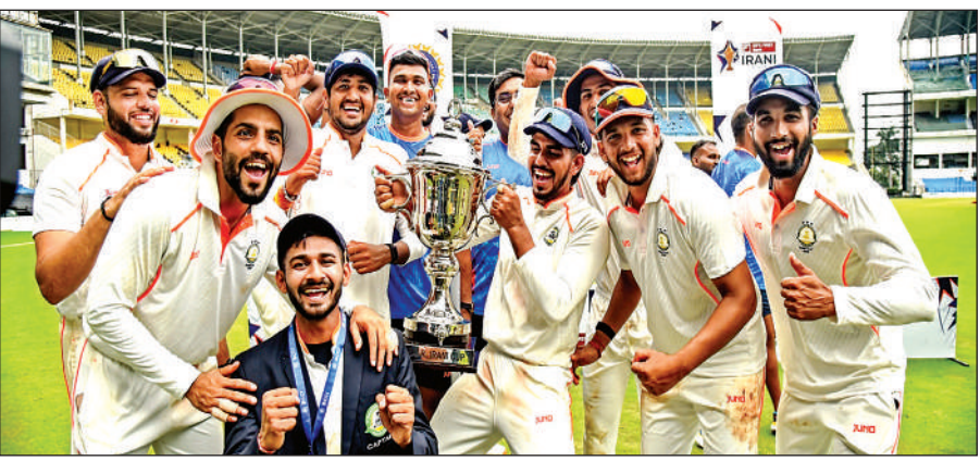
फाइनल में भारत को 93रनों से हराकर ईरानी कप जीतने की खुशी मनाते विदर्भ के खिलाड़ी ।

शेष भारत ने मैच के आखिरी दिन दो विकेट पर 30 रन से आगे