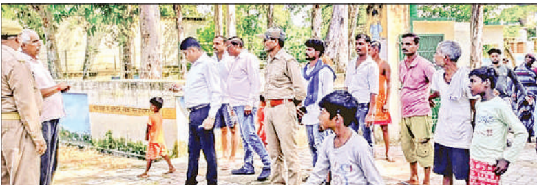
निगोहां के करनपुर प्राथमिक विद्यालय का निरीक्षण करती एसडीएम और वनविभाग की टीम।