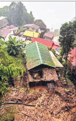
मिरिक-दार्जिलिंग मार्ग को जोड़ने वाला पुल क्षतिग्रस्त होने से फंसे लोग। दाएं : भूस्खलन के बाद क्षतिग्रस्त हुए मकान।