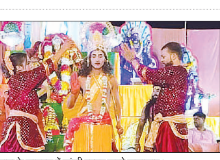
माता के जागरण में झांकी प्रस्तुत करते कलाकार।