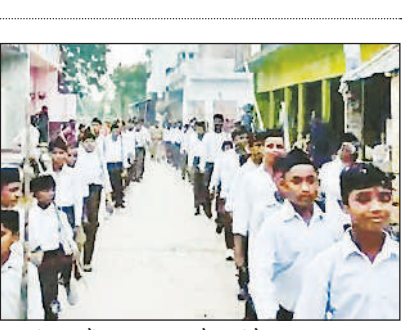
पथ संचलन में कदमताल करते स्वयंसेवक।