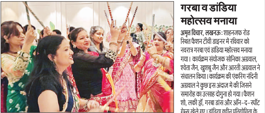
गरबा और डांडिया महोत्सव में नृत्य करती महिलाएं।