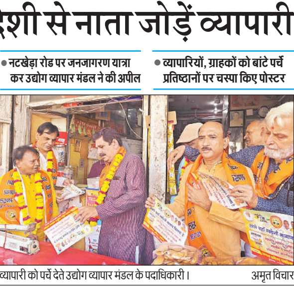
व्यापारी को पर्व देते उद्योग व्यापार मंडल के पदाधिकारी। अमृत विचार

कम से कम एक घंटे बाद आयरन की गोली लेनी चाहिए।