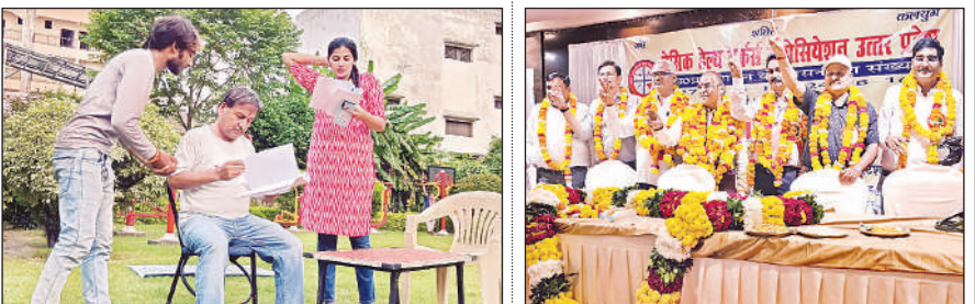
नाटक हम तो चले हरिद्वार का रिहर्सल करते कलाकार।