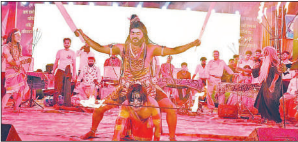
कार्यक्रम में प्रस्तुति देने कलाकार ।