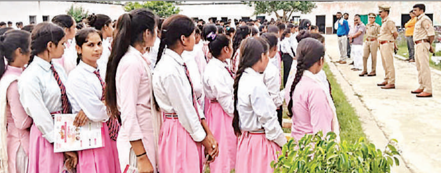
हरपालपुर थाना क्षेत्र के सतौथा गांव स्थित मदन मोहन इंटर कॉलेज में छात्राओं को जागरूक करती पुलिस टीम।