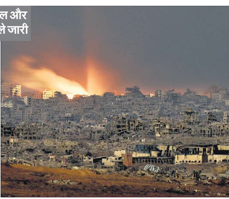
इजराइल ने रविवार को रात भर उत्तरी गाजा में हवाई और जमीनी हमले किए।

माना जा रहा है कि लेकोर्नू ने अपनी नई सरकार के गठन के कुछ ही घंटों बाद इस्तीफा देकर देश को एक बार फिर से राजनीतिक अनिश्चितता में धकेल दिया था। इस तरह 27 दिनों के कार्यकाल के बाद लेकोर्नू फ्रांसीसी संसदीय इतिहास में सबसे कम समय तक रहने वाले प्रधानमंत्री बन गए हैं।