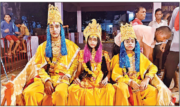
रामलीला का मंचन करते पात्र।