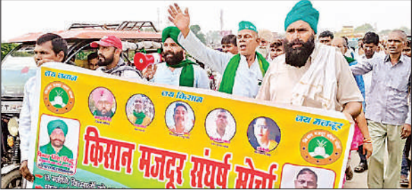
शहर के मुख्य मार्ग पर प्रदर्शन करते किसान संगठन।