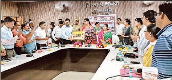
राज्य महिला आयोग की अध्यक्ष को स्मृति चिन्ह देते अपर जिलाधिकारी।