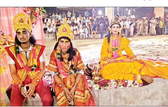
रामलीला में मंचन करते कलाकार।

मल्लावां, हरदोई, अमृत विचार। श्री राम एवं श्री कृष्ण उत्थान समिति राधोपुर रोड मल्लावां के 76वें वर्ष की लीला का मंचन श्री गिरिजारा बालकृष्ण लीला संस्थान गोवर्धन मथुरा के कलाकारों के द्वारा प्रथम दिन गणेश पूजन, नारद मोह लीला का सुंदर वर्णन किया गया।