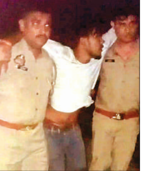
पुलिस की गिरफ्त में घायल बदमाश।