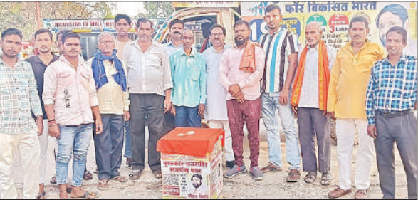
यात्रा का स्वागत करते लोग ।