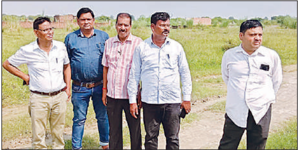
मौके पर जांच करती राजस्व की टीम।