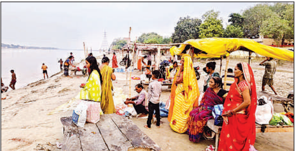
शरद पूर्णिमा पर गंगा स्नान करते श्रद्धालु।