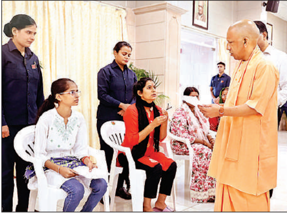
जनता दर्शन में लोगों की समस्याएं सुनते मुख्यमंत्री योगी।

तबसे न तो किसानों को समय से खाद और बीज उपलब्ध करा पा रही है और न किसानों की फसलों का सही मूल्य दिला पा रही है। महंगाई के कारण खेती का लागत मूल्य बढ़ गया है। लेकिन किसानों को उनकी फसलों का उचित दाम नहीं मिल रहा है। सपा प्रमुख ने सोमवार को जारी बयान में कहा कि भाजपा सरकार में खाद के लिए लाइनों में खड़े कई किसानों पर लाठीचार्ज हुए। लाइनों में लगे-लगे किसानों की तबीयत खराब हुई और कई किसानों की जान चली गयी। लेकिन संवेदनहीन भाजपा सरकार ने किसानों की कोई सुध नहीं ली। उन्होंने कहा कि अब गेहूं, आलू, चना, मटर तथा अन्य फसलों के लिए किसानों को डीएपी और अन्य खाद की जरूरत है लेकिन सरकार की कोई तैयारी नहीं है। सरकार सो रही है। भाजपा सरकार में कालाबाजारी और मुनाफाखोरी चरम पर है।