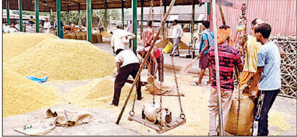
नवीन गल्ला मंडी में धान की तौल कराते किसान।