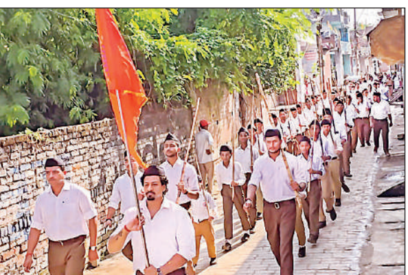
आरएसएस के पथ संचालन में शामिल स्वयंसेवक।