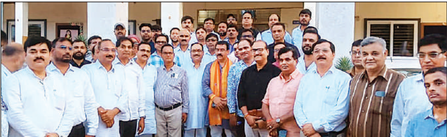
बीएसएस एकेडमी में मौजूद स्ववित्त पोषित विद्यालय प्रबन्धक एसोसिएशन के पदाधिकारी।