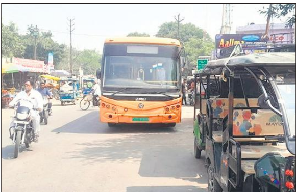
महानगर में गुजरती ई बस।