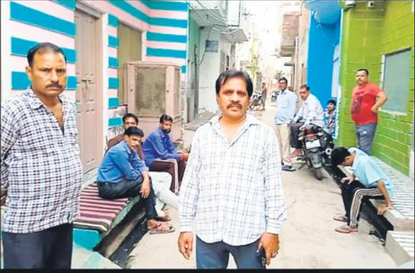
घर के बाहर बेटे परिजन। ● अमृत विचार

जा नहीं तो तेरे गोली मार देगे। मां-बेटे गिड़गिड़ाते रहे मत मारो और मांफ़ी मांगने लगे। आरोपी ने दोनों को लात मारकर धक्का दे दिया। आरोपी का जरा सा दिल