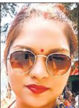
पुष्प लता ब्लॉगर

कहते है यदि एक बार भूलन बेल पर आपने पैर रख दिया या उसके करीब से गुजर गए, तो कुछ समय के लिए आप सब कुछ भूल जाएंगे। पौराणिक ग्रंथों में भी इसका वर्णन मिलता है, क्योंकि वन प्रवास के दौरान पांडव कई दिनों तक घने वन की भूल-भुलैया में फंसकर रह गए। वैसे कई लोग अकाव जैसे चौड़े पत्ते वाली बेल को भूलन बेल कहते हैं। मानते हैं कि ये इतना असरकारक है कि देखने वाला खुद ही भूल जाता है कि कौन सी भूलन बेल है।