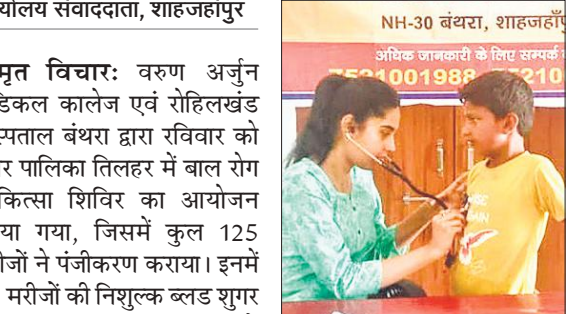
वरुण अर्जुन मेडिकल कालेज एवं रोहिलखंड अस्पताल बंधरा द्वारा नगर पालिका तिलहर में लगाए चिकित्सा शिविर में रोगी की जांच करती चिकित्सक।

स्वास्थ्य टीम एवं पीआरओ ने लोगों को नियमित जांचे करवाने के लिए जागरूक भी किया और परिवार स्वास्थ्य कार्ड की भी जानकारी दी, जो अस्पताल के द्वारा 200 रुपये में बनाया जाता है और एक वर्ष के लिए मान्य है। समस्त रोगियों को बताया गया कि परिवार स्वास्थ्य कार्ड के द्वारा ओपीडी का पर्चा निशुल्क बनेगा एवं दवाइयों और सभी जांचों पर 20 प्रतिशत कि अतिरिक्त छूट भी मिलेगी व भर्ती होने पर भर्ती फाइल मुफ्त बनेगी। स्वास्थ्य कार्ड धारक को सामान्य आपरेशन में 25 प्रतिशत एवं खुन की