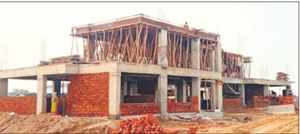
गंगा एक्सप्रेस वे पर टोल के लिए निर्माणधीन कोठरी।