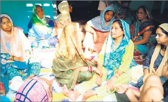
रोते बिलखते मृतक की पत्नी और परिजन।