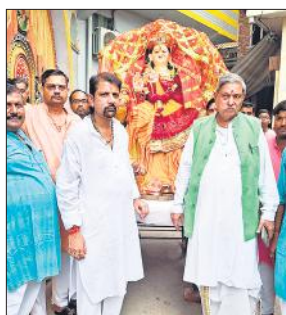
मां दुर्गा की शोभायात्रा निकालते भक्तगण।

अमृत विचार : मोहल्ला संख्या पांच स्थित सिद्धपीठ श्री बालाजी धाम की ओर से नवरात्र शुरु होने पर यहां दुर्गा महोत्सव मनाया गया। इसमें दरबार में स्थापित की गई। मां दुर्गा की प्रतिमा के विसर्जन से पहले सोमवार को माता रानी के भक्तों ने नगर में एक शोभायात्रा निकाली। इसका नगर के व्यापारियों ने जगह-जगह स्वागत किया। शोभायात्रा नगर के मोहल्ला संख्या पांच बालाजी धाम से शुरू होते हुए नगर के अटल चौक सर्राफा बाजार, बालाजी चौक, चंद्रशेखर आजाद मार्केट होते हुए बाद में कछला बस स्टैंड पर पहुंची। यहां से भक्त प्रतिमा को विसर्जन के लिए गंगा घाट के लिए रवाना हुए।