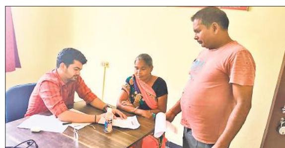
वरुण अर्जुन मेडिकल कालेज एवं रोहिलखंड अस्पताल बंधरा द्वारा मीरानपुर कटरा में लगाए गए निशुल्क स्वास्थ्य शिविर में जांच करते चिकित्सक।

इनमें से पांच लोगों को मोतिबाबिंद के आपरेशन के लिए चयनित किया गया, जिनका आपरेशन रोहिलखंड अस्पताल में निशुल्क किया जायेगा। शिविर में सभी मरीजों को निशुल्क आई ड्राप एवं दवाइयां वितरित की