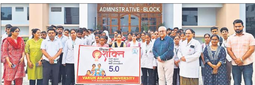
वरुण अर्जुन विश्वविद्यालय बंधरा में मिशन शक्ति फेज 5.0 के कार्यक्रम को लेकर परिसर में मौजूद चिकित्सक व मेडिकल स्टाफ।