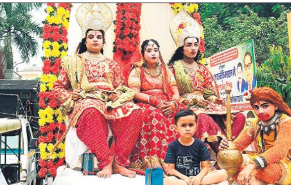
शरद पूर्णिमा पर निकाली गई साईं पालकी शोभायात्रा में शामिल राम दरबार की झांकी।

चित्रांश म्यूजिकल ग्रुप द्वारा भजनों की रसधारा प्रवाहित की