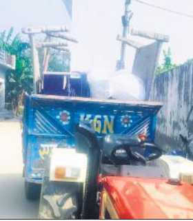
गांव में खड़ी सामान लदी ट्रैक्टर-ट्रॉली।

मामला थाना मूसाझाग क्षेत्र की नगर पंचायत का है। यहां निवासी युवक दूसरे समुदाय की एक युवती को प्रेम जाल में फंसाकर बहला फुसलाकर अपने साथ ले गया। वह वापस आई तो परिजनों ने उसकी शादी तक कर दी थी। इसके बाद युवक उसे दोबारा से ले गया। इससे युवती की शादी टूट गई थी। युवती के परिजन की तहरीर पर पुलिस ने आरोपी के खिलाफ छह दिन पहले रिपोर्ट दर्ज की थी। पुलिस आरोपी की तलाश में लगातार दबिश दे रही है। जिसके चलते आरोपी के परिजन सोमवार सुबह लगभग 9 बजे ट्रैक्टर-ट्रॉली में सामान भरकर पलायन की फिराक में थे। युवती पक्ष ने ट्रॉली में सामान भरने का वीडियो बना लिया। ग्रामीणों के साथ