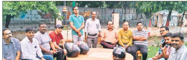
बैठक में मौजूद यूटा के पदाधिकारी व शिक्षक।

जिला अस्पताल में फीवर वार्ड पिछले 15 दिनों से मरीजों से फुल चल रहा है। पांच अतिरिक्त बेड भी फुल हो गए हैं। बच्चा वार्ड में डायरिया और बुखार से ग्रसित रोगियों की संख्या लगातार बढ़ रही है। पर्चा व दवा काउंटर पर