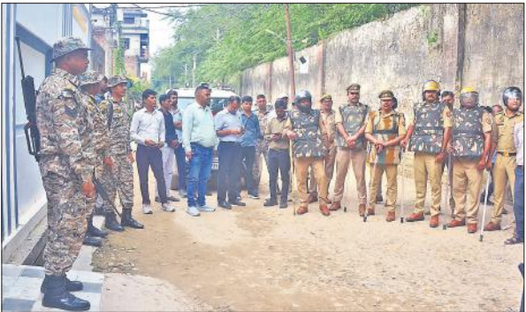
बरातघर को सील करने के दौरान फोर्स के साथ मौजूद बीडीए के अधिकारी।