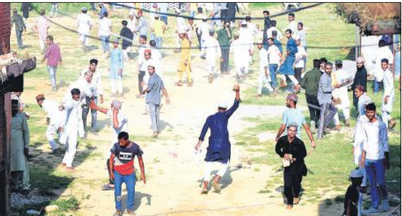
26 सितंबर को जुमे की नमाज के बाद पथराव करते आरोपी। (फाइल फोटो)