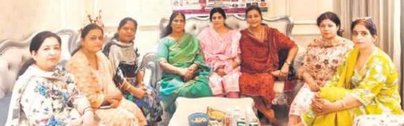
जानकारी देती इनर व्हील क्लब ऑफ बरेली साउथ की पदाधिकारी ।