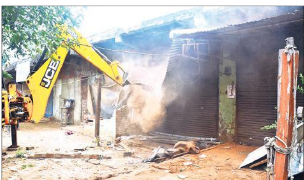
नगर निगम की टीम ने कटघर से अतिक्रमण हटाया।

लोगों ने जानकारी करनी चाही, लेकिन बाहरी लोगों को इस बैठक में शामिल नहीं होने दिया गया। चर्चा है कि इस बैठक में ही शहर में बवाल कराने की रणनीति तैयार हुई थी और सभी को अलग-अलग जिम्मेदारी सौंपी गई थी।