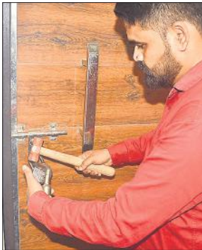
बरातघर का ताला तोड़ता कर्मचारी।

इसका निर्माण करीब 6 माह पूर्व ही पूरा हुआ है। बीडीए से इस बरातघर के निर्माण से पूर्व नक्शा भी स्वीकृत नहीं कराया था। मुख्य गेट पर ताले को तोड़कर बीडीए की टीम ने अंदर जाकर जांच की। इसके बाद मुख्य द्वार को सील कर