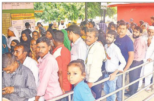
जिला अस्पताल के पर्चा काउंटर पर लगी मरीजों की कतार।