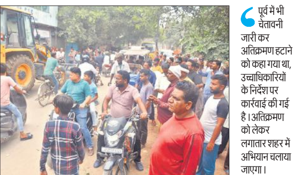
अतिक्रमण हटाने के दौरान मौके पर जुटी रही भीड़।