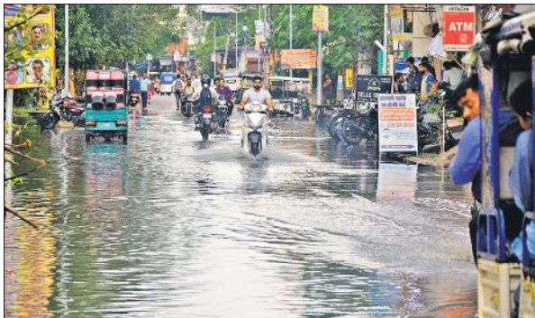
वनखंडी नाथ रोड पर बारिश के बाद जलभराव से गुजरते वाहन।

अमृत विचार : जिले में सोमवार शाम तेज हवा के साथ झमाझम बारिश हुई। कुछ इलाकों में ओलावृष्टि भी हुई। इससे लोगों को हल्की ठंडक का अहसास हुआ। मौसम विभाग ने मंगलवार को भी हल्की से मध्यम बारिश का येलो अलर्ट जारी किया है। इसके बाद से मौसम शुष्क रहेगा। सोमवार को सुबह से धूप खिली लेकिन कुछ देर बाद बादल छा गए। दिन भर ऐसे ही मौसम बदलता रहा, जिससे लोगों को उमस भरी गर्मी का अहसास हुआ। दोपहर 3:30 बजे के बाद घने बादल छाने के साथ गरजने लगे। कुछ देर बाद तेज हवाएं चलीं और फिर झमाझम बारिश हुई। जिले में अधिकतम तापमान में 32.8 डिग्री सेल्सियस और न्यूनतम