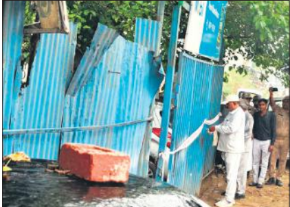
गैराज को सील करती बीडीए की टीम।