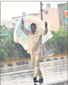
बारिश से बचाव करता युवक।