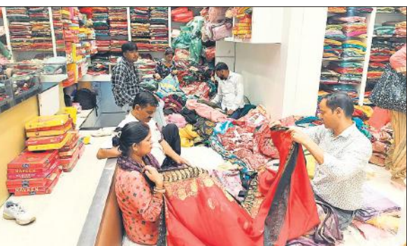
शहर के एक साड़ी शोरूम में खरीदारी करते ग्राहक ।

गई जरी की सलमा सितारा साड़ियां उपलब्ध हैं, जो ग्राहकों को काफी पसंद आ रही हैं । दुकानों पर बंधेज जयपुरी, लहरिया जयपुरी, जरी की साड़ी, सिल्क, साउथ सिल्क, ऑरगेंजा फैवरिक, डोला, बनारसी सिल्क, फैंडी शिफॉन, क्रंची शिफॉन, साड़ियां महिलाओं को पसंद आ रही हैं । दुकानदारों ने बताया कि उनके यहां से सभी प्रकार की साड़ियां ग्राहक खरीद रहे हैं । महिलाएं