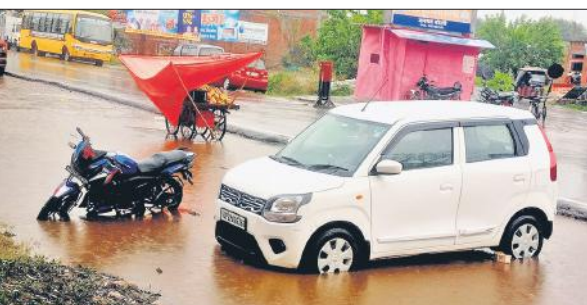
बारिश में शेरगढ़ की सड़कों पर पानी भर गया।

अमृत विचार : सोमवार को क्षेत्र में हुई बारिश से जहां मौसम सुहावना हो गया तो वहीं नगर की गलियां जलमग्न हो गईं। इस दौरान कई जगह मार्ग के दोनों ओर जलभराव होने से वाहनों तक पहुंचने में लोगों को ख़ासी परेशानी का सामना करना पड़ा। क्षेत्र में सोमवार को अस्पताल बाईपास तिराहा पर युवा मंडल विद्यालय और बैंक ऑफ बड़ौदा की शाखा के सामने बारिश से जलभराव हो गया। जिससे लोगों को दिक्कत का सामना करना पड़ा। लोग काफी देर तक पानी खत्म होने का इंतजार करते रहे। सबसे ज्यादा परेशानी महिलाओं को उठानी पड़ी। नाले भी जबाब दे गए। किसानों की पानी और धान की फसल धराशायी हो गई।