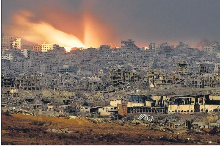
इजराइल ने रविवार को रात भर उत्तरी गाजा में हवाई और जमीनी हमले किए।

इजराइल के प्रधानमंत्री बेंजामिन नेतन्याहू के कार्यालय ने बताया कि अप्रत्यक्ष वार्ता लाल सारंग से शर्म अल शेख रिसॉर्ट में होगी, जहां शीर्ष वार्ताकार रॉन डेरमर के नेतृत्व में इजराइली प्रतिनिधिमंडल सोमवार को पहुंच रहा है। हमास ने एक बयान में कहा कि खलील अल-हय्या के नेतृत्व में हमास का प्रतिनिधिमंडल रविवार को मिस्त्र पहुंचा। इसमें कहा गया है कि वार्ता युद्ध विराम के प्रथम चरण पर केन्द्रित रहेगी, जिसमें इजराइली सेना की आंशिक वापसी तथा इजराइली हिरासत में मौजूद फिलिस्तीनी कैदियों के बदले में, गाजा में चरमपंथियों द्वारा बंधक बनाये गए लोगों की रिहाई शामिल है।