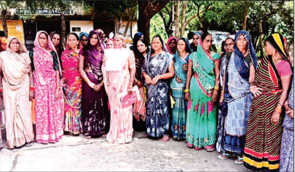
डीएम को ज्ञापन देने कलेक्ट्रेट पहुंचीं महिलाएं।