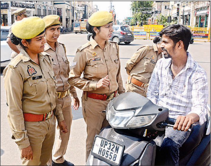
लखनऊ के हजरतगंज में बिना हेलमेट दोपहिया वाहन चलाते युवक को समझाती महिला पुलिसकर्मी। (फाइल फोटो)

एडीजी ने कहा कि यह अभियान महिलाओं को सुरक्षित महसूस कराने की दिशा में योगी सरकार की जीरो टॉलरेंस नीति का परिणाम है। ट्रैफिक अनुशासन और सार्वजनिक सुरक्षा सुनिश्चित करने में यह पहल मील का पथर साबित हो रही है।