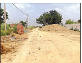
कच्चा पड़ा मार्ग।