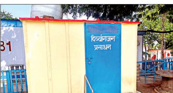
शौचालय पर लटका ताला।

स्टेशन से रोजाना सैकड़ों की संख्या में ट्रेनों का आवागमन होता है। इस रेलवे स्टेशन से यात्रियों को कानपुर, इटावा, लखनऊ, बनारस, दिल्ली, चंडीगढ़, सुल्तानपुर, अकबरपुर, शाहगंज, आजमगढ़, जौनपुर आदि जगहों पर जाने के लिए यात्रियों को हर जगह जाने