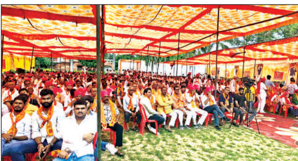
कार्यक्रम में मौजूद लोग।