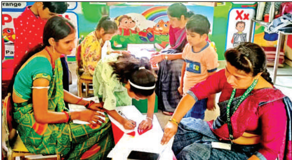
बैठक के दौरान मौजूद अभिभावक और शिक्षक।