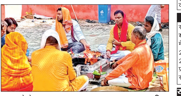
पूजन करते लोग।