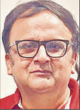
विवेक शुक्ला वरिष्ठ पत्रकार

बिहार में विधानसभा चुनावों का बिगुल बज चुका है। चुनाव आयोग ने मतदान की तारीखों की घोषणा कर दी है। छह और 11 नवंबर को मतदान होगा। नतीजे 14 नवंबर को आएंगे। यह चुनाव केंद्रीय गृह मंत्री अमित शाह के लिए विशेष महत्व रखता है। उन्होंने राष्ट्रीय जनतांत्रिक गठबंधन (राजग) को दो-तिहाई बहुमत के साथ विजयी बनाने का लक्ष्य रखा है। इसके लिए भाजपा कार्यकर्ताओं को स्पष्ट निर्देश दिए गए हैं। शाह का दावा है कि राजग न केवल पूर्ण बहुमत के साथ बिहार में सरकार बनाएगा, बल्कि घुसपैठियों को राज्य की पवित्र धरती से बाहर भी करेगा।