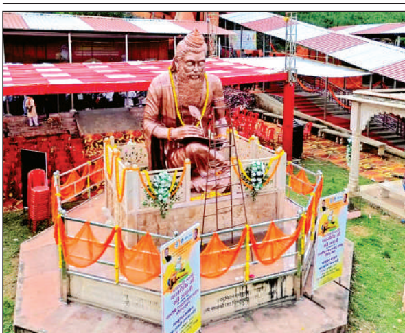
मंदिर में स्थापित महर्षि वाल्मीकि जी की भव्य प्रतिमा।