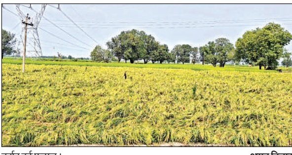
बर्बाद हुई फसल।