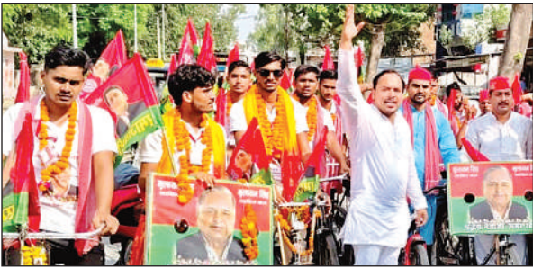
साइकिल यात्रा के साथ नारेबाजी करते सपा नेता।