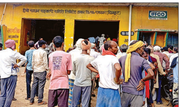
छीबों साधन सहकारी समिति में खाद के लिए परेशान खड़े किसान।

अमृत विचार। दावों और वादों के बाद भी समितियों में खाद के लिए मारामारी की स्थिति है। किसानों का कहना है कि वे लोग एक-एक बोरी खाद के लिए परेशान हैं। जिम्मेदारों द्वारा समितियों में पर्याप्त खाद होने के दावे किए जाने के बाद भी किसानों की बात मानने तो हकीकत यह है कि क्षेत्र की समितियों में खाद के लिए दिन भर खाद की समितियों में भटक रहे हैं। इसके बाद भी खाद नहीं मिल पा रही है। बीते दिन रामनगर की सोसाइटी में खाद वितरण के दौरान बीस बीस बोरी खाद एक एक किसान को देने के आरोप लगे। साथ ही एक गांव विशेष को ही खाद वितरित करने के आरोप लगे। रैपुरा पुलिस व प्रशासनिक अधिकारियों को आना पड़ा। अधिकारियों ने हिदायत दी कि