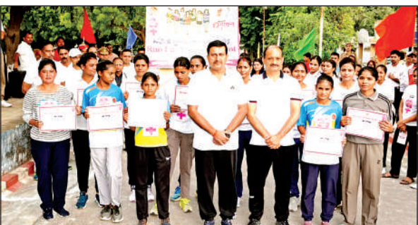
विजेता छात्राओं व महिला पुलिस प्रशस्तिपत्र के साथ व मौजूद डीएम, एसपी।

विभिन्न विद्यालयों की 200 से अधिक छात्राओं एवं पुलिसकर्मियों ने प्रतिभाग कर महिला सुरक्षा का संदेश दिया। प्रतिभागियों ने "नारी सुरक्षा-नारी सम्मान, बेटी बचाओ-बेटी पढ़ाओ, महिला सशक्तिकरण ही राष्ट्र सशक्तिकरण" जैसे प्रेरक नारे भी लगाए। इस अवसर पर पुलिस अधीक्षक ने कहा कि कन्नौज पुलिस सदैव महिलाओं की सुरक्षा और सहयोग के लिए प्रतिबद्ध है।