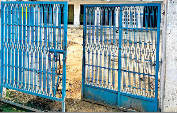
पुराने पंचायत भवन के गेट का टूटी कुंडी और फैली गंदगी।