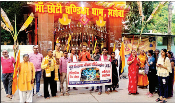
छोटी चंडिका धाम से परिक्रमा निकालने को तैयार श्रद्धालु।