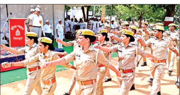
मार्चपास्ट करते पुलिसकर्मी।