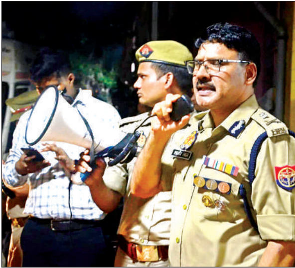
पुलिस कमिश्नर ने लोगों को भीड़ न लगाने को कहा।