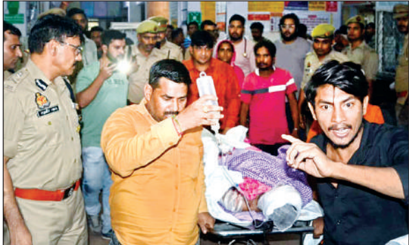
घायलों को उर्सला अस्पताल ले जाया गया।

मिश्री बाजार में अब्दुल हमीद की खिलौनों की दुकान से करीब 300 मीटर से अधिक के दायरे में दुकानों में विस्फोट का असर दिखा। किसी दुकान का प्लास्टर गिरा तो कां फाल्स सीलिंग। दुकानों के बाहर स्टैंड पर लगे कपड़े, बैग, प्लास्टिक के सामान, खिलौने हवा में उड़े। आसपास की छह दुकानों की दीवारों में मोटी दरारें पड़ गईं। धुएं का गुबार