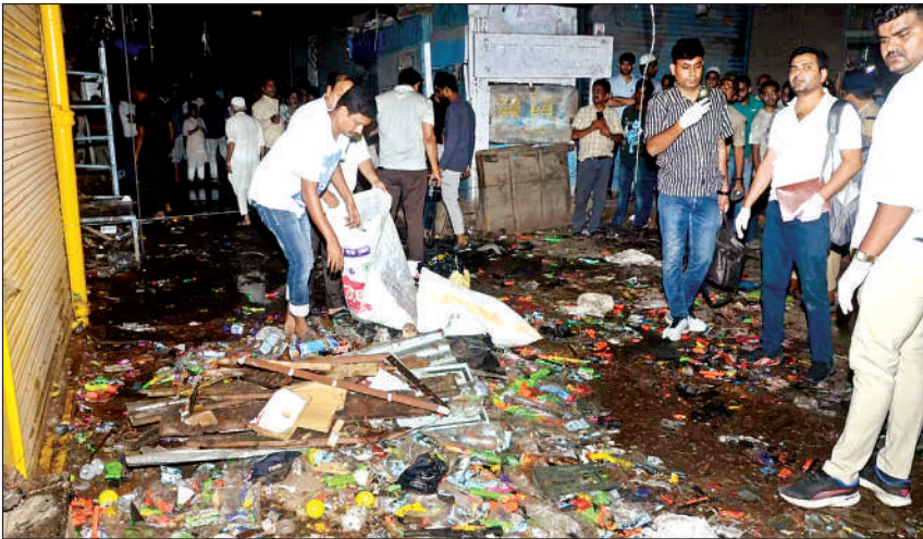
दुकानों के बाहर रखा माल बर्बाद हो गया।

मिश्री बाजार में विस्फोट से दुकानों के बाहर लगा माल हवा में उड़ा, पूरी सड़क पर फैला, कई दुकानों में फाल्स सीलिंग, प्लास्टर गिरने से फैली धूल