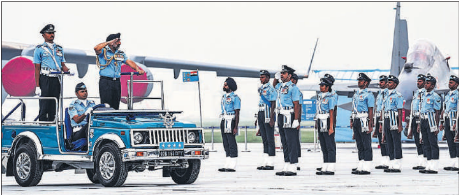
93वें भारतीय वायु सेना दिवस समारोह के दौरान गार्ड ऑफ ऑनर का निरीक्षण करते एयर चीफ मार्शल एपी सिंह।

वायु सेना प्रमुख ने कहा कि सेना ने दुनिया के समक्ष यह साबित कर दिया कि वायु शक्ति का उपयोग कुछ ही दिनों में सैन्य परिणामों को आकार देने में कैसे प्रभावी हो सकता है। एयर चीफ मार्शल सिंह ने हिंडन एयरबेस पर 93वें वायुसेना दिवस पर वायु योद्धाओं से ऑपरेशन सिंदूर की सफलता की सराहना की। भारतीय वायु सेना (आईएएफ) की आवधिकारिक स्थापना आठ अक्टूबर 1932 को हुई थी। वायु सेना प्रमुख