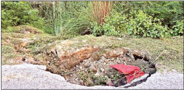
ककवन सीएचसी के सामने धंसी सड़क।

जानकारी के अनुसार ककवन सामुदायिक स्वास्थ्य केंद्र के ठीक पास सड़क का एक बड़ा हिस्सा धंस गया है। इससे यहां बड़ा गड्ढा बन गया है। यह गड्ढा इतना गहरा है कि खासकर रात के समय या बारिश के दौरान यह किसी भी वाहन के लिए बड़ा खतरा बन सकता है। स्थानीय लोगों के अनुसार, इस गड्ढे के कारण कई छोटी-बड़ी दुर्घटनाएं हो चुकी हैं, लेकिन विभाग ने इसे भरने या