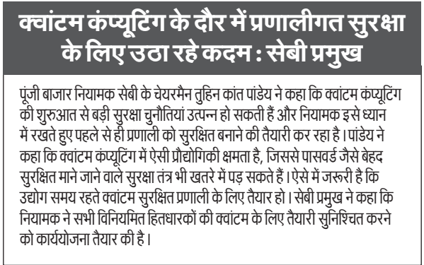
व्वांटम कंप्यूटिंग के दौर में प्रणालीगत सुरक्षा के लिए उठा रहे कदम : सेबी प्रमुख

कि भारत में जीवंत वित्तीय प्रौद्योगिकी (फिनटेक) परिवेश है और फिनटेक ने किरायाती लागत पर वित्तीय सेवाएं प्रदान करना संभव बनाया है। देश में लगभग 10,000 ऐसी संस्थाएं हैं। मल्होत्रा ने कहा कि एकीकृत कर्ज इंटरफेस (यूएलआई) का उद्देश्य ऋणदाताओं को वैकल्पिक कर्ज मॉडल बनाने को आंकड़ों के उपयोग को लेकर सक्षम बनाना है, जैसा कि भुगतान क्षेत्र में यूपीआई (यूनिफाइड पेमेंट इंटरफेस) ने किया है।