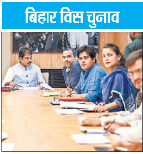
इंदिरा भवन में सीईसी की बैठक में शामिल कांग्रेस नेता

में कैसे प्रभावी ढंग से किया जा सकता है। वायुसेना प्रमुख ने ऑपरेशन सिंदूर को इस बात का एक शानदार उदाहरण बताया कि सावधानीपूर्वक बनाई गई योजना, अनुशासित प्रशिक्षण और दृढ़ निश्चयी कार्यान्वयन के जरिए क्या हासिल किया जा सकता है।