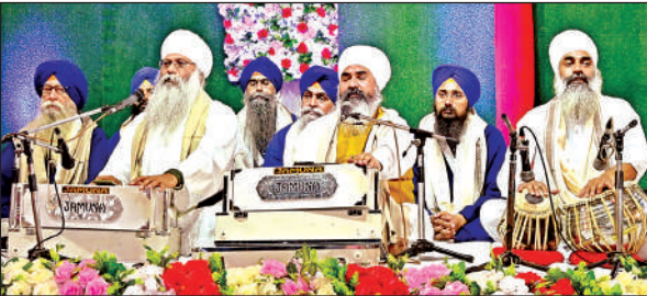
मोतीझील ग्राउंड पर गुरमत समागम हुआ।

अमृत विचार। श्री रामदास जी के प्रकाश पर्व पर मोतीझील ग्राउंड पर गुरमत समागम में रागी जत्थों ने शबद गायन करके संगत का मन मोहा। इस दौरान जो बोले सो निहाल-सतश्री अकाल गूंजता रहा। बुधवार को उत्तर प्रदेश सिख फाउंडेशन द्वारा मोतीझील ग्राउंड पर भव्य पंडाल में गुरमत समागम आयोजित किया गया। इस दौरान श्री गुरु ग्रंथ साहिब को मत्था टेकने के लिए भारी भीड़ उमड़ी और लंगर छकने के लिए भी संगत की भीड़ मौजूद रही। दिल्ली के रागी जत्था