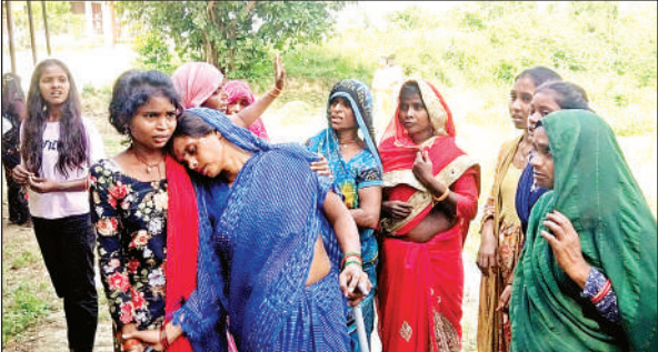
दोनों बेटियों के डूबने के बाद बहववाश मां को संभालती महिलाएं।