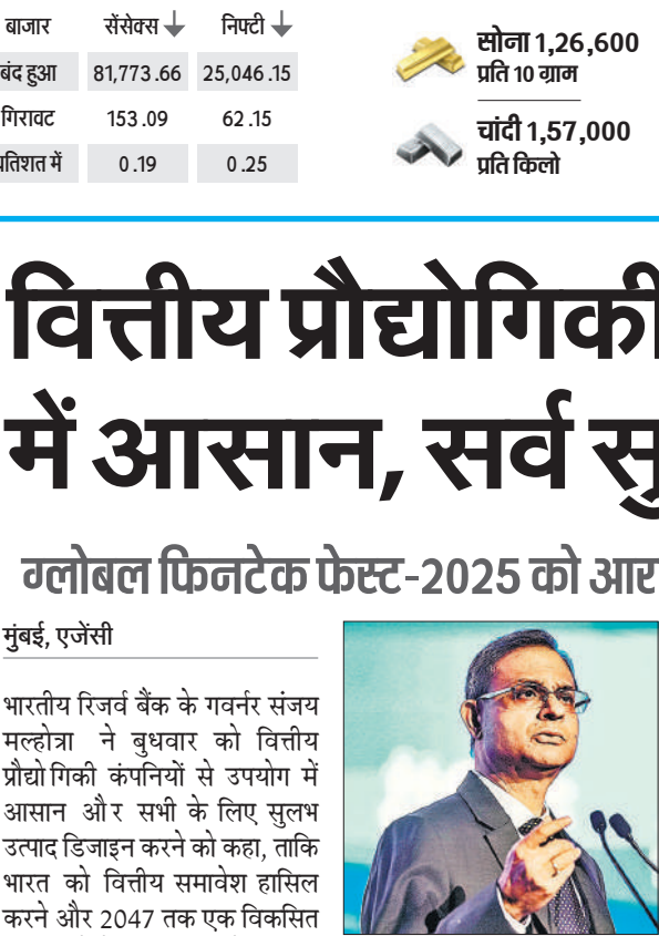
ग्लोबल फिनटेक फेस्ट-2025 को आरबीआई गवर्नर मल्होत्रा ने किया संबोधित

ग्लोबल फिनटेक फेस्ट (जीएफएफ) मंत्री ने कहा कि दुनिया, भारत को विश्वास के साथ देखती है क्योंकि यह देश उच्च गुणवत्ता वाली प्रतिभा, कौशल, वस्तुओं एवं सेवाओं की मांगी देता है और समय पर आपूर्ति के लिए प्रतिबद्ध है। वित्तीय प्रौद्योगिकी की दुनिया में भागीदार से लेकर अब