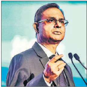
ग्लोबल फिनटेक के दूसरे सत्र को संबोधित करते गवर्नर संजय मल्होत्रा।

मल्होत्रा ने ग्लोबल फिनटेक फेस्ट 2025 को संबोधित करते हुए, बढ़ते डिजिटल धोखाधड़ी के मुद्दे का भी उल्लेख किया और इस समस्या पर अंकुश लगाने के लिए प्रयास करने की वकालत की। उन्होंने कहा कि ऐसे उत्पाद और सेवाएं डिजाइन करें जो उपयोग में आसान हों, सभी के लिए सुलभ हों और सहायक प्रौद्योगिकी के साथ हों, ताकि यह सुनिश्चित हो सके कि वरिष्ठ नागरिक, सीमित डिजिटल साक्षरता वाले व्यक्ति और विशेष रूप से दिव्यांग जैसे कमजोर समूह पीछे न छूटें। आरबीआई गवर्नर ने कहा