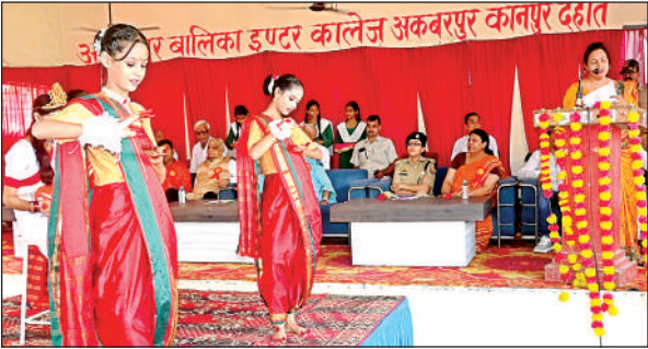
विद्यालय की छात्राओं ने नृत्य प्रस्तुत कर सांस्कृतिक झलक दिखाई।