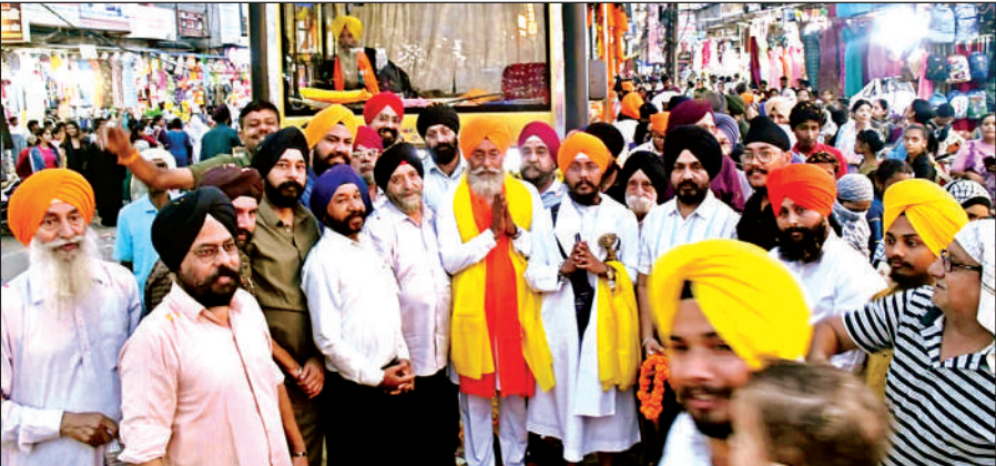
तख्त साहिब पटना से कानपुर पहुंची जागृति यात्रा का भव्य स्वागत किया गया।

कानपुर के अतिरिक्त लखनऊ, प्रयागराज, उन्नाव, फतेहपुर समेत कई जिलों के लोगों ने शिरकत की। गुरबाणी कंपटीशन प्रतियोगिता में भाग देने वाले 156 बच्चों को सम्मानित किया गया।