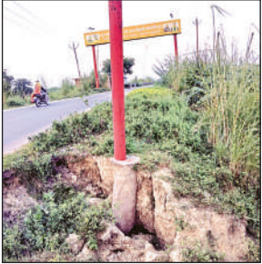
बारिश से कटा सड़क का किनारा।

जबकि इस हाईवे से रोजाना हजारों की संख्या में वाहनों का आवागमन रहता है। यह हाईवे क्षेत्र की लाइफलाइन है, बड़े-बड़े गड्ढे और पुलों की टूटी सड़कें गंभीर चिंता का विषय हैं। स्थानीय निवासियों और यात्रियों ने विभाग