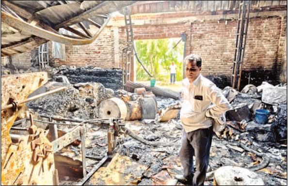
फैक्ट्री में लगी आग से जला सामान।

जानकारी के अनुसार देर रात करीब 12 से 1 बजे के बीच में दोना पत्तल की फैक्ट्री में आग लग गई। आग इतनी भीषण थी कि इसकी लपटें दूर से दिखाई दे रही थीं। जैसे