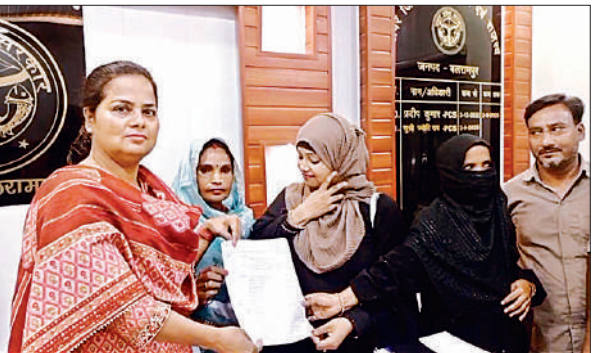
एडीएम को सामूहिक त्यागपत्र सौंपते नगर पंचायत पचपेड़वा के सभासद।