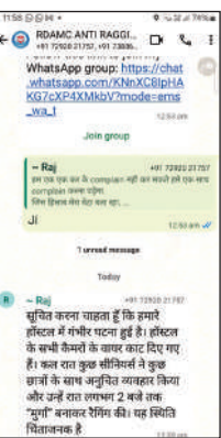
अराजकतत्वों के बनाए गुप का स्क्रीन शॉट।