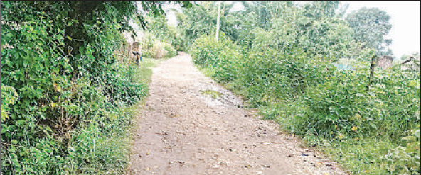
जर्जर सड़क जिसका होना है निर्माण।