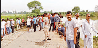
घटनास्थल पर मौजूद ग्रामीणों की भीड़।