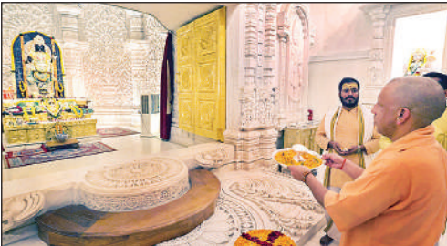
रामलला की आरती करते मुख्यमंत्री योगी आदित्यनाथ।