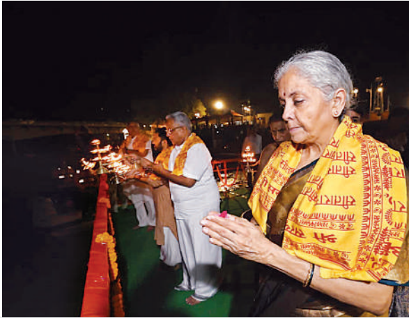
सरयू घाट पर पूजन-अर्चन करतीं केंद्रीय वित्त मंत्री निर्मला सीतारमण।