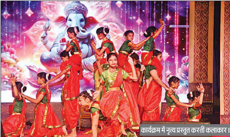
कार्यक्रम में नृत्य प्रस्तुत करती कलाकार।