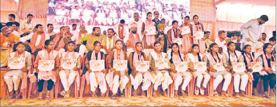
बलभद्र सिंह महाविद्यालय में सांसद प्रतिभा सम्मान समारोह में मेधावियों के साथ पूर्व सांसद बृजभूषण शरण सिंह।