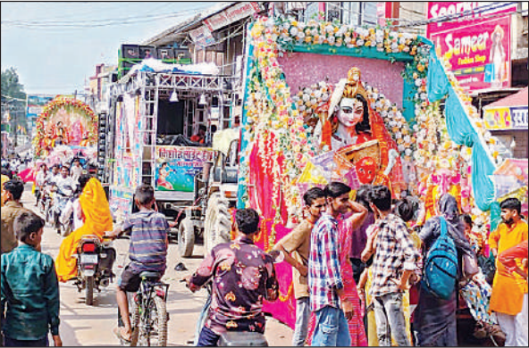
शहर में निकाली गई विसर्जन शोभायात्रा।

नवरात्र में कलश स्थापना से जिले में दुर्गा पूजा महोत्सव की औपचारिक शुरुआत हुई थी। हालांकि, मेले की रंगत दशहरा से शुरू हुई। पूर्णिमा के हवन पूजन के बाद मंगलवार को चौक ठठेरी बाजार में नंबरिंग कर शोभायात्रा के लिए ट्रैक्टर ट्रालियों पर प्रतिमाएं सजाई गईं। रात करीब 10 बजे यहाँ डीएम व एसपी ने झंडी दिखाकर विसर्जन शोभायात्रा को रवाना किया। आगे-आगे बजरंग बली की मूर्ति चल रही थी। इसके बाद बड़ी दुर्गा की प्रतिमा एक नंबर पर थी। बाबा बजरंगी की मूर्ति दीवानी चौराहे पर आकर रुक गई। यहां से गाजे बाजे के साथ दुर्गा प्रतिमाओं की विसर्जन शोभायात्रा आगे बढ़ी। बुधवार की रात करीब 10 बजे बड़ी दुर्गा आदि गंगा गोमती के सीताकुंड घाट पहुंचीं। यहां पर विधि विधान से पूजा अर्चना व आरती के बाद मां की प्रतिमा का विसर्जन नम आंखों से किया गया। यह सिलसिला अगले दिन गुरुवार तक चलेगा। वहीं, बिना नंबर की कई प्रतिमाएं दिन भर विसर्जित की जाती रही।