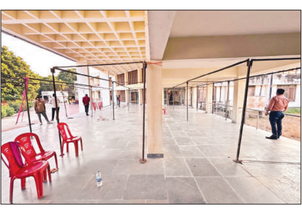
लोहिया भवन में स्वदेशी मेले की तैयारियों में जुटे लोग।

अमृत विचार। यूपी इंटरनेशनल ट्रेड शो-2025 के अंतर्गत जनपद स्तर पर स्वदेशी मेले के आयोजन के संबंध में जिलाधिकारी अनुपम शुक्ला ने जानकारी दिया। उन्होंने कहा कि प्रदेश सरकार द्वारा 09 से 18 अक्टूबर तक प्रत्येक जनपद में स्वदेशी मेला आयोजित किए जाने के निर्देश दिए गए हैं। यह आयोजन 25 से 29 सितम्बर तक इंडिया एक्सपोजिशन मार्ट लिमिटेड ग्रेटर नोएडा में आयोजित यूपी इंटरनेशनल ट्रेड शो-2025 की तर्ज पर किया जा रहा है। जिलाधिकारी ने बताया कि