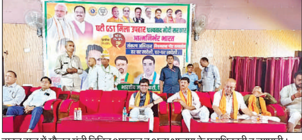
टाउन हाल में मौजूद मंत्री नितिन अग्रवाल व अन्य भाजपा के पदाधिकारी व व्यापारी।

यह बातें बुधवार को टाउन हॉल में आयोजित घटी जीएसटी मिला उपहार, धन्यवाद मोदी सरकार कार्यक्रम में प्रदेश सरकार के राज्य