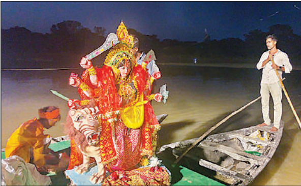
कुड़वार में गोमती नदी में किया गया प्रतिमा का विसर्जन।