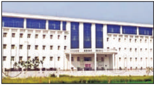
● एमबीबीएस 2025 बैच के विद्यार्थियों के लिए बनाया गया था आरडीएमसी एंटी रैगिंग गुप

अमृत विचार : राजर्षि दशरथ मेडिकल कॉलेज का साजिशान माहौल बिगाड़ने का मामला सामने आया है। अराजकतत्वों ने 2025 बैच के एमबीबीएस विद्यार्थियों के अभिभावकों का एक फर्जी गुप बना उन्हे दहशत में ला दिया। गुप पर भ्रामक सूचनाएं डाली जाने लगीं कि यहां पर ब्यौंज हॉस्टल में सीनियर स्टूडेंट जूनियर को आधी रात मुर्गा बना रखे हैं। कॉलेज प्रशासन को मामले की भनक लगी तो जांच कराई और पुलिस को सूचित कर दिया। उसके बाद से गुप के एडमिन का नंबर भी स्विचऑफ हो गया है।