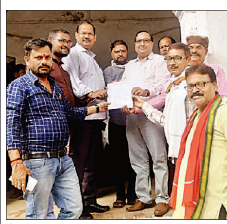
डीएसओ को ज्ञापन देते कोटेदार।

से जलमग्न हो जाती थीं। किसानों का कहना है कि सड़कें दुरुस्त होने पर उन्हें नवीन गल्ला मंडी जाने में कोई समस्या नहीं होगी।