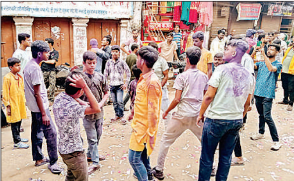
विसर्जन शोभायात्रा के दौरान जमकर थिरके उत्साही युवा व किशोर।