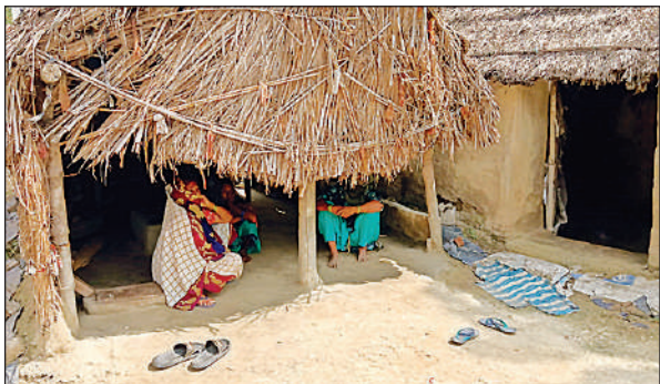
छप्पर के मकान में बिलखते परिजन।