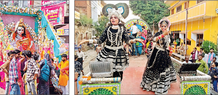
शोभायात्रा के दौरान चलायमान मंच पर कार्यक्रम प्रस्तुत करते कलाकार।

बल्दीराय प्रतिनिधि के अनुसार इसीली क्षेत्र स्थित गोमती नदी के निजामुद्दीनपुर तिलौहटी घाट पर