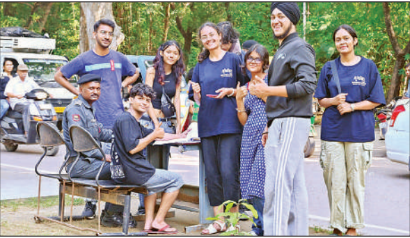
महोत्सव ‘अंतरागिन’ में शामिल होने को पहुंचे छात्र-छात्राएं।

अलावा त्रंहांभरा, मिस्टर व मिस अंतरागिन जैसे भव्य इवेंट होंगे। आयोजन के दौरान युवाओं की ओर से विभिन्न सामाजिक संदेश भी दिए जाएंगे। यह संदेश व नुक्कड़ नाटक, स्टेज शो, माडम व मोनेट के जरिये देंगे। आयोजन के दौरान अक्षर- आईआईटी कानपुर का एक साहित्य महोत्सव भी आयोजित किया जाएगा। शिवानी केन्द्र, राजभाषा प्रकोष्ठ, हिंदी साहित्य सभा एवं गाथा (एसआईआईसी-इनक्यूबेटेड कंपनी) की ओर से यह इवेंट आयोजित किया जा रहा है। यह आयोजन प्रसिद्ध हिंदी उपन्यासकार गौरा पंत ‘शिवानी’