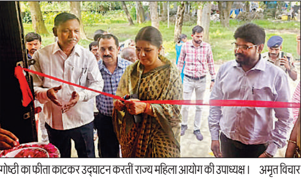
गोष्ठी का फीता काटकर उद्घाटन करती राज्य महिला आयोग की उपाध्यक्ष।