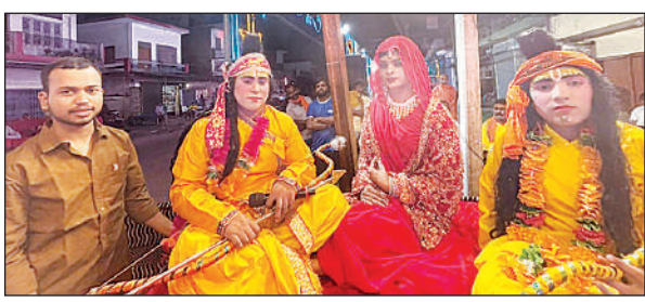
राम वन गमन का मंचन करते कलाकार।