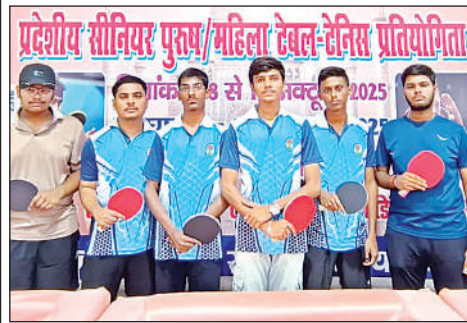
प्रदेश स्तरीय टेबल टेनिस प्रतियोगिता के लिए चयनित खिलाड़ी।