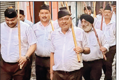
बारिश के दौरान पथ संचलन करते स्वयंसेवक।