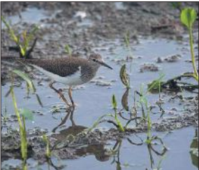
शिकार की तलाश करता प्रवासी पक्षी।

अमृत विचार: प्राकृतिक धरोहर से समृद्ध पीलीभीत टाइगर रिजर्व हर साल की तरह इस साल भी विंटर विजिटीस के लिए शरणस्थली बन रहा है। सात समंदर लोंघ कर आए यूरोप के कॉमन सैंडपाइपर ने दस्तक दे दी। वहीं साइबेरिया के डेमेंजेल क्रेन का झुंड भी यहां आमद कर चुका है। विशेषज्ञों की मानें तो अभी कई अन्य प्रवासी पक्षियों की प्रजातियां भी यहां दस्तक देने वाली हैं। इन प्रवासी पक्षियों की पीलीभीत टाइगर रिजर्व समेत जनपद में मौजूदगी यहां की समृद्ध पारिस्थितिकी का तो प्रमाण है ही, साथ ही वर्ड वॉचिंग के शौकीनों के लिए यह खासा रोचक होगा।