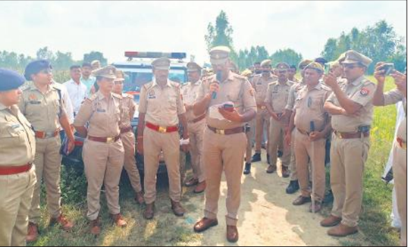
संपत्ति कुर्क करने के दौरान मौजूद तिलहर सर्किल की पुलिस फोर्स।