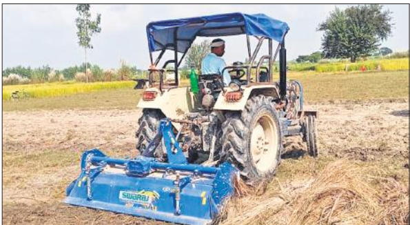
मेला स्थल को ट्रैक्टर से समतल करता ग्रामीण।

रहेलखंड का मिनी कुंभ मेला ककोड़ा का आयोजन जिला पंचायत कराता है। इसलिए जिला पंचायत पिछले दस दिन से मेला स्थल पर तैयारियां कर रहा है। अभी तक मेला स्थल पर कच्ची सड़कों का निर्माण कार्य किया जा रहा है। कच्ची सड़क बन जाने के बाद अन्य कार्य कराए जाएंगे।