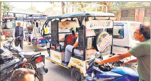
शहर में जाम का कारण बनते हैं ई-रिक्शा।

इस समस्या को दूर करने के लिए यातायात महकमा ने व्यवस्था बनाई है। बाजार में चार पहिया वाहन, टैक्टर-ट्रॉली, ई-रिक्शा व ऑटो पूरी तरह से प्रतिबंधित कर दिए गए हैं। जगह-जगह पुलिसकर्मियों और होमगार्डों की तैनाती की गई है। यह प्रतिबंध 25 अक्टूबर तक