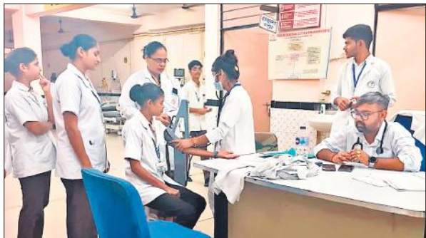
स्वास्थ्य परीक्षण शिविर में चेकअप कराती छात्राएं।

शिविर में विश्वविद्यालय के संस्थानों जैसे वरुण अर्जुन मेडिकल कॉलेज एवं रोहिलखंड अस्पताल, वरुण अर्जुन कॉलेज ऑफ नर्सिंग, वरुण अर्जुन कॉलेज ऑफ फार्मसी, वरुण अर्जुन कॉलेज ऑफ पैरामेडिकल साइंसेज, वरुण अर्जुन कॉलेज आफ कामर्स एंड मैनेजमेंट और फॉरेंसिक साइंसेज संकाय के छात्रों ने उत्साहपूर्वक भाग लिया। चिकित्सा, नर्सिंग और पैरामेडिकल स्टाफ की समर्पित टीमों ने छात्रों का व्यापक स्वास्थ्य परीक्षण किया, जिसमें सामान्य शारीरिक जांच, रक्तचाप मापन, हीमोग्लोबिन स्तर