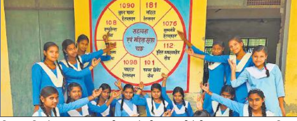
मिशन शक्ति के तहत आपातकालीन नंबरों की जानकारी देती छात्राएं।