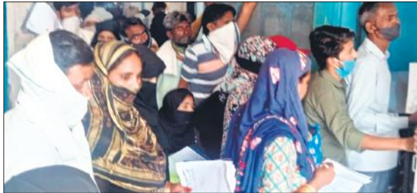
जिला अस्पताल में ओपीडी के बाहर लाइन में लगे मरीज।

बुधवार को जिला अस्पताल में 1200 से अधिक मरीजों ने अलग-अलग चिकित्सकों को दिखा कर दवा ली। सुबह से ही मरीजों की लाइन लगनी शुरू हो गई। दोपहर 1 बजे तक मरीजों के पंचे बनाए गए। इनमें बुखार के 400 से अधिक मरीज आए, जबकि वायरस के 150 से अधिक मरीज ने दवा ली। इसके बाद दो