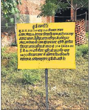
कुर्की के बाद लगाया गया बोर्ड।

धमकी और सरकारी कार्य में बाधा डालने जैसे अपराध शामिल हैं। उस पर थाना जैतीपुर में 323, 504, 307, 420, 467, 468, 471, 392 समेत कई धाराओं में कुल 7 मुकदमे दर्ज हैं। कुर्की कार्रवाई में थाना जैतीपुर के