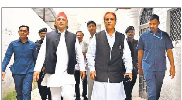
आजम खां के साथ उनके घर आते अखिलेश यादव।

आजम खां के जेल जाने और निकलने तक सपा में उन्हें लेकर जिस तरह का माहौल रहा उससे तमाम तरह के सियासी कयास लगाए जा रहे थे। यह भी कहा जा रहा था कि वह बसपा में शामिल होंगे। बहरहाल बुधवार को आजम खां से मिलने सपा प्रमुख अखिलेश यादव रामपुर पहुंचे। बंद कमरे में आजम खां और पूर्व मुख्यमंत्री अखिलेश यादव के बीच करीब डेढ़ घंटे गुप्तगू भी हुई लेकिन, पत्रकारों से बातचीत के दौरान आजम खां चुप्पी साधे रहे। एक सवाल के जवाब में आजम खां ने बस इतना