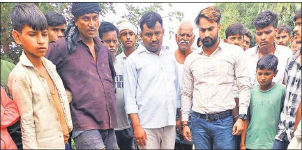
ढांग गिरने के बाद मौके पर लगी ग्रामीणों की भीड़।