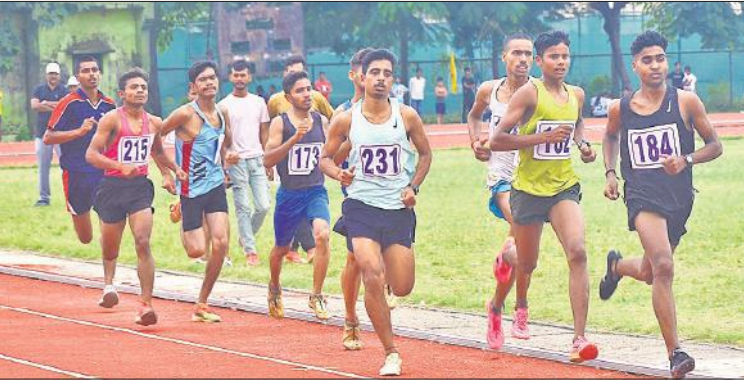
जनपदीय विद्यालय एथलेटिक्स प्रतियोगिता में 800 मीटर पुरुष दौड़ में शामिल खिलाड़ी।