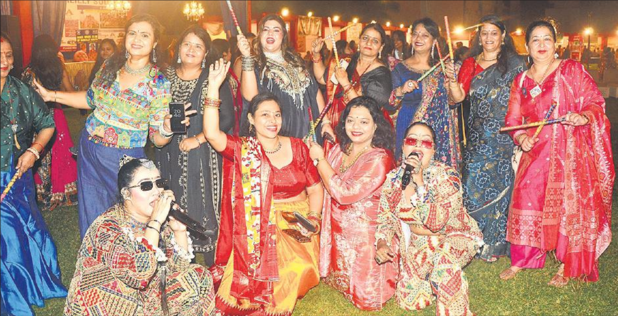
वुमनिया नारी शक्ति मेले में डांडिया नाइट में मस्ती करती महिलाएं।