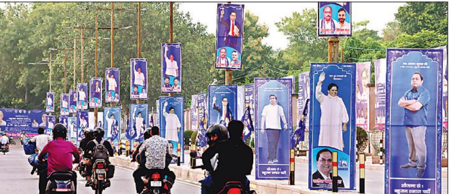
प्रस्तावित बसपा की रैली को लेकर राजधानी लखनऊ में नीले हॉर्डिंग से पटी सड़क।

अमृत विचार : राजधानी में 9 अक्टूबर गुरुवार को होने जा रही बसपा की रैली की तैयारियां पूरी हैं। पार्टी ने इसके लिए शहरभर को नीले झंडों और पोस्टर-बैनर से सजाया है। अपना खोया हुआ जनाधार पाने की कोशिश में जुटी मायावती, रैली के जरिए एक बार फिर शक्ति प्रदर्शन कर सकती हैं। तैयारियां तो पांच लाख तक की भीड़ जुटाने की रख रखी है। स्वाभाविक है पार्टी की मंशा इसके जरिए यूपी की राजनीति में एक नयी करवट लेने की है। माना जा रहा है कि रैली अगर सफल रही तो बसपा के गिरते ग्राफ के बाद, 2027 के चुनाव को योगी बनाम अखिलेश माना जा रहा हो लेकिन इस लड़ाई में मायावती की भी एंट्री हो सकती है।