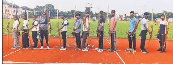
अंतर महाविद्यालयीय प्रतियोगिता में निशाना लगाने को तैयार तीरंदाज।