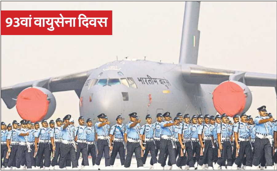
गाजियाबाद के हिंडन एयरबेस पर 93वें भारतीय वायुसेना दिवस पर परेड के दौरान भारतीय वायुसेना के जवान।