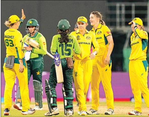
पाकिस्तान का अखिरी विकेट गिरने के बाद जश्न मनाती ऑस्ट्रेलियाई टीम।

अगस्त-सितंबर में सीएएफए नेशनल कप के लिए आराम दिए जाने के बाद करिश्माई खिलाड़ी सुनील छेत्री की टीम में वापसी हुई है, लेकिन खालिद जमील की पूरी टीम ने इतने महत्वपूर्ण मैच के लिए मुश्किल से एक हफ्ते ही एक साथ ट्रेनिंग की है। भारत चार टीम के ग्रुप सी में सबसे निचले पायदान पर है। टीम के शुरुआती दो मैच में सिर्फ एक अंक है। भारतीय टीम ने बांग्लादेश के खिलाफ गोल रहित ड्रां खेला जबकि हांगकांग के खिलाफ उसे 0-1 से हार का सामना करना पड़ा। सिंगापुर अभी दो मैच में चार