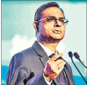
ग्लोबल फिनटेक के दूसरे सत्र को संबोधित करते गवर्नर संजय मल्होत्रा।

मल्होत्रा ने एप्पल के संस्थापक स्टीव जॉब्स का हवाला देते हुए कहा कि अपने ग्राहकों के पहले से कहीं अधिक करीब पहुंचिए, इन्हना करीब कि उन्हें यह पता चलने से पहले ही बता दीजिए कि उन्हें क्या चाहिए। सबसे पहले ग्राहक दृष्टिकोण अपनाएं और