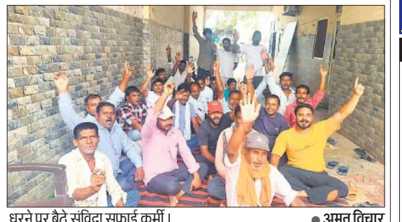
धरने पर बैठे संविदा सफाई कर्मी।