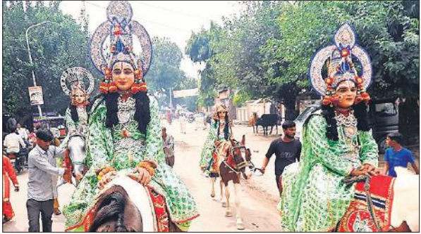
फरीदपुर में निकाली गई शोभायात्रा में शामिल झांकी।