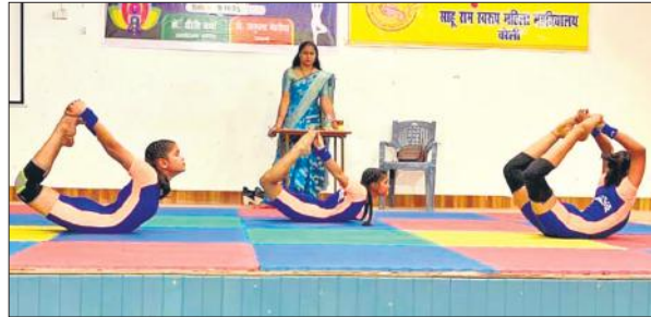
अंतर महाविद्यालयीय योग प्रतियोगिता में भाग लेती छात्राएं।