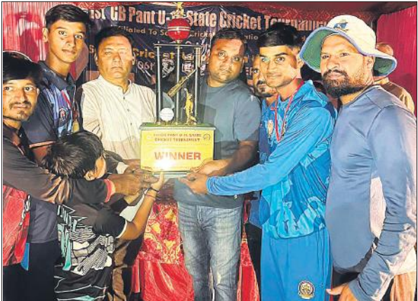
विजेता खिलाड़ियों को ट्रॉफी देते आयोजक।

सेमीफाइनल झांसी व पीलीभीत टीम के बीच हुआ। झांसी ने 10 ओवर में 7 विकेट पर 72 रन