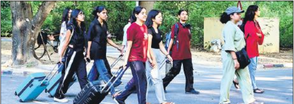
कार्यक्रम में भाग लेने आती छात्राएं।

बुधवार से प्रतिभागियों का संस्थान में आना शुरू हो गया। आईआईटी कानपुर के वार्षिक सांस्कृतिक महोत्सव अंतराग्नि 1.6 लाख से अधिक प्रत्यक्ष