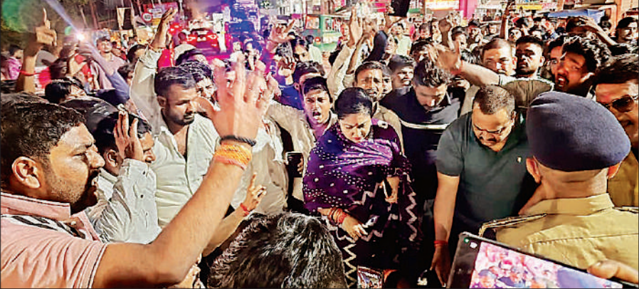
थाने के सामने हंगामा करते ग्रामीणों के साथ भाजपा कार्यकर्ताओं को समझाते पुलिस अधिकारी।