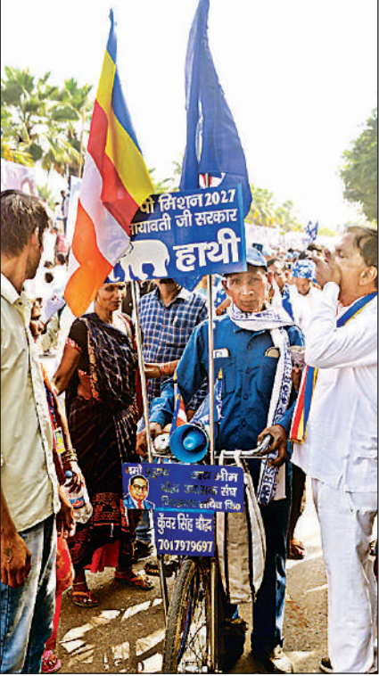
मिशन 2027 का रोलौगन साईकिल पर लगा रैली में पहुंचा समर्थक ।

ई-निविदा सूचना: ओटी-08-2025 उप मुख्य विद्युत इंजीनियर-II / निर्माण, पूर्वांचल रेलवे, गोरखपुर द्वारा भारत के राष्ट्रपति की ओर से निम्नलिखित कार्यों के लिये “खुली” निविदा आमंत्रित की जाती है। निविदा सं०:- ओटी-08-2025, कार्य का विवरण:- छितौनी- तमकुही तक नई बीजी लाइन के संरक्षण में आने वाले पीयूबीवीपनएल और एनपीबीडीसीएल के 33 कबी -10 अदद, 11 कबी -69 अदद, और 0.4 कबी - 55 अदद (कुल -134 अदद) ओवरहेड पावर लाइन क्रासिंग को केवल द्वारा भूमिगत क्रासिंग में परिवर्तित करना और प्रमुख मुख्य विद्युत इंजीनियर, निर्माण, पूर्वांचल रेलवे, गोरखपुर के अधिकार क्षेत्र के अन्तर्गत 0.4 कबी -27 अदद, 11 कबी -34 अदद और 33 कबी - 5 अदद ओवरहेड पावर लाइन क्रासिंग को संशोधन आवश्यकतानुसार केवल द्वारा भूमिगत क्रासिंग में परिवर्तित करना। अनुमानित लागत:- रु.7,05,59,021.50, बचाना राशि:- रु. 5,02,800.00, निविदा प्रपत्र का मूल्य:- रु निल, कार्य पूर्ण करने की अवधि:- 18 माह, निविदा बन्द होने की अंतिम तिथि व समय: 29.10.2025 को 15.00 बजे। नोट:- इस निविदा के विरुद्ध कोई मैन्युअल आफर स्वीकार नहीं किया जायेगा। ऐसे प्राप्त मैन्युअल आफर को उपेक्षित कर दिया जायेगा। विस्तृत विवरण व निविदा जमा करने हेतु कृपया भारतीय रेलवे की वेबसाइट www.ireps.gov.in को देखें। • निविदा सूचना में यदि हिन्दी या अंग्रेजी के आलेखों में कोई भिन्नता होती है तो अंग्रेजी के ही आलेख मान्य होंगे। • उप मुख्य विद्युत इंजीनियर-II / निर्माण मुजावि / विद्युत-155 गोरखपुर ट्रेनों में बीडी / सिगरेट न गियें