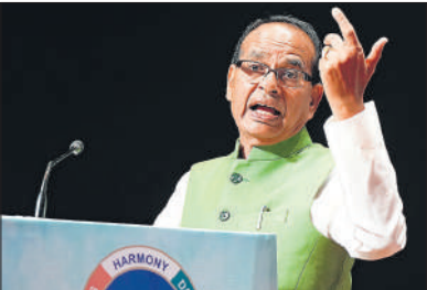
कार्यक्रम को संबोधित करते केंद्रीय कृषि एवं किसान कल्याण मंत्री शिवराज सिंह चौहान।

केंद्रीय मंत्री ने कहा कि भारत की 46 प्रतिशत आबादी आजीविका के लिए कृषि पर निर्भर है। इस पर निर्भरता को कम करने के लिए जारी प्रयासों के बावजूद इस क्षेत्र को मजबूत करना महत्वपूर्ण हो जाता है। मौजूदा स्थिति में खाद्यान्न के लिए वैश्विक बाजार पर निर्भर नहीं रहा जा सकता। इसलिए हमें आत्मनिर्भर बनना होगा। पीएल480 कार्यक्रम के तहत अमेरिकी खाद्य सहायता पर भारत की पिछली निर्भरता का जिक्र करते हुए चौहान ने कहा कि देश ने एक लंबा सफर तय किया है। एक समय ऐसा था जब अतीत में किसी प्रधानमंत्री को लोगों से सप्ताह में एक बार उपावास रखने को कहना पड़ता था। अब 80 करोड़ लोगों को मुफ्त राशन दिया जा रहा है।