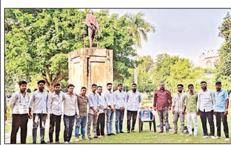
बीबीएयू में आयोजित स्वास्थ्य शिविर में जांच करती डॉक्टर।