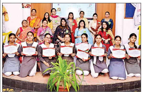
कार्यक्रम में पुरस्कृत छात्राएं व शिक्षिकाएं।