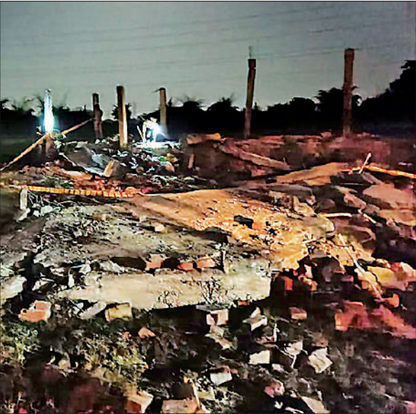
विस्फोट के बाद घर की छत उड़ी व बिखरा पड़ा मलबा।