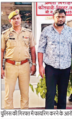
पुलिस की गिरफ्त में फायरिंग करने के आरोपी।

अमृत विचार, आशियाना: गुरुवार को आशियाना थाने में पति-पत्नी और