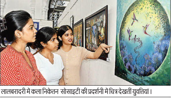
लालबहादुरी में कला निकेतन सोसाइटी की प्रदर्शनी में चित्र देखती युवतियां।