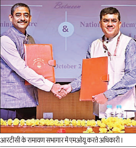
आरटीसी के रामायण सभागार में एमओयू करते अधिकारी।