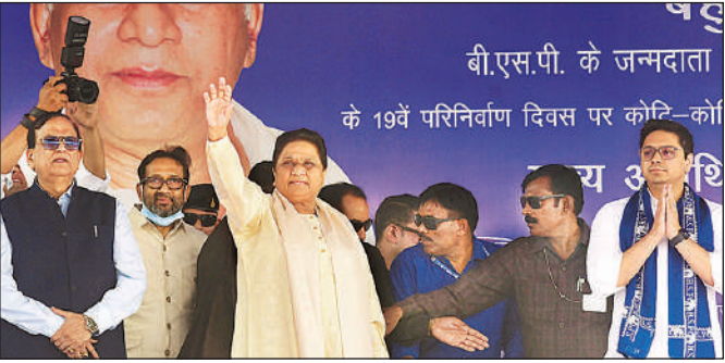
मंच से कार्यकर्ताओं का अभिवादन करती मायावती, साथ में आकाश आनंद और सतीश मिश्र ।