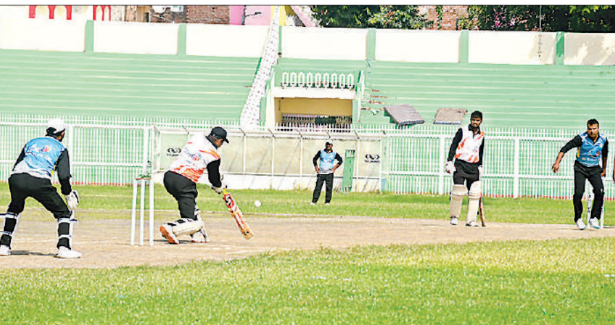
केडी सिंह बाबू स्टेडियम में इकाना टी 20 क्रिकेट मैच में बल्लेबाजी करते दूरदर्शन के कर्मी।