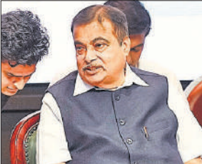
पीएचडीसीसीआई के 120वें वार्षिक सत्र में शामिल केंद्रीय मंत्री नितिन गडकरी।

पीएचडी चैंबर ऑफ कॉमर्स एंड इंडस्ट्री (पीएचडीसीसीआई) के 120वें वार्षिक सत्र में गडकरी ने कहा कि रणनीतिक जोजिला सुरंग का 75-80% काम हो चुका है। यह सुरंग लद्दाख क्षेत्र और देश के बाकी हिस्सों के बीच सभी मौसम में संपर्क प्रदान करेगी। उन्होंने कहा कि यदि राजमार्ग मंत्रालय अपनी सड़क परियोजनाओं का मौद्रिकरण करता है तो उसे 15 लाख करोड़ रुपये मिलेंगे। गडकरी ने कहा कि एक्सप्रेसवे और आर्थिक गलियारों के निर्माण से देश की लॉजिस्टिक्स लागत 16 से घटकर 10% हो गई है। दिसंबर तक भारत की लॉजिस्टिक्स लागत घटकर नौ प्रतिशत रह जाएगी, जिससे भारत को और अधिक प्रतिस्पर्धी बनने में मदद