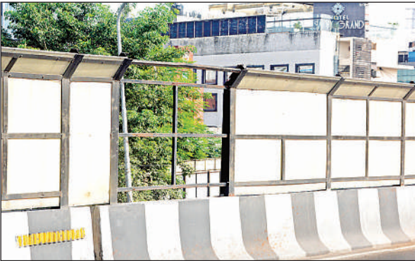
लोहिया अस्पताल से फन माल जाने वाले पुल की टूटी फाइबर की रेलिंग।