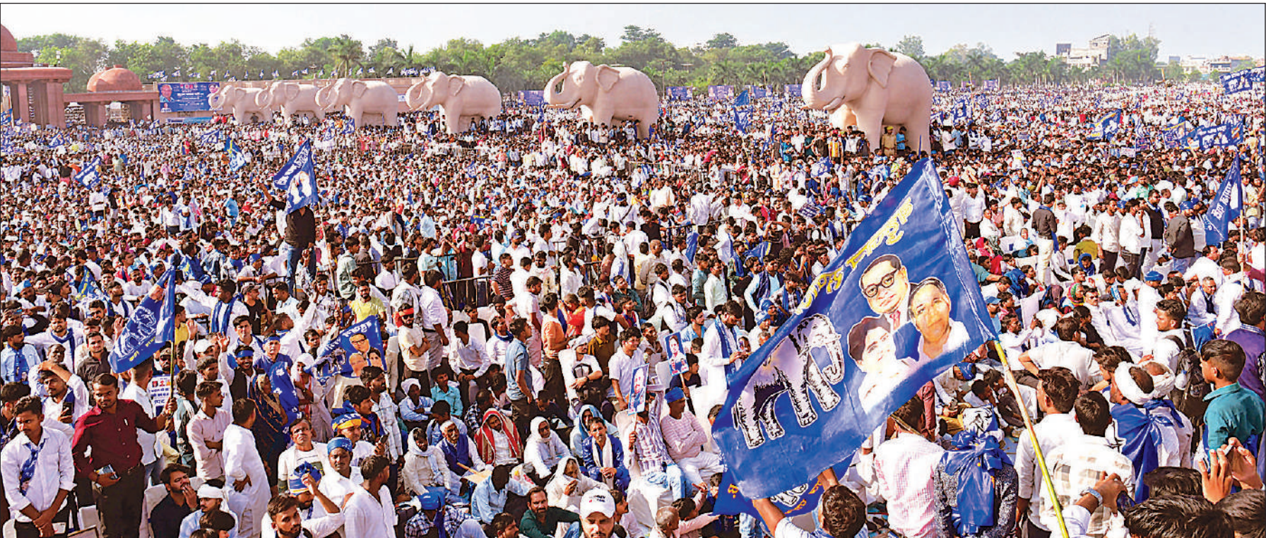
काशीराम की पुण्यतिथि पर राजधानी के काशीराम स्मारक स्थल पर आयोजित बसपा की रैली में भारी संख्या में शामिल पार्टी के समर्थक ।