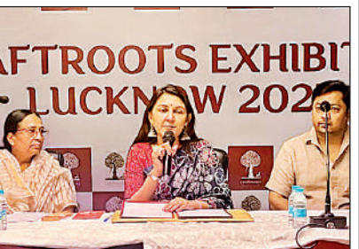
प्रदर्शनी की जानकारी देते आयोजक।