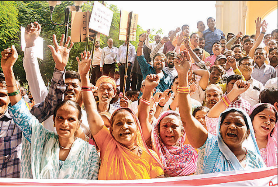
हजरतगंज स्थित गांधी प्रतिमा पर उत्तर प्रदेश स्थानीय निकाय कर्मचारी महासंघ के सदस्य अपनी मांगों को लेकर धरना देते।

आउटसोर्सिंग कर्मचारियों की बेहतर व्यवस्था के साथ पुरानी पेंशन बहाल की जाए। सिर्फ आश्वासन से काम नहीं चलेगा, 9 नवंबर तक मांगें नहीं मानी गईं तो पूर्ण कार्य बहिष्कार कर 10 नवंबर से बड़ा आंदोलन किया जाएगा। कहा कि कर्मचारियों ने कहा कि हम लोगों को वेतन 20,000 मिलना चाहिए। अभी सिर्फ 10,000 वेतन मिल रहा है। उसमें भी पीएफ नहीं मिल रहा है। काम रात दिन चाहिए लेकिन पैसा नहीं बढ़ाया जाता