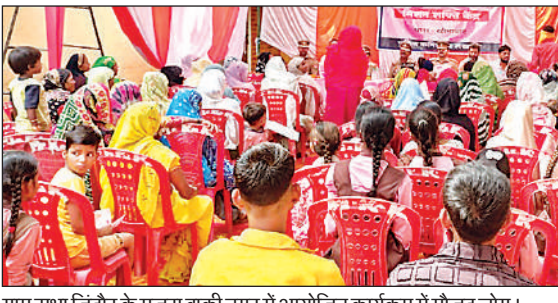
ग्राम सभा जिवंदर के मजरा बाकी नगर में आयोजित कार्यक्रम में मौजूद लोग।

स्कूल के शिक्षक, पुलिस और विशेषज्ञों ने बालिकाओं को नारी शक्ति और महिलाओं की उपलब्धियों के बारे में जानकारी दी। उन्हें यह सिखाया गया कि किसी भी तरह की परेशानी या