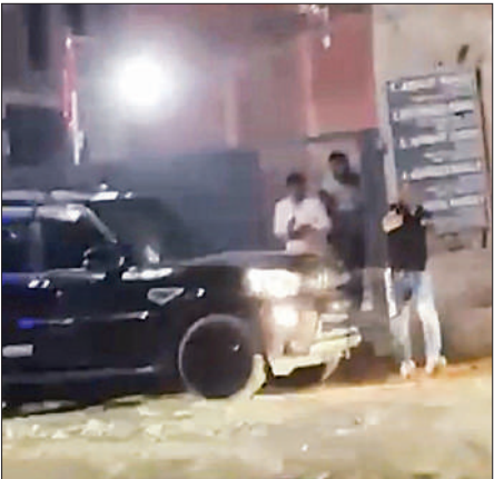
फुटेज में काली स्कार्पियो से उतरते आरोपी।