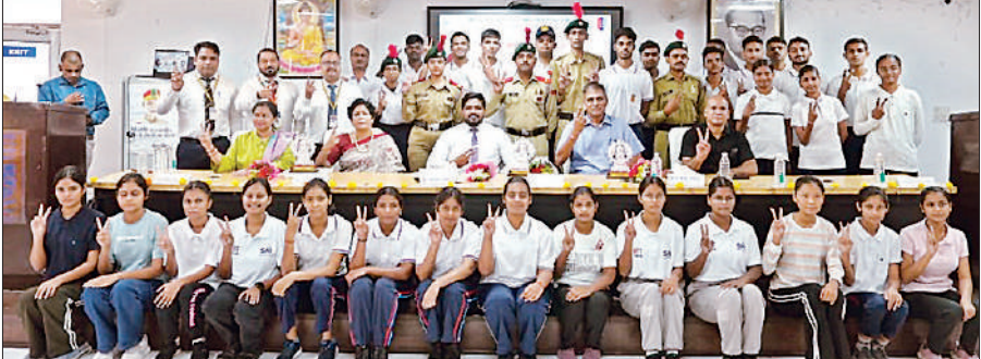
भारतीय वायु सेना दिवस पर आयोजित कार्यक्रम में छात्राएं व शिक्षक।

देशभक्ति, अनुशासन और निष्ठा की भावना पर दिया जोर