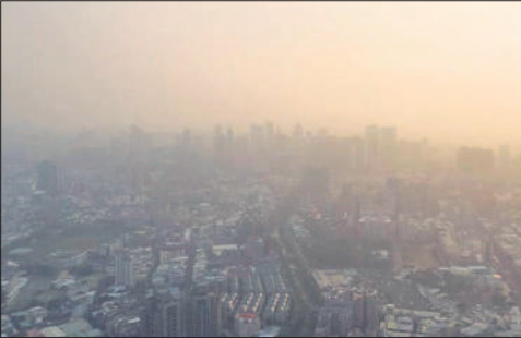
दिल्ली में प्रदूषण में छिपा सूर्य।