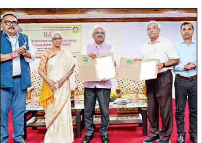
स्थापना दिवस के पर 'एरोमा मित्र' का विमोचन करते हुए।