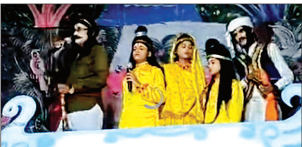
रामलीला का मंचन करते कलाकार।

● कलाकारों ने छठवें दिन अभिनय से किया सभी को प्रभावित