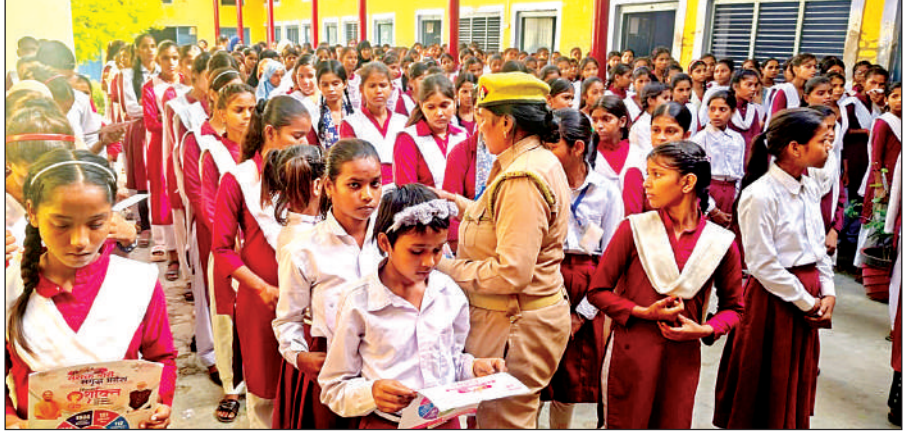
विद्यार्थियों को जागरूक करती महिला आरक्षी।

उन्होंने यह भी बताया कि किसी भी आपात स्थिति में महिलाएं निडर होकर तुरंत पुलिस से संपर्क करें, पुलिस हर संभव मदद प्रदान करेगी। कार्यक्रम के दौरान अभिभावकों और शिक्षकों ने भी महिला सुरक्षा को लेकर अपने विचार साझा किए, वहीं छात्राओं ने आत्मरक्षा के महत्व को समझते हुए उत्साहपूर्वक भागीदारी की।