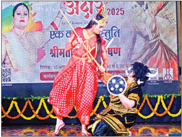
एकल नृत्य नाटिका का मंचन करते कलाकार।

संस्थान परिसर में सुबह से ही देशभर से आए कॉलेजों व संस्थानों की टीमों ने प्रतियोगिताओं में प्रतिभा दिखाना शुरू कर दिया था। एक ओर युवा प्रतिभा में दम दिखा रहे थे तो दूसरी ओर अपनी बारी का