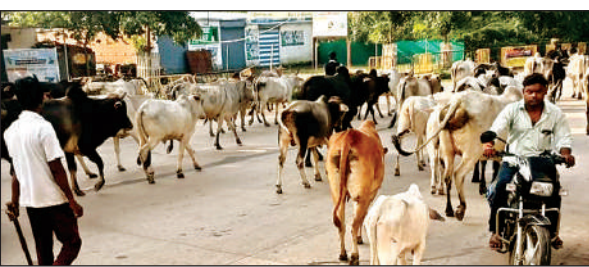
महोबा में गोवंशों को पकड़ते पालिकाकर्मों।