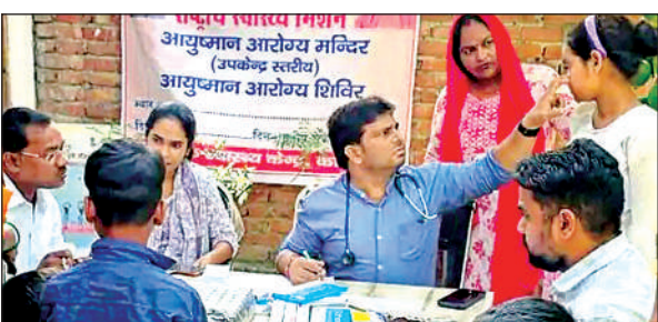
स्वास्थ्य शिविर में मरीजों का परीक्षण करते चिकित्सक।