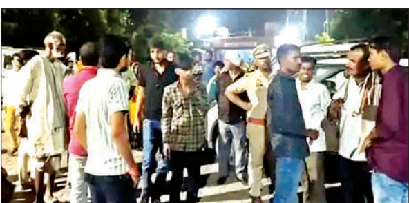
जिला अस्पताल में हंगामा करते मायके वाले।

● पुलिस को अभी पोस्टमार्टम रिपोर्ट आने का इंतजार