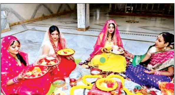
करवा चौथपर चांद का पूजन करती सुहागिन महिलाएं।

● चांद का दीदार करने के बाद पति के हाथ पानी पीकर तोड़ा उपवास पति ने दिए मनचाहे उपहार