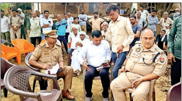
घटना की सूचना पर पहुंचे एसडीएम, सीओ व अन्य अधिकारी।