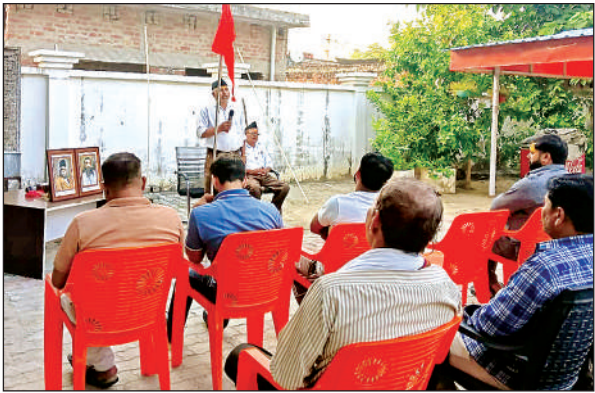
कार्यक्रम के दौरान मौजूद पदाधिकारी।