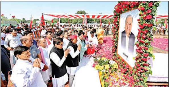
नेताजी की समाधि स्थल पर पुष्पांजलि अर्पित करते अखिलेश यादव व अन्य लोग ।

सपा चीफ अखिलेश यादव ने कहा हम सभी नेताजी की पुण्यतिथि पर उन्हें श्रद्धांजलि अर्पित करते हैं। उन्होंने कहा भाजपा सरकार संविधान को खत्म करने की साजिश कर रही है। वह तरह-तरह के हथकंडे अपना रही हैं, लेकिन हम उन सभी ताकतों को परास्त करेंगे जो सामाजिक न्याय के इस तरीके को खत्म करने की साजिश कर रही हैं। हम अपना संघर्ष जारी रखेंगे। पूरा पीडीए एक है। हम पीडीए के सम्मान और गरिमा के लिए लड़ेंगे।अखिलेश यादव ने