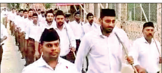
पथ संचलन करते स्वयंसेवक ।