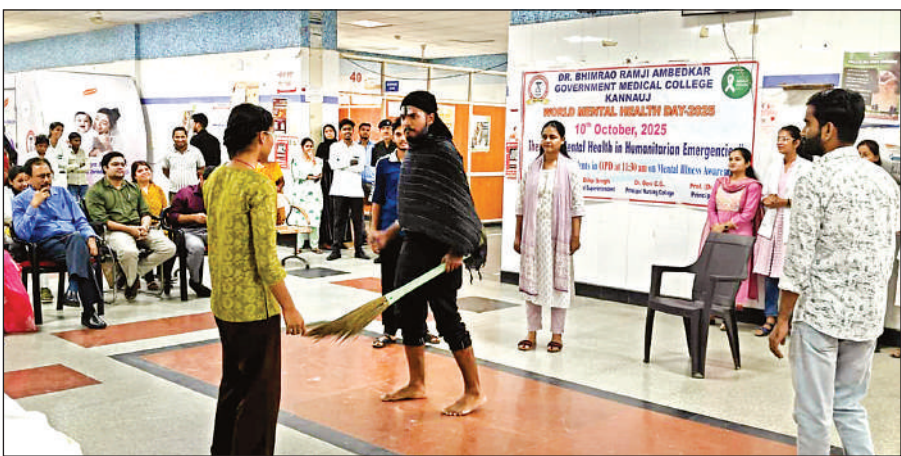
मेडिकल कॉलेज में मानसिक स्वास्थ्य को लेकर जागरूक करने को नाटक का मंचन करते कलाकार।