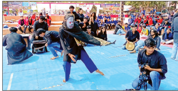
नुककड़ नाटक में अभिनय करती दिल्ली कॉलेज ऑफ आर्ट एंड कॉमर्स की टीम।

■ युवाओं का जोश ‘जुनून’ इवेंट में उमड़ा। इस इवेंट में विभिन्न टीमों की ओर से रॉक बैंड के जरिये प्रतिभा का प्रदर्शन किया गया। इस इवेंट को देखने के लिए बड़ी संख्या में युवा मौजूद रहे। इवेंट में शुक्रवार को 8 टीमों की ओर से गिटार, कीबोर्ड, ड्रम सहित अन्य वाद्ययंत्रों के जरिए ईस्टर्न रॉक म्यूजिक को प्रदर्शित किया गया। बैंड के जरिये ईस्टर्न म्यूजिक को बॉलीवुड गीतों के साथ मिक्स भी किया गया। खासतौर पर द हव्स, अपबीट, इववीनॉथ, बेयरवाह, रिफ्ट प्लीज जैसे बैंड के साथ मेमी प्रोफेशनल बैंड ने भी प्रस्तुतियां दीं।