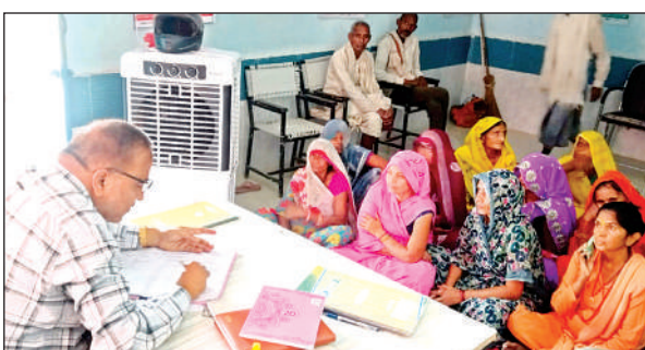
चौपाल में समस्याएं सुनते ग्राम पंचायत सचिव।