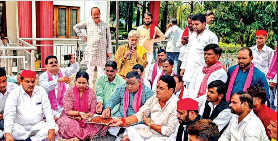
सपा कार्यालय में नेताजी मुलायम सिंह यादव की पुण्यतिथि पर हवन-पूजन करते सपाईं।