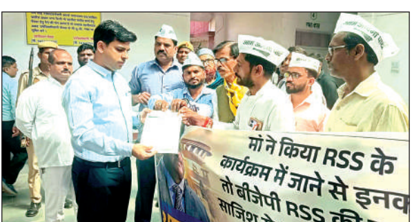
आम आदमी पार्टी के कार्यकर्ताओं ने एसडीएम को ज्ञापन सौंपा।

ज्ञापन में कहा गया कि भारत के मुख्य न्यायाधीश की ओर जूता फेंकना शर्मनाक है। यह कृत्य न सिर्फ सर्वोच्च न्यायालय का अपमान है, बल्कि संविधान, न्यायपालिका की स्वतंत्रता और बाबा साहेब डॉ.भीमराव अंबेडकर द्वारा स्थापित संवैधानिक मूल्यों पर सीधा हमला है। जूता फेंकने का प्रयास करने वाले व्यक्ति ने खुलेआम टेलीविजन पर अपने कृत्य पर गर्व व्यक्त किया, जो अत्यंत दुर्भाग्यपूर्ण और कानून