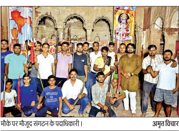
मौके पर मौजूद संगठन के पदाधिकारी।

औरैया। पीसीएस-प्री परीक्षा को सकुशल सफल बनाने हेतु कलेक्ट्रेट सभागार में जिलाधिकारी आशुतोष कुमार द्विवेदी की अध्यक्षता में तैयारी बैठक हुई। डीएम ने निर्देशित किया कि नोडल अधिकारी तत्काल कैमरा लगवाना सुनिश्चित करें सभी स्टैटिक मंजिस्ट्रेट अपने परीक्षा केंद्र का निरीक्षण कर व्यवस्थाएं परखें।