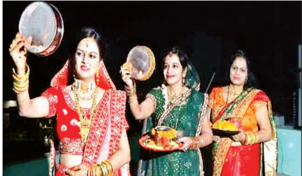
चांद का दीदार कर पूजन करतीं सुहागिन महिलाएं।

कार्तिक मास की चतुर्थी को करवा चौथ का व्रत हर सुहागिन महिला के लिए महत्वपूर्ण माना जाता है। इसी धारणा के चलते हिंदू महिलाएं अपनी पति की दीर्घायु, स्वास्थ्य और सुख समृद्धि के लिए