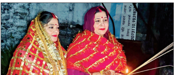
गुरसहायगंज में करवाचौथ पर पूजन करती सुहागिनें।