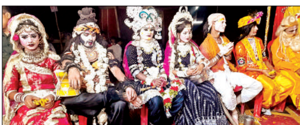
राम बारात में शामिल झांकियां।

कस्बा नादेमऊ में इस वर्ष भी बहुत ही धूमधाम से दो दर्जन मनमोहक झांकियों के साथ भगवान राम की बारात निकाली गई। गुरुवार की रात सुभाष इंटर कॉलेज से प्रारंभ हुई बारात नगर के प्रमुख मार्गों से गुजरी तो लोगों ने अपनी अपनी छतों