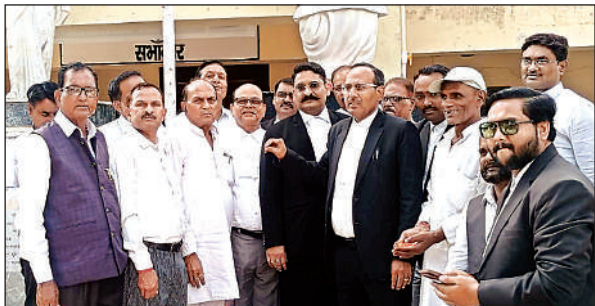
कचहरी पर नेताजी की मूर्ति पर फूल चढ़ाते अधिवक्ता ।

और सेक्युलरिज्म को मजबूत बनाने का काम किया। इस देश में हम सब मिलकर के पीडीए सरकार बनाकर पीडीए समाज को हक और सम्मान दिलाएंगे।अखिलेश यादव ने कहा हम नेताजी को शत-शत नमन करते हैं। यह भी संकल्प लेते हैं कि नेताजी ने जीवन भर जिन सिद्धांतों के लिए संघर्ष किया और समाजवाद को बढ़ाया। उस पर चलकर उनके सपनों को पूरा करने का काम करेंगे। संविधान की रक्षा के लिए एकजुट