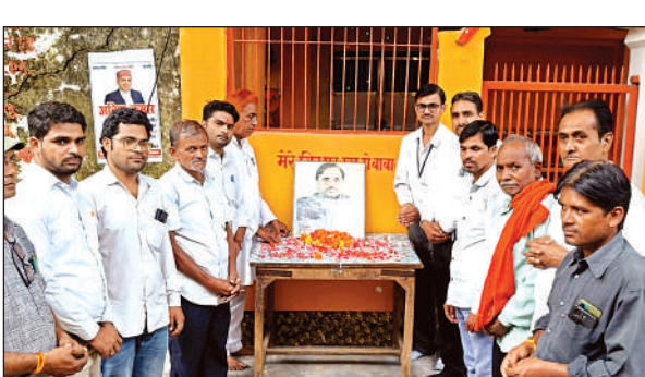
सदर तहसील परिसर में मुलायम सिंह यादव की पुण्यतिथि मनाते अधिकता व अन्य।

तेराजाकेट में आयोजित श्रद्धांजलि सभा में शिक्षक सभा के जिलाध्यक्ष अमित यादव के नेतृत्व में पुण्यतिथि मनाई गई। इस मौके पर टिल्लू