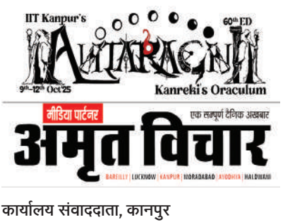
कार्यालय संवाददाता, कानपुर

अमृत विचार। आईआईटी कानपुर में चल रहे युवा सांस्कृतिक महोत्सव अंतराग्नि के दूसरे दिन शुक्रवार को संगीत से जुड़े इवेंट ने सभी को आकर्षित किया। डांस, म्यूजिक और गिटार सहित विभिन्न वाद्ययंत्रों ने युवाओं का मन मोहा। अक्षर में साहित्यिक आयोजन हुए। मुख्य रूप से ऋतुभरा और ईडीएम नाइट ने चार चांद लगा दिए। अमृत विचार अंतराग्नि का मीडिया पार्टनर है। संस्थान परिसर में सुबह से ही देशभर से आए कॉलेजों व संस्थानों की टीमों ने प्रतियोगिताओं में प्रतिभा दिखाना शुरू कर दिया था। एक ओर युवा प्रतिभा में दम दिखा रहे थे तो दूसरी ओर अपनी बारी का इंतजार कर रहे टीम के सदस्य अभ्यास कर खुद को मांझ रहे थे। इस बीच आयोजन स्थल में प्रैक्टिस के दौरान आ रही गिटार, ड्रम और गीतों की आवाजें बाकियों में उत्साह भर रही थी। साहित्य आयोजन अक्षर में भी संवाद और अभिनय के माध्यम से साहित्यिक रचनाओं को युवाओं तक आसान भाषा में पहुंचाया जा रहा था। देर रात ऋतुभरा में आयोजन के दूसरे दिन 6 टीमों के प्रतिभागियों ने अपनी प्रतिभा का प्रदर्शन किया। ईडीएम नाइट में संगीत और नृत्य के बीच माहौल में उत्साह भर दिया गया।