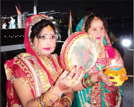
चांद का दीदार करती सुहागिनें।

खरीदारों से गुलजार रहीं। इसमें डिजाइनर गजरो की खूब बिक्री हुई। खासकर नव विवाहिताओं में पहले करवाचौथ को लेकर विशेष उत्साह