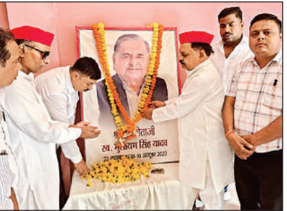
मुलायम सिंह यादव के चित्र पर पुष्प अर्पित करते सपा अमृत विचार कार्यकर्ता ।

उन्नाव, अमृत विचार । समाजवादी पार्टी के संस्थापक व पूर्व मुख्यमंत्री मुलायम सिंह यादव की तीसरी पुण्यतिथि पर जिले के समाजवादियों ने धरती पुत्र के नाम से प्रसिद्ध मुलायम सिंह यादव को श्रद्धांजलि अर्पित की।