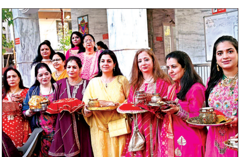
पांडुनगर में पूजा के लिए जाती महिलाएं।