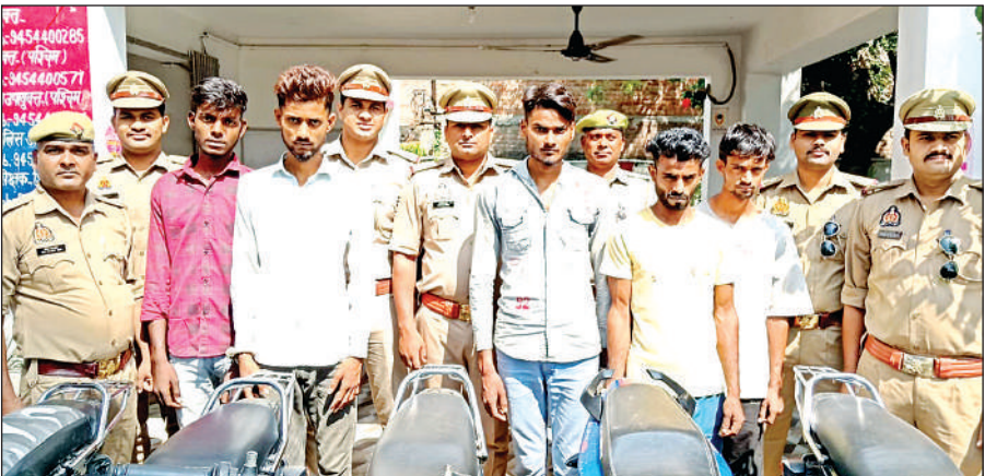
पुलिस की गिरफ्त में खड़े बाइक चोर।