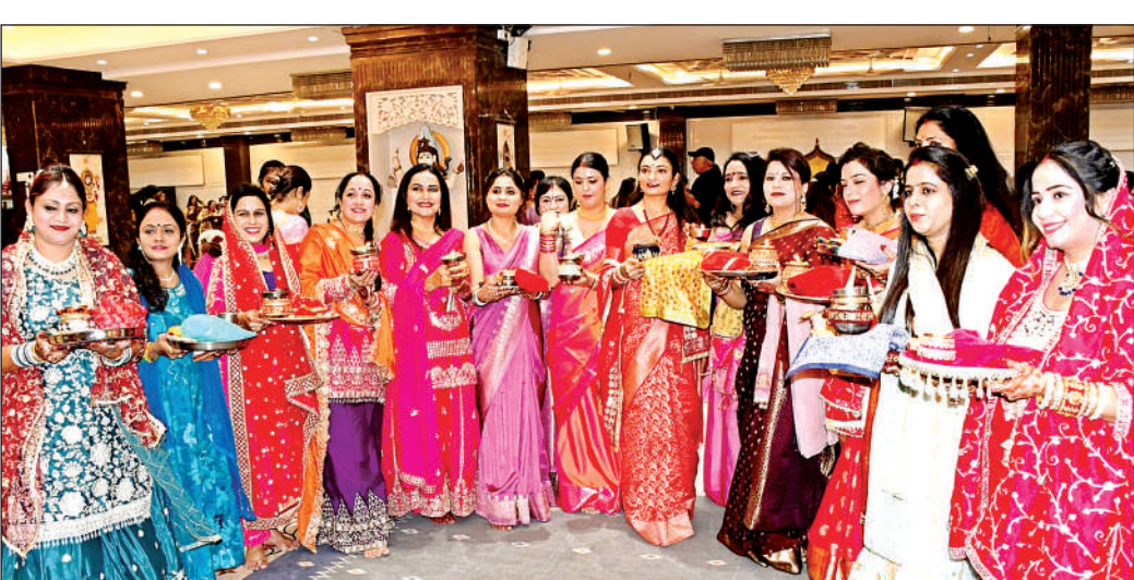
सनातन धर्म मंदिर कौशलपुरी में सामूहिक पूजा हुई।

अमृत विचार। हाथों में पिया के नाम की मेहंदी, सोलह श्रृंगार कर अखंड सौभाग्य की कामना के साथ महिलाओं ने शुक्रवार को करवाचौथ का व्रत रखा। सूरज अस्त हुआ तो चांद के दर्शन की बेचैनी हर किसी के चेहरे पर देखी गई। जब चांद निकला तो भगवान गणेश और चंद्रदेव का पूजन कर पति देव की आरती की और चलनी की ओट से पिया और चांद को देखकर व्रत का पारण किया। कई जगहों पर सामूहिक पूजन का आयोजन किया गया। सुहागिनों ने मंदिरों में दर्शन पूजन कर पति के मंगलमय जीवन की कामना की। अखंड सौभाग्य की कामना के इस पर्व पर ज्यों- ज्यों दिन ढलता गया व्रती महिलाओं की बेचैनी बढ़ती ही गई। खासकर उन महिलाओं की जिनका पहला करवाचौथ था। उन्हें तो बेचैनी इस बात थी कि जल्द से जल्द वे अपने पिया को चंद्रमा के साथ देखें और उनके हाथों से जल की एक घूंट पीकर व्रत तोड़ें