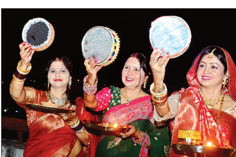
बारादेवी में चलनी से चंद्रमा देखती सुहागिनें।