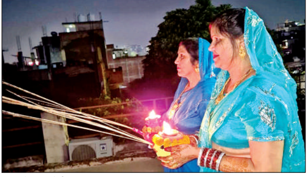
चांद को अर्घ्य देती महिलाएं।

पौराणिक मान्यताओं के अनुसार सारा भाइयों की इकलौती बहन निवातनी ने अपने पति की लंबी आयु के लिए करवा चौथ का व्रत रखा था। भूख से परेशान होकर उसने भोजन कर लिया था जिसके फल स्वरूप उसके पति की मृत्यु हो गई थी। पति की मृत्यु के बाद भी माता इंद्राणी ने वीरावती को सात्वना प्रदान की व कहा कि करवा चौथ का व्रत