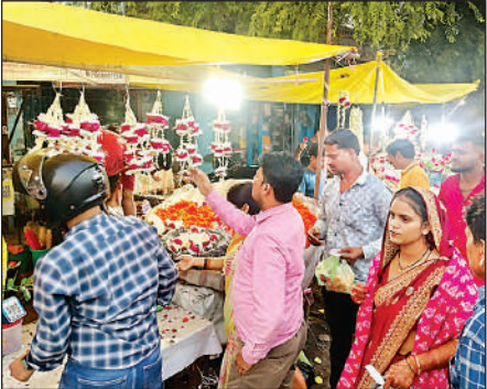
फूल की दुकान में होती खरीदारी।

करवाचौथ को लेकर बाजारों में खासी रौनक देखने को मिली। महिलाओं ने अपनी पसंद के कपड़े, गहने व श्रृंगार की सामग्री खरीदी। शहर के ब्यूटी पार्लरों में भी महिलाओं की काफी भीड़ रही। सदर बाजार में सजी दुकानें पर पूजन सामग्री जैसे