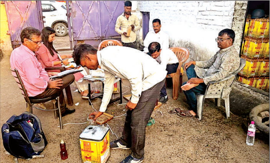
खाद्य पदार्थों की जांच करते अधिकारी।