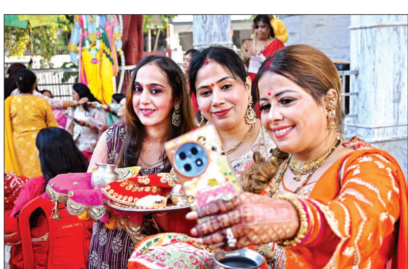
माडल टाउन पांडु नगर में सेल्फी लेती महिलाएं।

अंतराग्नि के तहत डांस के जरिये युवाओं ने दो मिनट में अपनी प्रतिभा का प्रदर्शन किया। इवेंट एस्टापी व जितरबर्ग के पहले राउंड में टीमों ने समूह व एकल वर्ग में बंटकर प्रतिभा को प्रदर्शित किया। इस आयोजन में हंसराज कॉलेज दिल्ली, दौलतराम कॉलेज दिल्ली, जाकिर हुसैन कॉलेज दिल्ली, बीबीडीयू लखनऊ व आत्माराम स्नातनधर्म कॉलेज की टीम के प्रदर्शन को सराहा गया।