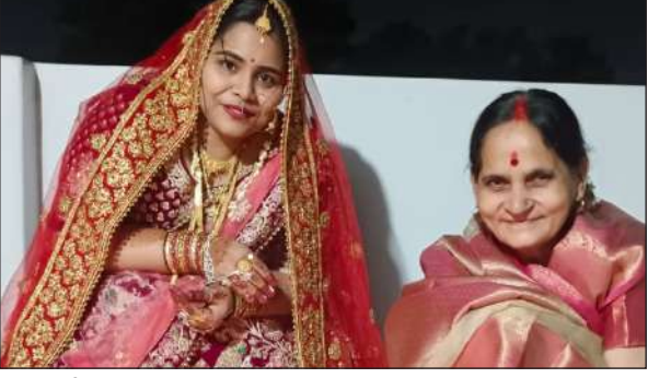
पूजा करती महिलाएं।

घाटमपुर। करवा चौथ का त्योहार धूमधाम से मनाया गया। जिसमें सुहागिन महिलाओं ने अपने पति की लंबी उम्र के लिए विशेष पूजा अर्चना की। इस अवसर पर महिलाओं ने दिनभर निर्जला उपावास रखा और शाम 8 बजे चांद को देखते ही व्रत दीवार के साथ अपना व्रत खोला।