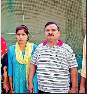
साथ खड़े दंपती।