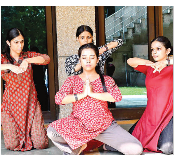
एस्टापी व जितरबर्ग इवेंट में डांस का अभ्यास करती प्रतिभागी।

अंतराग्नि में शुक्रवार को नुककड नाटक के जरिये विभिन्न सामाजिक संदेश दिए गए। इस इवेंट में देशभर से आई 33 टीमों के कलाकारों ने अपने अभिनय को प्रदर्शित किया। इन टीमों में खासतौर पर आईआईटी कानपुर, बीएचयू व दिल्ली विश्वविद्यालय की टीमों प्रमुख रहीं। इन आयोजन में युवाओं की ओर से सोसाइटी में डर किस तरह फैलाया जात है और डर से कारोबार को किस तरह बढ़ाया जाता है उस पर समस्याओं पर भी व्यंग्य किए गए।