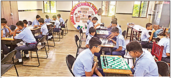
अंबिका स्कूल में चेस प्रतियोगिता में भाग लेते छात्र ।