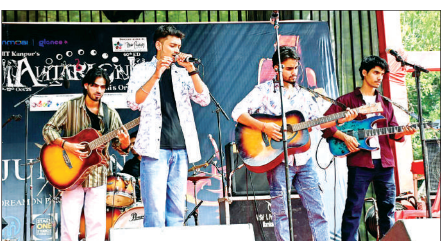
जुनून इवेंट में प्रस्तुति देता द हंसक ग्रुप।