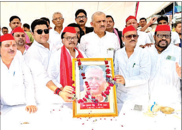
परेड में नेताजी की पुण्यतिथि में शामिल सपा पदाधिकारी, विधायक व कार्यकर्ता।