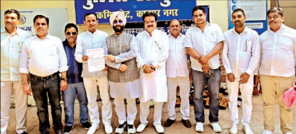
ज्ञापन देने जाते व्यापारी नेता।