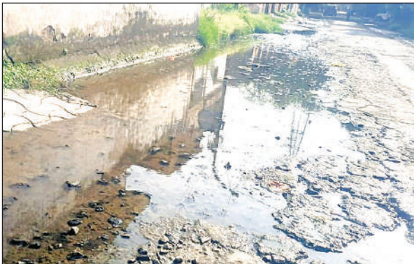
जेके कैंसर संस्थान में गंदा पानी भरा।

रावतपुर स्थित जेके कैंसर संस्थान में प्रतिदिन 200 से 250 मरीज इलाज के लिए आते हैं। लंबी दूरी तय कर अस्पताल में इलाज के लिए आने वाले कई कैंसर ग्रस्त मरीजों के रुकने के लिए परिसर में रैन बसेरा बना है।