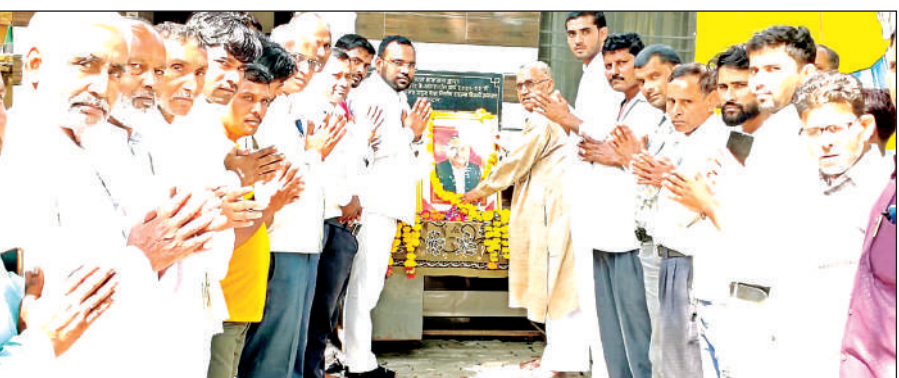
मुलायम सिंह यादव के चित्र पर पुष्पांजलि करते सपा कार्यकर्ता।