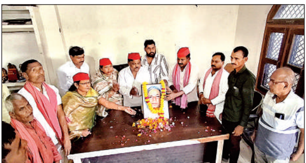
कांशीराम के चित्र पर माल्यार्पण करते सपाईं।