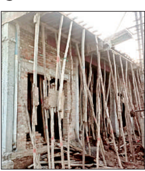
होता निर्माण कार्य।

अमृत विचार। घाटमपुर के रेडना थाना के गिरसी गांव में एक मदरसा संचालक के द्वारा बजरंगबली मंदिर के रास्ते पर अवैध निर्माण किए जाने से विवाद हो गया था। इसके बाद यह मामला एसडीएम की चौखट पर पहुंच गया था। जिसके बाद एसडीएम घाटमपुर ने पांच सदस्यीय समिति गठित कर अवैध निर्माण को तत्काल रोके जाने की बात कही थी। मदरसा संचालक के द्वारा एक बार पुनः विवादित मकान का निर्माण कार्य शुरू करा दिया गया। मामले की सूचना रेडना पुलिस को ग्रामीणों ने दी। सूचना पर पहुंची पुलिस ने मदरसा संचालक को बुलाकर