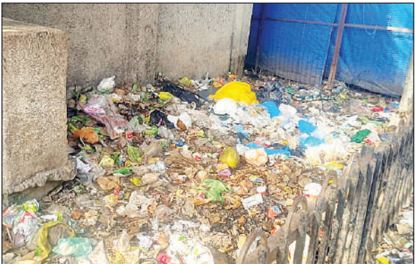
अस्पताल परिसर में फैली गंदगी।