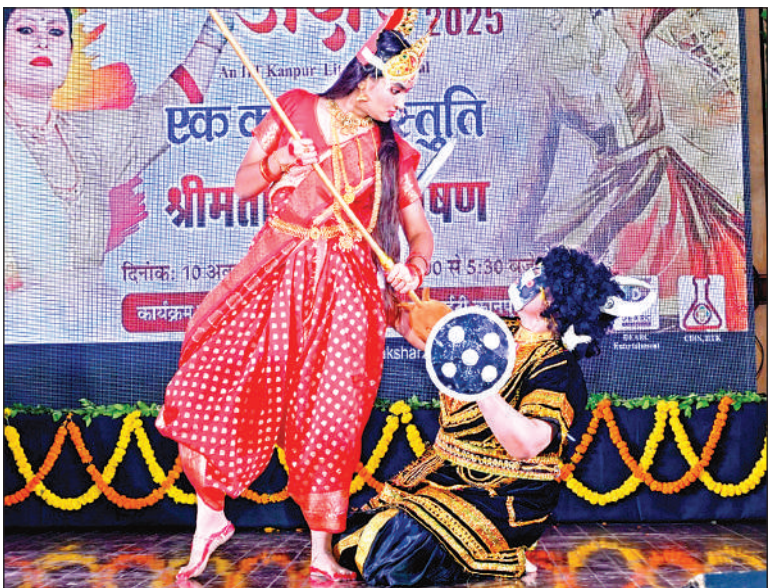
अक्षर में किया नाटिका का मंचन।

अमृत विचार। आईआईटी कानपुर में चल रहे युवा सांस्कृतिक महोत्सव अंतराग्नि के दूसरे दिन शुक्रवार को संगीत से जुड़े इवेंट ने सभी को आकर्षित किया। डांस, म्यूजिक और गिटार सहित विभिन्न वाद्ययंत्रों ने युवाओं का मन मोहा। अक्षर में साहित्यिक आयोजन हुए। मुख्य रूप से ऋतुभरा और ईडीएम नाइट ने चार चांद लगा दिए। अमृत विचार अंतराग्नि का मीडिया पार्टनर है। संस्थान परिसर में सुबह से ही देशभर से आए कॉलेजों व संस्थानों की टीमों ने प्रतियोगिताओं में प्रतिभा दिखाना शुरू कर दिया था। एक ओर युवा प्रतिभा में दम दिखा रहे थे तो दूसरी ओर अपनी बारी का इंतजार कर रहे टीम के सदस्य अभ्यास कर खुद को मांझ रहे थे। इस बीच आयोजन स्थल में प्रैक्टिस के दौरान आ रही गिटार, ड्रम और गीतों की आवाजें बाकियों में उत्साह भर रही थी। साहित्य आयोजन अक्षर में भी संवाद और अभिनय के माध्यम से साहित्यिक रचनाओं को युवाओं तक आसान भाषा में पहुंचाया जा रहा था। देर रात ऋतुभरा में आयोजन के दूसरे दिन 6 टीमों के प्रतिभागियों ने अपनी प्रतिभा का प्रदर्शन किया। ईडीएम नाइट में संगीत और नृत्य के बीच माहौल में उत्साह भर दिया गया।