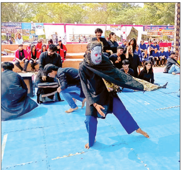
नुककड नाटक में अभिनय करती दिल्ली कॉलेज ऑफ आर्ट एंड कॉमर्स की टीम।