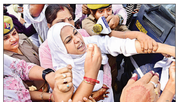
लखनऊ में आम आदमी पार्टी के प्रदर्शन के दौरान महिला कार्यकर्ता को पकड़कर ले जाती पुलिस।

ताकि कांशीराम के सपने साकार किए जाएं। बसपा प्रमुख ने शुक्रवार को सोशल मीडिया एक्स पर कार्यकर्ताओं से कहा कि बहुजन समाज के लोग अपने वोटों के बलबूते पर शोषित से शासक वर्ग बनकर बाबा साहेब डॉ. भीमराव आंबेडकर का सपना पूरा करने के लिए कितने तत्पर व संघर्षशील हैं। इसकी झलक गुरुवार को उन लोगों ने उप्र. समेत पूरे देश को दिखा दी है।