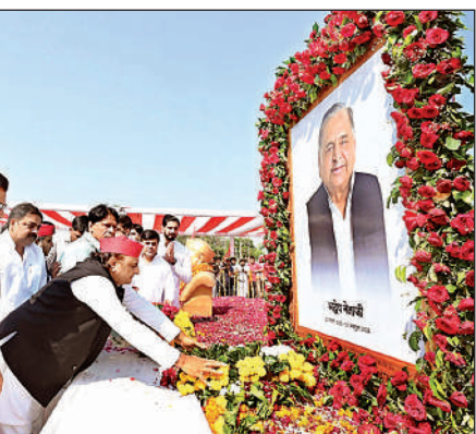
सैफई में मुलायम सिंह यादव के चित्र पर पुष्पांजलि अर्पित करते सपा प्रमुख अखिलेश यादव, साथ में अन्य ।