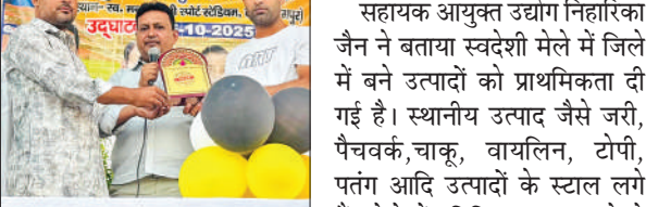
विजयी टीम को पुरस्कार देते मुख्य अतिथि।

रामपुर, अमृत विचार : रोशन बाग में स्वदेशी मेले का आयोजन हो रहा है। शुक्रवार को सांस्कृतिक संस्था में दयावती मोदी एकेडमी के शिक्षकों द्वारा गीत गाए।