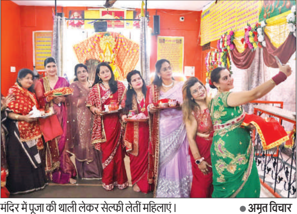
मंदिर में पूजा की थाली लेकर सेल्फी लेती महिलाएं।