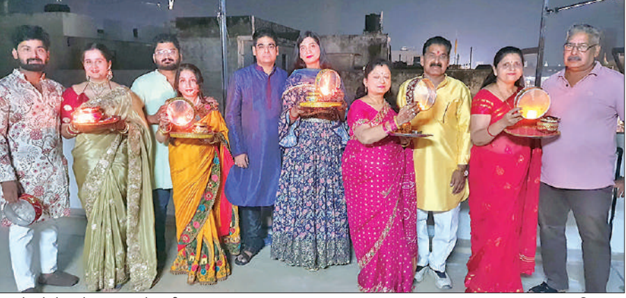
चांद देखने से पहले छत पर पहुंचे दंपती।

समाज के लोग जागरूक नहीं हैं। समाज के जो लोग पारिवारिक एवं सामाजिक रूप से संगठित नहीं रहते हैं। दलित, पिछड़ा, आदिवासी एवं अल्पसंख्यक आदि जातिवर्गों में बांट रखा है और दलित, पिछड़े, आदिवासी एवं अल्पसंख्यक जब तक अपनी अज्ञानता एवं