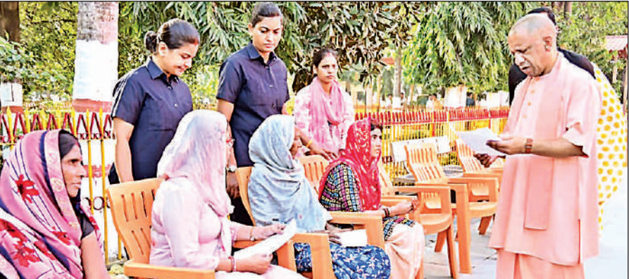
गोरखपुर में आयोजित जनता दर्शन में फरियादियों की समस्याएं सुनते मुख्यमंत्री योगी।

मुख्यमंत्री शुक्रवार को सुबह गोरखनाथ मंदिर परिसर में आयोजित जनता दर्शन में लोगों की समस्याएं सुन रहे थे। उन्होंने करीब 200 लोगों की समस्याएं सुनीं। उन्होंने उपस्थित अधिकारियों से कहा कि हर शिकायत का समयबद्ध, पारदर्शी और गुणवत्तापूर्ण निस्तारण सुनिश्चित किया जाए।