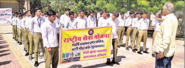
सड़क सुरक्षा नियमों की शपथ दिलाते प्रधानाचार्य। ● अमृत विचार