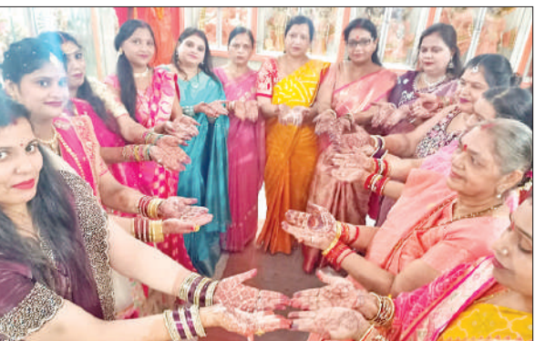
करवा चौथ पूजन के दौरान मेहंदी लगे हाथ दिखाती सुहागिनें।

करवा चौथ त्योहार को लेकर पिछले कई दिनों से तैयारी चल रही थी। शुक्रवार को सुहागिन महिलाओं ने पति की सुख-समृद्धि के लिए व्रत रखा। तमाम महिलाओं ने बाजारों से सौंदर्य प्रसाधन का सामान खरीदा। बिछुए और अन्य जेवरों की भी खरीदारी की। शाम को महिलाओं ने पूजा अर्चना की तैयारी की। तरह-तरह के पकवान तैयार किए। इसके बाद