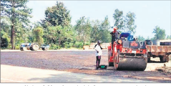
टनकपुर हाईवे से नवनिर्मित बाईपास जोड़ने के लिए बनाया जा रहा एप्रोच रोड।

शहर से गुजरने वाले टनकपुर हाईवे से उत्तराखंड से यूपी आने और जाने वाले वाहनों का संचालन होता है। बड़े वाहनों की आवाजाही से अकसर इस हाईवे पर जाम की समस्या बनी हुई है। इसी हाईवे पर कलेक्ट्रेट, विकास भवन, कचहरी समेत तमाम बड़े अस्पताल और अन्य विभागों के