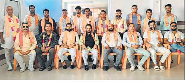
नवगठित पदाधिकारियों संग जिलाध्यक्ष व अन्य।

डॉक्टरों की 24 घंटे इयूटी लगाई है। जहां छह मरीजों का इलाज किया जा रहा है। इसके अलावा 20 मरीज बीसलपुर सीएचसी में भर्ती है। जिनका इलाज किया जा रहा है। साथ ही एक एंबुलेंस भी गांव में लगा दी गई है। 15 दिन के भीतर हुई जांचों में 19 से अधिक डेंगू पॉजिटिव मरीज सामने आए हैं। इनमें कुछ मरीजों की मौत भी हो चुकी है, तो कई बरेली में इलाज करा रहे हैं। शनिवार को लिफा गे सैपल की रिपोर्ट आना अभी बाकी है। सीएमओ इस गांव में डेंगू की ब्रीड बनने का कारण वहां फैली गंदगी और घरों में पानी का जमाबाड़ा है। जो मच्छरों के लार्वा को तैयार कर रहे हैं। टीमें लगाकर उन्हें नष्ट भी करा रहे हैं, लेकिन लोग समझाने को तैयार नहीं है।