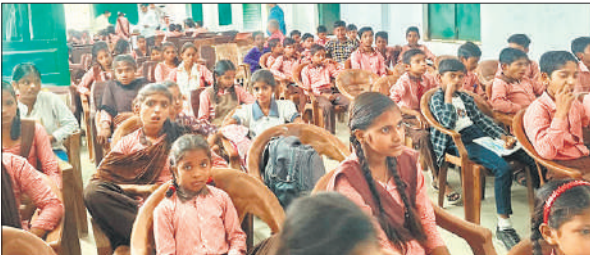
स्पेल बी परीक्षा में शामिल हुए बच्चे।