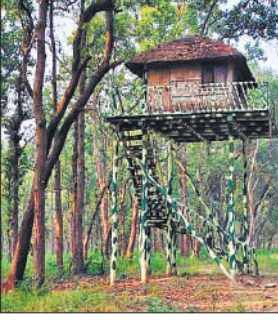
पीलीभीत टाइगर रिजर्व की महोफ रेंज में बना वाँच टावर।

जनपद में 73 हजार हेक्टेयर से अधिक क्षेत्रफल में फैले पीलीभीत के जंगल को जून 2014 में टाइगर रिजर्व का दर्जा दिया गया था।