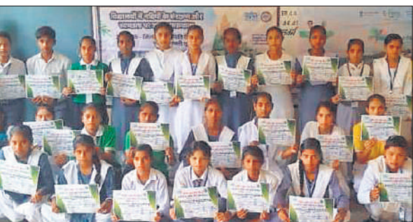
गोमती उद्गम स्थल पर हुए कार्यक्रम में प्रतिभाग करते विद्यार्थी।

इस दौरान नदी प्रेरक, पोस्टर एवं रंगोली प्रतियोगिता का आयोजन किया गया। जिसमें विद्यार्थियों ने बड़बड़ कर अपनी प्रतिभा का प्रदर्शन किया। कार्यक्रम में जिला गंगा समिति के नामित सदस्य