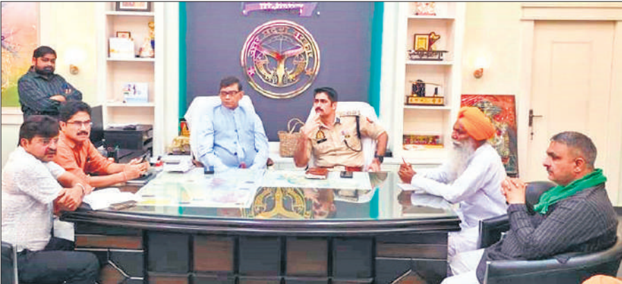
डीएम – एसपी से धान खरीद को लेकर वार्ता करते भाकियू चढ़ूनी के राष्ट्रीय अध्यक्ष।

इस पर डिप्टी आरएमओ ने शुरुआत में शासनादेश और मंडी की नियमावली का हवाला देते हुए बचाव करने का प्रयास किया, लेकिन जब एक-एक कर साथ लाए गए किसानों ने धांधली से जुड़ी हकीकत के कुछ साक्ष्य पेश किए तो डिप्टी आरएमओ जवाब नहीं दे पाए। कुछ प्रतिशत गड़बड़ी को स्वीकारा भी और फिर बीते साल की गई कार्रवाई का हवाला देकर साख बचाते नजर आए। अंत में डीएम-एसपी ने खरीद को नियमानुसार और पारदर्शिता से कराने का आश्वासन दिया।बता दें 3 अक्टूबर से सरकारी भाव पर धान खरीद की शुरुआत की गई है। 132 क्रय केंद्र बनाए गए हैं और न्यूनतम समर्थन मूल्य 2369