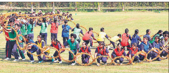
एनुअल एथलेटिक्स मीट की शुरुआत पर प्रस्तुति देते बच्चे।