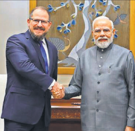
नई दिल्ली में क्वालकॉम के सीईओ और अध्यक्ष क्रिस्टियानो अमोन से मिलते प्रधानमंत्री नरेंद्र मोदी।

देखकर बहुत अच्छा लगा। भारत ऐसी प्रौद्योगिकियों के निर्माण के लिए बेजोड़ प्रतिभा और व्यापकता प्रदान करता है, जो हमारे सामूहिक भविष्य को आकार देगी। अमोन ने शुक्रवार को प्रधानमंत्री से उनके सरकारी आवास पर मुलाकात की। उन्होंने शुक्रवार को 'एक्स' पर एक पोस्ट में कहा कि भारत एआई और भारत सेमीकंडक्टर मिशनों के समर्थन में क्वालकॉम और भारत के बीच व्यापक साझेदारी को बढ़ावा देने के साथ-साथ 6जी में बदलाव पर शानदार बातचीत के लिए प्रधानमंत्री नरेन्द्र मोदी को धन्यवाद। अमोन ने कहा