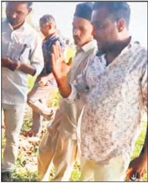
धमकाता दबंग।

कि दबंगों ने कानूनगो को घेरा हुआ है, उनके हाथ पकड़कर खींचने की कोशिश की और फाइल छीनने का प्रयास भी किया। एक दबंग के हाथ में डंडा भी दिखा, जिससे मारपीट की कोशिश हुई। हालांकि, मौके पर मौजूद अन्य व्यक्ति ने उसे रोकने का प्रयास किया। स्थानीय लोगों का कहना है कि इस दौरान दबंगों में पुलिस का कोई भय नहीं था। यह पूरी घटना सरकारी कार्य में बाधा डालने के स्पष्ट उदाहरण के रूप में सामने आई है। अधिकारियों ने कहा कि इस प्रकार की घटनाएं न केवल सरकारी कार्य में रुकावट डालती हैं, बल्कि समाज में कानून और व्यवस्था के प्रति अवमानना का संदेश भी देती हैं। वीडियो में देखा