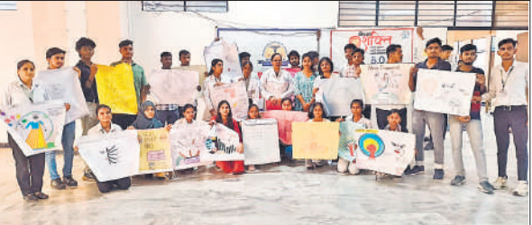
वरुण अर्जुन यूनिवर्सिटी में पोस्टर प्रतियोगिता के दौरान उपस्थित छात्र-छात्राएं।