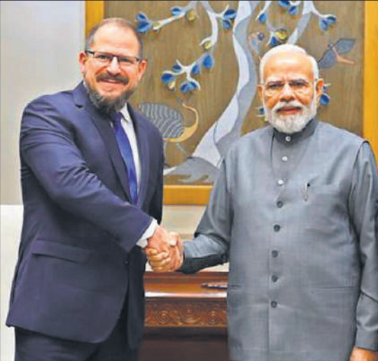
नई दिल्ली में क्वालकॉम के सीईओ और अध्यक्ष क्रिस्टियानो अमोन से मिलते प्रधानमंत्री नरेंद्र मोदी।

देखकर बहुत अच्छा लगा। भारत ऐसी प्रौद्योगिकियों के निर्माण के लिए बेजोड़ प्रतिभा और व्यापकता प्रदान करता है, जो हमारे सामूहिक भविष्य को आकार देगी। अमोन ने शुक्रवार को प्रधानमंत्री से उनके सरकारी आवास पर मुलाकात की। उन्होंने शुक्रवार को 'एक्स' पर एक पोस्ट में कहा कि भारत एआई और भारत सेमीकंडक्टर मिशनों के समर्थन में क्वालकॉम और भारत के बीच व्यापक साझेदारी को बढ़ावा देने के साथ-साथ 6जी में बदलाव पर शानदार बातचीत के लिए प्रधानमंत्री नरेन्द्र मोदी को धन्यवाद। अमोन ने कहा