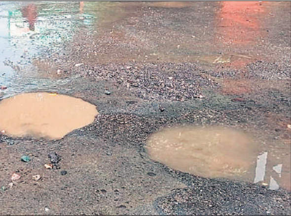
पाइप लाइन टूटने के बाद बीच सड़क पर बह रहा पानी।

अमृत विचार : शहर में अनेकों जगहों पर पानी की पाइप लाइन क्षतिग्रस्त हैं जिससे सड़कों पर पानी बहता रहता है। रोडवेज से अस्पताल को जाने वाली सड़क पर अंडर ग्राउंड पानी की पाइप लाइन टूट गई। इससे सड़क पर पानी बह रहा है। इससे वाहन चालकों को परेशानी का सामना करना पड़ा। वहीं दोनों अस्पतालों के बीच की सड़क को बंद कर नाले पर स्लैप डाला गया। इससे वाहन चालक लंबा चक्कर लगाने को मजबूर है। कुछ बाइक बाइक फिसल कर गिर गए।