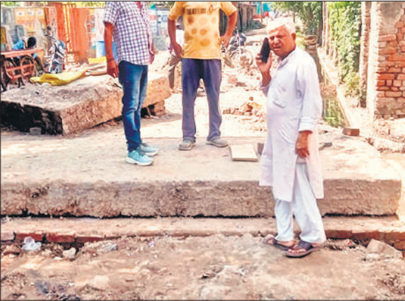
नाले पर बनाया गया स्लैप जिस कारण आवागमन बंद हो गया।

को परेशानी होती है। परशुराम चौक से कचहरी को जाने वाली सड़क स्थित तिराहे पर शनिवार को सुबह अंडरग्राउंड पानी की पाइप लाइन क्षतिग्रस्त हो गई। इससे पाइप का पानी सड़क पर बहने लगा। सुबह 8 बजे तक कम पानी आया, लेकिन दो घंटे बाद भी किसी ने पानी रोकने का प्रयास