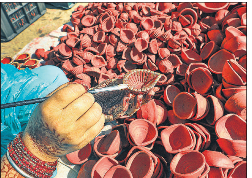
प्रकाश पर्व दिवाली से पहले जम्मू के बाजार में बिक्री के लिए मिट्टी के दीये सजाती कारीगर।

जोर दिया कि सुरक्षा और सुविधाएं भारतीय रेलवे के लिए सर्वोपरि हैं, यही वजह है कि इस तरह की कई पहलों को लागू किया जा रहा है। पंद्रह फरवरी, 2025 को नयी दिल्ली रेलवे स्टेशन पर मची भगदड़ में 18 यात्रियों की मौत के बाद, रेल मंत्रालय ने देश भर के पांच रेलवे स्टेशनों पर स्थायी प्रतीक्षास्थल बनाने का आदेश दिया था। नई दिल्ली रेलवे स्टेशन के अलावा, अन्य चार स्टेशन आनंद विहार, गाजियाबाद, वाराणसी और अयोध्या हैं।