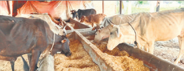
गोशाला में सूखा भूसा खाते गोवंशीय पशु।

यही वजह है कि लापरवाही बरतने वाले अधिकारियों के चलते गोशाला में दिन पर दिन गोवंशीय पशुओं की संख्या घटती जा रही है। गोशाला में गायों को हरा चारा, दाना की जगह पर सूखा भूसा खिलाया जा रहा है। गोशाला की जिम्मेदारी निभा रहे पशु चिकित्साधिकारी, प्रधान, सचिव और खंड विकास अधिकारी अंजान बने हुए हैं। इससे गोवंशीय पशु भूख, प्यास से व्याकुल रहते हैं। पशुओं की हालत हद से बदतर है और बीमार होकर दम तोड़ रही है। खुटार के गांव चमराबोझी में गोशाला है। इसमें 15 से अधिक गाय पल रही थी। अब 12 गायों की संख्या रह गई है। गोशाला की देखरेख