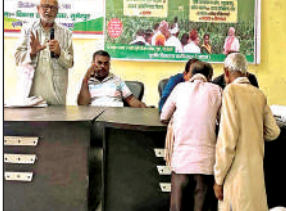
कार्यक्रम में मौजूद अधिकारी व किसान।

अमृत विचार। सुमेरपुर ब्लाक परिसर में पीएम धन-धान्य कृषि योजना और दलहन आत्म निर्भरता मिशन का लाइव प्रसारण कृषकों को दिखाया गया। इस दौरान देश के प्रधानमंत्री द्वारा कृषकों को 42 हजार करोड़ की कृषि परियोजनाओं के कृषकों को लोकार्पण का प्रसारण कृषकों को दिखाया गया। प्रधानमंत्री ने कृषकों को एकफुीओ बनाने और एकफीओ से जुड़ने का आह्वान किया। कहा कि एकफीओ के माध्यम से कृषक अपने उत्पाद की सही दाम पर बिक्री करें। उन्होंने कहा कि कृषक अपने खेत की मिट्टी पहचान कर उसके बीज की व्यवस्था करें। उन्होंने कहा कि हमारे कृषकों की मेहनत से विश्व में दूध का उत्पादन एक नंबर पर है। इसका श्रेय आप कृषको को ही जाता है। फल और कृषि उत्पाद को प्रसंस्कृत कर अधिक लाभ लेने के लिए कृषकों