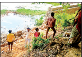
तालाब की बाउंड्री वाल का गिरा हिस्सा।