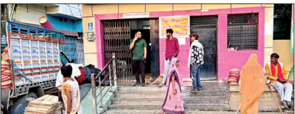
सार्वजनिक शौचालय का निरीक्षण करते नगर पालिका के ईओ।

अधिशासी अधिकारी ने शनिवार की सुबह भटीपुरा वार्ड के शेखूनगर में डोर-टू-डोर कूड़ा कलेक्शन और सामुदायिक व सार्वजनिक शौचालयों का निरीक्षण किया। वार्ड संख्या-7 भटीपुरा के लोगों ने शिकायत की कि सफाईनायक से