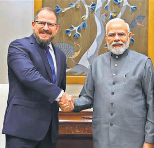
नई दिल्ली में क्वालकॉम के सीईओ और अध्यक्ष क्रिस्टियानो अमोन से मिलते प्रधानमंत्री नरेंद्र मोदी।

देखकर बहुत अच्छा लगा। भारत ऐसी प्रौद्योगिकियों के निर्माण के लिए बेजोड़ प्रतिभा और व्यापकता प्रदान करता है, जो हमारे सामूहिक भविष्य को आकार देगी। अमोन ने शुक्रवार को प्रधानमंत्री से उनके सरकारी आवास पर मुलाकात की। उन्होंने शुक्रवार को 'एक्स' पर एक पोस्ट में कहा कि भारत एआई और भारत सेमीकंडक्टर मिशनो के समर्थन में क्वालकॉम और भारत के बीच व्यापक साझेदारी को बढ़ावा देने के साथ-साथ 6जी में बदलाव पर शानदार बातचीत के लिए प्रधानमंत्री नरेन्द्र मोदी को धन्यवाद। अमोन ने कहा