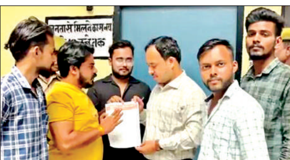
उप जिलाधिकारी कार्यालय में ज्ञापन देते संगठन के लोग।