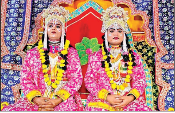
धनुष भंग लीला के दौरान दरबार में बैठे राम-लक्ष्मण।

धनुष भंग मंचन के दौरान मिथलापुरी के राजा जनक ने अपनी पुत्री सीता के विवाह के लिए स्वयंवर रचाया। स्वयंवर में देश विदेश के राजा शामिल हुए। स्वयंवर पर प्रत्यंचा चढ़ाना तो दूर उसे हिला थी कि जो भी वीर इस शिव धनुष