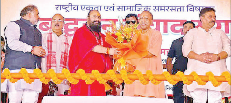
गाजीपुर के श्री हथियाराम मठ परिसर में आयोजित प्रबुद्धजन संवाद संगम कार्यक्रम में उपस्थित मुख्यमंत्री योगी आदित्यनाथ।

को संबोधित कर रहे थे। योगी ने कहा कि हमारी सरकार की नीति ‘परित्राणाय साधूनां, विनाशाय च दुष्कृताम्’ के सूत्र पर आधारित है। सज्जनों का संरक्षण और दुष्ट प्रवृत्तियों के खिलाफ जीरो टॉलरेंस