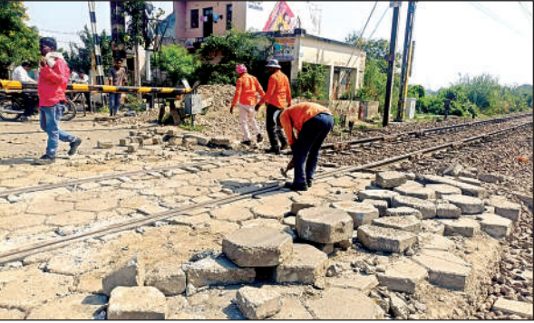
रेलवे ट्रैक पर होता मरम्मत कार्य।