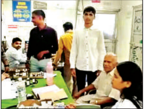
अस्पताल में परिजनों के साथ खड़ा छात्र।