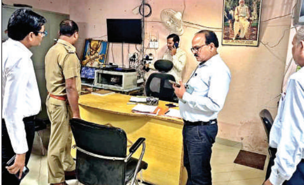
हीरानंद इंटर कॉलेज परीक्षा केंद्र का निरीक्षण करते एडीएम व एएसपी।