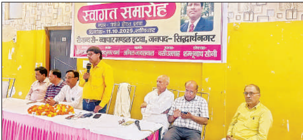
स्वागत समारोह को संबोधित करते अतिथि।