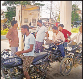
बिना हेलमेट के पेट्रोल भरवाते लोग।

बता दें कि जनपद मुख्यालय के बांसी स्टैंड लुंबिनी रोड पर स्थित बंधू मिल कंपनी पेट्रोल पंप पर जिलाधिकारी के आदेशों को तार-तार करते हुए बिना हेलमेट लगाए वाहन चालकों को खुलेआम पेट्रोल दिया जा रहा है जो सरकार ही नहीं बल्कि जिलाधिकारी के आदेशों का खुलेआम पालन नहीं किया जा रहा है। इतना ही नहीं पेट्रोल पंपों पर पेट्रोल की घातकौली भी खुलेआम की जा रही है मुख्यालय स्थित जगदंबा पेट्रोल पंप पर कार्यकर्ताओं द्वारा पेट्रोल कम नापने की आए दिन शिकायत मिल रही है। किंतु इसके बावजूद भी कार्यकर्ताओं द्वारा पेट्रोल