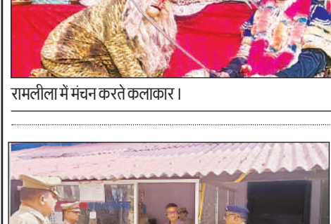
समाधान दिवस में पहुंचकर करनेलगंज कोतवाली का निरीक्षण करते आईजी अमित पाठक।