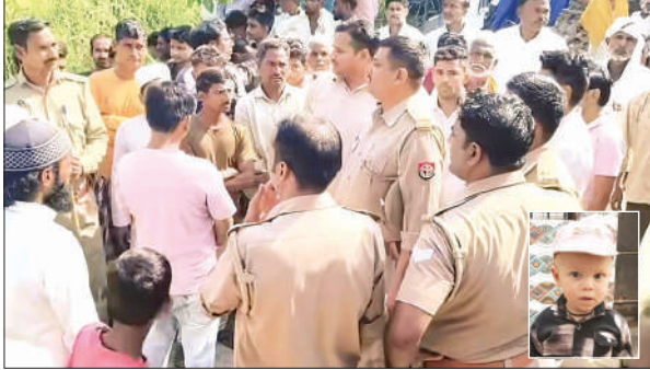
मौके पर मौजूद पुलिसकर्मी व लोग और इनसेट में बच्चे की फाइल फोटो।