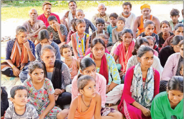
अंतरराष्ट्रीय बालिका दिवस पर आयोजित गोष्ठी में शामिल बालिकाएं।