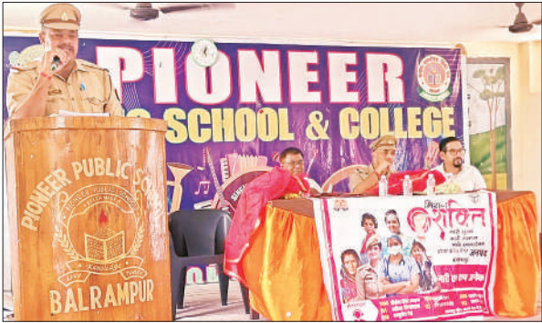
कार्यक्रम को संबोधित करते पुलिस अधिकारी।