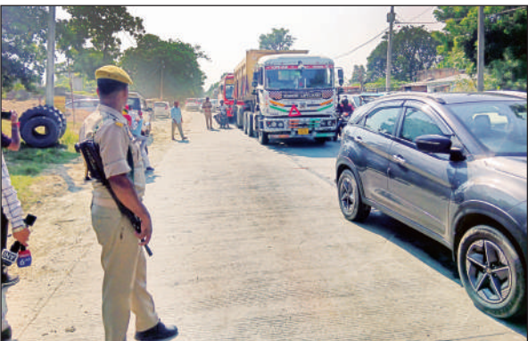
मार्ग पर जाम के चलते लगी वाहनों की कतार।