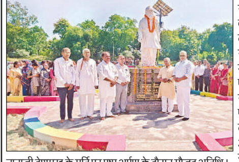
नानाजी देशमुख के मूर्ति पर पुष्प अर्पण के दौरान मौजूद अतिथि।