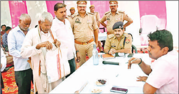
फरियादियों की समस्याएं सुनते जिलाधिकारी डॉ. राजा गणपति आर व अन्य अधिकारी।

अमृत विचार। शासन के मंशा के अनुरूप सम्पूर्ण थाना समाधान दिवस का आयोजन किया गया। थाना समाधान दिवस के अवसर पर जिलाधिकारी डॉ. राजा गणपति आर की अध्यक्षता में थाना खेसरहा में थाना समाधान दिवस का कार्यक्रम सम्पन्न हुआ। लोगों की समस्याएं सुनते हुए जिलाधिकारी ने संबंधित विभागों के अधिकारियों को लोगों की समस्याओं को लंबित न रखने का दिशा-निर्देश दिए। सम्पूर्ण थाना समाधान दिवस के अवसर पर आने वाले शिकायतकर्ताओं की समस्याओं को जिलाधिकारी द्वारा सुना गया। ज्यादातर प्रकरण भूमि विवाद एवं नाली से संबंधित था। समस्त राजस्व निरीक्षक को निर्देश दिया