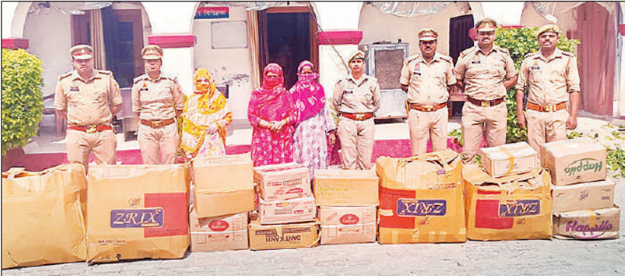
जब्त पटाखों के साथ गिरफ्तार तीन महिलाएं।