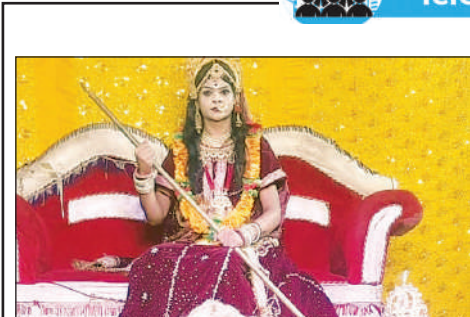
रामलीला में मंचन करते कलाकार।