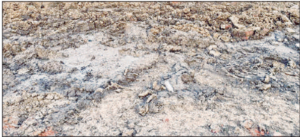
पगलाभारी में बारूद से हुए विस्फोट में ढहे मकान को समतल कर भराया गया पानी।