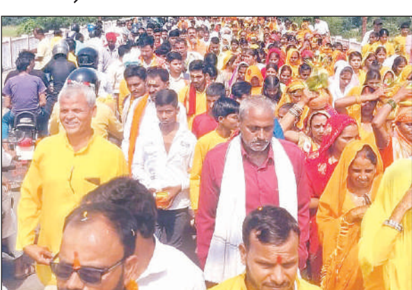
कलश यात्रा में शामिल श्रद्धालु।