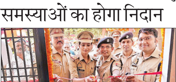
परिवार परामर्श केंद्र का फीता काटकर उद्घाटन करते पुलिस अधीक्षक।