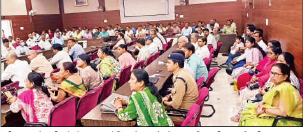
परीक्षा का तैयारी को लेकर आयोजित बैठक में मौजूद अधिकारी व कर्मचारी।

गोंडा, अमृत विचार : रविवार को आयोजित हो रही यूपी पीसीएस की प्रारंभिक परीक्षा की तैयारी पूरी कर ली गयी है। दो पालियों में होने वाली इस परीक्षा के लिए 18 स्कूलों को केंद्र बनाया गया है। प्रत्येक पाली में 7488 परीक्षार्थी परीक्षा में शामिल होंगे। जिलाधिकारी प्रियंका निरंजन ने संबंधित विभागीय अधिकारियों के साथ बैठक कर परीक्षा को शांतिपूर्ण, नकलविहीन एवं व्यवस्थित ढंग से सम्पन्न कराने का निर्देश दिया है। परीक्षा की निगरानी के लिए प्रत्येक केंद्र को सीसीटीवी कैमरे से लैस किया गया है। कोई भी प्रत्येक परीक्षा केंद्र पर एक सेक्टर मजिस्ट्रेट व एक स्टेटिक मजिस्ट्रेट