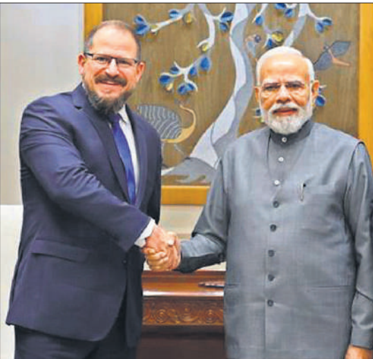
नई दिल्ली में क्वालकॉम के सीईओ और अध्यक्ष क्रिस्टियानो अमोन से मिलते प्रधानमंत्री नरेंद्र मोदी।

देखकर बहुत अच्छा लगा। भारत ऐसी प्रौद्योगिकियों के निर्माण के लिए बेजोड़ प्रतिभा और व्यापकता प्रदान करता है, जो हमारे सामूहिक भविष्य को आकार देगी। अमोन ने शुक्रवार को प्रधानमंत्री से उनके सरकारी आवास पर मुलाकात की। उन्होंने शुक्रवार को 'एक्स' पर एक पोस्ट में कहा कि भारत एआई और भारत सेमीकंडक्टर मिशनों के समर्थन में क्वालकॉम और भारत के बीच व्यापक साझेदारी को बढ़ावा देने के साथ-साथ 6जी में बदलाव पर शानदार बातचीत के लिए प्रधानमंत्री नरेन्द्र मोदी को धन्यवाद। अमोन ने कहा