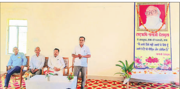
नानाजी देशमुख की जयंती कार्यक्रम में मंचासीन अतिथिगण।