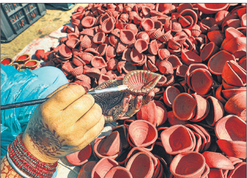
प्रकाश पर्व दिवाली से पहले जम्मू के बाजार में बिक्री के लिए मिट्टी के दीये सजाती कारीगर।

के पांच रेलवे स्टेशनों पर स्थायी प्रतीक्षास्थल के बांधे दिए जा रहे हैं। नई दिल्ली रेलवे स्टेशन के अलावा, अन्य चार स्टेशन आनंद विहार, गाजियाबाद, वाराणसी और अयोध्या हैं।