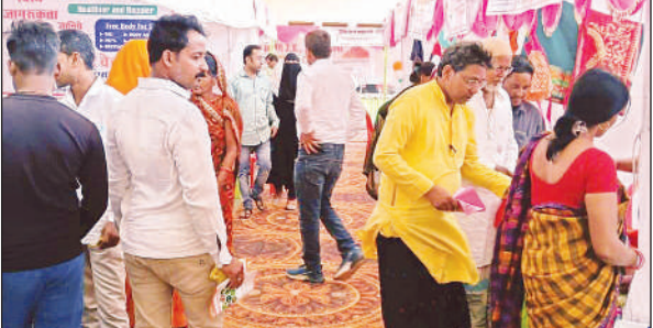
लोहिया भवन परिसर में स्टॉलों का अवलोकन करते लोग।