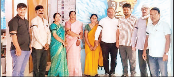
काली पट्टी बांध कर उच्च प्राथमिक विद्यालय अस्तिकन में प्रदर्शन करते शिक्षक।