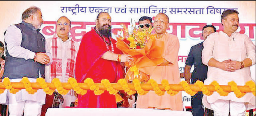
गाजीपुर के श्री हथियाराम मठ परिसर में आयोजित प्रबुद्धजन संवाद संगम कार्यक्रम में उपस्थित मुख्यमंत्री योगी आदित्यनाथ।

को संबोधित कर रहे थे। योगी ने कहा कि हमारी सरकार की नीति ‘परित्राणाय साधूनां, विनाशाय च दुष्कृताम्’ के सूत्र पर आधारित है। सज्जनों का संरक्षण और दुष्ट प्रवृत्तियों के खिलाफ जीरो टॉलरेंस