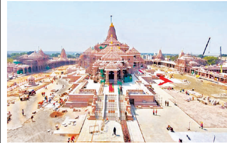
ध्वजारोहण से पूर्व शनिवार को राम मंदिर का एक विहंगम दृश्य देखने को मिला। श्रीराम जन्मभूमि तीर्थ क्षेत्र ट्रस्ट द्वारा यह तस्वीर जारी की गई। इसमें राम मंदिर परिसर के साथ शिखर तक का संपूर्ण परिदृश्य देखते ही बन रहा है।