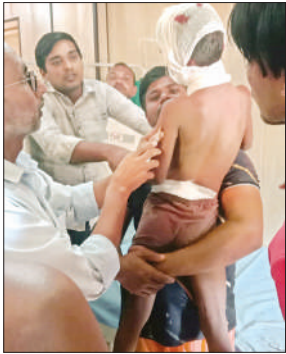
घायल बच्चे का किया गया उपचार।