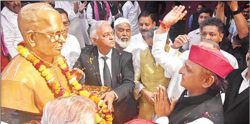
सपा मुख्यालय में जयप्रकाश नारायण की प्रतिमा पर पुष्पांजलि अर्पित करते पार्टी प्रमुख अखिलेश यादव, साथ में अन्य।

मुख्यमंत्री ने कहा कि पराली जलाना केवल पर्यावरण का नुकसान नहीं, बल्कि भूमि की उर्वरता को भी कम करता है।