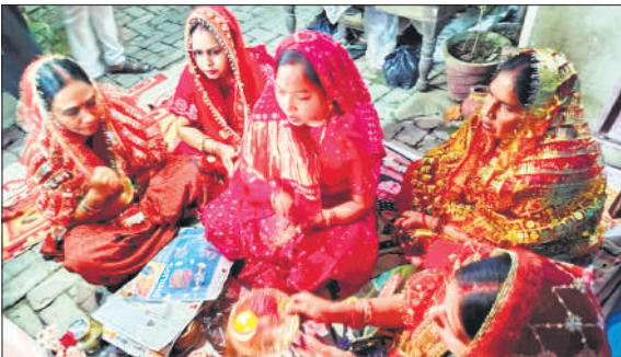
अहोई अष्टमी पर पूजा करती माताएं।

रामपुर, अमृत विचार : मिशन शक्ति अभियान 5 एवं साइबर सुरक्षा अभियान के तहत सोमवार को साइबर क्राइम व थाना कोतवाली पुलिस द्वारा श्री हरि इंटर कॉलेज, आश्रम पद्धति में छात्र-छात्राओं और शिक्षकों को पंपलेट वितरित कर जागरूक किया। कहा कि किसी भी अनजान लिंक, कॉल या संदेश पर विश्वास न करें। ओटीपी, पासवर्ड या बैंक विवरण साझा न करें। सोशल मीडिया पर व्यक्तिगत जानकारी सार्वजनिक न करें। साइबर दंगी पर तत्काल 1930 साइबर हेल्पलाइन पर शिकायत दर्ज करें।