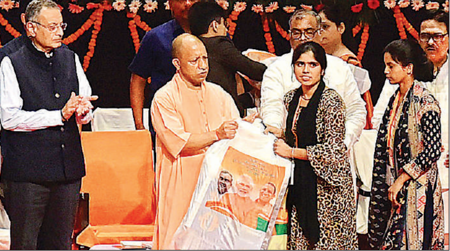
लखनऊ में आयोजित समारोह में महिला मंगल दल को खेल किट वितरित करते मुख्यमंत्री योगी।

मुख्यमंत्री ने कहा कि खेलों के साथ लोक संस्कृति को भी बढ़ावा