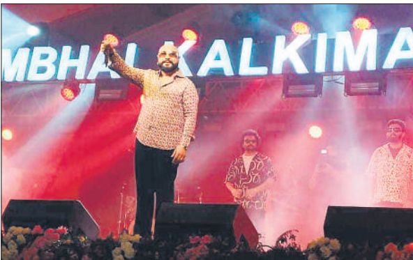
कल्कि महोत्सव की सांस्कृतिक संस्था में गीत गाते बी प्राक।