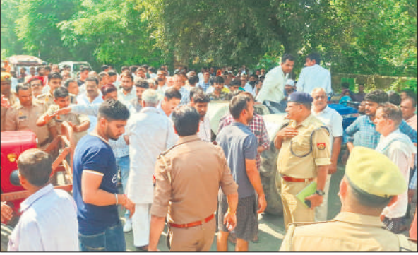
परिजनों को समझाती पुलिस।

मृतक किसान के परिजनों का गुस्सा फूट पड़ा। उन्होंने पुलिस पर लापरवाही और आरोपियों को गिरफ्तार न करने का आरोप लगाते हुए हंगामा शुरू कर दिया। प्रदर्शनकारियों ने अमरोहा-जोया मार्ग पर ट्रैक्टर खड़े कर जाम लगा दिया। हालात बिगड़ते देख कई थानों की पुलिस फोर्स को मौके पर बुलाया गया। सीओ