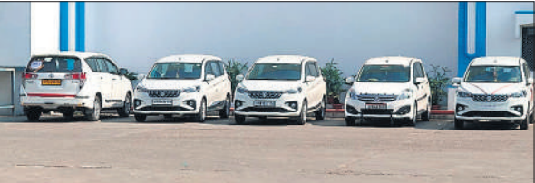
इंडिया फ़ोजन मीट फैक्ट्री में खड़ी आयकर विभाग के अधिकारियों की गाड़ियां।

आयकर विभाग ने जिस बड़ी तैयारी के साथ इंडिया फ़ोजन मीट फैक्ट्री परिसर और सरायतरीन में मालिक के घर छापेमारी की उससे कहा जा रहा है कि मामला कुछ बड़ा ही है। एक दो नहीं बल्कि आयकर विभाग के 100 के लगभग अधिकारी व कर्मचारी मीट फैक्ट्री परिसर और उसके मालिकों के घर को खंगालने में जुटे हैं। आयकर विभाग के अधिकारी लगातार