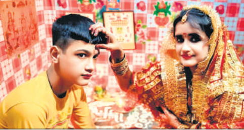
बेटे का तिलक करती मां।

अहोई अष्टमी के पर्व से दीपावली महोत्सव की शुरुआत मानी जाती है। अहोई अष्टमी के दिन उपवास रखने वाली महिलाओं ने सुबह उठकर, मिट्टी के करवे में पानी भर कर माता अहोई का पूजन किया। दोपहर के समय महिलाओं ने अहोई अष्टमी की कहानी सुनी। संतान की लंबी आयु के लिए मनाए जाने वाले अहोई अष्टमी पर्व को लेकर शहर के बाजारों में चहल-पहल देखी गई। बाजारों में पहुंचकर महिलाओं