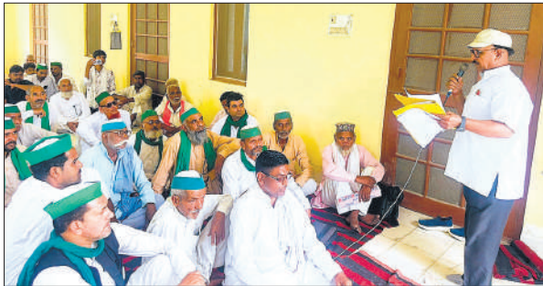
पंचायत को संबोधित करते किसान नेता।

नियमों की अनदेखी कर पशुओं को काटा जा रहा है। बिना जांच कराए क्षमता से अधिक पशुओं को फैक्ट्री