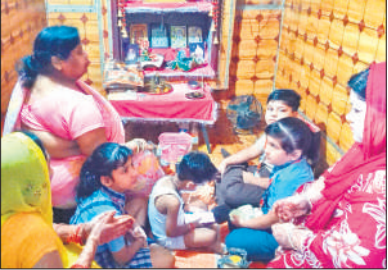
अहोई अष्टमी पर बच्चों के साथ पूजा करती माताएं।

ने खरीदारी की। महिलाओं में भारी उत्साह देखने को मिला। बच्चों ने उपहार खरीदकर अपनी माताओं को भेंट कर पर्व की परंपरा कायम रखी। व्रत रखने वाली महिलाओं ने शाम को तारा देखने के बाद उपवास खोला। मंडी धनौरा क्षेत्र में भी अहोई अष्टमी का पर्व हथौल्लास के साथ मनाया गया। माताओं ने अपनी संतान की सुख समृद्धि, उनकी दीर्घायु, सौभाग्य, आरोग्य, यश कीर्ति, वैभवता एवं के लिए व्रत रखकर पूजा अर्चना की।