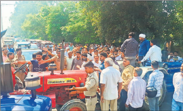
ट्रेक्टरों से अमरोहा-जोया रोड जाम करते परिजन व ग्रामीण।