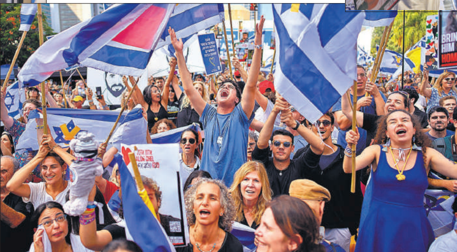
गाजा में बंधक लोग रिहा होकर तेल अवीव पहुंचे तो वहां उनके स्वागत के लिए खुशी से झूमते हजारों लोगों की भीड़ इकट्ठी थी ।

युद्धविराम समझौते का जश्न मनाने सोमवार सुबह अमेरिकी राष्ट्रपति डोनाल्ड ट्रंप इजराइल पहुंचे । अपने भाषण से पहले ट्रंप ने नेसेट चेंबर में प्रवेश किया जहां तालियों की लगातार गड़गड़ाहट से उनका स्वागत किया गया । उन्होंने पहले गाजा में हमास द्वारा बंधक बनाए गए कुछ लोगों के परिवारों से मुलाकात की । ट्रंप ने घोषणा की कि इस समझौते ने युद्ध को प्रभावी रूप से समाप्त कर दिया है और पश्चिम एशिया में स्थाई शांति स्थापित करने का मार्ग प्रशस्त किया है ।