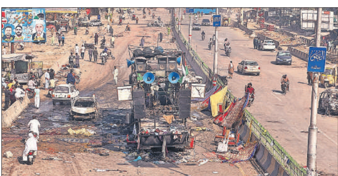
सुरक्षा बलों से झड़पों के दौरान प्रदर्शनकारियों ने सड़कों पर जमकर तोड़फोड़ की ।

शर्म अल-शेख । अमेरिका के राष्ट्रपति डोनाल्ड ट्रंप गाजा के भविष्य से संबंधित वैश्विक सम्मेलन में भाग लेने के लिए सोमवार को मिस्र पहुंचे । विश्व के कई देशों के नेता इससे पहले ही यहां पहुंच चुके थे । ट्रंप गाजा युद्ध विराम का जश्न मनाने इजराइल की यात्रा के बाद मिस्र पहुंचे हैं । इजराइली प्रधानमंत्री बेन्जामिन नेतन्याहु को भी आमंत्रित किया गया था, लेकिन उन्होंने 'ज्यूइश होलीडे' का हवाला देते हुए शिरकत करने से इन्कार कर दिया । सम्मेलन में तुर्की के राष्ट्रपति रजब तैयब एर्दोआन और कतर के अमीर शेख तमीम बिन हम्माद अल सानी हिस्सा ले रहे हैं । जॉर्डन के शाह अब्दुल्ला भी शामिल हो सकते हैं । इजराइल के प्रमुख अंतरराष्ट्रीय समर्थकों में से एक जर्मनी के चांसलर फ्रेडरिक मर्ज भी सम्मेलन में हिस्सा लेंगे । ब्रिटेन के प्रधानमंत्री केअर स्टार्मर, संयुक्त राष्ट्र के महासचिव एंtonियो गुतेरres, यूरोपीय यूनियन के प्रमुख एंtonियो कोर्रेआ और इटली की प्रधानमंत्री जोर्जिया मेलोनो समेत कई देशों के नेता सम्मेलन में शिरकत करेंगे ।