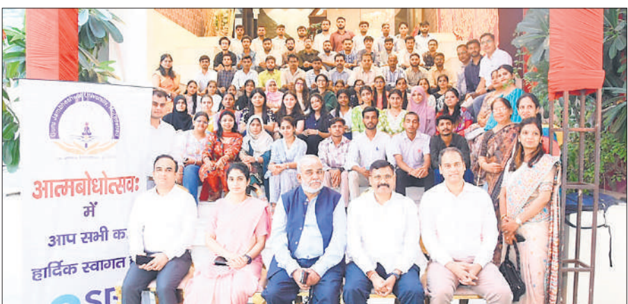
गुरु जंभेश्वर विश्वविद्यालय के ऑरिएंटेशन के दौरान मौजूद मुख्य अतिथि और छात्र-छात्राएं।