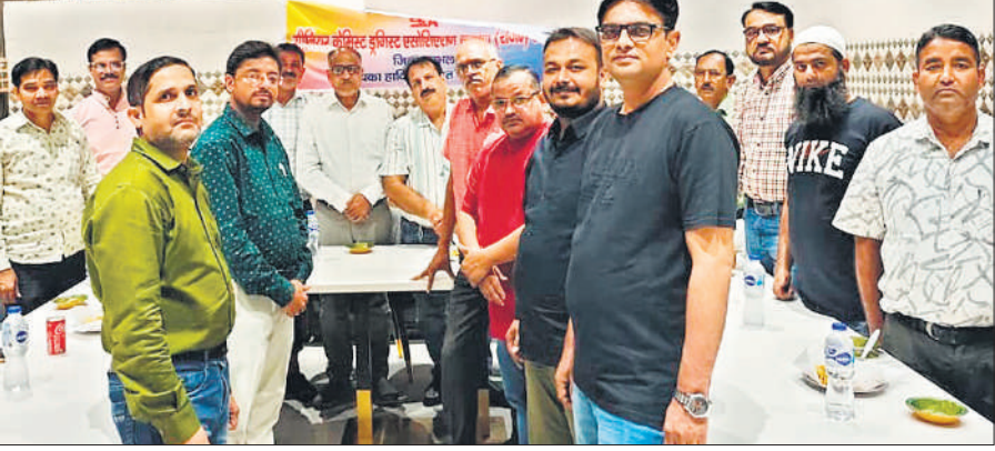
सीनियर केमिस्ट एसोसिएशन की बैठक में मौजूद पदाधिकारी।