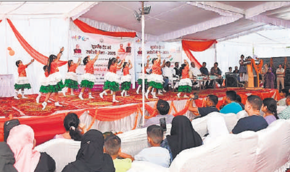
सांस्कृतिक कार्यक्रम प्रस्तुत करते बच्चे।