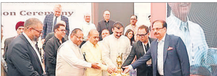
ग्रेटर नोएडा में 60वां आईएचजीएफ दिल्ली मेला-ऑटम की शुरुआत करते अतिथि।