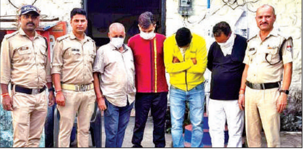
मुखानी पुलिस की गिरफ्त में जुआरी।