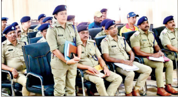
गोष्ठी में मौजूद पुलिस अधिकारी और कार्मिक।