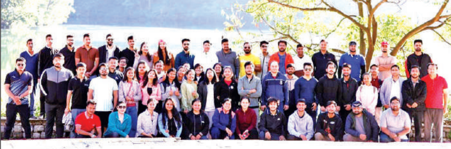
ग्राफिक एरा भीमताल अलुमनाई मीट 2025 में मौजूद पूर्व छात्र व शिक्षक।