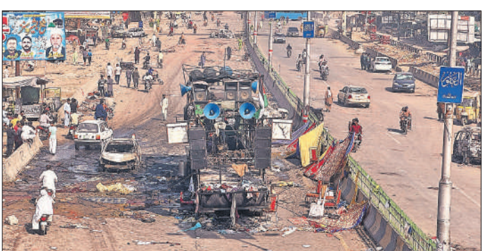
सुरक्षा बलों से झड़पों के दौरान प्रदर्शनकारियों ने सड़कों पर जमकर तोड़फोड़ की ।

शर्म अल-शेख । अमेरिका के राष्ट्रपति डोनाल्ड ट्रंप गाजा के भविष्य से संबंधित वैश्विक सम्मेलन में भाग लेने के लिए सोमवार को मिस्र पहुंचे । विश्व के कई देशों के नेता इससे पहले ही यहां पहुंच चुके थे । ट्रंप गाजा युद्ध विराम का जश्न मनाने इजराइल की यात्रा के बाद मिस्र पहुंचे हैं । इजराइली प्रधानमंत्री बेन्जामिन नेतन्याहु को भी आमंत्रित किया गया था, लेकिन उन्होंने 'ज्युइश होलीडे' का हवाला देते हुए शिरकत करने से इन्कार कर दिया । सम्मेलन में तुर्की के राष्ट्रपति रजब तैयब एर्दोआन और कतर के अमीर शेख तमीम बिन हम्माद अल सानी हिस्सा ले रहे हैं । जॉर्डन के शाह अब्दुल्ला भी शामिल हो सकते हैं । इजराइल के प्रमुख अंतरराष्ट्रीय समर्थकों में से एक जर्मनी के चांसलर फ्रेडरिक मर्ज भी सम्मेलन में हिस्सा लेंगे । ब्रिटेन के प्रधानमंत्री केअर स्टार्मर, संयुक्त राष्ट्र के महासचिव एंटोनियो गुतेरres, यूरोपीय यूनियन के प्रमुख एंतीनियो कोर्रेआ और इटली की प्रधानमंत्री जोर्जिया मेलोनी समेत कई देशों के नेता सम्मेलन में शिरकत करेंगे ।