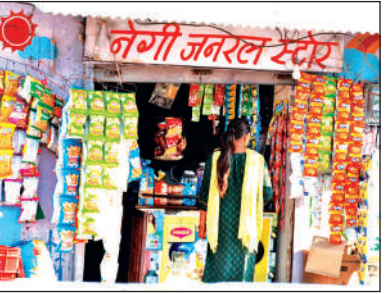
देवलचौड़ चौराहे के पास स्कूल के सामने बिक रहा गुटखा।

बेखौफ होकर तंबाकू उत्पाद बेचे जा रहे हैं। विद्यालयों के आस-पास गुटखा, तंबाकू बेचने से विद्यार्थियों में इसका असर देखने को मिलता है। इससे छात्र-छात्राओं की पढ़ाई पर भी असर देखने को मिलता है। कई विद्यार्थियों को भी इसकी लत लग जाती है। साथ ही स्कूलों