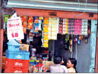
जीजीआईसी के बगल में बिक रहा है गुटखा।

अमृत विचार : सरकार की ओर से निर्धारित मानकों के अनुसार स्कूल परिसर के 100 मीटर दायरे में तंबाकू उत्पाद बेचना पूरी तरह प्रतिबंधित है। व्यवसायियों की ओर से इनकी बिक्री किये जाने पर कड़ी कार्रवाई का प्रावधान है। लेकिन विद्यालयों के आसपास गुटखा तंबाकू उत्पादों की खुलेआम बिक्री की जा रही है। इससे कई युवा भी तंबाकू, गुटखा के जद में आ रहे हैं। स्कूल प्रबंधन की शिकायतों के बाद भी शहर के कई सरकारी व निजी विद्यालयों के आस पास खुलेआम तंबाकू उत्पाद बेचे जा रहे हैं। जिस पर जिम्मेदारों की ओर से कोई कार्रवाई नहीं की जा रही है।