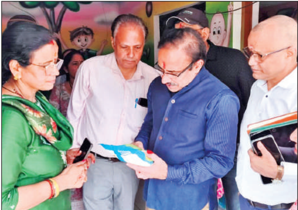
ब्लॉक का भ्रमण करते अपर सचिव वित्त मंत्रालय।