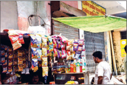
प्राथमिक विद्यालय चौक बाजार के पास पान-बीड़ी की दुकान।