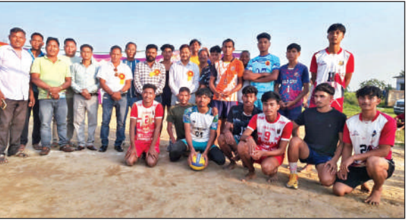
वॉलीबॉल टूर्नामेंट में खिलाड़ियों के साथ अतिथि और आयोजक।