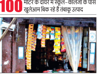
मछली बाजार के पास सजी बीड़ी और गुटखा की दुकान।