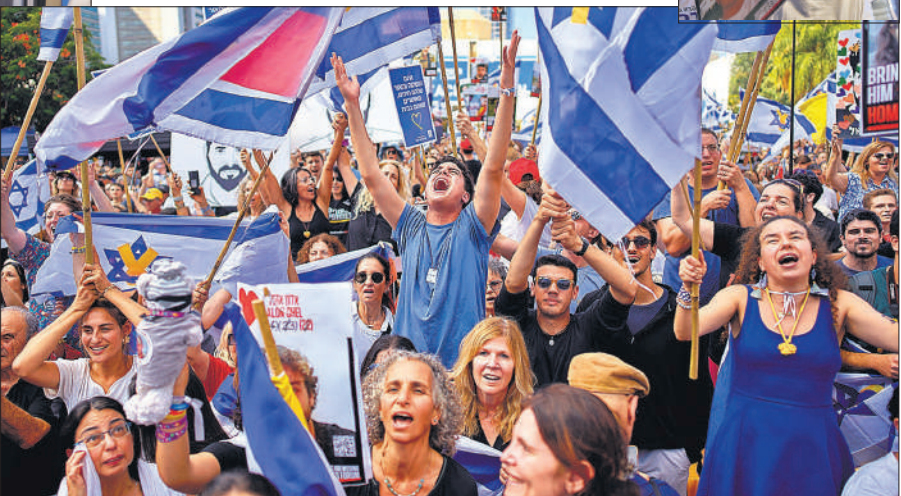
गाजा में बंधक लोग रिहा होकर तेल अवीव पहुंचे तो वहां उनके स्वागत के लिए खुशी से झूमते हजारों लोगों की भीड़ इकट्ठी थी ।

युद्धविराम समझौते का जश्न मनाने सोमवार सुबह अमेरिकी राष्ट्रपति डोनाल्ड ट्रंप इजराइल पहुंचे । अपने भाषण से पहले ट्रंप ने नेसेट चेंबर में प्रवेश किया जहां तालियों की लगातार गड़गड़ाहट से उनका स्वागत किया गया । उन्होंने पहले गाजा में हमास द्वारा बंधक बनाए गए कुछ लोगों के परिवारों से मुलाकात की । ट्रंप ने घोषणा की कि इस समझौते ने युद्ध को प्रभावी रूप से समाप्त कर दिया है और पश्चिम एशिया में स्थाई शांति स्थापित करने का मार्ग प्रशस्त किया है ।