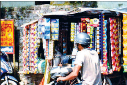
एमबीपीजी कालेज की बाउंड्री से लगी बीड़ी सिगरेट की दुकान।