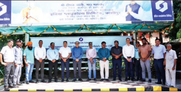
काशीपुर में बस स्टैंड को जनता को समर्पित करते अतिथि।