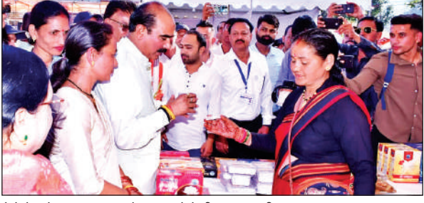
मेले में लगे स्टाल का अवलोकन करते केंद्रीय राज्य मंत्री अजय टम्टा व अन्य।

मुख्य अतिथि केंद्रीय राज्य मंत्री अजय टम्टा ने कहा कि मेले का उद्देश्य स्थानीय उद्यमियों, महिला स्वयं सहायता समूहों एवं पारंपरिक उत्पादों को बाजार उपलब्ध कराना है। उन्होंने बताया कि बागेश्वर जनपद कीवी उत्पादन में प्रथम स्थान पर होने के साथ ही मत्स्य