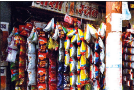
एमबी इंटर कॉलेज के सामने बिक रहा गुटखा।