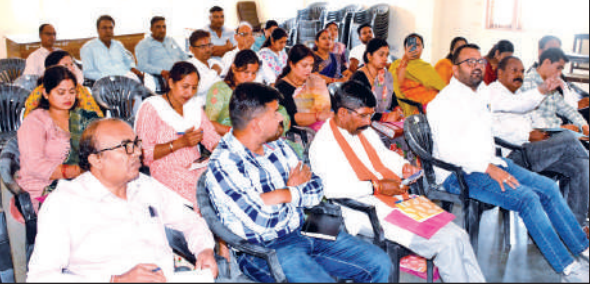
हल्द्वानी ब्लॉक सभागार में प्रशिक्षण में मौजूद बीडीसी सदस्य ।