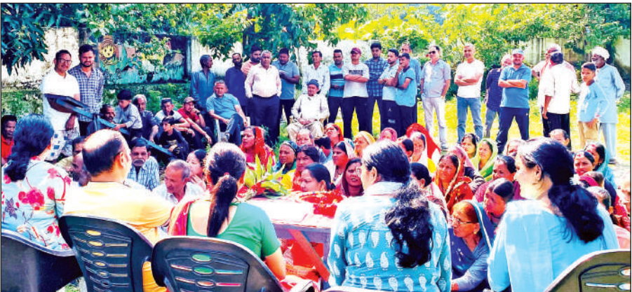
कालाढूंगी में आयोजित खुली बैठक में उपस्थित अधिकारी, जनप्रतिनिधि व ग्रामीण।