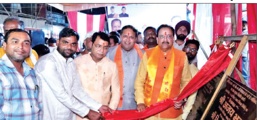
सड़क का शिलान्यास करते सांसद, विधायक और महापौर। ● अमृत विचार

उन्होंने बताया कि विधायक बनने के बाद से उनके द्वारा लगातार पुल निर्माण कराने का प्रयास किया गया तथा नमक फैक्ट्री स्थित पुल निर्माण के प्रथम चरण की स्वीकृति प्राप्त होने के बाद जल्द ही पुल निर्माण का कार्य आरंभ कराया जाएगा, जिससे आसपास निवास करने वाले लोगों को आने-जाने में सुविधा प्रदान हो सके।