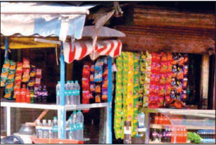
ललित महिला इंटर कॉलेज के बगल में गुटखा की दुकान।