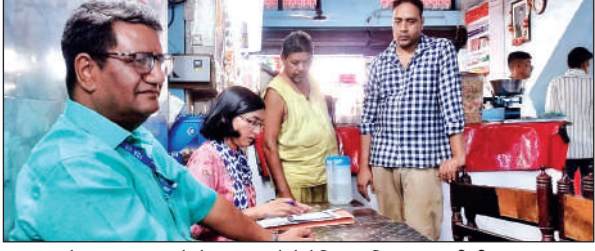
टनकपुर में खाद्य सुरक्षा को लेकर दुकानों में चेकिंग अभियान चलाती टीम।