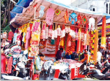
दीपावली पर हल्द्वानी बाजार में सजी दुकानें । ● अमृत विचार

धनतेरस से ठीक पहले शहर का हर कोना त्योहारी रंग में सराबोर है और ग्राहकों के उत्साह ने व्यापारियों के चेहरों पर भी चमक ला दी है। शहर के मुख्य बाजार, पटेल चौक से लेकर तिकोनिया तक, शायद ही कोई ऐसी दुकान हो जो बिजली की आकर्षक मालाओं से न सजी हो। शाम ढलते ही इन बाजारों की चकाचौंध देखते ही बन रही है। बर्तनों की दुकानों पर खनकते नए स्टील और तांबे के बर्तनों की चमक ग्राहकों को लुभा रही है, तो