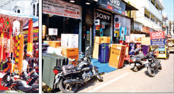
दीपावली पर बाजार में सजी दुकानें । ● अमृत विचार

वहीं कपड़ा बाजार में पारंपरिक और आधुनिक परिधानों की नई रेंज लोगों को अपनी ओर खींच रही है।