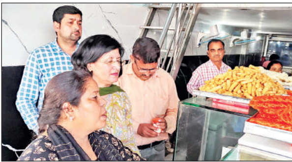
शक्तिफार्म में खाद्य पदार्थों की जांच करती टीम।