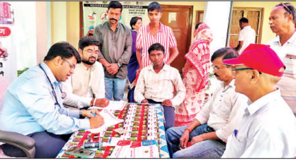
स्वास्थ्य शिविर में मरीजों को परामर्श देते चिकित्सक।