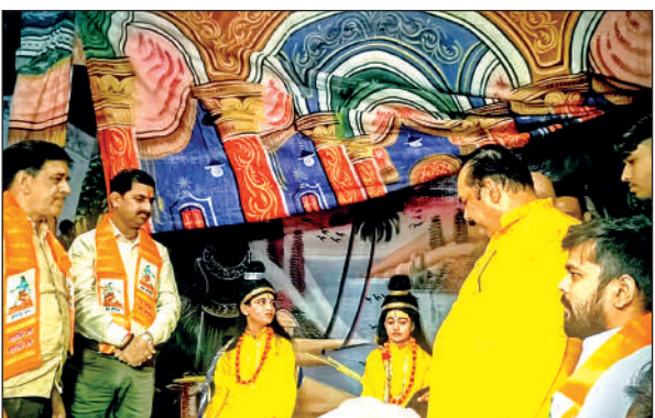
रामलीला के दौरान मंच पर कलाकारों के साथ मौजूद एमएलसी।

रामलीला के अंतिम दिवस कलाकारों ने मंचन करते हुए सर्वप्रथम सेतुबंध रामेश्वरम की स्थापना की गई, इसके बाद विभीषण को रावण को त्यागने, अंगद रावण संवाद के बाद मेघनाद लक्ष्मण युद्ध दर्शाया गया, जिसमें मेघनाद लक्ष्मण को शक्ति बाण माराकर अचेत कर देता है, इसके बाद श्रीराम के विलाप करते और फिर हनुमान संजीवनी बूटी लेकर