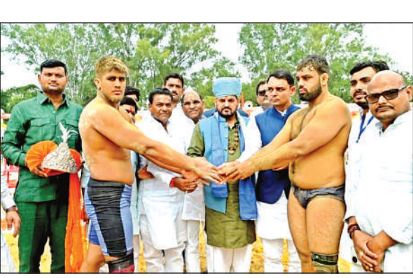
पहलवानों का हाथ मिलवाते पूर्व सांसद बृजभूषण शरण सिंह।

सोमवार को जीआईसी मैदान में पहुंचे पूर्व सांसद बृजभूषण शरण सिंह ने कार्यक्रम को संबोधित