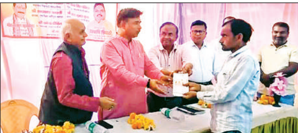
कार्यक्रम दौरान पंजीयन पुस्तक वितरण करते अधिकारी।

कार्यक्रम को संबोधित करते हुए मुख्य अतिथि ने कहा सहकारी समितियां ग्रामीण विकास की धुरी हैं। इस समय युवाओं के अलावा महिलाओं को सहकारी समितियों से जोड़ने पर जोर दिया जा रहा है। कहा कि जब किसान संगठित होकर एक मंच पर आते हैं, तो उन्हें न केवल योजनाओं की जानकारी मिलती है साथ ही वह आत्मनिर्भरता की दिशा की ओर अग्रसर होते हैं। सहकारिता केवल एक व्यवस्था