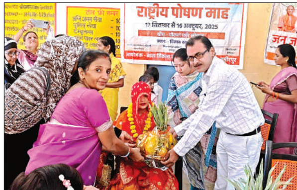
गर्भवती महिला की गोद भराई करते अधिकारी।

जिले में 17 सितंबर से पोषण माह का आगाज हो गया है। महिला एवं बाल विकास विभाग की एक महत्वाकांक्षी योजना पोषण अभियान के तहत 17 सितंबर से 16 अक्टूबर तक जिलेभर में पोषण माह मनाया जा रहा है। सोमवार को शहर स्थित बाल विकास परियोजना कार्यालय में नोडल अधिकारी खंड शिक्षा अधिकारी की अध्यक्षता में पोषण माह मनाया गया। इस दौरान नोडल अधिकारी ने