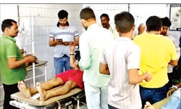
जिला अस्पताल में घायलों को भर्ती कराया गया।