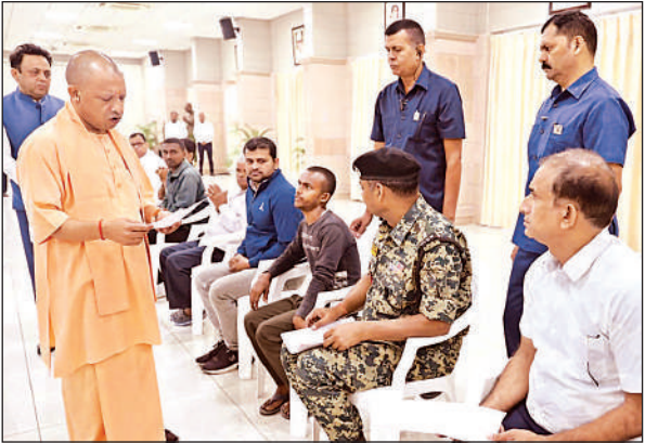
लखनऊ में जनता दर्शन के दौरान लोगों की समस्याएं सुनते मुख्यमंत्री योगी ।

मुख्यमंत्री आवास पर सोमवार सुबह "जनता दर्शन" में प्रदेश के 50 से अधिक पीड़ित पहुंचे ।