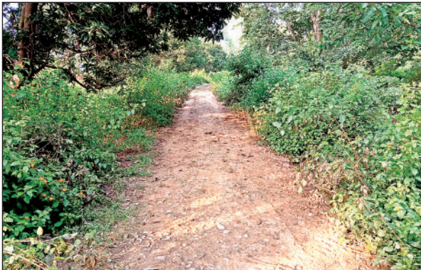
बदहाल है पंचकोसी परिक्रमा मार्ग।