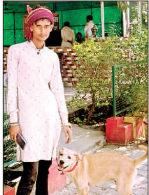
सुमेरपुर थाने में मौजूद लेब्रा डॉग।