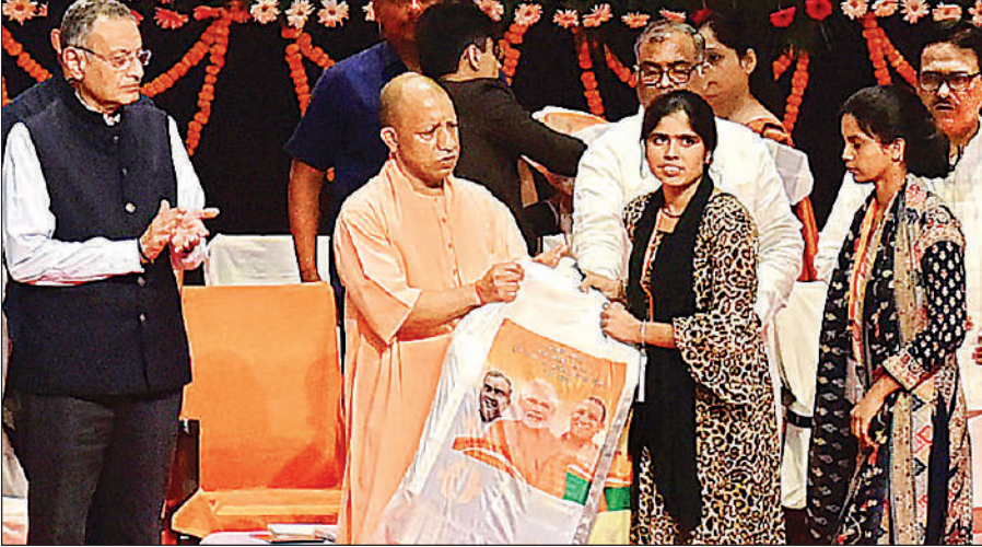
लखनऊ में आयोजित समारोह में महिला मंगल दल को खेल किट वितरित करते मुख्यमंत्री योगी ।

मुख्यमंत्री ने कहा कि खेलों के साथ लोक संस्कृति को भी बढ़ावा