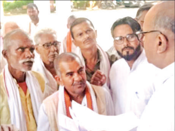
अधिकारी को ज्ञापन देते कस्बावासी।

एडीएम को सौंपे जापन में बताया कि कस्बे में दो दशक पहले पेयजल संकट से निपटने के लिए कस्बे से दो किमी दूर नलकूप स्थापित कराए गए थे। नलकूपों से समूचे कस्बे में पानी की आपूर्ति होती थी। एक साल पहले नमामि गंगे योजना के तहत कस्बे में पाइप लाइन बिछाई गई।