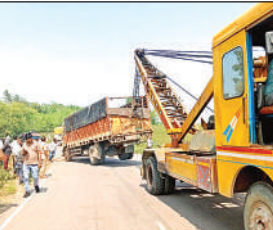
ट्रक को किनारे करती क्रेन।