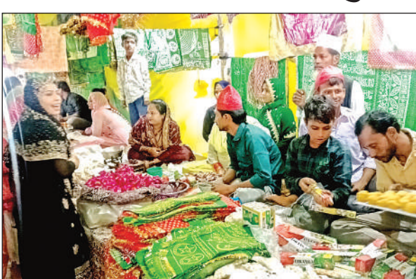
उर्स के दौरान सजी दुकान पर खरीदारी करती महिला।

अमृत विचार। कस्बे के आदर्श स्कूल के सामने स्थित हजरत सैय्यद मुहब्बत शाह बाबा की मजार पर चल रहे तीन दिवसीय उर्स के तीसरे दिन रविवार की रात कव्वाली कार्यक्रम हुआ। कव्वल फैजान अजमेरी और अनीश ने सुफियाना कलाम पेश कर अकीदतमंदों को झूमने पर मजबूर कर दिया। मुहम्मद के नसीबों से वो जन्मत से निराला है..., जैसे कलामों पर पंडाल तालियों की गड़गड़ाहट से गुंज उठा। उर्स को हिन्दू-मुस्लिम एकता का प्रतीक माना जाता है। देर रात तक चली इस महफिल में हजारों जायरीन मौजूद रहे। उर्स स्थल पर झूले, खिलौनों की दुकानें, मिठाई व चाय की दुकानों ने मेले की