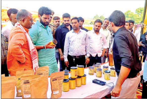
मेला में लगे स्टॉलों का अवलोकन करते लोग।