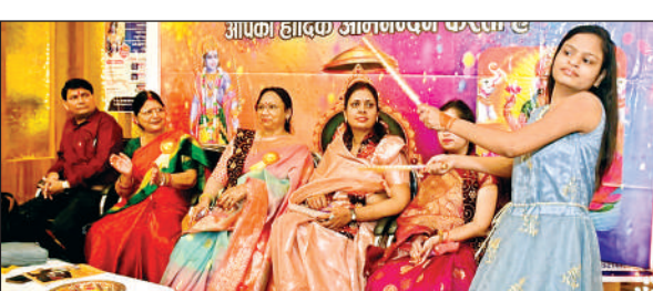
कार्यक्रम के दौरान नृत्य प्रस्तुत करती बच्ची।