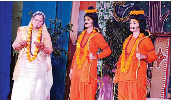
रामलीला में शबरी प्रसंग का मंचन करते कलाकार।