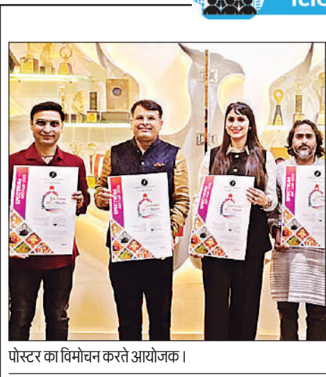
पोस्टर का विमोचन करते आयोजक।

कुलपति ने कहाकि आज से आप जार्जियन कहलाएंगे। इतिहास के सुनहरे पन्ने में आपका नाम दर्ज हो गया है। केजीएमयू की गरिमा बनाए रखें। यहां के तौर-तरीके सीखें। खूब मेहनत से पढ़ाई करें। ताकि अच्छे डॉक्टर बनकर समाज की सेवा कर सकें। प्रथम वर्ष में एंनॉटमी, फिजियोलॉजी व बायोकेमेट्री की क्लास होंगी। डॉ. रश्मि कुशवाहा ने कहा कि नए छात्र सिर्फ पढ़ाई में ध्यान लगाएं।