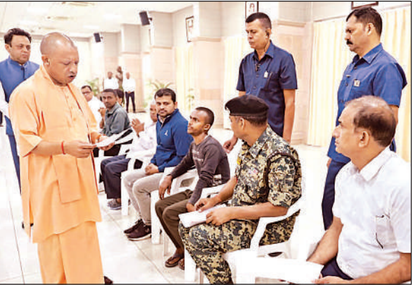
लखनऊ में जनता दर्शन के दौरान लोगों की समस्याएं सुनते मुख्यमंत्री योगी।

मुख्यमंत्री आवास पर सोमवार सुबह "जनता दर्शन" में प्रदेश के 50 से अधिक पीड़ित पहुंचे।