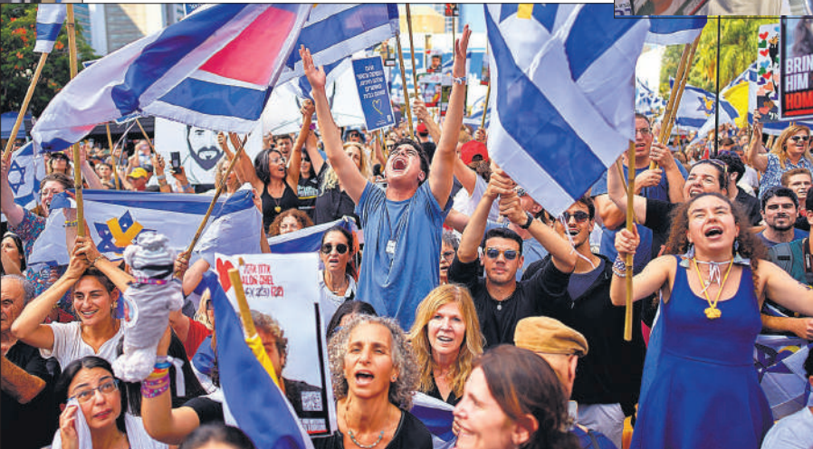
गाजा में बंधक लोग रिहा होकर तेल अवीव पहुंचे तो वहां उनके स्वागत के लिए खुशी से झूमते हजारों लोगों की भीड़ इकट्ठी थी।

युद्धविराम समझौते का जश्न मनाने सोमवार सुबह अमेरिकी राष्ट्रपति डोनाल्ड ट्रंप इजराइल पहुंचे। अपने भाषण से पहले ट्रंप ने नेसेट चेंबर में प्रवेश किया जहां तालियों की लगातार गड़गड़ाहट से उनका स्वागत किया गया। उन्होंने पहले गाजा में हमास द्वारा बंधक बनाए गए कुछ लोगों के परिवारों से मुलाकात की। ट्रंप ने घोषणा की कि इस समझौते ने युद्ध को प्रभावी रूप से समाप्त कर दिया है और पश्चिम एशिया में स्थाई शांति स्थापित करने का मार्ग प्रशस्त किया है।