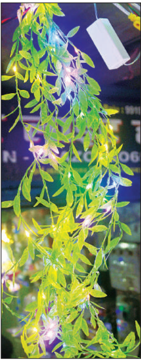
बाजार में जगमगाती हरी पत्ती झालर।