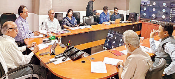
रेरा मुख्यालय पर बैठक के दौरान प्रेजेंटेशन देखते अध्यक्ष संजय भूसरेड्डी।

अमृत विचार : उप रियल एस्टेट विनियामक प्राधिकरण (रेरा) ने 186वीं बैठक में लखनऊ, अयोध्या, गौतमबुद्ध नगर, झांसी, मुरादाबाद और प्रयागराज में एक-एक नई रियल एस्टेट परियोजनाओं को मंजूरी दी है। छह परियोजनाओं में कुल 176.28 करोड़ के निवेश से 501 नई इकाइयां विकसित करके फ्लैट और दुकानें बनाई जाएंगी। इससे रियल एस्टेट क्षेत्र को बढ़ावा मिलेगा। सोमवार को न्यू हैदराबाद स्थित रेरा मुख्यालय पर अध्यक्ष संजय भूसरेड्डी की अध्यक्षता में परियोजनाओं का प्रेजेंटेशन दिया गया। बताया कि रियल एस्टेट विकास केवल महानगरों तक