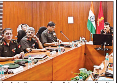
ईएमई कोर दिवस सप्ताह बैठक में सेना के उच्च अधिकारी।