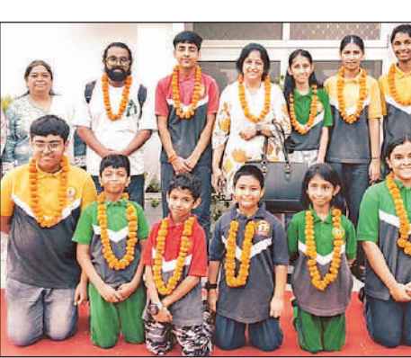
देश-विदेश से आई प्रतिभागी टीम।