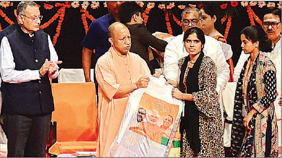
लखनऊ में आयोजित समारोह में महिला मंगल दल को खेल किट वितरित करते मुख्यमंत्री योगी।

मुख्यमंत्री ने कहा कि खेलों के साथ लोक संस्कृति को भी बढ़ावा