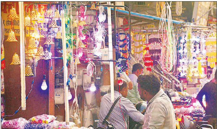
बाजार में झालरों और अन्य सजावटी सामान की खरीदारी करते लोग।

पहले 5 एमएम के तार वाली झालरें बाजार में थीं, लेकिन इस बार तार की मोटाई 12 एमएम कर दी गई है। प्लग भी पहले से मजबूत है। इससे 50 से 300 रुपये तक की इन लाइटें कई वर्ष चलने की संभावना है। 350 रुपये तक की टैपिल लाइट बाजार में है। यह सस्ता आइटम कम लागत में बेहतरीन रोशनी देता है।