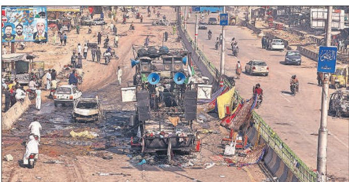
सुरक्षा बलों से झड़पों के दौरान प्रदर्शनकारियों ने सड़कों पर जमकर तोड़फोड़ की।

शर्म अल-शेख । अमेरिका के राष्ट्रपति डोनाल्ड ट्रंप गाजा के भविष्य से संबंधित वैश्विक सम्मेलन में भाग लेने के लिए सोमवार को मिस्र पहुंचे। विश्व के कई देशों के नेता इससे पहले ही यहां पहुंच चुके थे। ट्रंप गाजा युद्ध विराम का जश्न मनाने इजराइल की यात्रा के बाद मिस्र पहुंचे हैं। इजराइली प्रधानमंत्री बेन्जामिन नेतन्याहु को भी आमंत्रित किया गया था, लेकिन उन्होंने ‘ज्यूइश होलीडे’ का हवाला देते हुए शिरकत करने से इन्कार कर दिया। सम्मेलन में तुर्की के राष्ट्रपति रजब तैयब एर्दोआन और कतर के अमीर शेख तमीम बिन हम्माद अल सानी हिस्सा ले रहे हैं। जॉर्डन के शाह अब्दुल्ला भी शामिल हो सकते हैं। इजराइल के प्रमुख अंतरराष्ट्रीय समर्थकों में से एक जर्मनी के चांसलर फ्रेडरिक मर्ज भी सम्मेलन में हिस्सा लेंगे। ब्रिटेन के प्रधानमंत्री केअर स्टार्मर, संयुक्त राष्ट्र के महासचिव एंtonियो गुतेरres, यूरोपीय यूनियन के प्रमुख एंtonियो कोरस्टा और इटली की प्रधानमंत्री जोर्जिया मेलोनो समेत कई देशों के नेता सम्मेलन में शिरकत करेंगे।