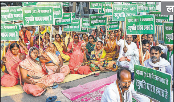
राजद अध्यक्ष लालूप्रसाद के घर के बाहर सोमवार को टिकट के दावेदारों का धरना।

बाद में बिहार भाजपा प्रभारी धर्मेन्द्र प्रधान ने भी इस मुद्दे को सुलझाने के लिए अपनी पार्टी के वरिष्ठ नेताओं के साथ बैठक की। दूसरी तरफ बिहार के मुख्यमंत्री नीतीश कुमार ने भी राजीव रंजन सिंह उर्फ ललन