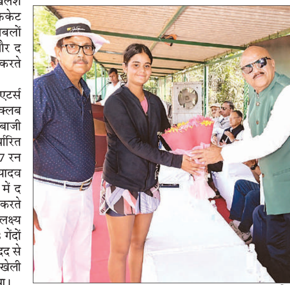
मुख्य अतिथि का स्वागत करते हुए आयोजन मंडल के सदस्य।