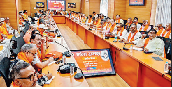
गंगा समग्र की बैठक में शामिल संगठन के सदस्य।