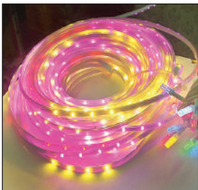
रंग बिरंगी झालर।

बाजार में पिछले वर्ष की अपेक्षा देशी झालरें 50 प्रतिशत तक घटीं, जुगुनू की चमक वाली लाइटें खूब टिमटिमा रहीं