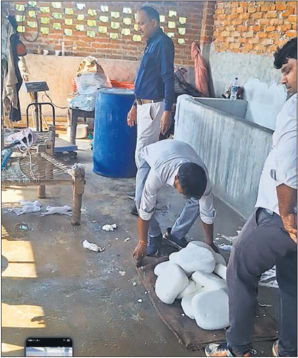
छापेमारी करती खाद्य विभाग की टीम।

कि मिर्च पाउडर में धनिया, चावल की मिलावट की पुष्टि हुई है, जो सेहत के लिए हानिकारक है। खाद्य अधिकारी ने बताया कि आठ विक्रेताओं को नोटिस जारी किए गए हैं। नोटिस का जवाब मिलने के बाद एडीएम कोर्ट में वाद दायर किया जाएगा। एडीएम कोर्ट से संबंधित विक्रेताओं के खिलाफ जुर्माना की कार्रवाई की जाएगी। अरहर दाल का सैंपल असुरक्षित आया है। इस मामले में कोर्ट द्वारा कार्रवाई की जाएगी। उन्होंने बताया कि दीपावली के चलते खाद्य पदार्थों में मिलावट रोकने के लिए जिले भर में व्यापक अभियान चलाया जा रहा है। खाद्य पदार्थों के सैंपल लेकर जांच को भेजे जा रहे हैं। खाद्य विभाग की कार्यवाही से खाद्य पदार्थों की बिक्री करने वालों में हड़कंप मच गया है।