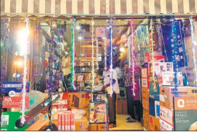
झालरों से सजा बाजार।

18 अक्टूबर को धनतेरस के बाद दिवाली का पर्व मनाया जाएगा। धीरे-धीरे करके अब बाजार गुलजार होना शुरू हो गए हैं। दिवाली के लिए बाजार रंग-बिरंगी लाइटों, झालरों और दीपकों से सज गए हैं। ग्रामीण क्षेत्रों से लोग मुन्नायन सामान खरीदने आ रहे हैं। बाजारों में खूब रौनक देखने को मिल रही है। लोग रंग बिरंगी झालरें और