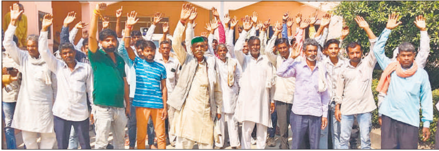
तहसील कार्यालय पर प्रदर्शन करते ग्रामीण।