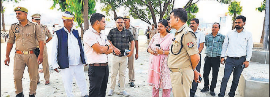
फोटो 20 निरीक्षण करते जिलाधिकारी और पुलिस अधीक्षक।