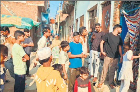
घटना के बाद मौके पर मौजूद लोग।

इस मामले ने पार्टी कार्यकर्ताओं और सामाजिक मंचों में गंभीर चर्चा को जन्म दिया है।