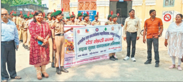
राजकीय रजा स्नातकोत्तर महाविद्यालय में जागरूकता रैली निकालते छात्र-छात्राएं।