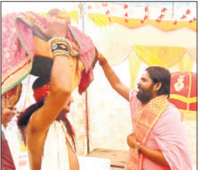
रासलीला के दौरान कृष्ण जन्म की झांकी।

अमृत विचार: कार्तिक महोत्सव के अंतर्गत हो रहे रासलीला के मंचन के दौरान वृंदावन से आए कलाकारों ने बहुत ही सुंदर तरीके से वसुदेव-देवकी विवाह एवं कृष्ण जन्म की लीला की गई। तहसील क्षेत्र के गांव मछरई स्थित त्रिमूर्ति शेषनाग धाम पर कार्तिक महोत्सव का आयोजन किया जा रहा है। इस महोत्सव के अंतर्गत प्रातः कोई हवन एवं दोपहर को रासलीला का आयोजन होता है। कार्तिक महोत्सव श्री कल्कि धाम निर्माण को समर्पित है। मंगलवार को वृंदावन से आई राधे-राधे रास मंडल के कलाकारों द्वारा बहुत ही सुंदर तरीके से देव की एवं वासुदेव विवाह, आकाशवाणी द्वारा कंस के वध की घोषणा एवं कृष्ण जन्म की लीला का मंचन किया गया।