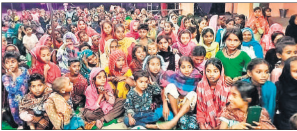
श्रीमद् भागवत कथा में उपस्थित श्रद्धालु।