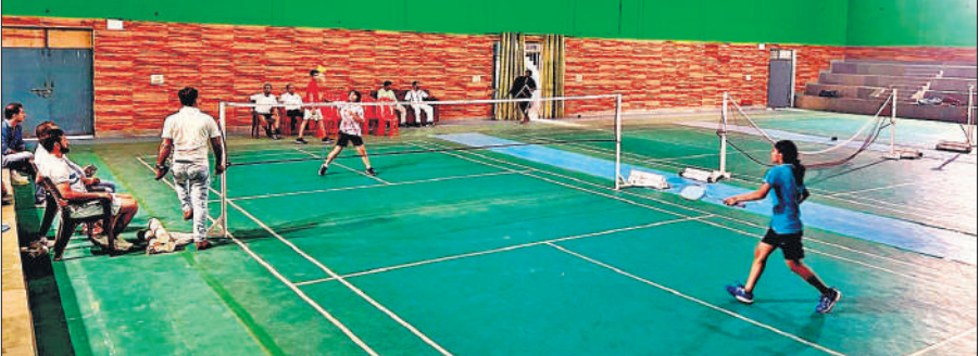
शहीदे आजम स्पोर्ट्स स्टेडियम में हुई बैडमिंटन प्रतियोगिता में भिड़ते खिलाड़ी।