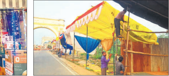
● अमृत विचार

आतिशबाजी की लग रही दुकानें : अब आतिशबाजी की दुकानें सजने लगी हैं। गांधी समाधि के पास लोग दुकानें लगाने के लिए स्थानों पर