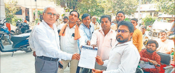
संभल में सिटी मजिस्ट्रेट को ज्ञापन देते दिव्यांग।