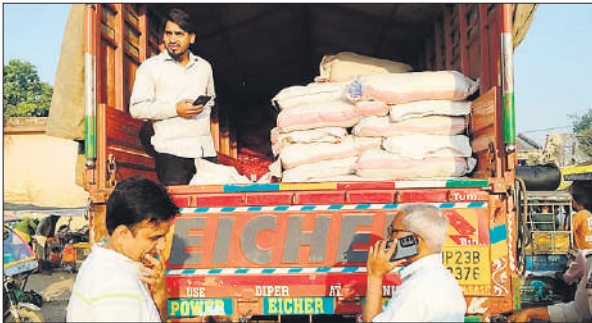
संभल में पॉलीथिन लदे ट्रक पर कार्रवाई करते सिटी मजिस्ट्रेट व ईओ।