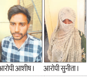
● पुलिस में हत्या का खुलासा कर आरोपी प्रेमी और मृतक की पत्नी को भेजा जेल