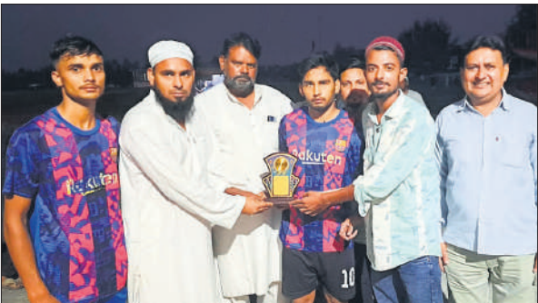
विजयी टीम को पुरस्कार देते मुख्य अतिथि।