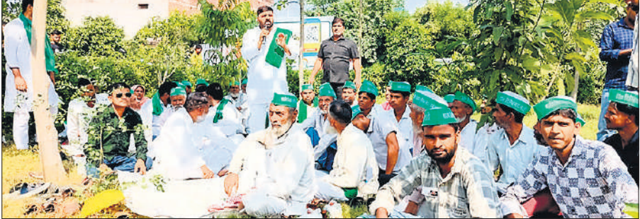
तहसील में प्रदर्शन करते भाकियू बीआर अंबेडकर से जुड़े किसान।