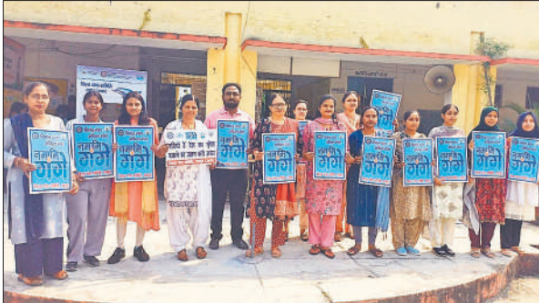
जिला गंगा के समिति के पोस्टर थामे छात्राएं एवं प्रधानाचार्य।